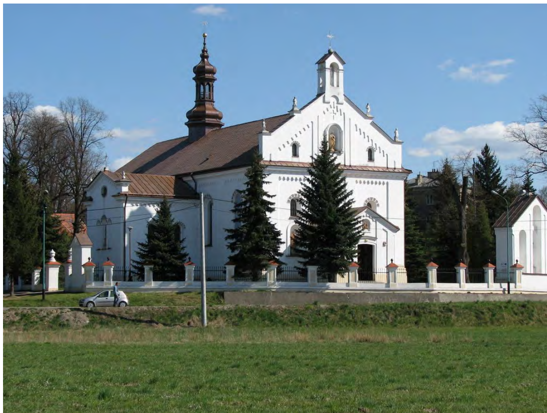
Kościół Parafialny pod wezwaniem Świętej Barbary w Grodzisku Dolnym

Parafia Grodzisko Dolne obejmuje swym zasięgiem miejscowość Grodzisko Dolne oraz Grodzisko Górne, łącznie ponad 4 000 parafian.