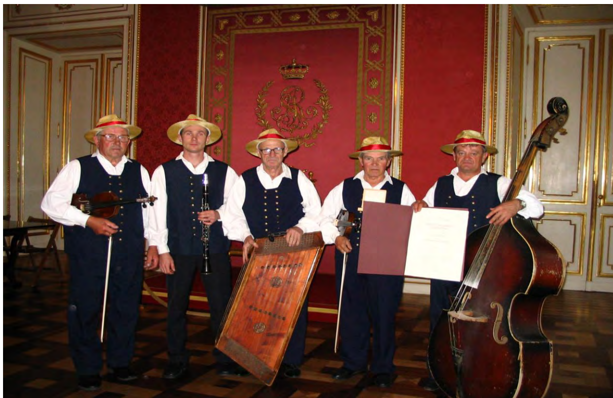
Kapela Ludowa „Grodziszczoki”