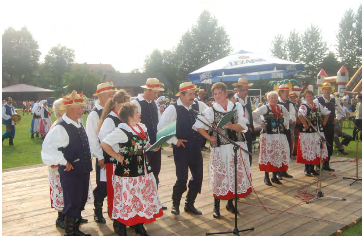
Zespół Ludowy „Grodziszczoki”

Zespół w tym roku obchodzić będzie 35-lecie swego istnienia.