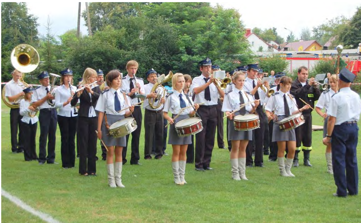
Orkiestra Dęta w Grodzisku Dolnym

Oprócz zespołów ludowych pod patronatem Ośrodka Kultury działają dziecięce i młodzieżowe zespoły taneczne, Teatrzyk „Ufoludek” oraz różnego rodzaju kółka zainteresowań.