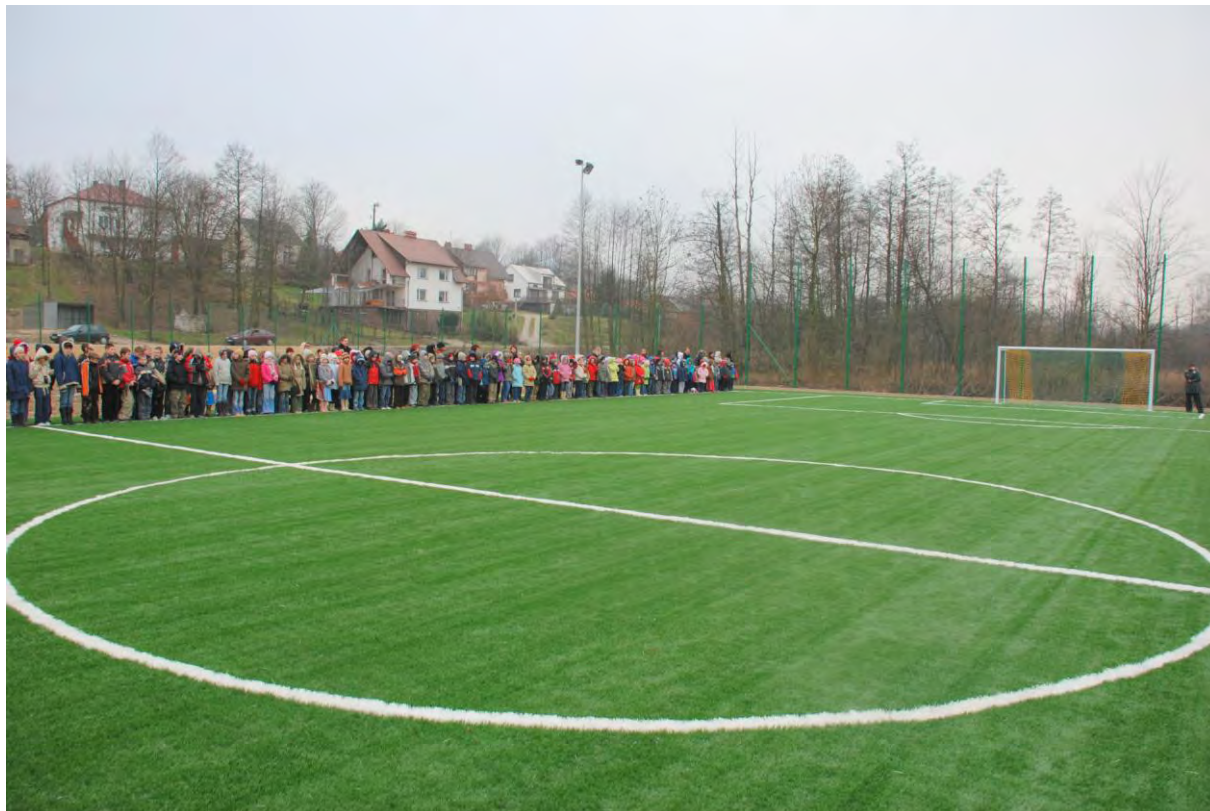
Kompleks sportowy „Orlik” przy zespole szkół w Grodzisku Dolnym

W centrum wsi Grodzisko Dolne przy drodze powiatowej znajduje się Zespół Szkół im. Jana Pawła II. Mieści się tu Przedszkole Samorządowe, Szkoła Podstawowa i Gimnazjum, do której łącznie uczęszcza 410 osób, w tym 361 uczniów (dane z roku szk. 2008/09).