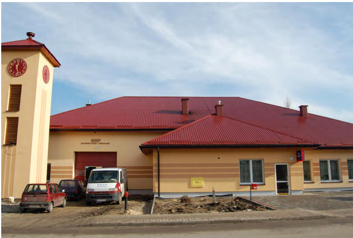
Remiza OSP „Miasteczko”