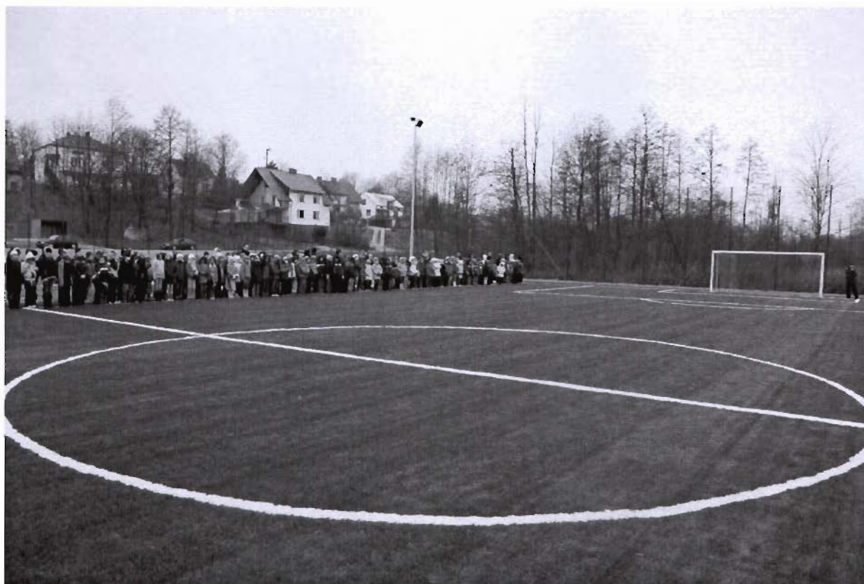
Kompleks sportowy „Orlik” przy zespole szkół w Grodzisku Dolnym

W centrum wsi Grodzisko Dolne przy drodze powiatowej znajduje się Zespół Szkół im. Jana Pawła II. Mieści się tu Przedszkole Samorządowe, Szkoła Podstawowa i Gimnazjum, do której łącznie uczęszcza 410 osób, w tym 361 uczniów (dane z roku szk. 2008/09).