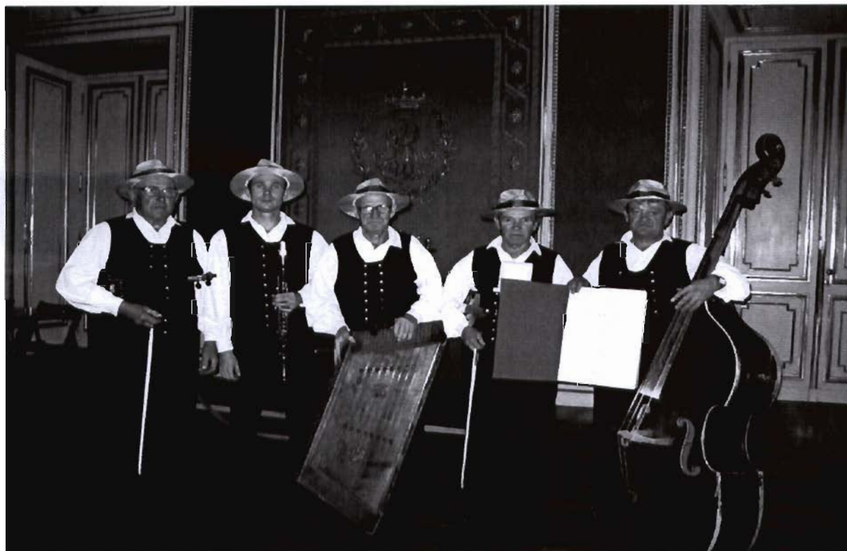
Kapela Ludowa „Grodziszczoki”