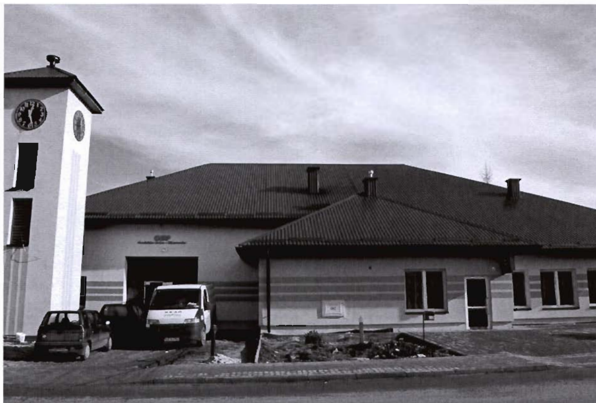
Remiza OSP „Miasteczko”