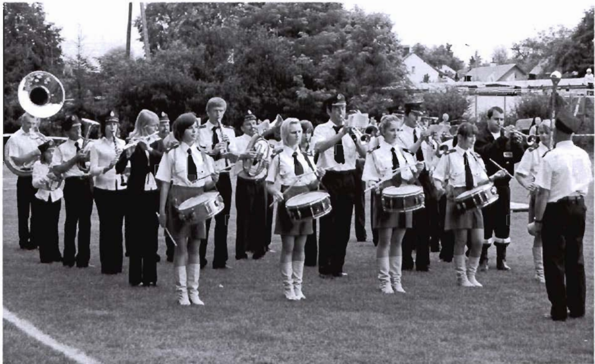
Orkiestra Dęta w Grodzisku Dolnym

Pozyskane instrumenty i stroje będą własnością Ośrodka Kultury.