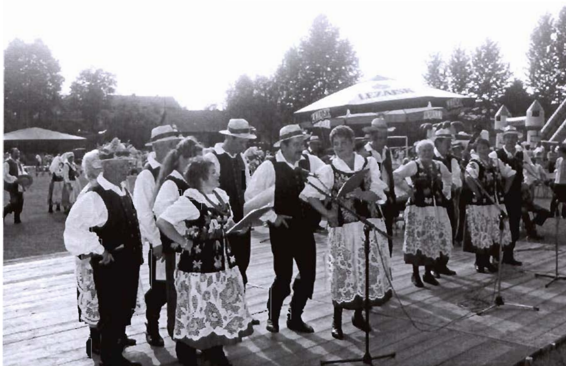
Zespół Ludowy „Grodziszczoki”

Zespół w tym roku obchodzić będzie 35-lecie swego istnienia.