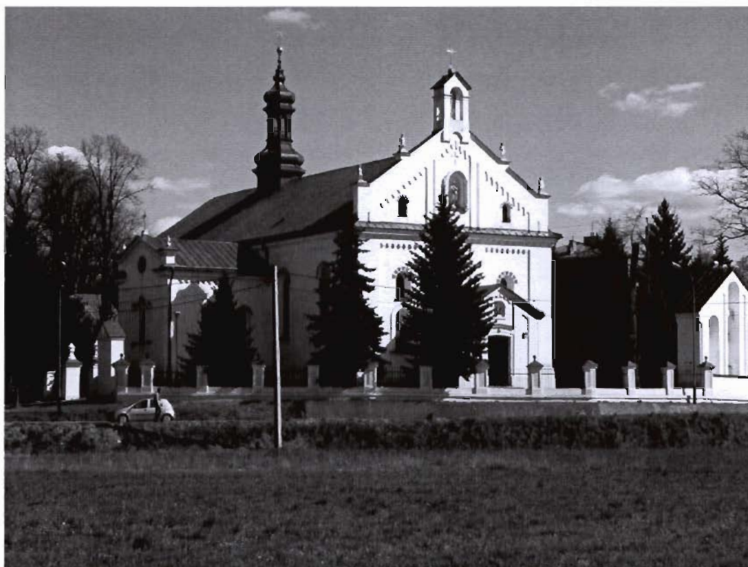
Kościół Parafialny pod wezwaniem Świętej Barbary w Grodzisku Dolnym