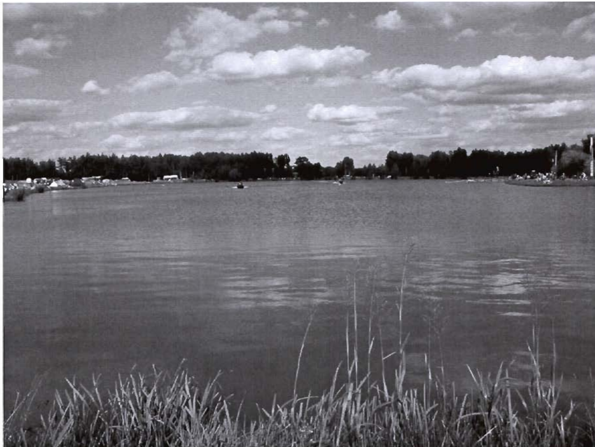
Zbiornik wodny „Czyste”

Od 2007 roku obok zalewu odbywają się coroczne Międzynarodowe Zawody Spadochronowe w Celności Lądowania, co jest kolejną atrakcją przyciągającą mieszkańców do spędzania wypoczynku nad zbiornikiem.