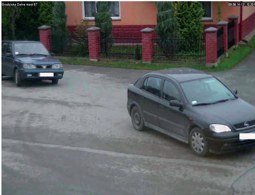
Widok z kamery

Sprzedam 76a działki budowlanej w Tryńczy, przy drodze powiatowej. Warunki zabudowy na dom jednorodzinny. Media i dojazd z drogi asfaltowej. Cena za 1a/700 zł. Tel. 507756277.