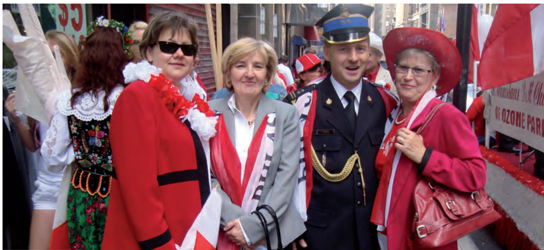
Tego dnia Polacy zauważalni byli na każdym kroku