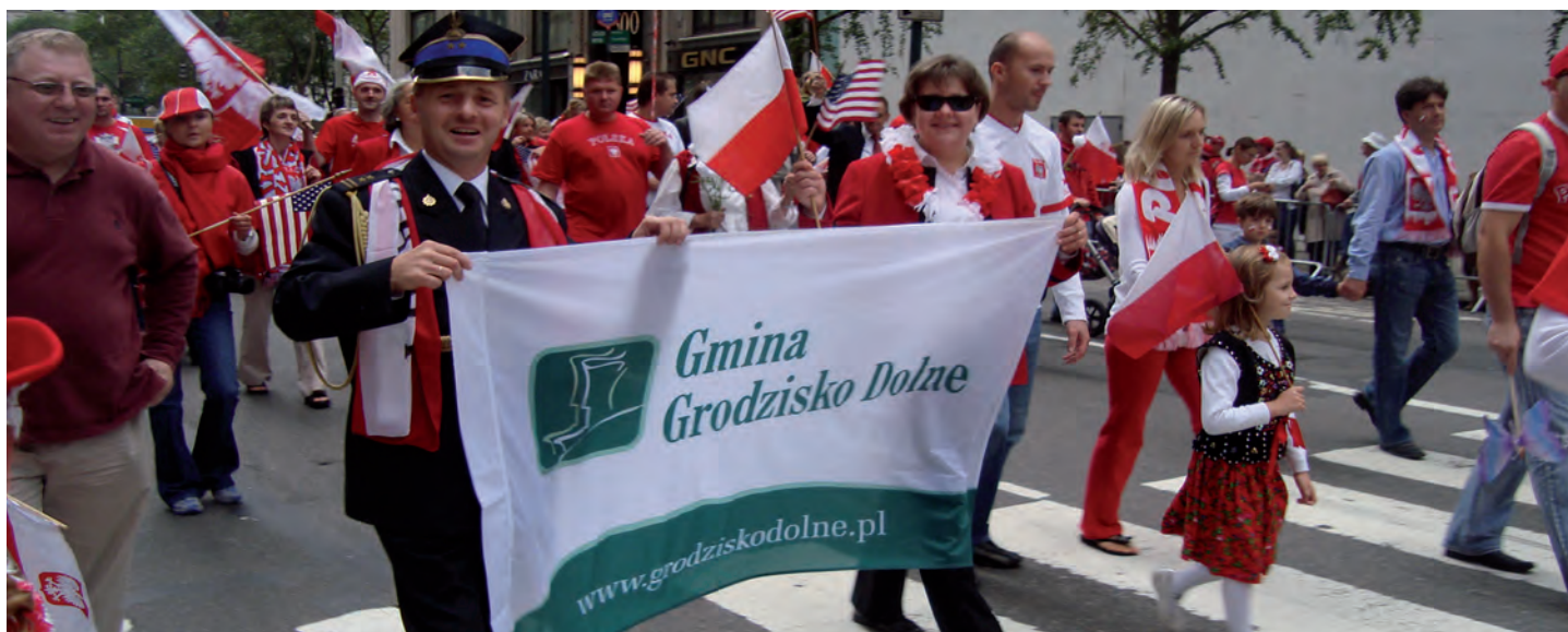
Paradny przemarsz Piątą Aleją w Nowym Jorku