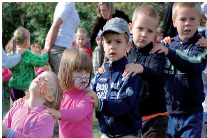
Zabawa przy muzyce