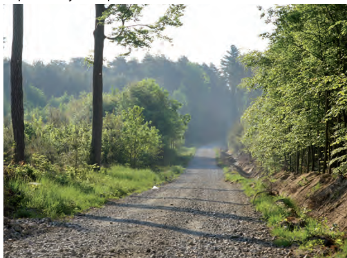
Jeden z odcinków szlaku nordic walking