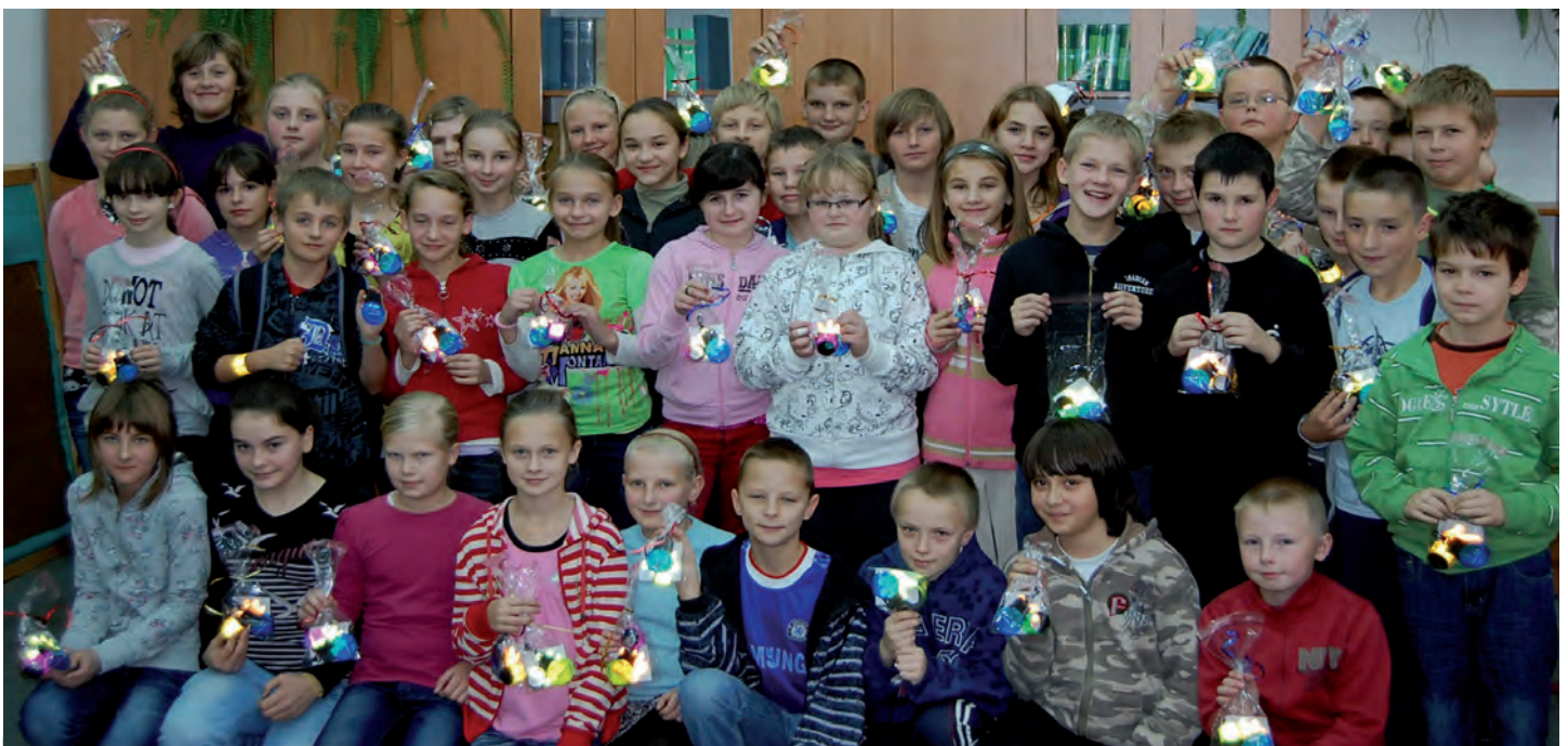
Każdy zestaw zawiera trzy elementy odblaskowe