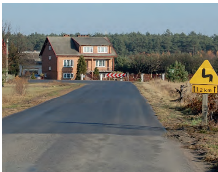
Nowa nawierzchnia na zakręcie na „Wesołej”

Z kolejnego rozdania w ramach programu „ Radosna szkoła ” skorzystał Zespół Szkół w Grodzisku Górnym. Oprócz Orlika, w najbliższym czasie obok szkoły powstanie nowy plac zabaw. Na wyposażeniu placu znajdą się huśtawki, zestaw zabawowy, sprężynowiec, talerz na sprężynach, sklepik z tablicą i lokomotywa z wagonem. Końcem października z wykonawcą - Przedsiębiorstwem APIS z Jarosławia - podpisana została umowa. Wartość zadania to ok. 80 tys. zł.