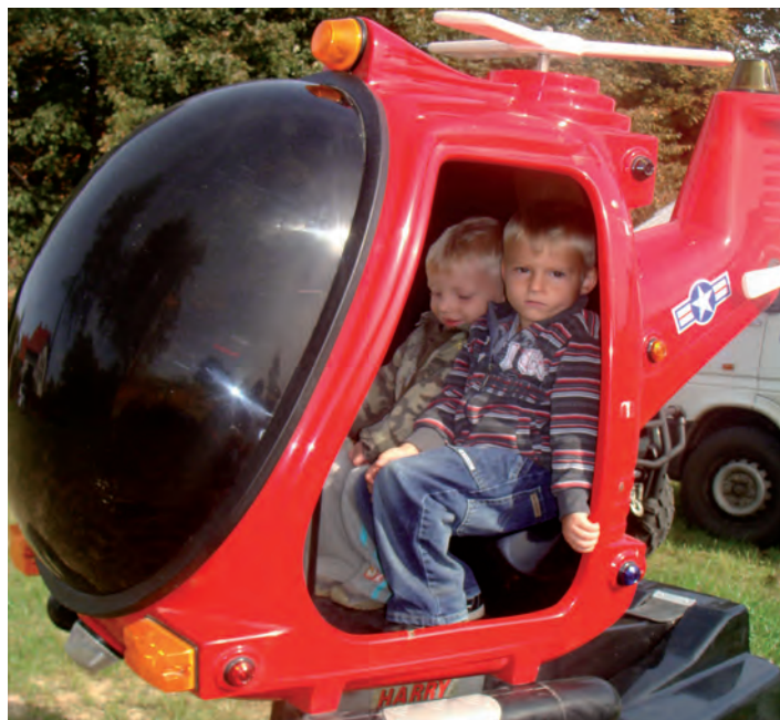
Marzeniem wielu był lot helikoptrem