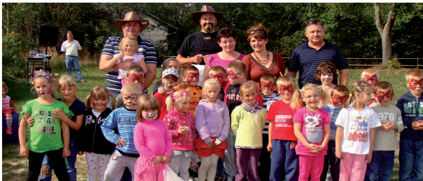
Na twarzach dzieci malowały się uśmiechy