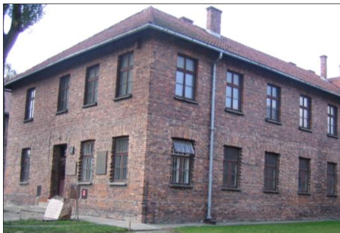
Obóz zagłady w Oświęcimiu

W drodze powrotnej z daleka podziwialiśmy Kalwarię Zebrzydowską. Ostatnim punktem wycieczki były Łagiewniki, gdzie modliliśmy się i zwiedzaliśmy Sanktuarium Bożego Miłosierdzia. Mam nadzieję, że ta wycieczka przybliżyła uczniom sylwetkę naszego Patrona i była atrakcyjnym walorem edukacyjnym. Należy pamiętać, iż poznawanie Ojczyzny to nie tylko „bycie” w ważnych miejscach, ale także emocje i przeżycia im towarzyszące. To atmosfera i nastrój. Zostają one w pamięci i w sercach uczniów. Dlatego ważne jest, by mogli oni częściej korzystać z takiej formy edukacji.