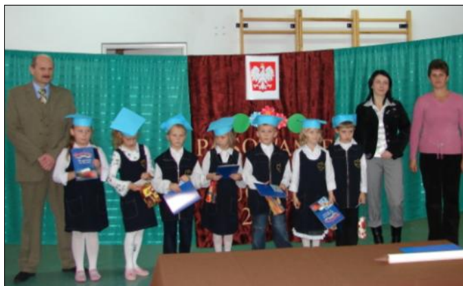
Nikt nie ugiął się pod ciężarem wielkiego ołówka