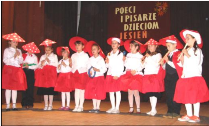
Grupa Muchomorki z Brzozy Królewskiej

W dniach 12 i 14 listopada br. w Ośrodku Kultury w Grodzisku Dolnym odbyły się eliminacje gminne oraz powiatowe konkursu „Poeci i pisarze dzieciom. Cztery pory roku – Jesień”. W konkursie gminnym wzięli udział uczniowie szkół podstawowych z terenu naszej gminy, którzy występowali