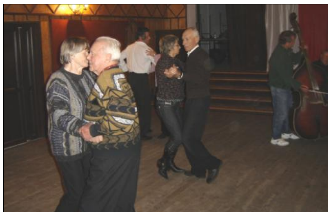
Zespół i Kapela w trakcie próby przed kolejnym występem

Mieszkańcy Gminy Grodzisko Dolne czują coraz większą potrzebę integracji i działania na rzecz dobra wspólnego, o czym może świadczyć chociażby zwiększająca się liczba zakładanych stowarzyszeń. W tym roku powstało ich cztery. Najnowszym i najmłodszym, jest powstałe w listopadzie folklorystyczno-artystyczne Stowarzyszenie „Grodziskie Jonki” . Jego skład stanowią członkowie Zespołu i Kapeli Grodziszczoki, Zespołu Leszczyńska i Orkiestry Dętej. Stowarzyszenie będzie sprawowało opiekę nad wszelkimi formami działalności grup i zespołów artystycznych, będzie dbało o rozwijanie uzdolnień tanecznych i muzycznych.