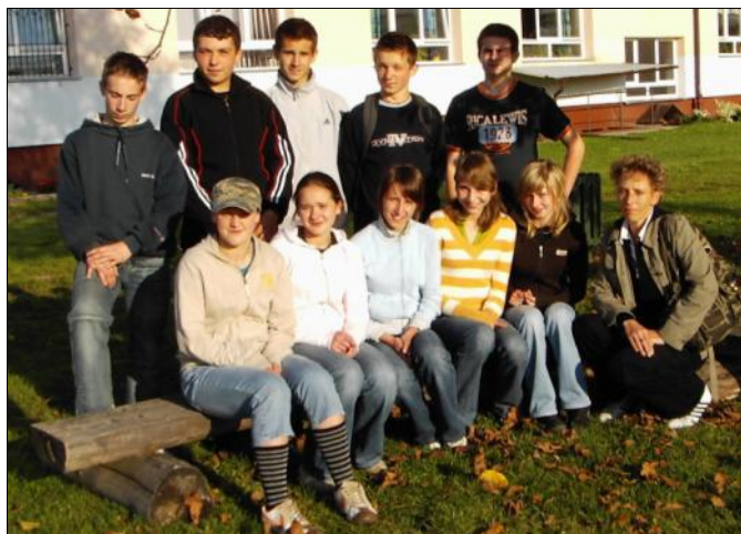
Zwycięska drużyna w konkurencji biegowej

W końcu nadszedł czas na czwarty etap biegu, czyli zaprezentowanie piosenki na wybraną melodię, co wyszło nam dobrze, gdyż pod tym względem zajęliśmy miejsce drugie.