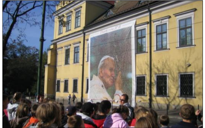
Wadowice – przed oknem papieskim

Browar w Leżajsku), 52 naszych uczniów, tuż po Święcie Patrona, 17 października mogło się udać na trzydniową wycieczkę do Krakowa, Ojcowskiego Parku Narodowego, Częstochowy, Oświęcimia i Wadowic.