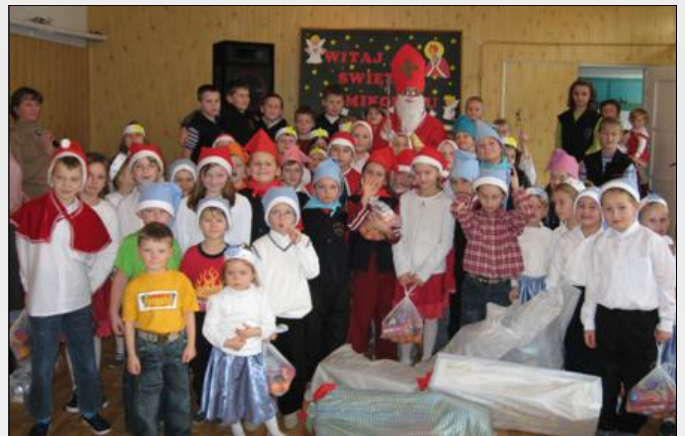
Wszystkie dzieci otrzymały wspaniałe prezenty

5 grudnia 2007 roku Szkołę Podstawową w Wólce Grodzkiej odwiedził wspaniały gość – Mikołaj Święty. Nasi uczniowie oraz najmłodsze dzieci z Wólki Grodzkiej zgromadzone w sali gimnastycznej nie mogły się doczekać przyścia tak ważnego gościa. Gdy ten pojawił się w drzwiach, tam czekały już na niego aniołki – uczniowie klasy III, by powitać gościa i w sposób uroczysty wprowadzić na salę. Wszyscy uradowani jego przybyciem z wielkim entuzjazmem i radością zaśpiewali „Bądź pozdrowiony gościu nasz”, po czym uczniowie klas młodszych zaprezentowali się w programie artystycznym przygotowanym specjalnie na cześć Świętego Mikołaja. „Mikołajki” z klasy II słowami wierszy przybliżyły wszystkim postać biskupa Mikołaja, a „krasnale i śnieżynki” z klasy „0” i I zaśpiewały mikołajkowe, wesole piosenki.