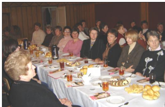
W spotkaniu uczestniczyła liczna grupa kobiet

Głównym celem spotkania było zwiększenie świadomości kobiet na temat profilaktyki raka szyjki macicy, dostępności bezpłatnych badań cytologicznych w ramach narodowego programu profilaktyki RSM oraz uzyskanie informacji o możliwości szczepień profilaktycznych.