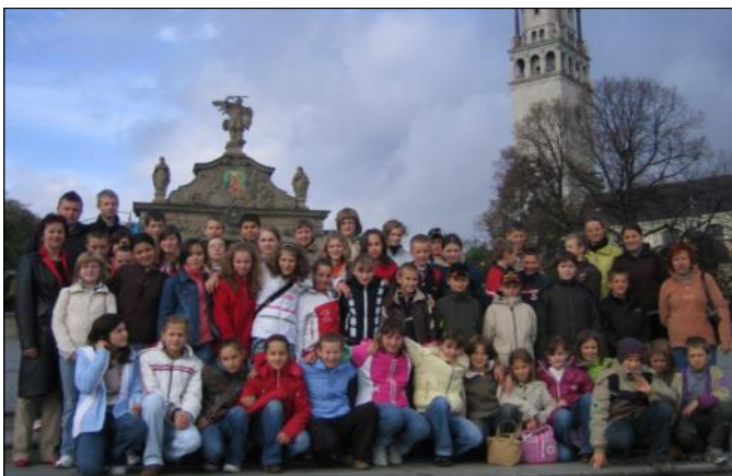
Częstochowa - przed Jasną Górą

Szkoła powinna przekazywać swoim wychowankom obowiązek troski o dziedzictwo własnej przeszłości i umacniać w nich poczucie tożsamości. Z tego nic nie może jej zwolnić. Elementem tej powinności są podróże historyczno-kulturowe po naszej Ojczyźnie i szukanie oraz rozpoznawanie wraz z uczniami piękna i dobra. Także – uświadamianie odpowiedzialności, szlachetności i poświęcenia przedstawicieli poprzednich pokoleń. Podróże mają budzić nastroje, sentymenty, uczucia dumy z narodowych wartości, pomagać utożsamiać się z tymi, którzy niejednokrotnie – mówiąc językiem Jana Pawła II – tę miłość do Polski nadpłacili samym sobą. Znajomość Ojczyzny, jej historii i kultury to nie tylko książkowa wiedza o niej, ale i szeroko pojęte krajoznawstwo, a przede wszystkim – znajomość miejsc, które stanowią polskie sacrum. Mając powyższe obowiązki i cele na uwadze, Zespół Szkół im. Jana Pawła II w Grodzisku Dolnym co roku realizuje kilka wycieczek w różne atrakcyjne miejsca. W pierwszym rzędzie dzieci poznają dziedzictwo przyrodniczo – historyczno – kulturowe „małej Ojczyzny” oraz najbliższego regionu. Natomiast później miejsca odległe od szkoły. Wiosną 2007 roku Ministerstwo Edukacji Narodowej przedstawiło „Program wycieczek edukacyjnych dla dzieci i młodzieży.