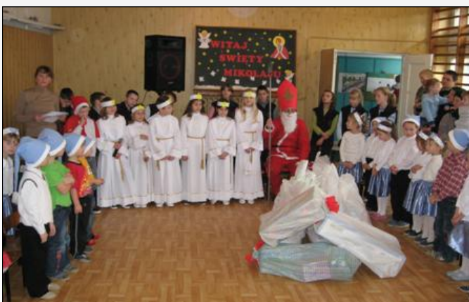
Święty Mikołaj przyniósł wór pełen niespodzianek

Potem nastąpił moment, na który wszyscy niecierpliwie czekali. Święty Mikołaj zaczął rozpakowywać wielkie worki prezentów. Buzie dzieci były bardzo uśmiechnięte, a oczy błyszczały radośnie, gdy tak po kolei podchodziły po swój podarek do Mikołaja. Aż szkoda, że taki dzień jest tylko raz w roku. Wizyta Świętego Mikołaja była dla nas wszystkich bardzo podniosłym wydarzeniem. Święty Mikołaju bardzo dziękujemy za przybycie i obiecujemy, że będziemy pamiętać o głównym przesłaniu tej uroczystości, iż każdy z nas może być Świętym Mikołajem dzieląc się dobrem i miłością z innymi.