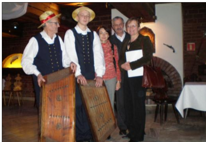
Mistrz i jego uczeń

Tradycją tych spotkań jest ich stałe miejsce i czas, zaś celem założonym przez organizatora zaprezentowanie aktualnego stanu żywej jeszcze tradycji gry na cymbałach oraz jej dokumentacja. A teraz kilka słów historii o samym instrumencie. Cymbały przywędrowały na Rzeszowszczyznę z kręgu karpackiego i zadomowiły się w kapelach naszego regionu. Wzbogaciły harmoniczną-rytmiczną funkcję sekundzisty i basisty oraz wzbogaciły charakterystyczną ornamentację linii melodycznej instrumentu prowadzącego. Dzięki mistrzowskiemu opanowaniu techniki gry, wielu cymbalistów zasłynęło z solowych popisów, nadając melodiom oryginalne brzmienie.