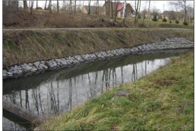
Utwardzony fragment potoku w Wólce Grodzkiej

Interwencje Wójta spowodowały, że udało się pozyskać znaczne środki finansowe w wysokości ponad 100 tys. zł, za które możliwe było wykonanie prac konserwacyjnych potoku na całym uregulowanym odcinku o długości ponad 14 km. Wyczyszczony potok nabrał wyglądu i nadal pełnić będzie swoją właściwą rolę.