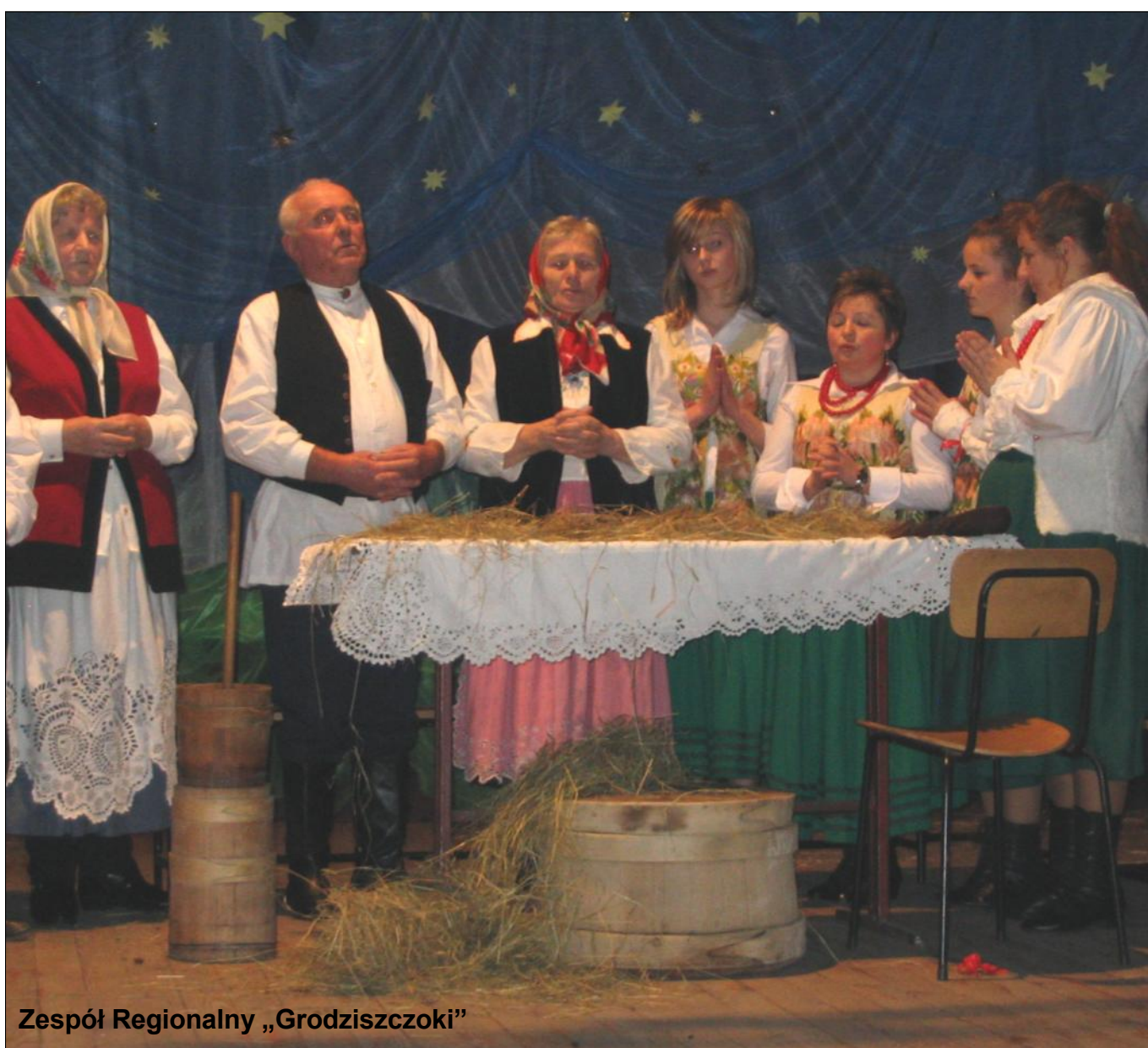
Zespół Regionalny „Grodziszczoki”