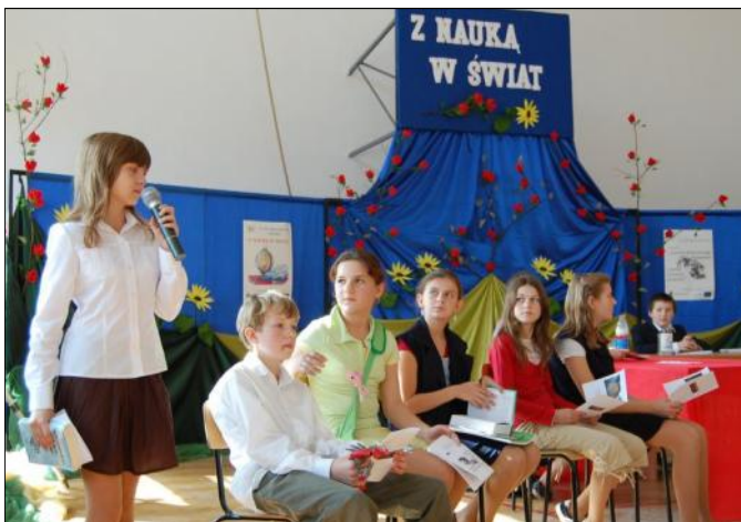
Inscenizacja prezentująca zrealizowane zadania

Następnie wszyscy udali się do budynku szkoły, gdzie odbyły się główne uroczystości. Uczniowie zaprezentowali podjęte w ostatnim czasie działania. Efekty ich pracy mogliśmy zobaczyć na przygotowanych prezentacjach multimedialnych.