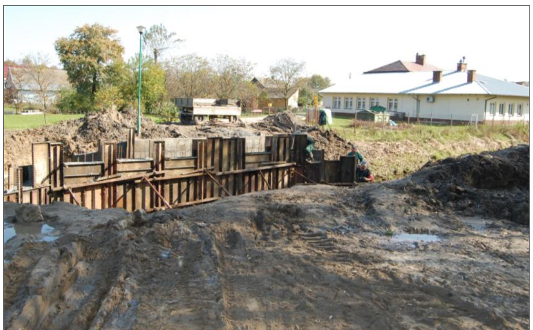
Most koło Remizy OSP w Grodzisku Dolnym