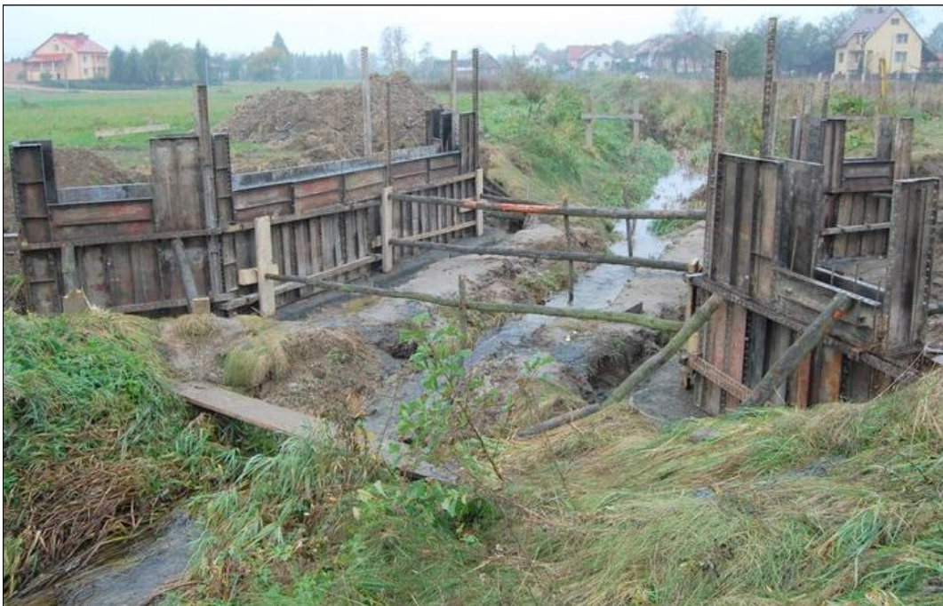
Most „na Misia” w Grodzisku Górnym