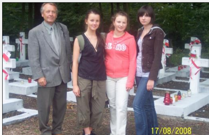
Cmentarz w Zadwórze