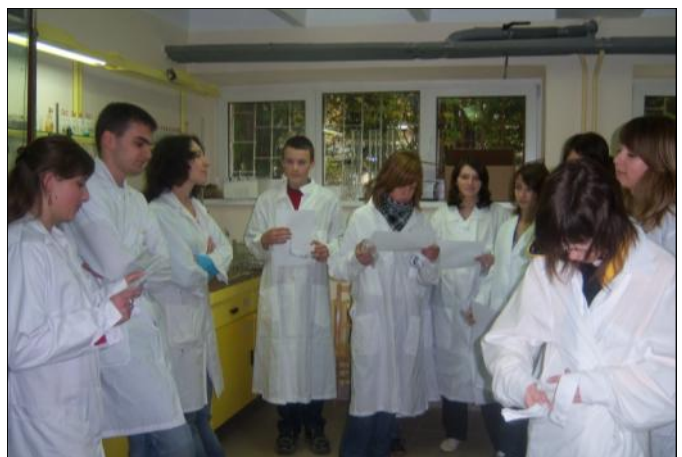
Wizyta w laboratorium

Pierwsze kroki w ramach realizowanych projektów podjęli także uczniowie szkół podstawowych. Powstało m.in. Szkole Centrum Terapeutyczne, gdzie dzieci uczestniczą w zajęciach korekcyjno-kompensacyjnych z logopedii, czy dysleksji oraz zespoły wyrównawcze z czytania i pisania, czy nauk przyrodniczych. W ramach powstałego Centrum Robotyki dla najmłodszych konstruktorów zakupiono pierwsze modele robotów oraz przyrządy. 10-ciu najlepszych konstruktorów ze szkoły podstawowej i gimnazjum wyjedzie na pięciodniowe szkolenie do centrum robotyki RoboComp w Gdańsku.