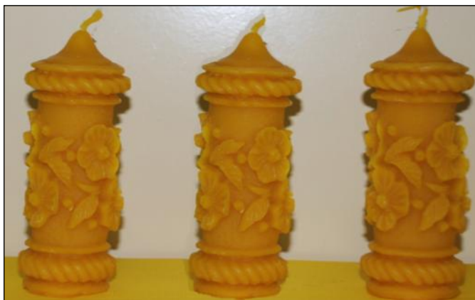
Świece woskowe autorstwa P.P Wojtynów z zespołu w Zmysłówce

charozy, a główne składniki to glukoza i fruktoza, która jest wchłaniana szybko z układu trawienia do organizmu. Możemy więc z powodzeniem 1 łyżeczką miodu zastąpić 2 łyżeczki cukru.