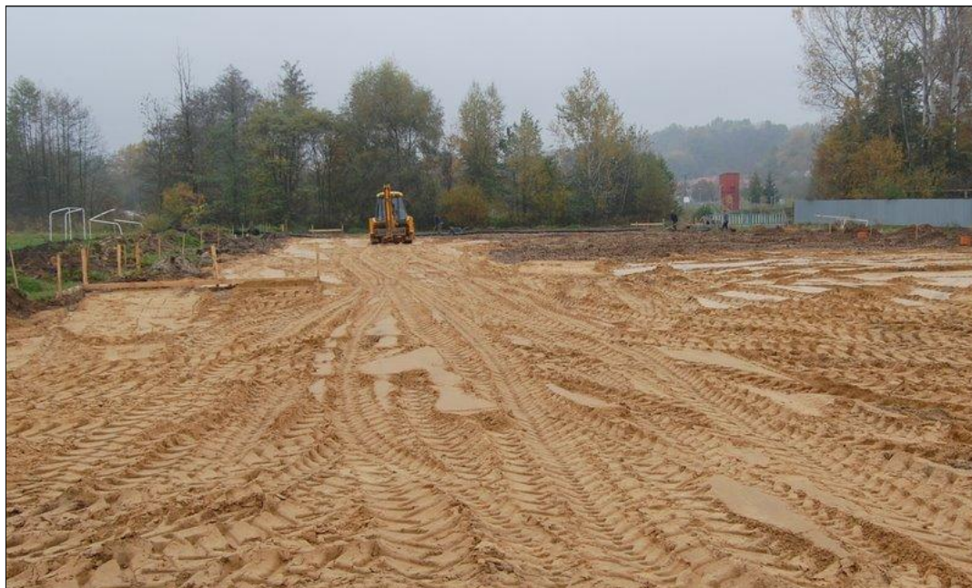
Budowa kompleksu sportowego w Grodzisku Dolnym