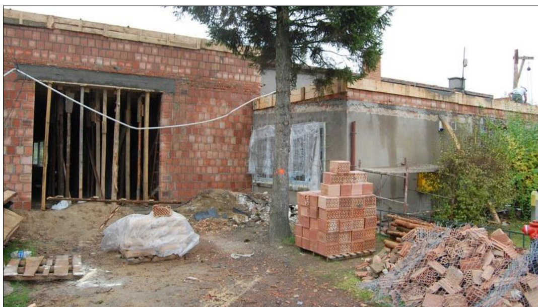
Modernizowana Remiza OSP w „Miasteczku”