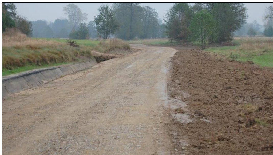
Utwardzona droga dojazdowa do pól tzw. „Pastewnik” w Grodzisku Dolnym