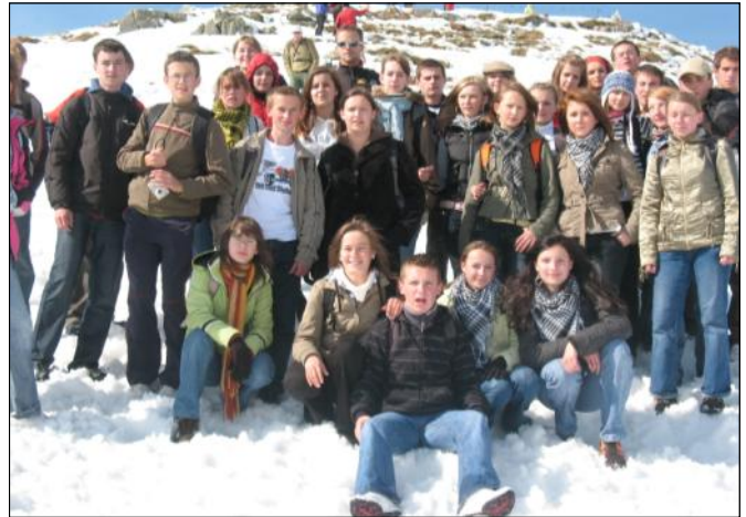
Wycieczka do Zakopanego

się jeszcze na wyjazdy edukacyjne do Bolestraszczyk, Przemyśla i Krasicyzna. Uczniowie odwiedzą także kina, teatry oraz szkołę języków obcych „Promar” w Rzeszowie.