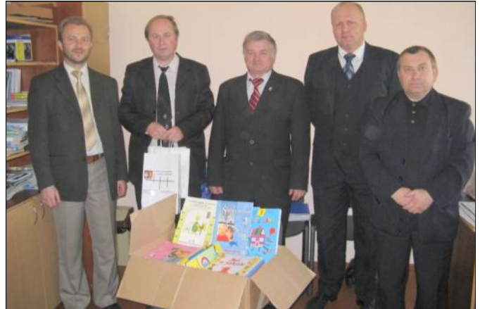
Przekazane książki i podręczniki pochodziły z Zespołów Szkół w Grodzisku Górnym i Dolnym

ty przedstawiciele polskich władz samorządowych odwiedzili Starostwo Powiatowe w Dolinie, zwiedzili Grekokatolickie Sanktuarium Ojców Bazylianów w Monastyrze oraz zakład zajmujący się wydobyciem ropy naftowej w Dolinie. Na rzecz dzieci ze Szkoły Podstawowej przekazali książki i podręczniki do nauki języka polskiego.