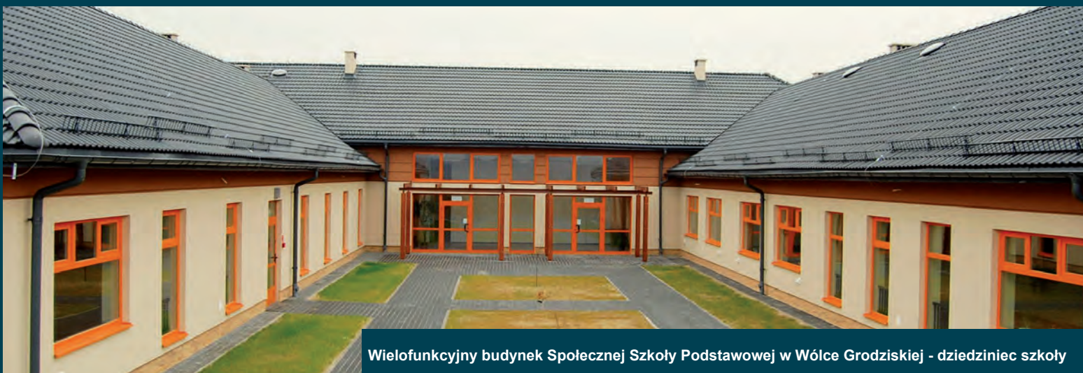
Wielofunkcyjny budynek Społecznej Szkoły Podstawowej w Wólce Grodzkiej - dziedziniec szkoły