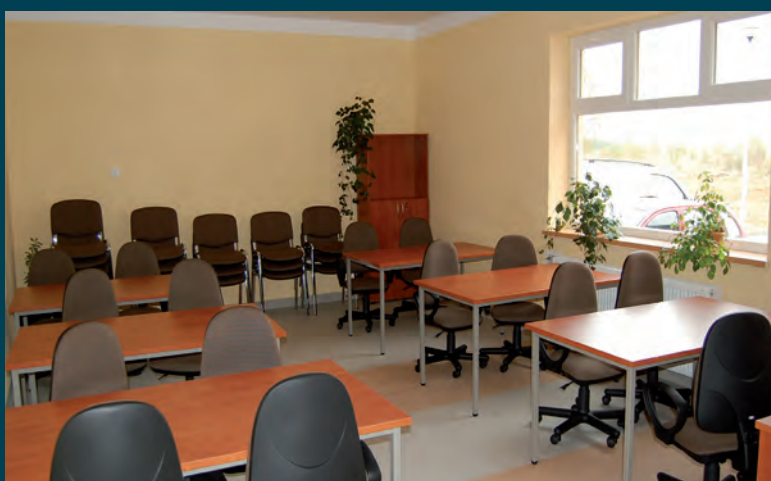
Jedna z sal lekcyjnych