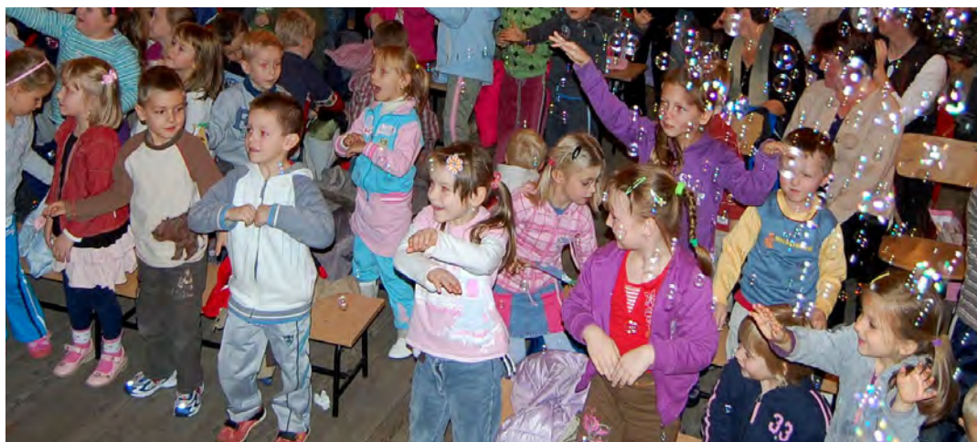
W sali Ośrodka Kultury trwała wielka zabawa

w zwierzęcej dyskotekie w dżungli. Później dotarły do Azji, gdzie spotkały się ze skośnookimi Japończykami i Chińczykami i odtanńczyli ich tańce. Następnie przeniosły się do Ameryki Północnej i uczestniczyły w kowbojskich wyczynach, a stamtąd do Ameryki Południowej, gdzie