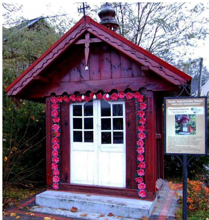
Na szlaku zamontowano 35 takich tablic

Na terenie gminy modernizowane są także kolejne odcinki dróg powiatowych. Trwają prace związane z odbudową niemal kilometrowego odcinka na drodze Kopanie Żołyńskie – Grodzisko Dolne (droga na p. Maja). W ramach prowadzonych prac usunięto starą nawierzchnię i położono 3 warstwy nowej. W najbliższym czasie usypane zostaną pobocza. Podobny zakres prac wykonywany jest na odcinku drogi powiatowej Zmysłówka – Grodzisko Dolne (w kierunku Podlesia). Obydwa odcinki dróg finansują po połowie powiat i gmina. Gotowy jest także szlak tu-