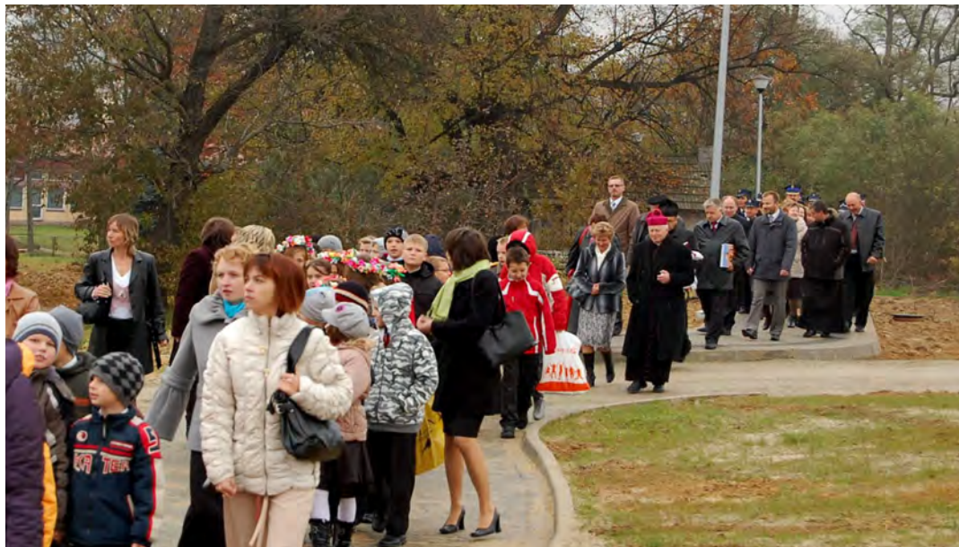
Przemarsz na nowy plac szkolny

Czekaliśmy na tę chwilę długo i udało się. Dziś stajemy przed budynkiem, który jest spełnieniem marzeń wielu społeczników z Wólki Grodziskiej. Jest to obiekt stworzony na miarę potrzeb tej miejscowości. Pod jednym dachem będą się mieścić sześcioklasowa Społeczna Szkoła Podstawowa, Remiza OSP oraz pomieszczenia dla Zespołu Leszczyńka. Życzyłbym wszystkim korzystającym z tego obiektu, aby potrafili się cieszyć z tego co wspólnie osiągnęli. Trudno tu wymienić z imienia i nazwiska tych, którzy swoimi staraniami i uporem przyczynili się do jego powstania, dlatego dziękuję wszystkim którzy w jakikolwiek sposób popierali budowę tego obiektu – powiedział