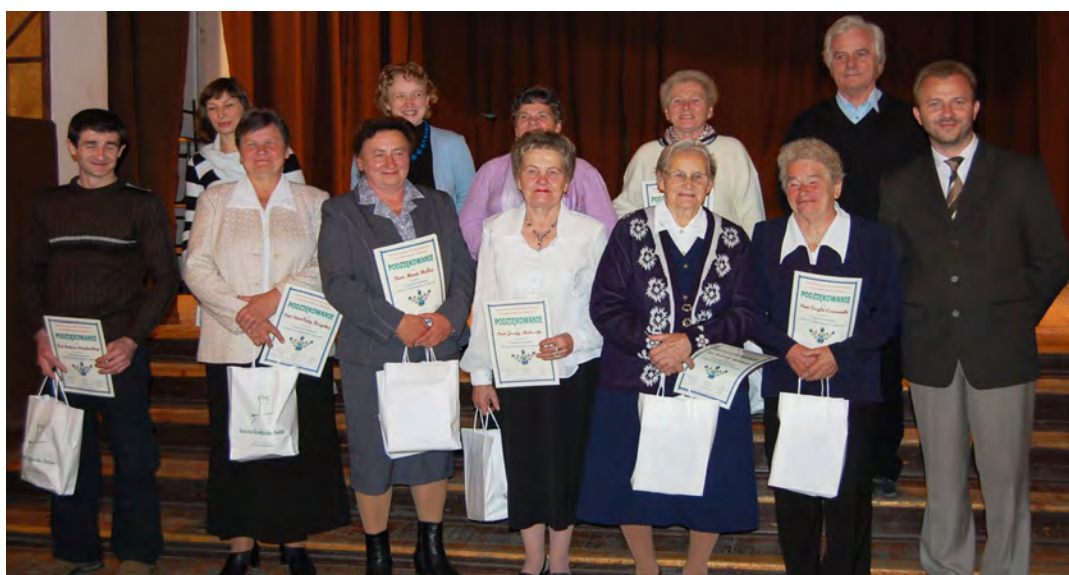
Autorzy prac otrzymali pamiątkowe dyplomy i drobne upominki