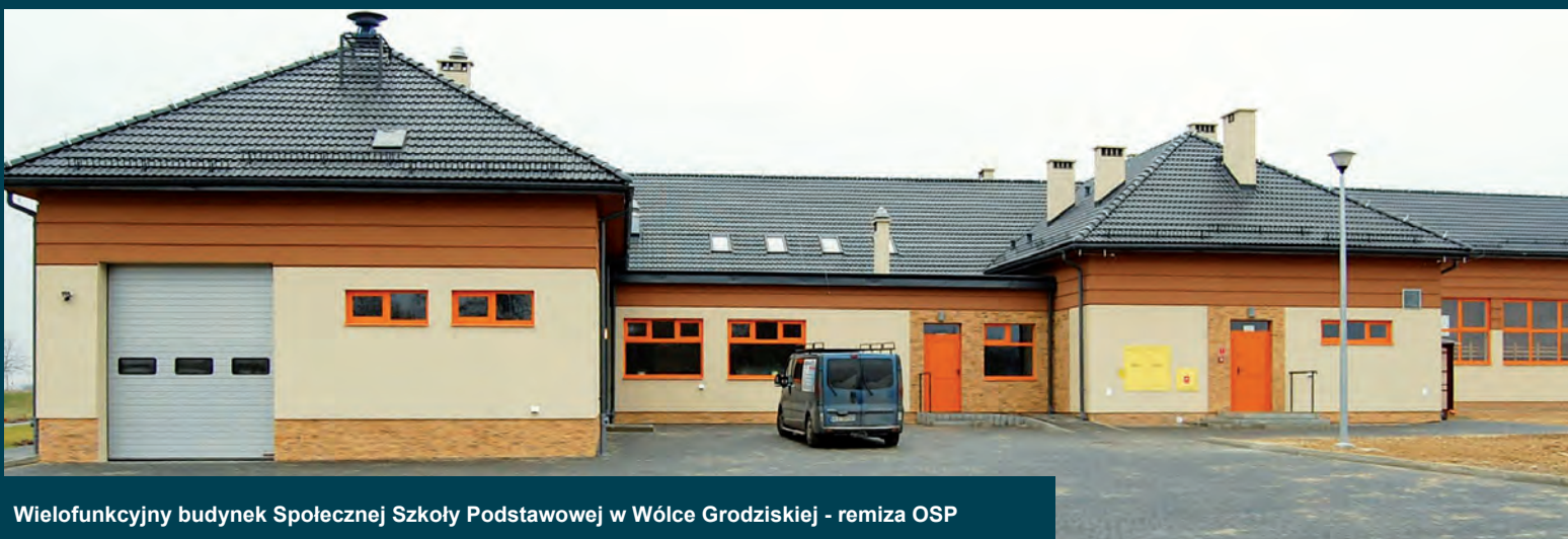
Wielofunkcyjny budynek Społecznej Szkoły Podstawowej w Wólce Grodzkiej - remiza OSP