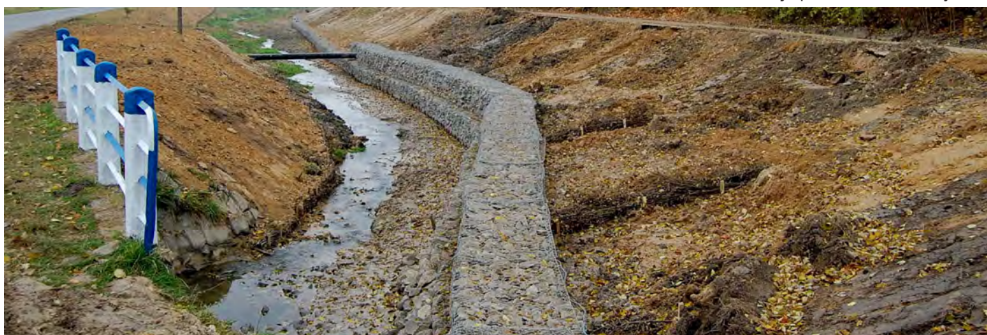
Modernizowany obiekt w Wólce Grodzkiej