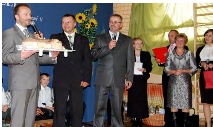
Wójt od członków stowarzyszenia otrzymał tort w kształcie nowej szkoły