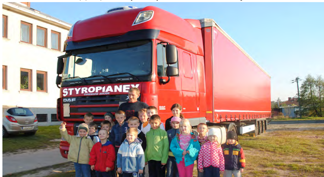
Samochód ciężarowy zrobił wielkie wrażenie szczególnie na chłopcach

Specjalne podziękowania za udostępnienie samochodu na spotkanie składamy właścicielowi firmy STYROPIANEX z Leżajska, produkującej styropian i posiadającej nowoczesną bazę transportową. RC