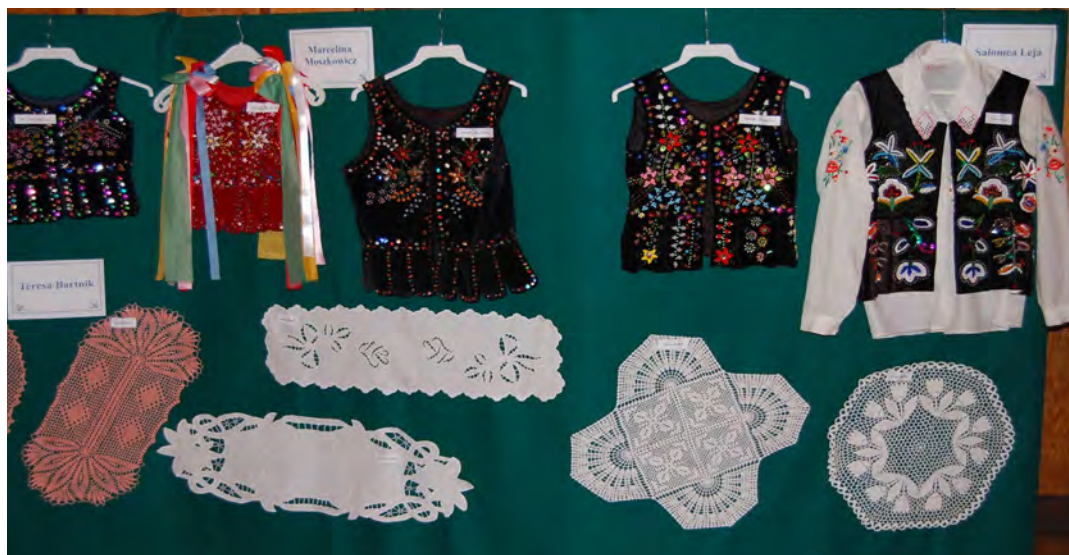
Na wystawie można było obejrzeć ręcznie haftowane gorsety