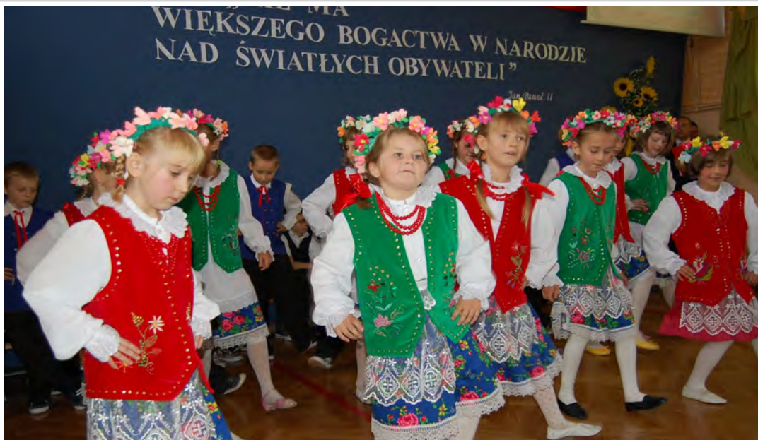
Występy artystyczne dzieci z Wólki Grodzkiej