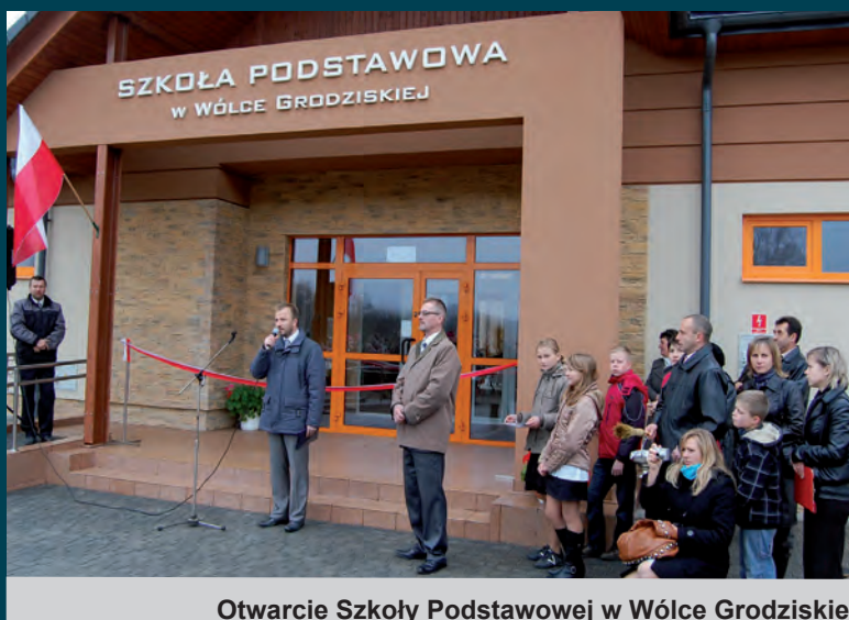
Otwarcie Szkoły Podstawowej w Wólce Grodziskiej