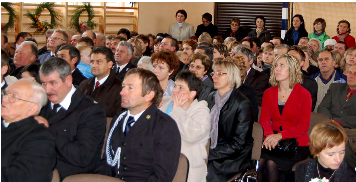
Nowa sala gimnastyczna wypełniona była po brzegi