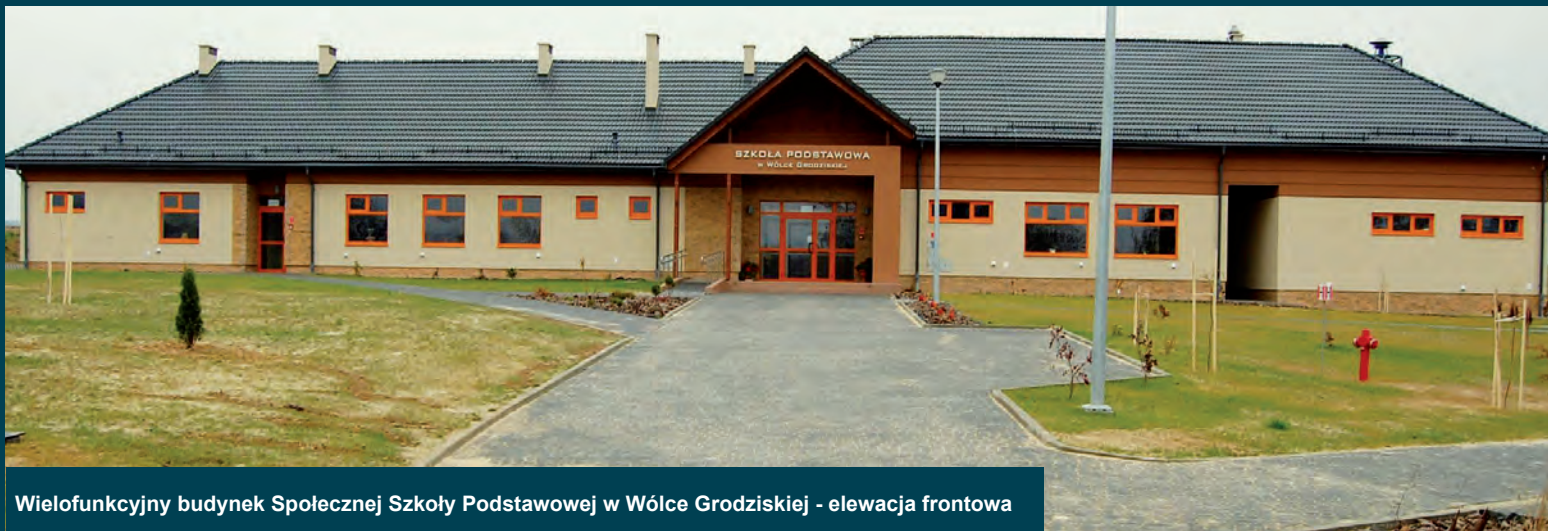
Wielofunkcyjny budynek Społecznej Szkoły Podstawowej w Wólce Grodzkiej - elewacja frontowa