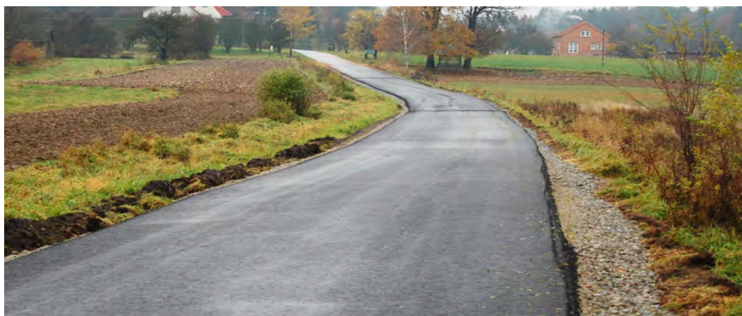
Droga na p. Maja

Szlak wiedzie od zbiornika Czyste, wzdłuż drogi powiatowej w kierunku Wólki Grodzkiej. Na trasie postawionych zostało 35 tablic informacyjnych z opisem najciekawszych atrakcji turystycznych. Z uwagi na wieloletnią historię Grodziska, sięgającą m.in. czasów Piastów, do tej pory w Grodzisku funkcjonują zwyczajowe nazwy poszczególnych obszarów miejscowości, czy też dróg. Zjawisko to powoli zanika. W związku z tym w ramach powstałego szlaku na tabliczkach umieszczono funkcjonujące wśród lokalnej społeczności nazwy.