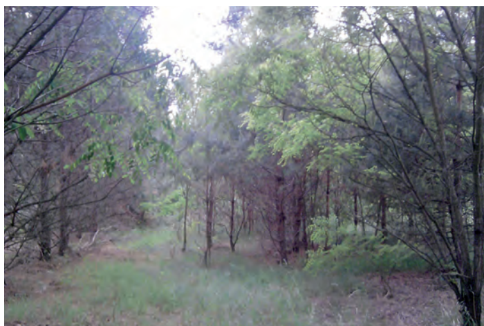
Działka oznaczona nr 3311/8 o pow. 0.57 ha w Grodzisku Dolnym

Przetarg odbędzie się w dniu 7 grudnia 2012 roku (piątek) o godz. 11.00 w Urzędzie Gminy Grodzisko Dolne (pokój nr 5).