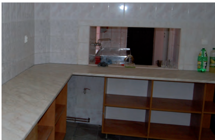
Remont pomieszczenia kuchennego w remizie OSP w Grodzisku Górnym

przebudowy Ośrodka Kultury jest przedsięwzięciem dwuletnim.