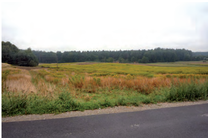
Działka oznaczona nr 316 o pow. 0.3817 ha w Zmysłówce

Przetarg odbędzie się w dniu 7 grudnia 2012 roku (piątek) o godz. 10.00 w Urzędzie Gminy Grodzisko Dolne (pokój nr 5).