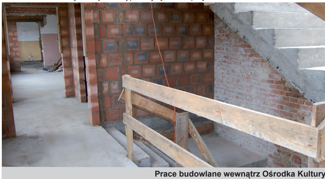
Prace budowlane wewnątrz Ośrodka Kultury