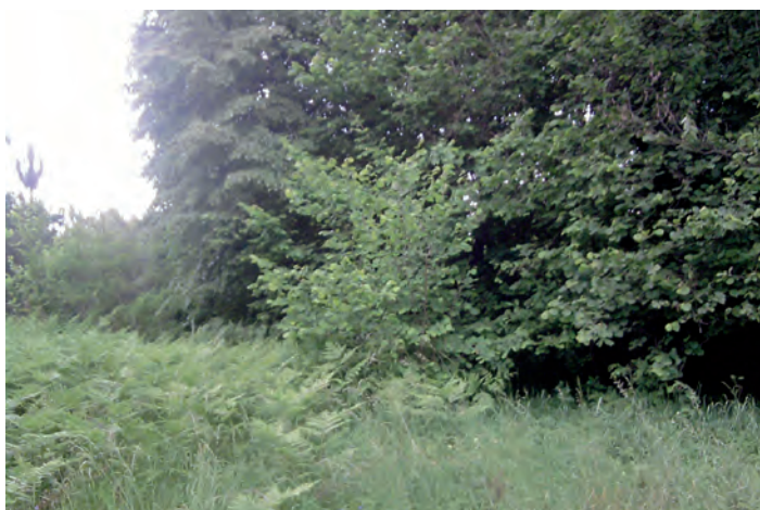
Działka oznaczona nr 3311/6 o pow. 0.0406 ha w Grodzisku Dolnym

Przetarg odbędzie się w dniu 7 grudnia 2012 roku (piątek) o godz. 10.30 w Urzędzie Gminy Grodzisko Dolne (pokój nr 5).