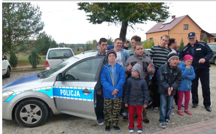
Obejrzenie policyjnego wozu to marzenie większości chłopców