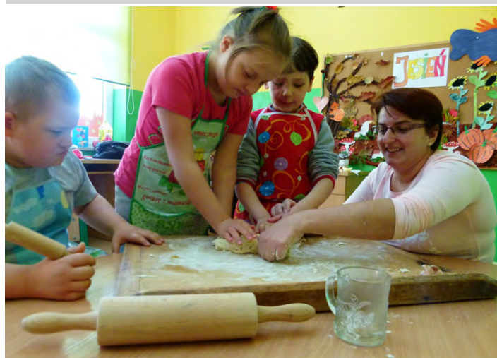
Tak powstaje ciasto na makaron własnej roboty