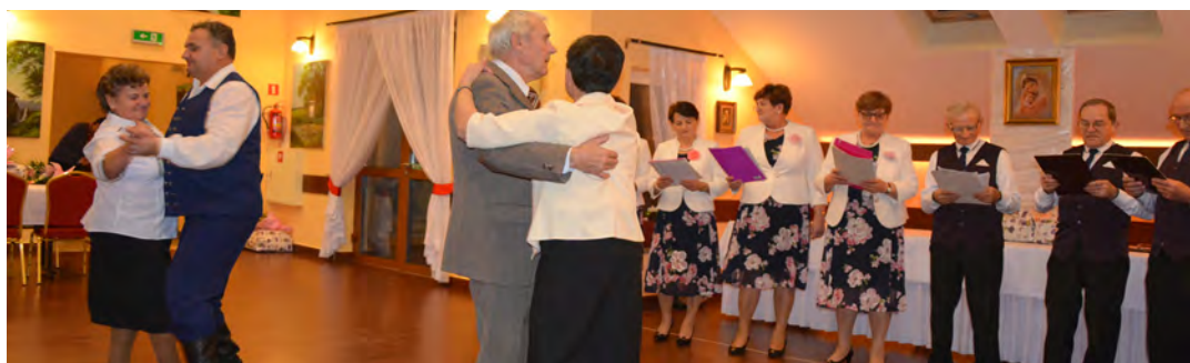
Grane utwory porwały niektórych na parkiet