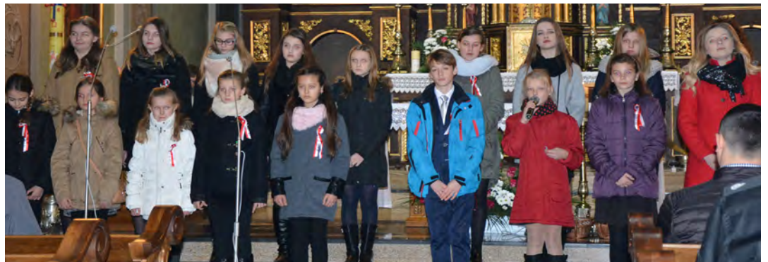
Patriotyczny blok artystyczny wykonała młodzież z Grodziska Dolnego

Pierwszym był pomnik „Żywią i bronią” w Grodzisku Miasteczku. Następnie udano się na grodziski cmentarz, gdzie pod obeliskiem „Pamięci tym, którzy cierpieli i oddali swe życie za Ojczyznę”, przedstawiciele władz złożyli kwiaty i wieńce. Będąc na cmentarzu udano się także na mogiłę zbiorową trzech żołnierzy