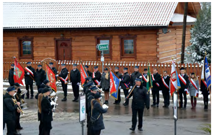
Uroczyste obchody rozpoczęły się w Grodzisku Miasteczku