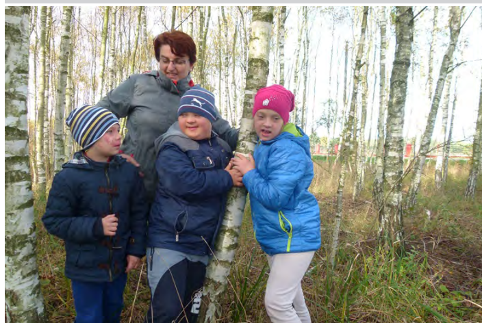
Przytulając się do drzew, dzieci pobierały dobrą energię