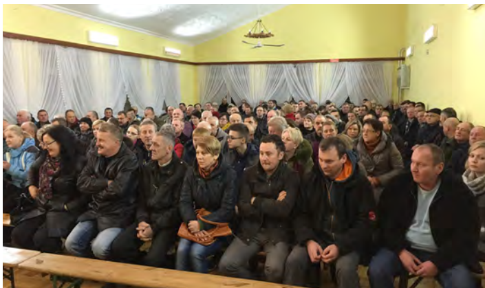
Udział w spotkaniach świadczył o sporym zainteresowaniu tematyką OZE

Dopuszcza się możliwość wyboru dwóch rodzajów instalacji jedynie w przypadku połączenia pompy ciepła i fotowoltaiki. W takim przypadku wielkość instalacji fotowoltaicznej będzie dobrana do mocy wybranej pompy ciepła. Wypełniając ankietę doboru instalacji należy zaznaczyć zarówno pompę ciepła jak i panele fotowoltaiczne oraz wypełnić informacje w zakresie pompy ciepła. W części dotyczącej paneli fotowoltaicznych w zakresie mocy umownej i zużycia energii zapisać jedynie- Instalacja w połączeniu z pompą ciepła oraz wypełnić informacje w zakresie proponowanego miejsca instalacji paneli i rodzaju pokrycia dachowego.