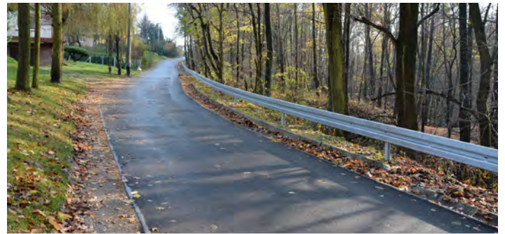
Przy takim nachyleniu drogi bariery były koniecznością