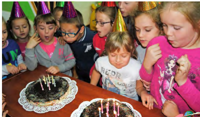
Na taką liczbę gości jeden tort to za mało

Następnie odbyły się zabawy i zgadywanki o bohaterach bajki. W zlizywaniu ma-