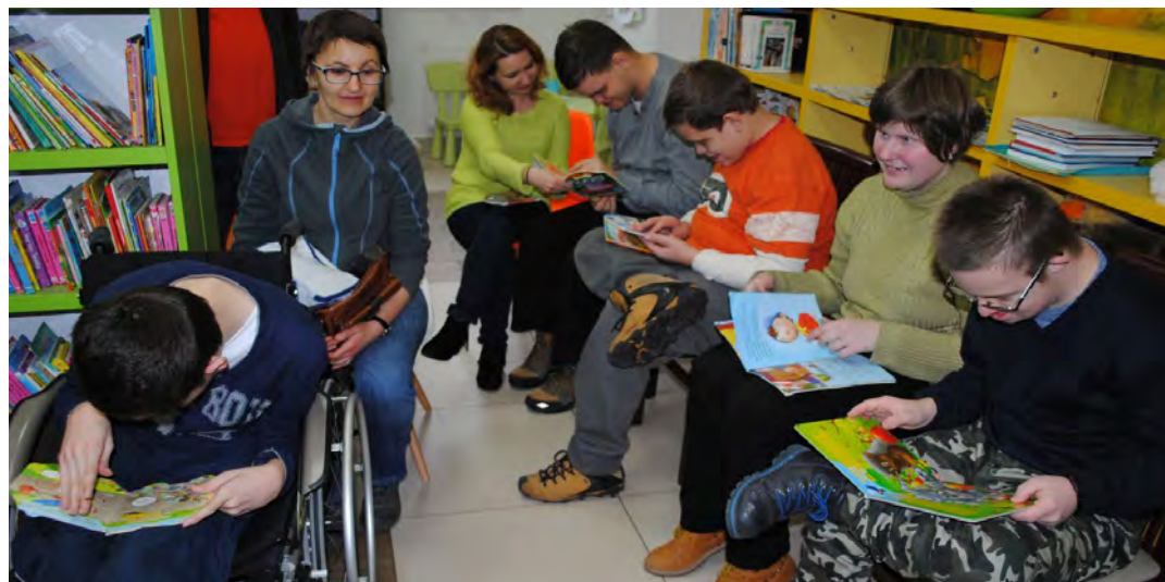
Goście z wielką ciekawością oglądali bajki i książki