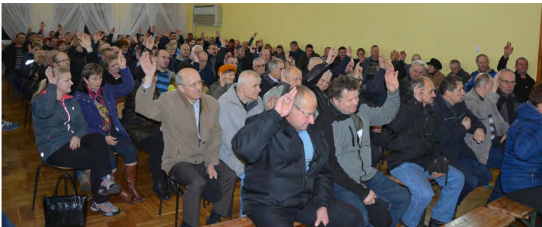
Radę Uczestników Scalenia wybrano poprzez głosowanie

Po zakończeniu zebrania okazało się, że troje spośród 12-stu członków nowo wybranej rady, nie jest rolnikami, dlatego na najbliższym spotkaniu scaleniowym skład rady zostanie uzupełniony o 3 nowe osoby.