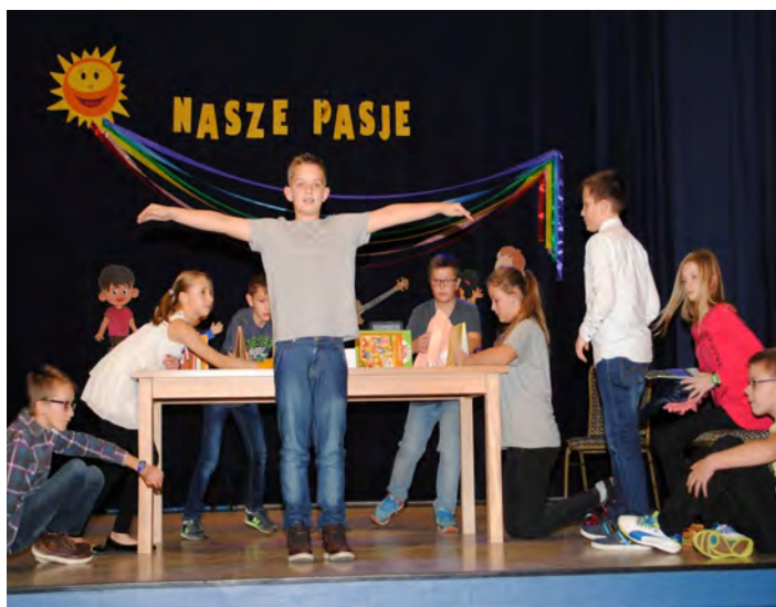
Kreatywność i pomysłowość młodych ludzi nie zna granic