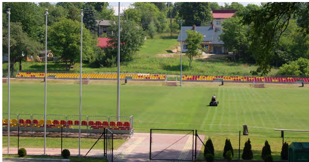
Płyta stadionu „Grodziszczanka” zyska profesjonalne nawodnienie