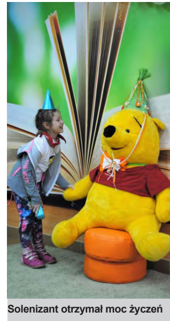
Solenizant otrzymał moc życzeń