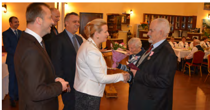
Jubileusze małżeńskie to coroczna tradycja w gminie