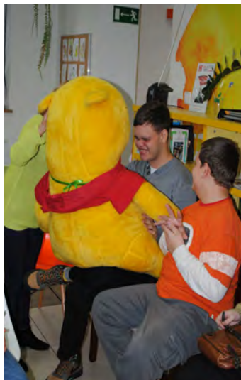
Na spotkaniu nie zabrakło i Kubusia