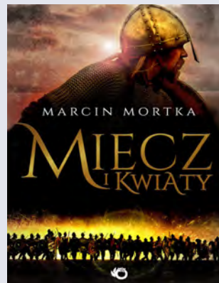
Marcin Mortka „Miecz i kwiaty”, Foksal 2016

Los nie sprzyja przyszłej rozwódce. W dodatku jej reputacja zawodowa zaczyna się walić, gdyż z konta firmy, w której pracował wiarołomny małżonek, znika ogromna suma pieniędzy, a jego kochanka zostaje znaleziona martwa. W tej sytuacji można zrobić tylko jedno. Wziąć sprawy w swoje ręce.