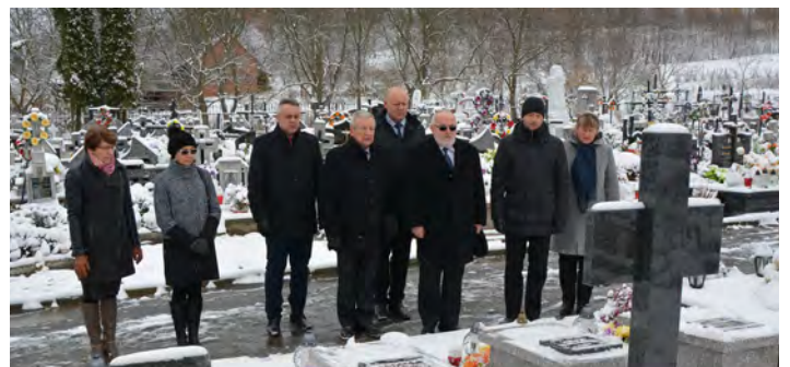
Na grodzickim cmentarzu, przy grobach żołnierzy Wojska Polskiego