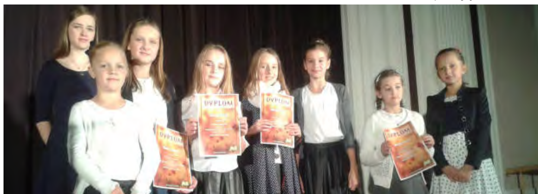
W konkursach recytatorskich przodują dziewczyny