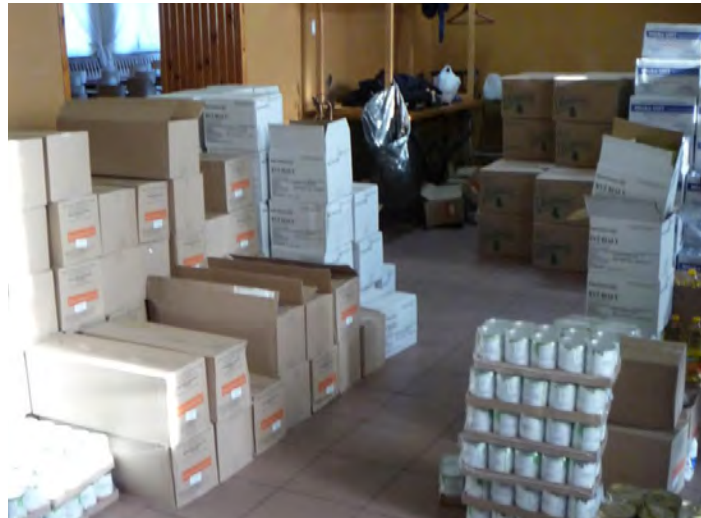
PROGRAM OPERACYJNY POMOC ŻYWNOSCIOWA 2014-2020

Żywność w postaci: mleka – 1320 l, groszku z marchewką – 264 kg, herbatników – 132 kg, ryżu – 660 kg, oleju rzepakowego – 660 l, makaronu jajecznego – 660 kg, fasoli bia-