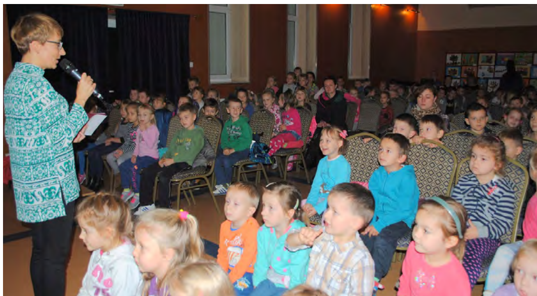
Przedszkolaki zawsze chętnie uczestniczą w organizowanych przez ośrodek konkursach