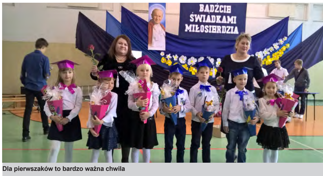
Dla pierwszaków to bardzo ważna chwila