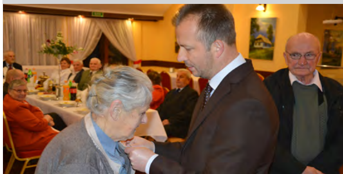
9 par małżeńskich odebrało medale nadane przez prezydenta