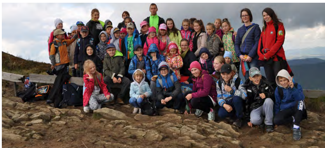
Nie ma to jak wycieczka w piękne o każdej porze roku Bieszczady