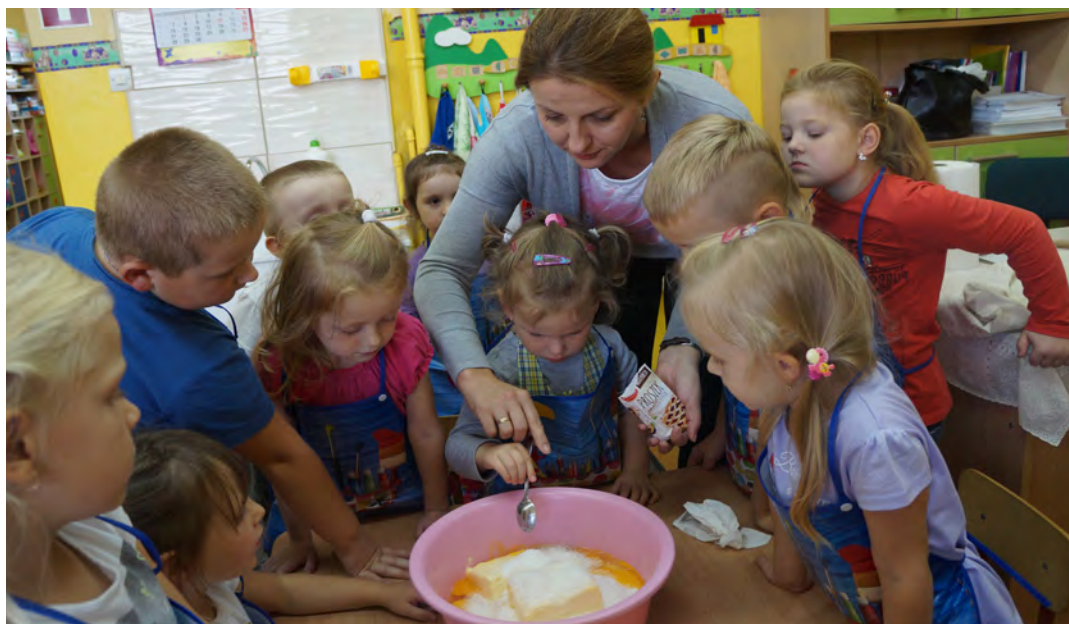
Samodzielnie przygotowane posiłki i desery cieszą najbardziej

Na zajęciach tych, dzieci rozwijają swoje praktyczne umiejętności kulinarne oraz poznają zasady prawidłowego odżywiania, które są niezbędne w dorosłym życiu. Jest to czas na brudzenie rączek, wąchanie przypraw, testowanie nowych smaków oraz opowiadanie o jedzeniu. W czasie prac kulinarnych przedszkolaki kształcą umiejętności współpracy w grupie, czerpią radość ze wspólnego przygotowywania posiłków, nabywają umiejętności planowania i organizowania swoich działań. Uczą się również, że ważne jest przygotowanie odpowiedniego stroju do czynności kuchen-