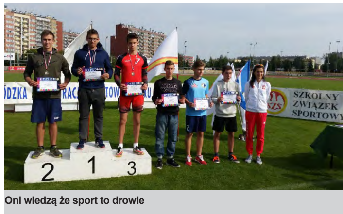
Oni wiedzą że sport to drowie