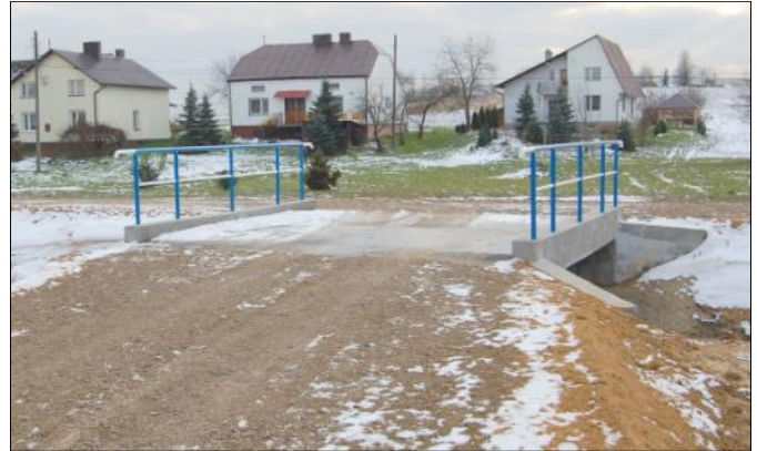
Nowy most na drodze „na Misia” w Grodzisku Górnym

Wójt Gminy składa serdeczne podziękowania panu Stanisławowi Bartnikowi - Radnemu Sejmiku Województwa Podkarpackiego, za okazaną pomoc w pozyskaniu środków na budowę mostu.