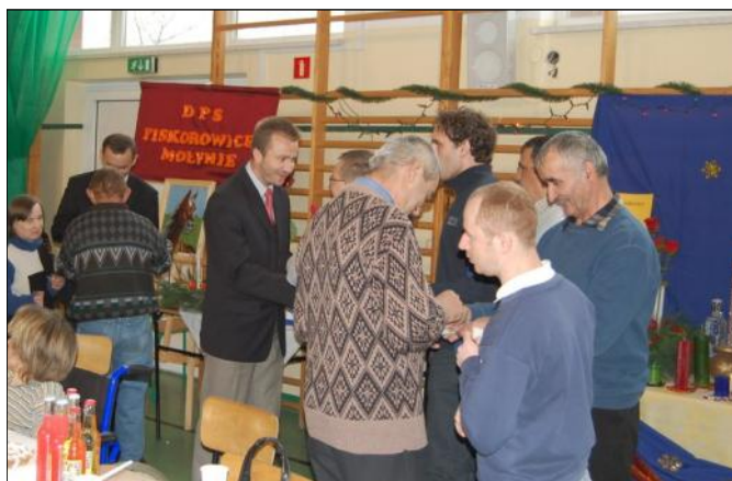
Świąteczne życzenia i łamanie się opłatkiem