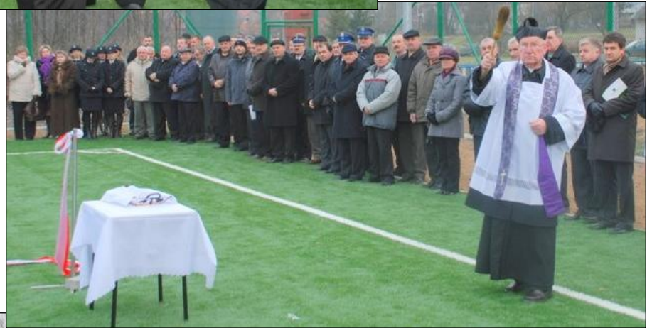
Akt poświęcenia nowego obiektu sportowego