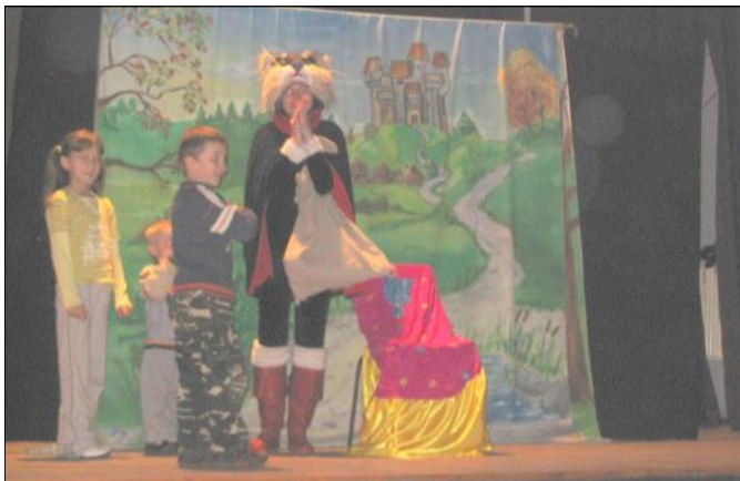
Przedstawienie „Kot w butach”

W tym dniu zgromadziła się w sali widowiskowej liczna grupa najmłodszych dzieci z Ochronki św. Józefa i tych trochę starszych z Ośrodka Rewalidacyjno-Wychowawczego w Laszczynach.