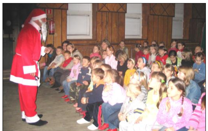
Święty rozdał dzieciom prezenty

W pierwszej kolejności dzieciaki obejrzały spektakl teatralny pt. „Kot w butach”, w wykonaniu aktorów z grupy teatralnej „ART-RE” z Krakowa, po czym miały możliwość wzięcia udziału w różnych grach i zabawach, przygotowanych specjalnie dla nich.