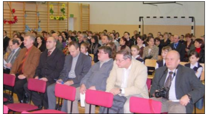
Profesorowie z Uniwersytetu Jagiellońskiego