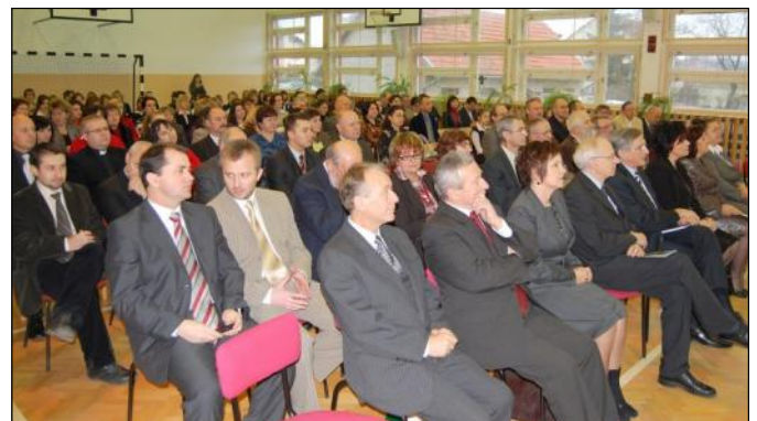
W konferencji uczestniczył poseł Zbigniew Rynasiewicz