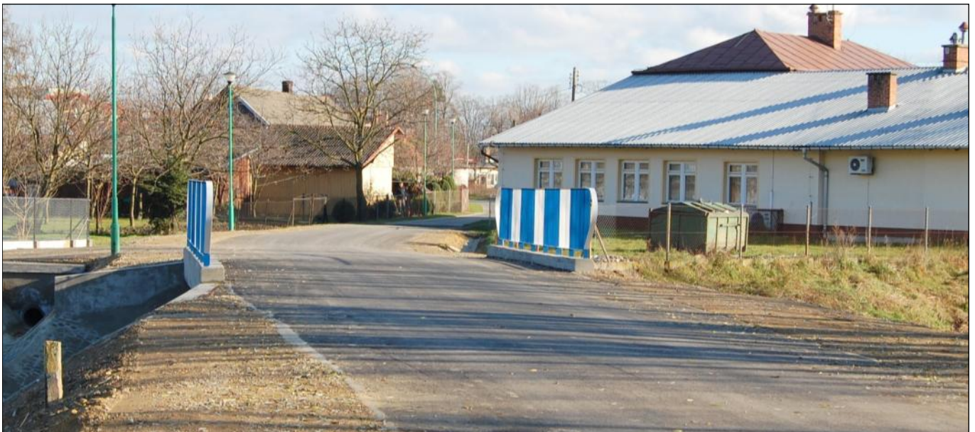
Wyremontowany most koło Remizy OSP w Grodzisku Dolnym