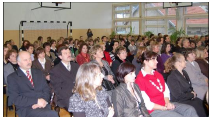
Uczestnicy sesji wypełnili salę po brzegi