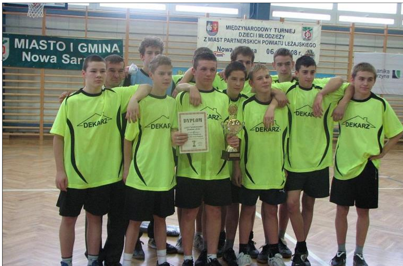
Zdobywcy II miejsca - LKS „Grodziszczanka” Grodzisko Dolne