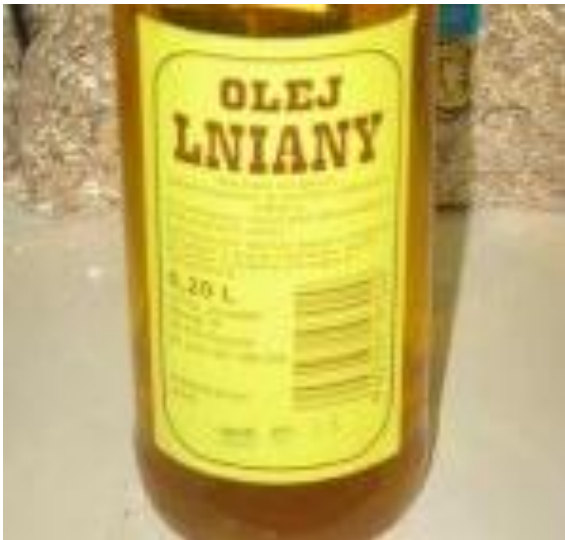
Olej lniany dostępny jest w szklanych lub plastikowych butelkach

Olej lniany wspomaga procesy trawienne, aktywizując przemianę materii, co może zapobiegać tworzeniu się kamieni żółciowych. Wzmacnia regeneruje błony śluzowe na całej długości układu pokarmowego. Skutecznie przeciwdziała miażdżycy, zawałowi serca i chorobie nadciśnieniowej. Zawarta w oleju omega-3 może wspomagać redukcję tkanki tłuszczowej oraz hamować powstawanie nowej. Wpływa korzystnie na od-tłuszczanie wątroby.