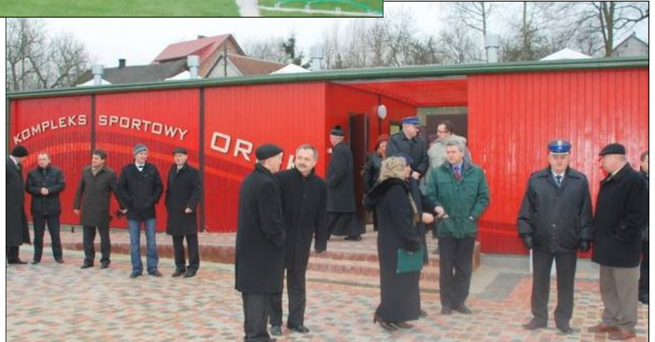
Kompleks sportowy posiada dwa boiska do gry oraz szatnię sportową