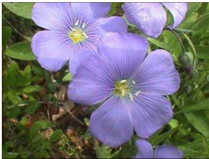
Kwiaty lnu są koloru chabrowego

W uprawie znajdują się dwa gatunki lnu, len oleisty i włóknisty. Len oleisty różni się od włóknistego ilością rozgałęzień i silniej rozwiniętym systemem korzeniowym. Plony nasion lnu oleistego osiągają 3t z ha, a słomy tylko do 4t, u lnu włóknistego do 7t. Zawartość tłuszczu w nasionach lnu oleistego wynosi 38 – 44% i jest wyższa o kilka procent niż w nasionach lnu włóknistego. Celem uprawy lnu oleistego jest uzyskanie jak największych plonów nasion, które są surowcem do otrzymywania oleju. Jest to tzw. olej schnący, służy do wyrobu pokostu, farb, lakieru, kitu, znajduje zastosowanie do wyrobu lekarstw. Len włóknisty uprawia się w celu uzyskania słomy lnianej, która jest surowcem do pozyskania włókna lnianego.