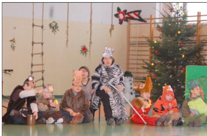
Wychowankowie ORW Laszczyny