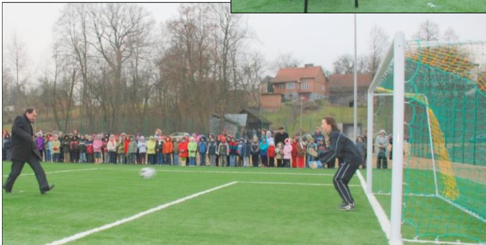
Pierwsze strzały na bramkę