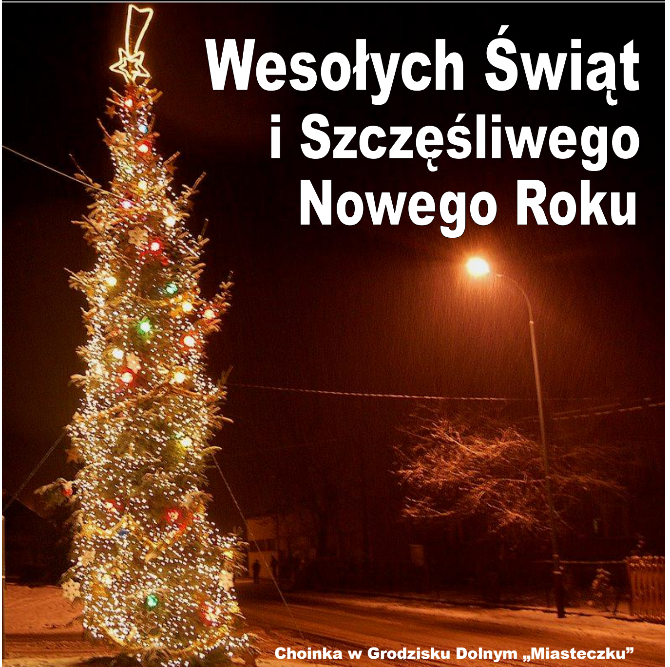
Choinka w Grodzisku Dolnym „Miasteczku”