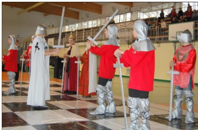
Inszenizacja Bitwy pod Grunwaldem