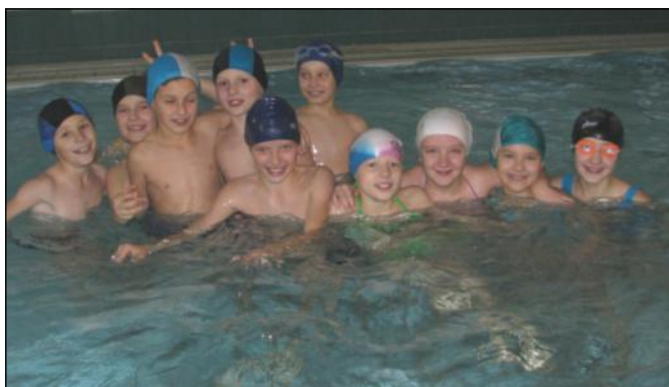
Grupowe zajęcia na basenie

Zajęcia cieszyły się dużym zainteresowaniem. Szczególnie dużym wzięciem cieszyły się zajęcia na pływalni wśród najmłodszej grupy dzieci z klas III i IV –tych. Poza nauką pływania uczniowie mieli możliwość zapoznania się z zasadami bezpiecznego zachowania na akwenach wodnych. Beneficjenci programu nie ponosili żadnych opłat i mieli zapewniony dowóz, co istotne było dla uczniów dojeżdżających. Zajęcia prowadzone były przez kadrę nauczycielsko-instruktorską Zespołu Szkół.