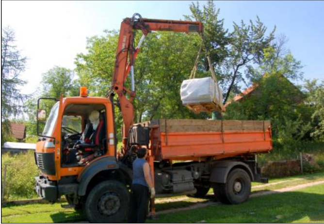
Paleta powinna być odpowiednio przygotowana, by podczas załadunku nie było problemów z jej zabraniem

Odpady zawierające azbest, z uwagi na zakaz ich stosowania, nie mogą być przedmiotem odzysku i muszą być w sposób bezpieczny dla ludzi i środowiska unieszkodliwiane przez składowanie.