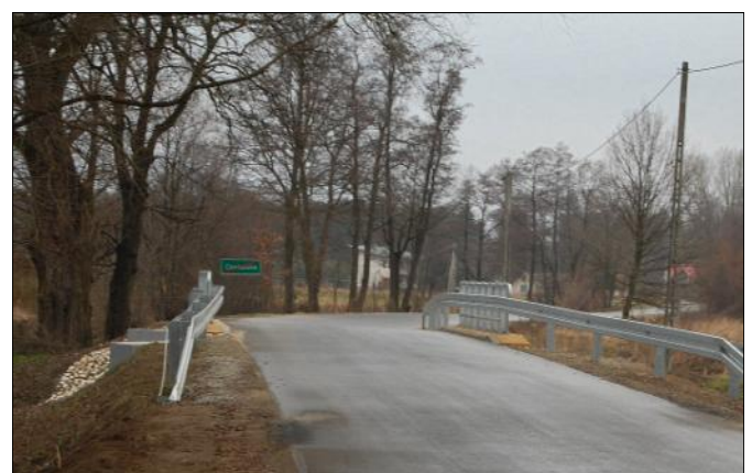
Wyremontowany odcinek drogi Grodzisko Nowe - Chodaczów wraz z mostem w Chodaczowie

podstawową budynku, powstaną nowe sale i pracownie do rehabilitacji osób niepełnosprawnych, z których korzystać będą mogli podopieczni Ośrodka Rewalidacyjno-Wychowawczego w Laszczynach.