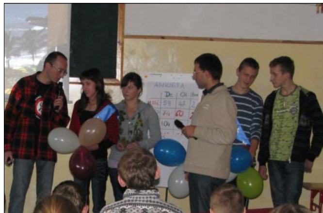
Młodzież bardzo aktywnie uczestniczyła w zajęciach

Podczas szkolenia rady pedagogicznej zaprezentowano także cele programu „Archipelag Skarbów”, wyniki badań nad młodzieżą wraz ze wskazówkami dotyczącymi szkolnej pracy profilaktycznej oraz wybrane aspekty wiedzy dotyczącej sku-