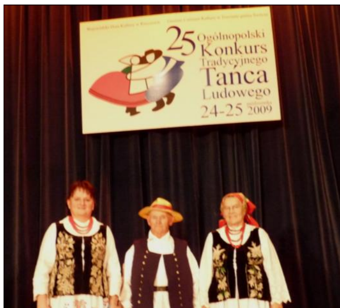
Za zaprezentowany taniec zespół zdobył drugą nagrodę