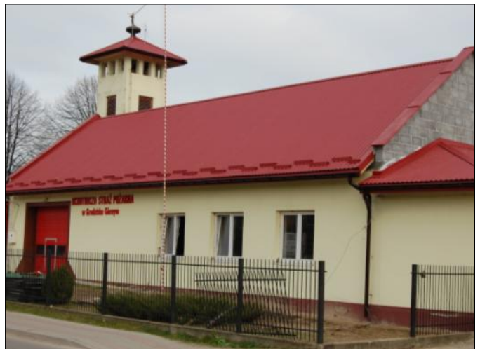
Nowy dach na remizie OSP w Grodzisku Górnym