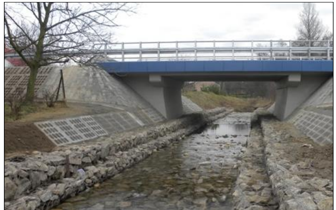
Pod nowym mostem na tzw. Orendzie uregulowano koryto potoku

Kontynuowane są także pozostałe prace związane z modernizacją i przebudową gminnych obiektów. Część z nich dobiegła już końca, inne są w trakcie realizacji. W miejscowości Grodzisko Górne koniecznym okazała się wymiana więźby dachowej wraz z pokryciem dachu na budynku remizy OSP. Obecnie trwają prace wewnątrz budynku. Przed nadejściem zimy dach położony zostanie również na obiekcie nowej szkoły w Wólce Grodzkiej. Z kolei w Laszczynach zakończył się pierwszy etap prac związanych z modernizacją starego budynku szkoły. Inwestycję prowadzi Stowarzyszenie Rodziców Niepełnosprawnych w Grodzisku Dolnym. W znajdującym się za szkołą