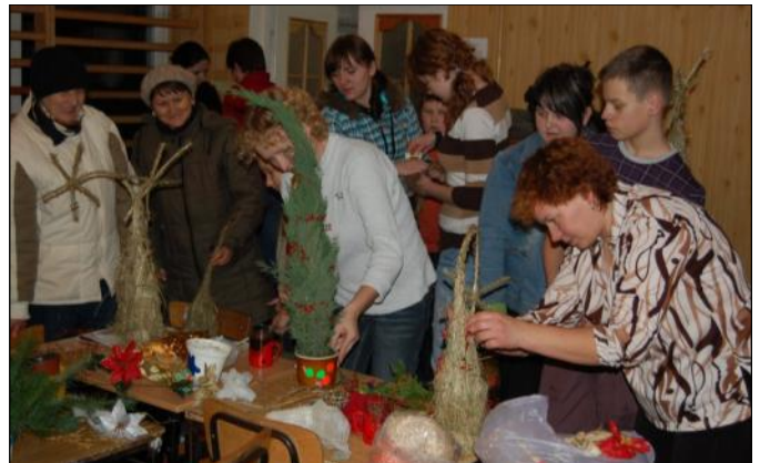
Przy ozdabianiu stroików liczyła się inwencja twórcza