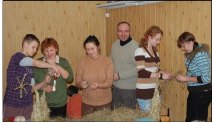
W warsztatach uczestniczyły całe rodziny