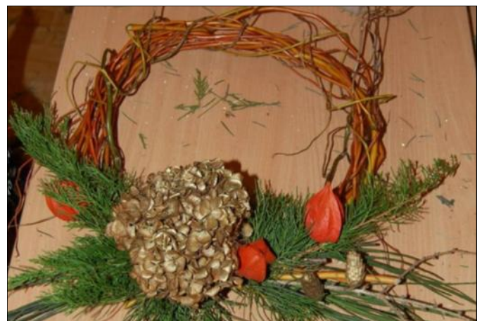
Z wierzbowych gałązek i choiny powstał wieńiec na drzwi