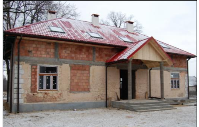
Budynek starej szkoły w Laszczynach zaadaptowany zostanie na potrzeby wychowanków ORW

Korzystne warunki pogodowe sprawiły, iż jeszcze w tym roku w ramach projektu udało się także rozpocząć prace na ponad 7,5 kilometrowym odcinku drogi powiatowej Grodzisko Dolne – Żołyńia. Wykonano już część prac związanych z położeniem pierwszej warstwy na odcinku od mostu w Grodzisku Dolnym do Opalenisk. Zakończenie inwestycji zaplanowano na rok przyszły. Dzięki