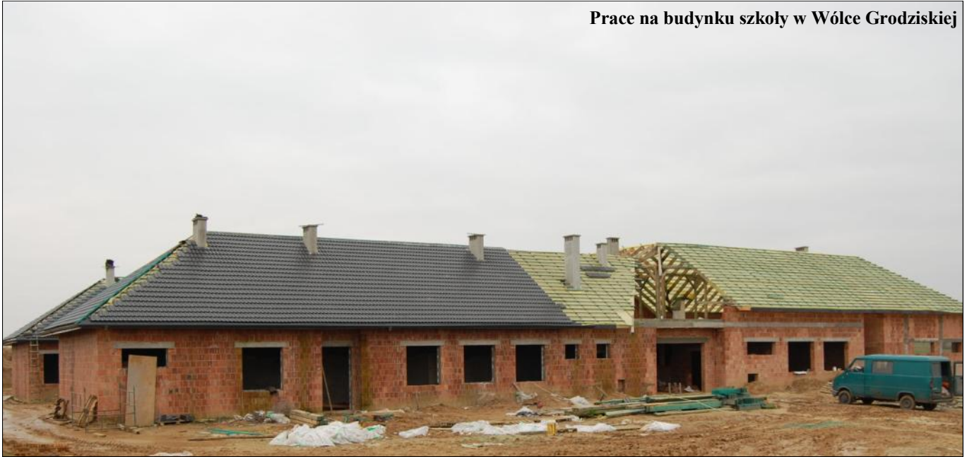
Prace na budynku szkoły w Wólce Grodziskiej

środkom z RPO stanowiącym 70% wartości inwestycji oraz dofinansowaniu ze strony powiatu leżajskiego (15%) i gminy Grodzisko Dolne (15%) nowej drogi doczekali się także mieszkańcy Grodziska Nowego i Chodaczowa. Trzykilometrowy odcinek drogi powiatowej oddano również w poniedziałek.