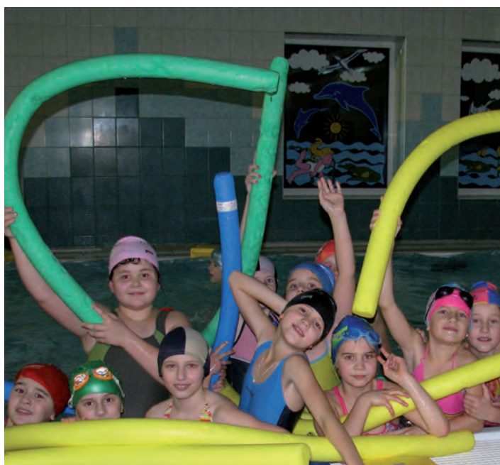
Najmłodsza grupa na basenie