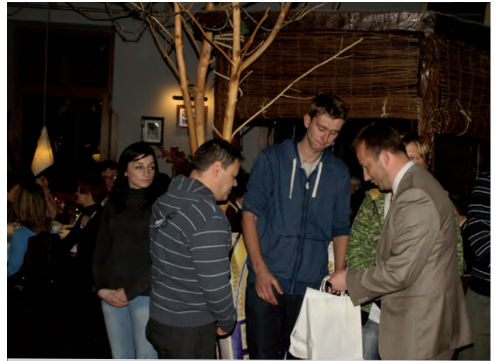
Podziękowania od Wójta

Oferta programowa mogłaby być dużo atrakcyjniejsza, ale brak stałych źródeł dochodu ogranicza działalność. W związku ze zmianą statutu PCK od przyszłego