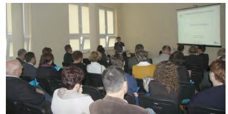
Spotkanie dla pracodawców (edycja 2)

Ważnym punktem spotkań był temat zatrudniania osób niepełnosprawnych i ich aktywizacji zawodowej, dlatego cieszy nas liczny i chętny w nich udział. W trakcie spotkań prezentowano również profile zawodowe uczestników poszczególnych edycji projektu, co mogło być pomocne w doborze odpowiednich pracowników.