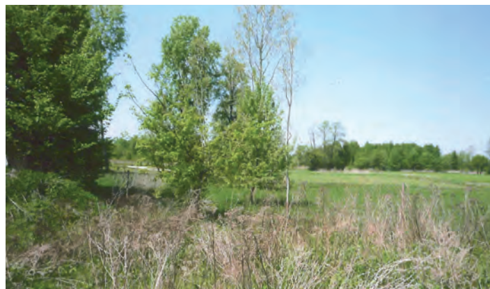
Działka oznaczona nr 1042/5 o pow. 0.1944 ha w Chodaczowie

Dodatkowe informacje można uzyskać w Urzędzie Gminy w Grodzisku Dolnym (pokój nr 5) w godz. 8 - 15 telefon (17) 2428265, 2436003 wew. 152 lub 151.