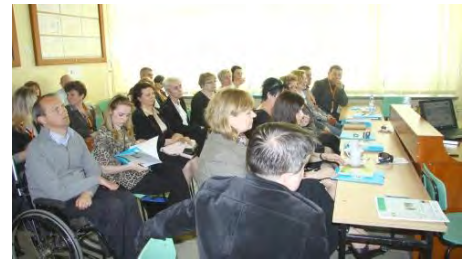
Spotkanie dla pracodawców (edycja 1)

do indywidualnych potrzeb, a tym samym jak najbardziej skuteczne. Zostały zrealizowane 2 grupowe spotkania dla pracodawców (po jednym w każdej edycji projektu) o profilach działalności zbieżnych z kompetencjami uczestników projektu.