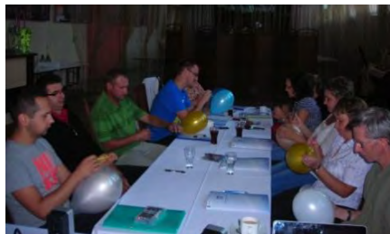
Szkolenie „Kompetencje społeczne” (edycja 2)

W sierpniu 2013 r. zakończyła się rekrutacja do drugiej edycji projektu, również z udziałem doradcy zawodowego i psychologa, w ramach której wyłoniono kolejnych 10 uczestników projektu (5 kobiet i 5 mężczyzn) z powiatu leżajskiego. Uczestnicy drugiej edycji projektu wzięli udział w analogicznych działaniach projektu jak uczestnicy pierwszej edycji: spotkania z doradcą zawodowym w ramach Indywidualnego Planu Działania, badania psychologiczne, szkolenie „Kompetencje społeczne”, Warsztaty Aktywnego Poszukiwania Pracy, indywidualne szkolenia zawodowe (operator wózka widłowego, operator obrabiarek CNC, grafika komputerowa z elementami DTP, kurs rysunku technicznego w programie AUTOCAD, komputerowa obsługa hurtowni i magazynu z obsługą kasy fiskalnej, kurs gastronomiczny, pracownik biurowy + kadry) oraz indywidualne spotkania z pracodawcami. Od grudnia 2013 r. uczestnicy tej edycji projektu rozpoczynają staże w różnych firmach i instytucjach powiatu leżajskiego i jego okolicach. Staże te będą trwać maksymalnie do końca maja 2014 r. gdyż realizacja projektu jest zaplanowana do końca czerwca 2014 r.