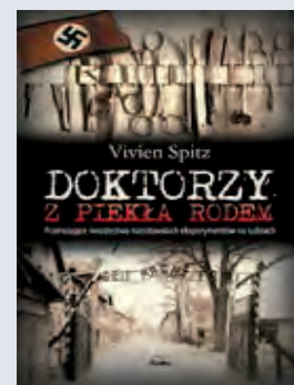
Vivien Spitz „Doktorzy z piekła rodem”, Replika 2013

Gdy odwrócisz głowę, może zalać go morską falą. Wtedy pozostanie tylko słona morską woda – albo słone łzy.