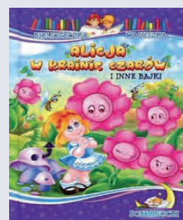
Alicja w Krainie Czarów. Biblioteczka Maluszka, Wydawnictwo Elżbieta Jarmołkiewicz 2013

Na podstawie przygotowanych relacji, wzbogaconych własnymi obserwacjami powstała poruszająca książka, szczegółowo traktująca o potwornych zbrodniach popełnionych rzekomo w imię nauki i patriotyzmu. Całości dopełniają unikatowe zdjęcia oraz fragmenty autentycznych protokołów z przesłuchań oskarżonych.