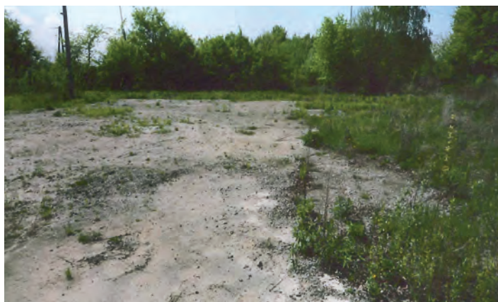
Działka oznaczona nr 1042/3 o pow. 0.3254 ha w Chodaczowie

Dodatkowe informacje można uzyskać w Urzędzie Gminy w Grodzisku Dolnym (pokój nr 5) w godz. 8 - 15 telefon (17) 2428265, 2436003 wew. 152 lub 151.