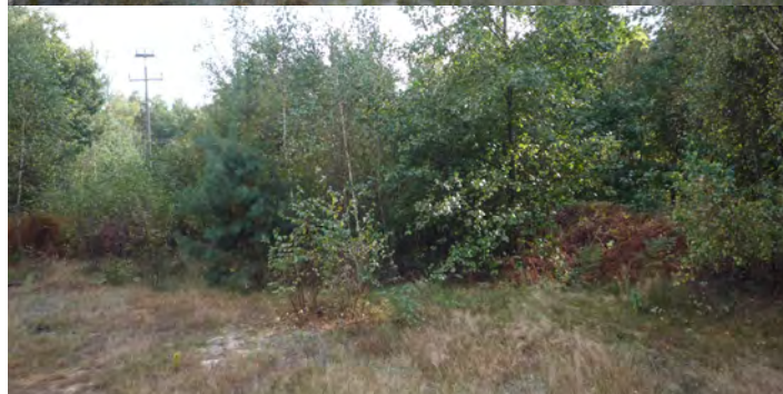
Działka oznaczona nr 429/1 o pow. 0.4284 ha w Laszczynach