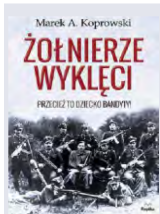
Marek A. Koprowski, „Żołnierze Wyklęci. Przecież to dziecko bandyty!”, Replika 2014

pomóc zapomnieć innym. Talent Miki zostaje odkryty przez niemieckiego żołnierza, który zmusza go do rozpoczęcia podwójnego życia, walki o życie i honor. Chłopcu udaje się jednak znaleźć nowe zastosowanie dla lalkarskiego talentu i sekretnych kieszeni płaszczka. Powieść opisuje też drugie oblicze wojny widzianej oczami niemieckiego żołnierza Maxa, który później trafia do syberyjskiego gułagu. Łącznikiem między postaciami żydowskiego chłopca i hitlerowca staje się jedna z pacynek, która przekazywana z pokolenia na pokolenie symbolizuje trudne dziedzictwo wojny.