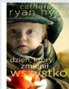
Catherine Ryan Hyde, „Dzień, który zmienił wszystko”, Jaguar 2014

oraz innych podziemnych organizacji, którzy ocalili, przeżyli wojnę i wyszli cało z ubeckich więzień czy katorżni. Wielu z nich otwarcie mówi, że to, że żyje, zawdzięcza wyłącznie szczęściu.