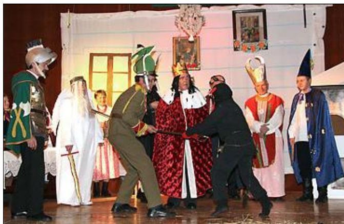
Herody w wykonaniu „Grodziszczoków”

W dniu 6 stycznia w Święto Trzech Króli w Kolbuszowej Górnej miał miejsce kolejny Wojewódzki Przegląd Widowisk Kołędniczych.