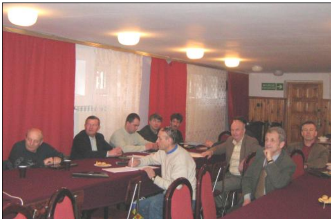
Wykłady z podstaw funkcjonowania gospodarstw ekologicznych

Podkarpacki Ośrodek Doradztwa Rolniczego w Boguchwale i Podkarpacka Izba Rolnicza w dniach 17 i 18 stycznia br., przeprowadziły w Urzędzie Gminy w Grodzisku Dolnym szkolenie dla rolników. Tematyka dotyczyła zasad prowadzenia gospodarstwa ekologicznego w aspekcie uwarunkowań środowiskowych i ekonomicznych województwa podkarpackiego.