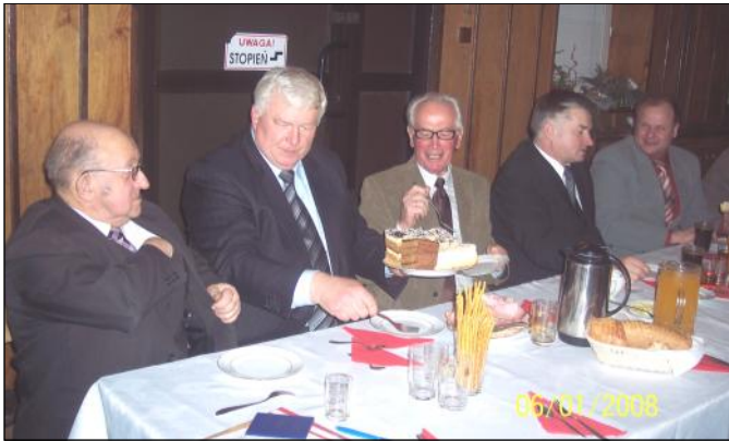
Sympatycy koła pszczelarskiego