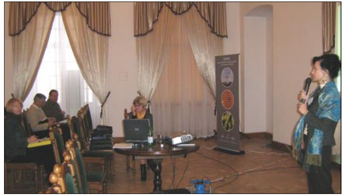
Prezentacja programu EQUAL

W trakcie trzydniowych spotkań na zamku w Krasiczynie zaprezentowano najlepsze rezultaty, jakie zostały wypracowane w ramach programu EQUAL oraz źródła ich finansowania. W przeprowadzo-