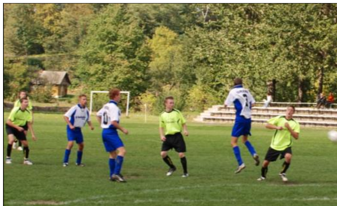
Fragment meczu z Orłem Przeworsk

13. Kańczuga 11 17-26 14. Sokół Nisko 7 15-50