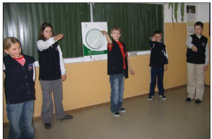
Nauka może być całkiem przyjemna

Ta krótka informacja mogłaby wystarczyć do scharakteryzowania celów, jakie sobie założono podczas planowania zespołów wyrównawczych z języka polskiego i matematyki w Szkole Podstawowej im. prof. Franciszka Lei w Grodzisku Górnym w ramach projektu „Szkoły Jagiellońskie”. W tych naukowych spotkaniach uczestniczyli wybrani