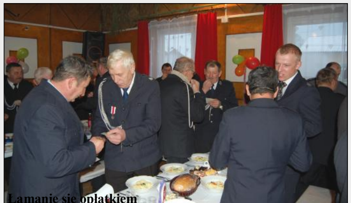
Lamanie się opłatkiem