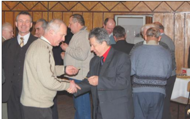
Pszczelarze tradycyjnie przelamali się oplatkiem

pszczelich, a także pomagają w zorganizowaniu Pielgrzymek Pszczelarzy z terenu województwa podkarpackiego do Sanktuarium Matki Bożej Pocieszenia w Leżajsku, które odbywają się 7 grudnia, w dniu święta pszczelarzy św. Ambrożego.