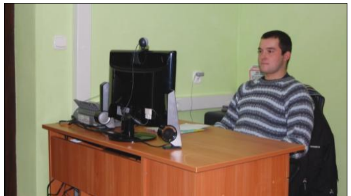
Osoba obsługująca centrum

podnoszenia wiedzy i kwalifikacji oraz korzystanie ze szkoleń dostępnych w ramach utworzonej platformy e-learningowej będzie nieodpłatne. Będzie to doskonale miejsce do organizowania różnego rodzaju kursów i szkoleń dla różnych grup społecznych.