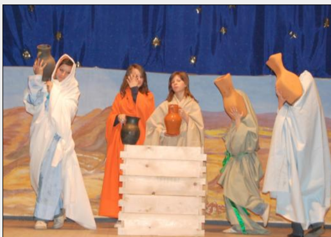
Teatrzyk „Ufoludek” w przedstawieniu „Jak to było...”