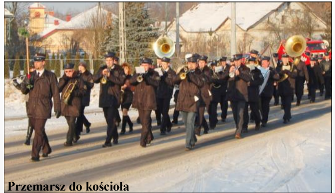
Przemarsz do kościoła