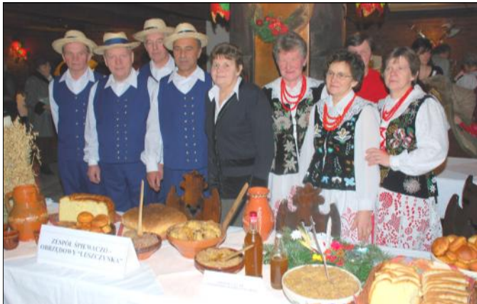
Potrawy wigilijne zaprezentowane przez „Leszczyńkę”

Głęboko zakorzenione bogactwo bożonarodzeniowych obrzędów, tradycji i zwyczajów zaprezentowano 18 grudnia 2008 roku w Wojewódzkim Domu Kultury w Rzeszowie, gdzie odbyła się Gala Finałowa „Prezentacji Potraw i Obrzędów Bożonarodzeniowych”.