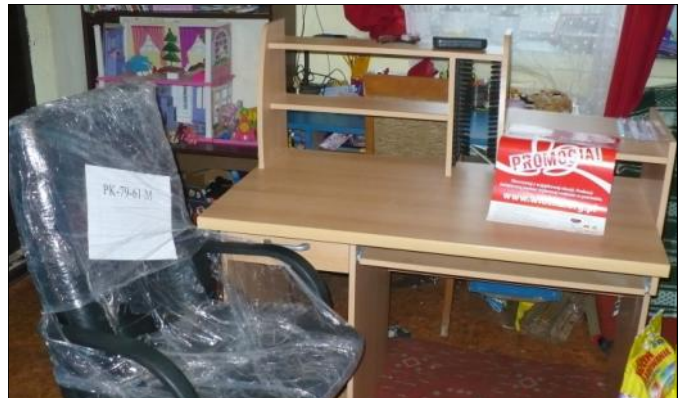
Jedna z rodzin otrzymała nowe biurko i obrotowy fotel

Świąteczne paczki trafiały do danej rodziny bezpośrednio od obdarowującego lub za pośrednictwem GOPS-u, gdzie pracownicy ośrodka jako wolontariusze, rozwozili je do domów. Ilość paczek była imponująca. W paczkach znajdowały się głównie artykuły spożywcze, chemiczne, przybory kuchenne, ubrania, buty, zeszyty i przybory szkolne.