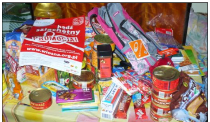
Wśród produktów spożywczych przeważały mąka, cukier, konserwy i słodycze

Dzięki życzliwości osób zamieszkałych za granicą oraz mieszkańców Krakowa, Łańcuta, Leżajska, Wałbrzycha oraz aktywności pracowników GOPS, wiele rodzin miało radośniejsze święta.