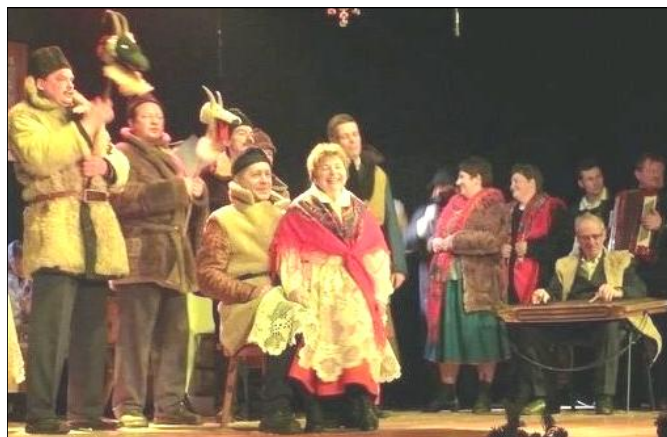
„Grodziszczoki” w widowisku „Kołędnicy z kozą”

Impreza rozpoczęła się o godz. 12-tej Mszą Św. w Kościele Św. Brata Alberta w Kolbuszowej, odprawioną w intencji kołędników dbających o zachowanie rdzennie polskich tradycji świątecznych. Po Mszy wszystkie grupy kołędnicze przeszły w paradzie do Miejskiego Domu Kultury, gdzie rozpoczęły się prezentacje konkursowe. W tej kategorii Zespół „Leszczyńka” przedstawił widowisko kołędnicze „Kolęda z owsem”, zaś „Grodziszczoki” „Kołędników z kozą”. Potem nastąpił koncert kołęd. Do tej kategorii „Leszczyńka” wytypowała kołędę „Pan z nieba i łona Ojca przy-