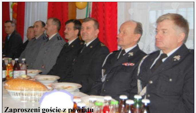
Zaproszeni goście z powiatu