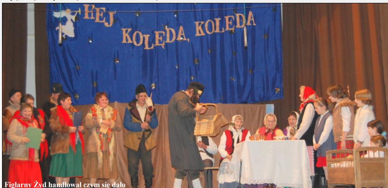
Figlarny Żyd handlował czym się dało