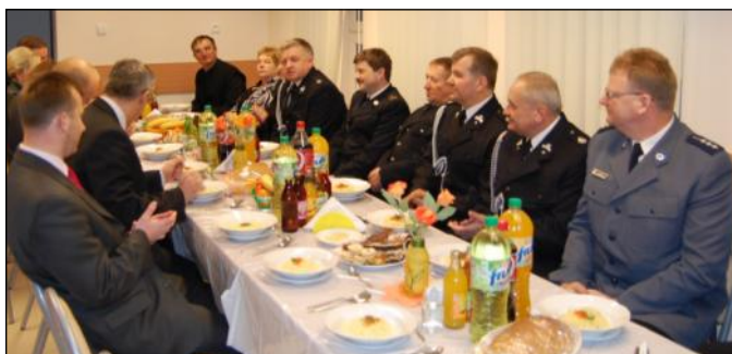
Na kolędzie nie zabrakło przedstawicieli z powiatu

Bezpośrednio po mszy, strażacy przenieśli się do mieszczącej się w budynku Środowiskowego Domu Samopomocy strażnicy, gdzie gospodarze, - jednostka z Laszczyn, przygotowali dla swoich kolegów poczęstunek. Przełamano się opłatkiem i złożono wzajemne życzenia. Były też liczne podziękowania za dobrą współpracę w minionym roku oraz za udział w akcjach gaśniczych i zabezpieczanie lokalnych imprez. Tradycyjnie już spotkanie swoim występem uświetnił koncert Orkiestry Dętej, przy wtórze której wspólnie odśpiewano kolędy.