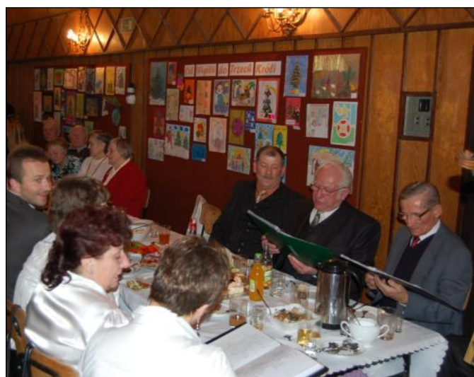
Kolędowanie przy stolach