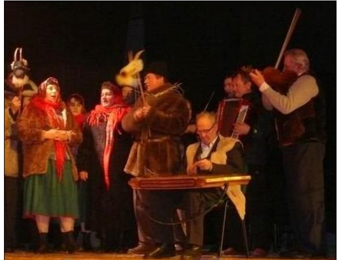
Grodziszczokom przyznano trzecią nagrodę

Nagrodę główną, czyli „Złotego Turonia” zawłaszczył tym razem zespół „Folusz” z Giedlarowej za „Kolędę z Turoniem”.