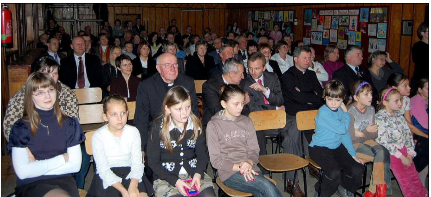
Sala Ośrodka Kultury wypełniła się po brzegi

Ten szczególny czas wypełniały wizyty kolędników z gwiazdą. Wspólnie zbierano się na tzw. chodzenie po domach. Za wyśpiewane kolędy dzieci