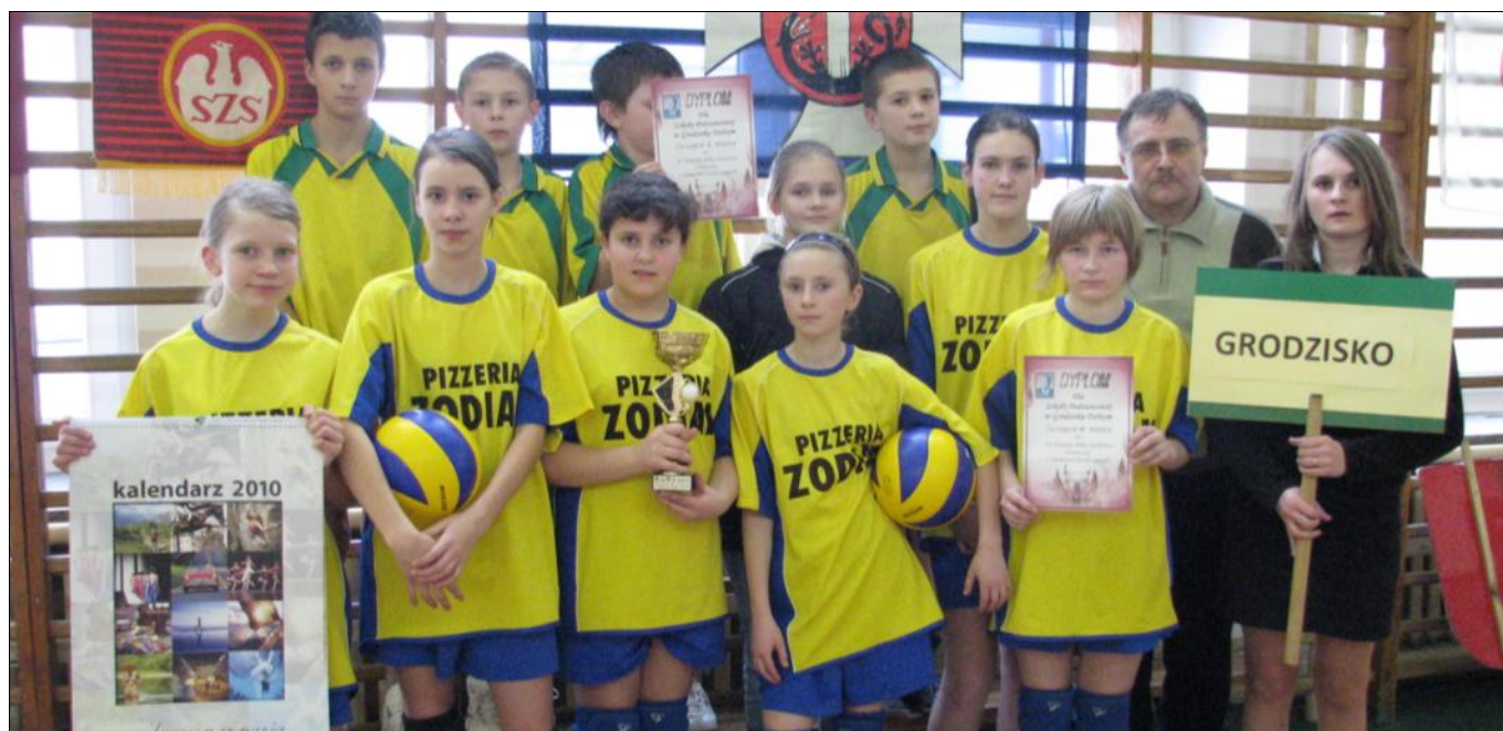
Drużyna dziewcząt otrzymała pamiątkowy puchar i dyplom, zaś chłopcy dyplom