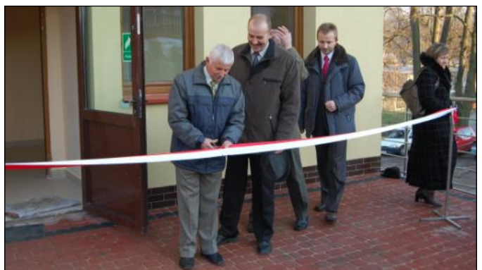
Uroczyste przecięcie wstęgi

Szatnia to druga obok otwartego w ubiegłym roku „Orlika” inwestycja sportowa w gminie. Modernizacja i rozbudowa szatni sportowej wraz z obiektami towarzyszącymi, to kolejny krok podjęty przez gminę w celu stworzenia nowoczesnej bazy sportowej i wypoczynkowej służącej nie tylko mieszkańcom gminy. Prace na budynku szatni trwają od 1994 roku. Z uwagi na brak środków finansowych inwestycja odwlekała się w czasie. Sytuacja zmieniła się dopiero w latach 2005/2006, kiedy do budynku szatni nadbudowano piętro, wykonano nowe pokrycie dachowe oraz stolarkę wewnętrzną i zewnętrzną. Na przebudowę gmina wygospodarowała we własnym budżecie 420 tys. zł. Kolejny etap prac zrealizowano dzięki otrzymanemu dofinansowaniu. W ubiegłym roku z PROW-u gminie udało się pozyskać ponad 480 tys. zł. Na