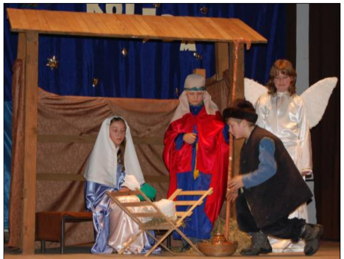
Teatrzyk „Ufoludek” w przedstawieniu jasełkowym

Ten szczególny czas wypełniały wizyty kolędników z gwiazdą. Wspólnie zbierano się na tzw. chodzenie po domach. Za wyśpiewane kolędy dzieci