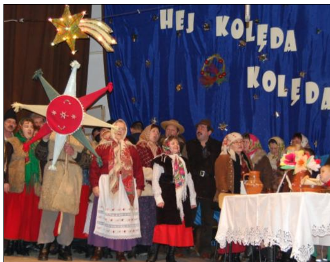
Widowisko „Szczodry wieczór”