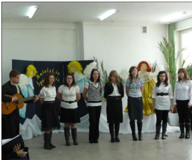
Gimnazjaliści z Grodziska zdobyli pierwsze miejsce