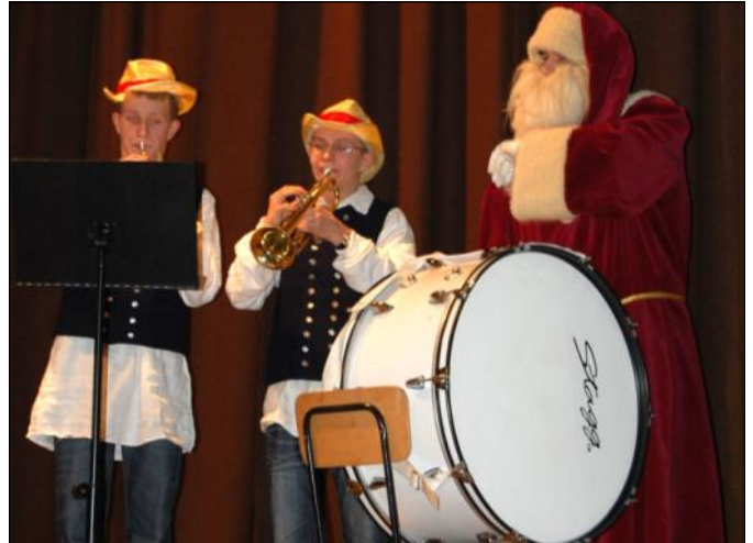
W roli dyrygenta wystąpił mikołaj

Następnie przyszedł czas występów. Scenki opisujące historię narodzin Jezusa w przedstawieniu jasełkowym zaprezentował teatrzyk „Ufoludek”. Ze swoim programem artystycznym wystąpiły także grodziskie zespoły „Leszczyńska” i „Grodziszczoki”. W widowisku „Szcudry wieczór” przypomnieli jak dawniej mieszkańcy gminy obchodzili okres od Świąt Bożego Narodzenia, do Trzech Króli.