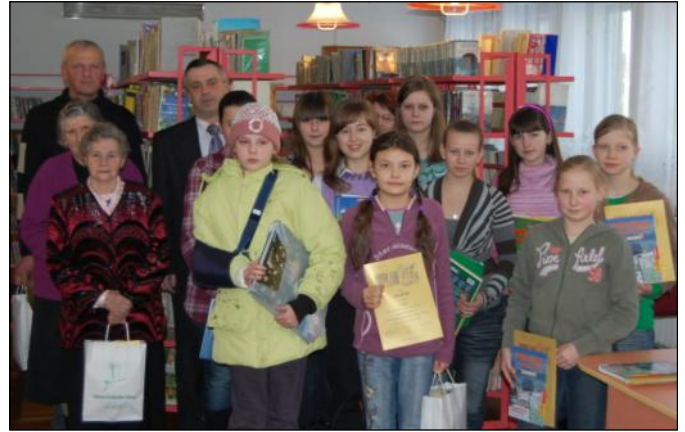
W konkursie udział wzięła nie tylko młodzież ale i starsi