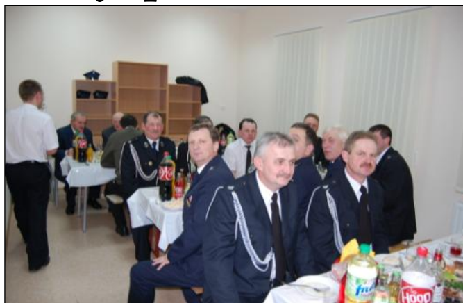
Wspólna biesiada przy stołach