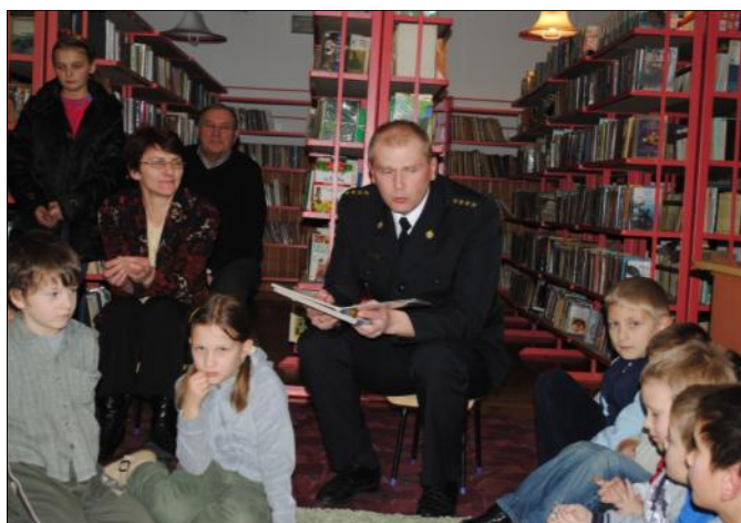
Mali goście byli zachwyceni obecnością strażaka

Nasi mali goście są coraz swobodniejsi w bibliotece i nawet takiemu poważnemu gościowi jak strażak trudno było utrzymać dzieci w ryzach. Mimo rozluźnionej atmosfery spotkanie było ciekawe i pouczające. Gość czytał bajki związane z pracą strażaka, z bezpieczeństwem i ekologią. W trakcie czytania rozmawiał z dziećmi o ważnych sprawach związanych z bezpieczeństwem. Dzieci przypomniły sobie numery telefonów alarmowych oraz dowiedziały się jak zgłosić wezwanie, jakie informacje podać dyspozytorowi i że absolutnie nie można dzwonić dla zabawy. Nasi najmłodszy czytelnicy poznali umundurowanie strażaka, a możliwość przymierzenia i sfotografowania się w hełmie strażackim wzbudziła furorę. Nikogo chyba nie zdziwi