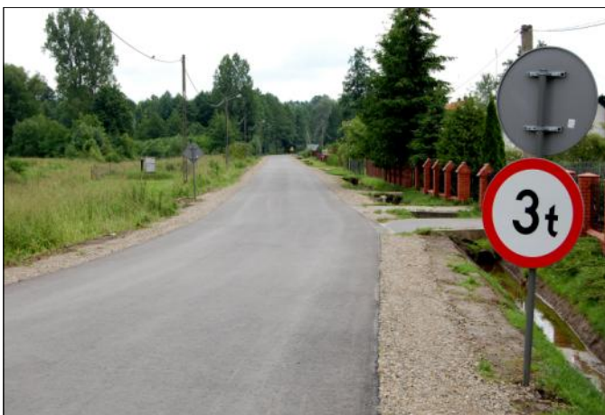
Wyremontowany odcinek tzw. „mokrzanek”