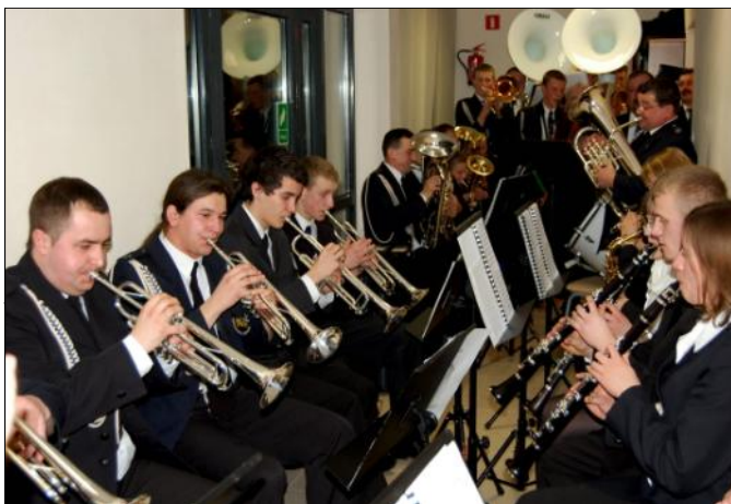
Dla orkiestry dętej zakupiono 31 nowych instrumentów