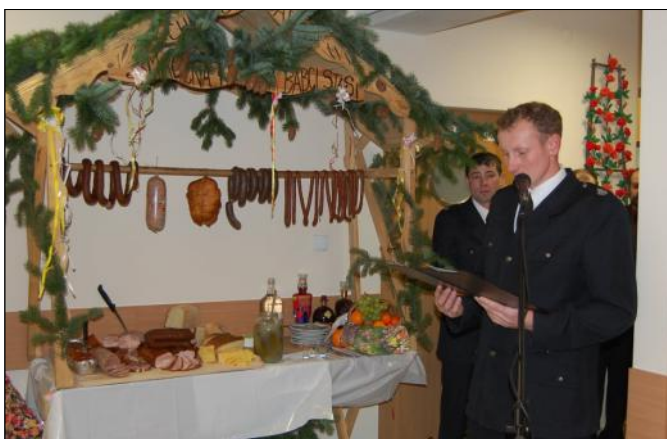
Uczestników spotkania powitał prezes jednostki