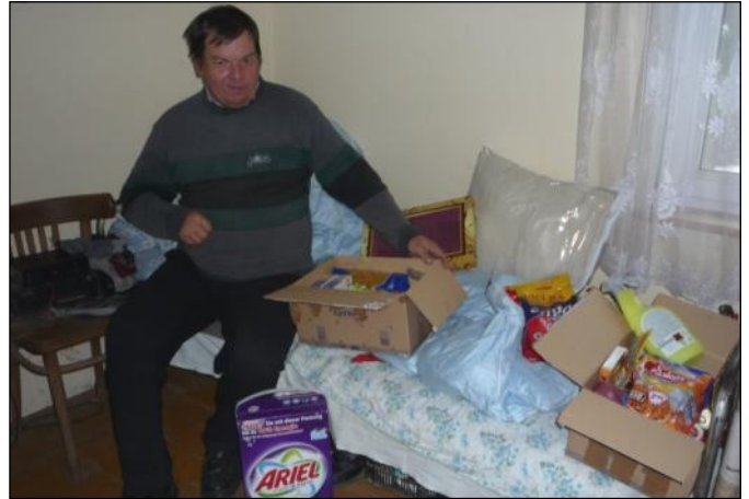
Z pomocy skorzystały 24 rodziny

Po raz drugi w akcję włączyli się pracownicy Gminnego Ośrodka Pomocy Społecznej w Grodzisku Dolnym i kilku pracowników Urzędu Gminy w Grodzisku Dolnym oraz zaprzyjaźnieni wolontariusze z Parafii w Chałupkach Dębniańskich, którzy na podstawie przeprowadzonych wśród mieszkańców wywiadów zgłosili do udziału w akcji 24 rodziny. Zgodnie z ideą akcji, potencjalny darczyńca wybierając z bazy stowarzyszenia rodzinę dla której chciał przygotować paczkę, mógł poznać jej konkretne potrzeby. Świąteczne paczki trafiały do danej rodziny za pośrednictwem wolontariuszy lub bezpośrednio od obdarowującego. W paczkach znajdowały się głównie artykuły spo-