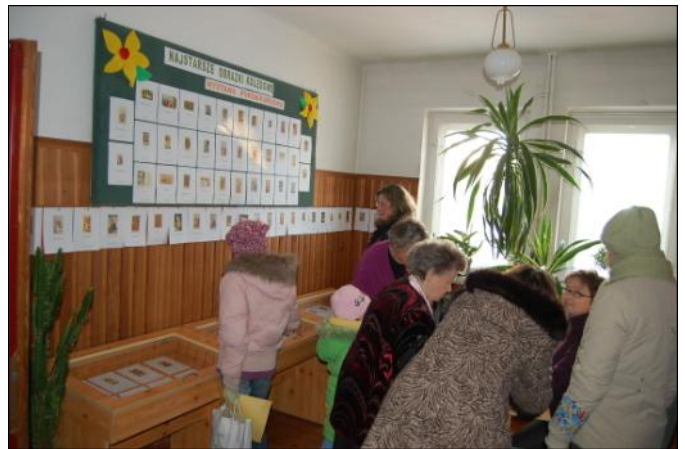
Wystawę można obejrzeć w bibliotece