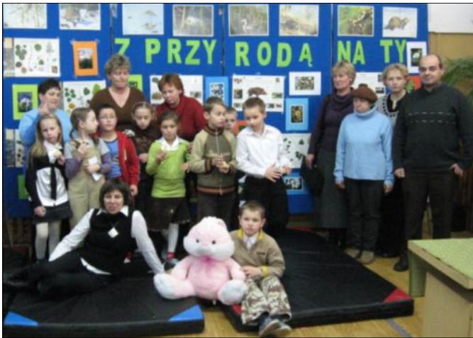
Realizacja projektów umożliwiła dzieciom rozwijanie umiejętności

W Społecznej Szkole Podstawowej w Wólce Grodzkiej realizowany był I etap ponadregionalnego Projektu Edukacyjnego współfinansowanego przez Unię Europejską w ramach Europejskiego Funduszu Społecznego.