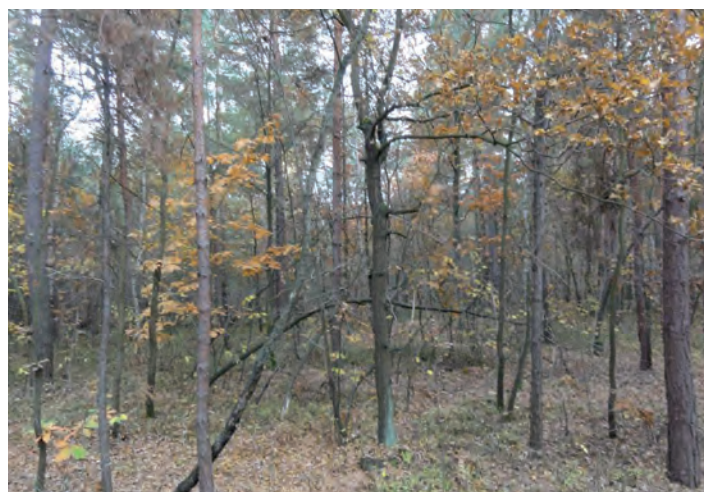
Działka oznaczona nr 3311/6 o pow. 0.0406 ha w Grodzisku Dolnym

I przetarg ustny nieograniczony odbędzie się w dniu 14 lutego 2014 roku (piątek) o godz. 11.00 w Urzędzie Gminy Grodzisko Dolne (pokój nr 5).