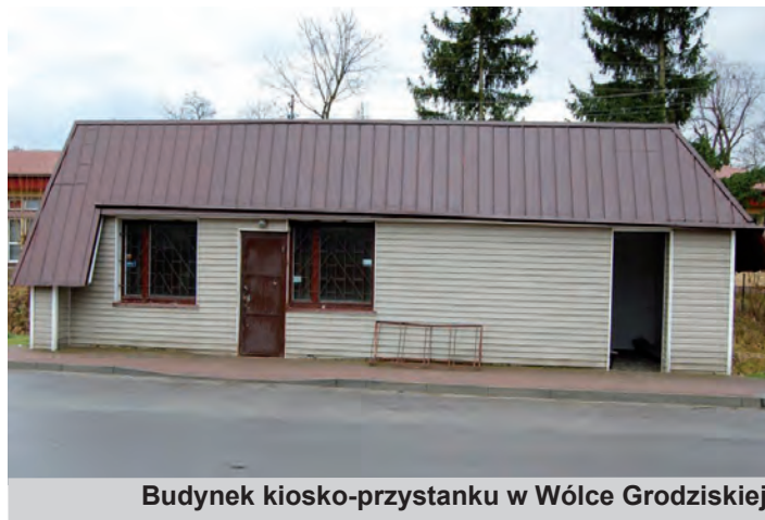
Budynek kiosko-przystanku w Wólce Grodziskiej

Podania na najem lokalu należy składać w Urzędzie Gminy Grodzisko Dolne (pokój nr 1) do dnia 31 stycznia 2014 roku. W przypadku gdy wpłynie więcej niż jedno podanie na w/w lokal zostanie przeprowadzony przetarg