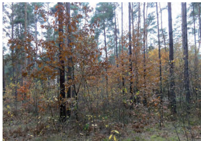
Działka oznaczona nr 3311/8 o pow. 0.57 ha w Grodzisku Dolnym

I przetarg ustny nieograniczony odbędzie się w dniu 14 lutego 2014 roku (piątek) o godz. 10.30 w Urzędzie Gminy Grodzisko Dolne (pokój nr 5).