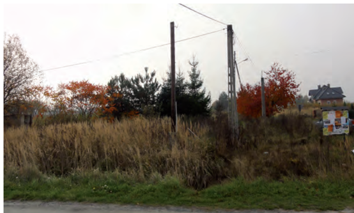
Działka oznaczona nr 1113 o pow. 0.1270 ha w Wólce Grodziskiej

I przetarg ustny nieograniczony odbędzie się w dniu 14 lutego 2014 roku (piątek) o godz. 10.00 w Urzędzie Gminy Grodzisko Dolne (pokój nr 5).