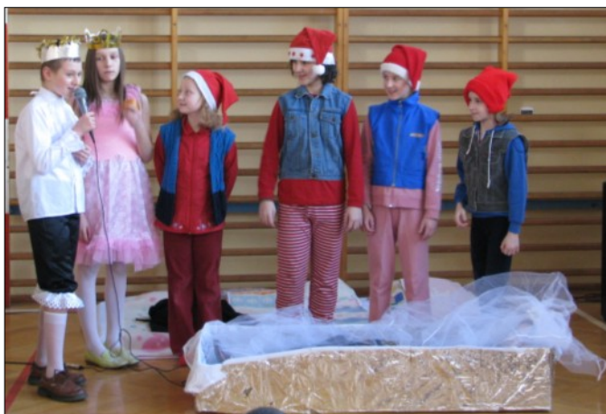
Nasi młodzi artyści podczas występu dla dzieci z OREW-u w Laszczynach

Głównym zamierzeniem kółka teatralnego jest edukacja dzieci i młodzieży w procesie wychowania przez teatr. Wystawianie sztuki, występowanie dziecka na scenie, żywy kontakt z publicznością to niezapomniana przygoda. Teatr jest procesem twórczym, to wspólna praca całego zespołu, dlatego w programie kółka jest miejsce na mnóstwo różnych ćwiczeń i zabaw mających na celu zintegrowanie zespołu. By odkryć własne możliwości i umiejętności uczniowie przygotowują improwizacje krótkich scenek o różnorodnej tematyce, które wymagają jednoczesnego zastosowania różnych form ekspresji. Wszystkie te działania przygotowywały młodych wykonawców do właściwego interpretowania materiału literackiego, jaki wystawiony będzie na scenie.