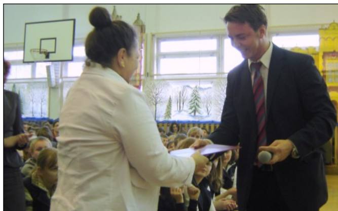
List gratulacyjny od przedstawiciela Wojewody Podkarpackiego