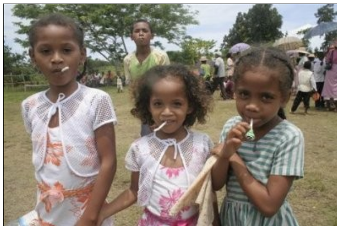
Otrzymane słodycze sprawiły dzieciom wiele radości

dzieciom potrzeby wdzięczności względem tych, którzy wspierają ich naukę. Chodzi o Was drodzy Przyjaciele i Dobrodzieje Misyjnej Adopcji Serca. Zatem 28 grudnia o 9.00 nasze spotkanie rozpoczęliśmy mszą świętą dziękczynną w Waszej intencji, prosząc o Boże Błogosławieństwo dla Was osobiście i Waszych Rodzin. Obecność dzieci była prawie 100%. Towarzyszyli im ich rodzice czy krewni. W sumie nasza grupa liczyła około 700 osób. Aby się wszyscy zmieścili poprosiliśmy Siostry Benedyktynki w Mananjary o udostępnienie ich ośrodka rekolekcyjnego. W ten sposób po przedstawieniu ławek i krzeseł większość dzieci mogła wejść do Sali, ale duża część była na zewnątrz. To nie problem, bowiem u nas w grudniu jest bardzo gorąco. W tym dniu nawet był spory deszcz, ale nikogo nie odstraszył.