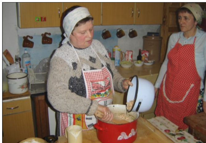
Kobiety z KGW w Grodzisku Górnym

W ramach projektu zaangażowane w działalność Stowarzyszenia panie z Kół Gospodyń Wiejskich, w styczniu br. przeprowadziły pierwsze warsztaty kulinarne. Wielkie gotowanie odbyło się w domach trzech gospodyń w Grodzisku Górnym, Dolnym i w Wólce Grodziskiej. Gotowane potrawy pochodziły z przepisów jakie wpłynęły na specjalnie zorganizowany w październiku ubiegłego roku konkurs kulinarny. Spośród przekazanych prac wybrano najbardziej oryginalne i tradycyjne, związane z naszą grodziską ziemią. Na bazie zgromadzonych przepisów i sfilmowanych warsztatów opracowywany jest multimedialny przewodnik kulinarny „Grodziskie Jadło”, który będzie dostępny na płytach DVD oraz stronie internetowej www.kobiety.grodziskodolne.pl