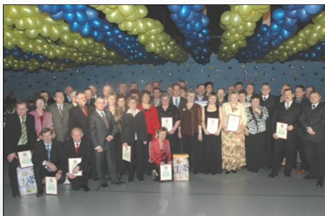
Jubileuszowe spotkanie pracowników browaru

dem jest półlitrowy kufel. W holenderskich pubach i restauracjach spożycie piwa jest znacznie większe niż w Polsce. W sklepie, Holendrzy kupują całą zgrzewkę, a nie po kilka butelek.