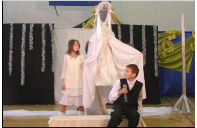
Grupa teatralna w Baśni „Królowa Śniegu”