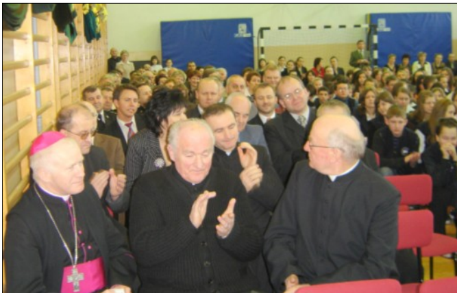
Powitanie zaproszonych gości

Fundusze (113 128,76 zł) uzyskane dzięki udziałowi w projekcie pozwoliły na zorganizowanie wycieczek krajoznawczych, szeregu zajęć pozalekcyjnych i utworzenie licznych kół zainteresowań. Wszystkie te działania umożliwiły naszym dzieciom kształtowanie własnej osobowości, rozwijanie zainteresowań i w twórczy sposób spędzanie wolnego czasu. Wyjazdy do Jarosławia, Krynicy Górskiej, Krakowa, Warszawy, a nawet Lwowa zorganizowane w poszukiwaniu śladów patrona Franciszka Lei realizowały cele poznawcze, a także wychowawcze.