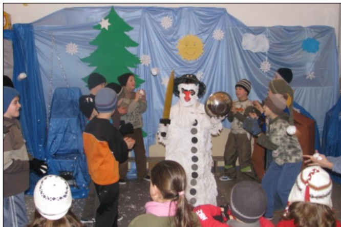
Przedstawienie pt. „Wszystkie dzieci kochają zimę” w wykonaniu uczniów klasy III

na się wyżyć kompleksów i przełamać barierę strachu. Tutaj też dzieci zdobywały poczucie własnej wartości, nabywały swobody i otwartości w kontaktach z ludźmi. Nasz dziecięcy teatr ma duży dorobek sceniczny.