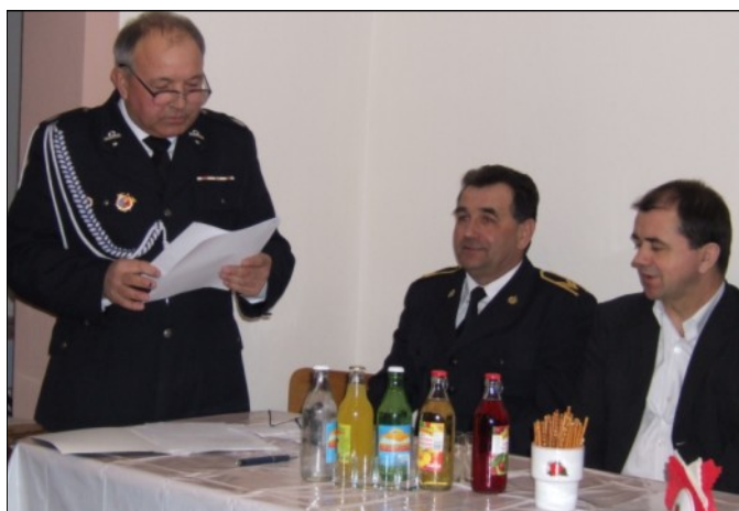
Zebranie OSP w Grodzisku Dolnym

Uczestniczyli w nich członkowie z poszczególnych jednostek OSP, władze administracji samorządowej powiatu i gminy, władze powiatowe Państwowej Straży Pożarnej zarząd i członkowie ZOSP działający na terenie gminy.