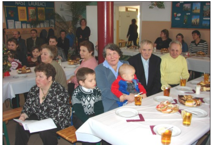
Wspólne biesiadowanie przy stole