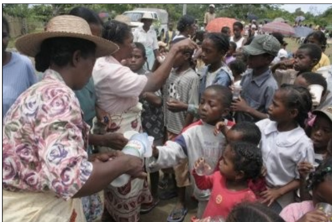
W kolejce po napoje