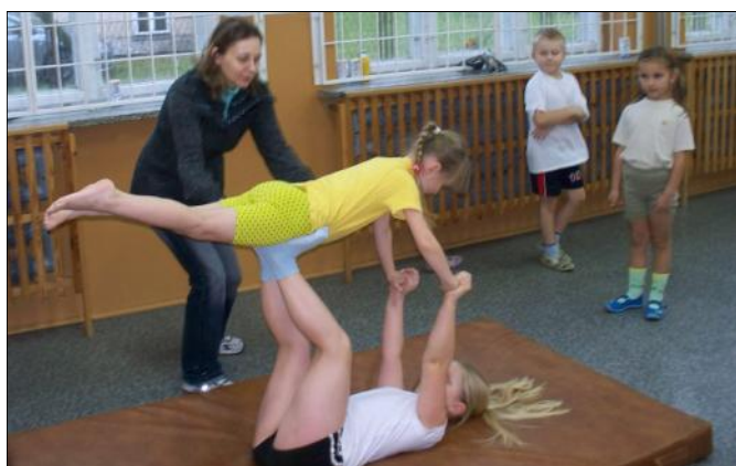
Sprawnościowe zajęcia z akrobatyki