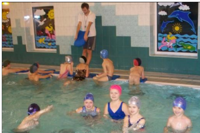
Na basenie dzieci czuły się jak ryby w wodzie