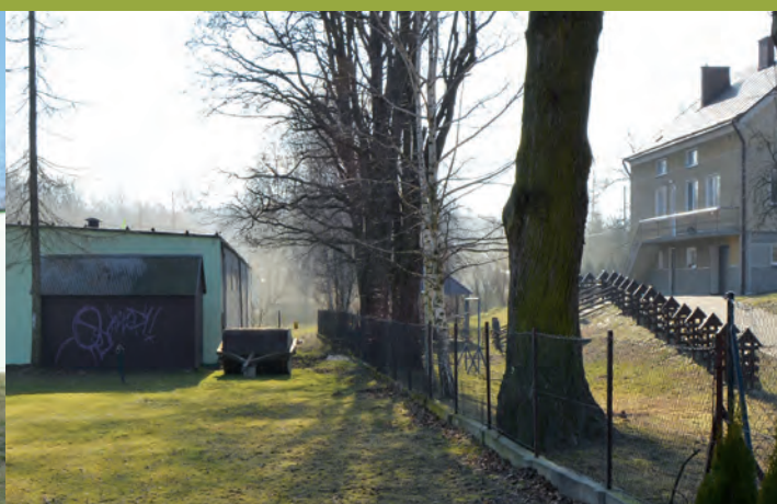
Projektowana obwodnica wokół stadionu w Grodzisku Górnym