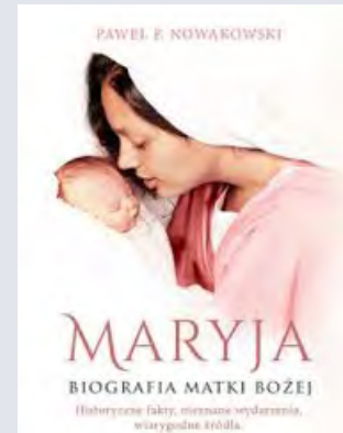
Paweł F. Nowakowski „Maryja. Biografia Matki Bożej”, Znak 2014

mienną w skutkach przysługę, która miała nigdy nie ujrzeć światła dziennego. Życie przerwało jednak znowu milczenia, a następstwa uczynku uruchomiły lawinę zdarzeń, które wystawiły na próbę rodziny obu braci, i tajemnica z przeszłości ujrzała światło dzienne. Konsekwencje braterskiej umowy poniosły żony bliźniaków i ich rodziny. Czy Elwira i Jagoda, dwie silne i przebojowe kobiety, znajdą dość sił, by uporać się z przeszłością mężów i ich marzeniami? Ile można poświęcić w imię raz danego słowa?