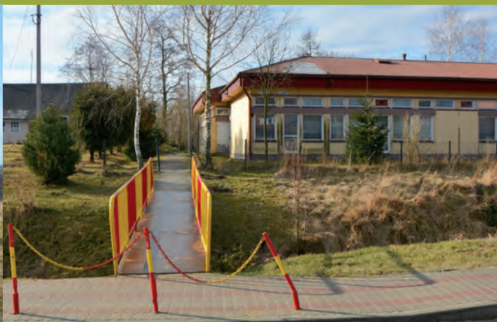
Droga wewnętrzna łącząca drogę powiatową i budynek szkoły w Wólce Grodzkiej