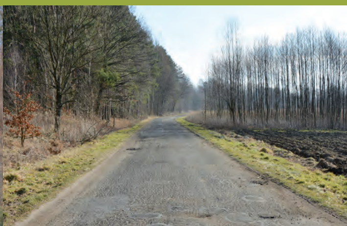
Przebudowywana droga powiatowa nr 1268R Kopanie Żołyńskie-Grodzisko Dolne - 1,3 km