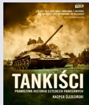
Kacper Śledziński „Tankiści. Prawdziwa historia czterech pancernych”, Znak 2014