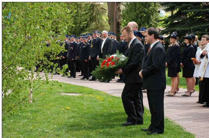
Złożenie wiązanek pod figurą św. Floriana