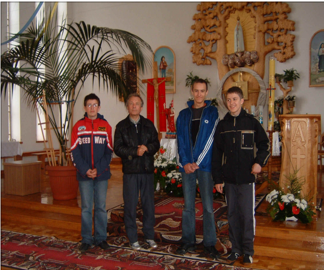
Sanktuarium w Terliczce

Kilkanaście kilometrów na zachód od Rzeszowa, przy mało uczęszczanej drodze, położona jest niewielka, spokojna miejscowość o nazwie Terliczka. Liczy ona zaledwie 500 mieszkańców. Mógłby ktoś zadać pytanie: co takiego interesującego i godnego opisanie znajduje się w owej wiosce? Otóż, miejscem, które najbardziej rozślawiło Terliczkę, zarówno w Polsce, jak i świecie, jest Sanktuarium Matki Bożej Fatimskiej i św. Ojca Pio.