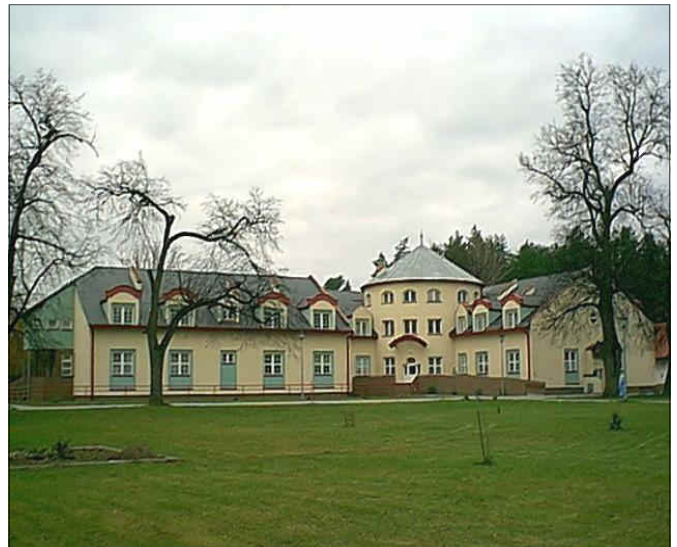
Dom Pomocy Społecznej w Piskorowicach– Mołyniach

Dlatego też GOPS w Grodzisku Dolnym stara się osobom wymagającym opieki zapewnić ją na miejscu poprzez organizację usług opiekuńczych na zasadach pomocy sąsiedzkiej, co jest formą bardzo dobrą i znacznie tańszą niż domy pomocy społecznej. Osoby, którymi opiekują się opiekunki zatrudnione przez GOPS są z nimi bardzo zżyte i czują się dobrze, bo są u siebie „na starych śmieciach”.