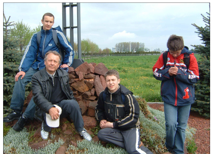
Pod Krzyżem Katynia

Kapucyn oprowadził nas również po dolnej kaplicy, gdzie znajdują się relikwie Stygmatyka z San Giovanni Rotondo. Następnie pokazał nam kaplicę Matki Boskiej Fatimskiej, czyli górną część kościoła. Wszystkie ołtarze, ambony i krzyże w całym sanktuarium są wykonane z drewna, co dodaje mu swego rodzaju prostoty. Po modlitwie, odwiedzeniu ogrodu św. Ojca Pio, który znajduje się za domem zakonnym, oraz krótkim odpoczynku wyruszyliśmy w drogę powrotną.