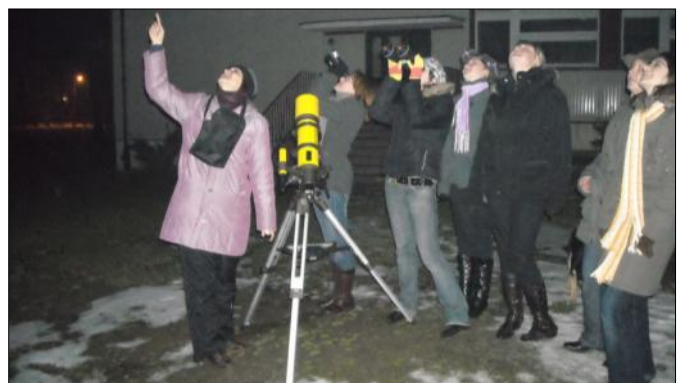
W poszukiwaniu Gwiazdy Polarnej