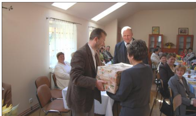
Na ręce prezes stowarzyszenia Wójt Gminy wraz z Przewodniczącym wręczyli komplet garnków