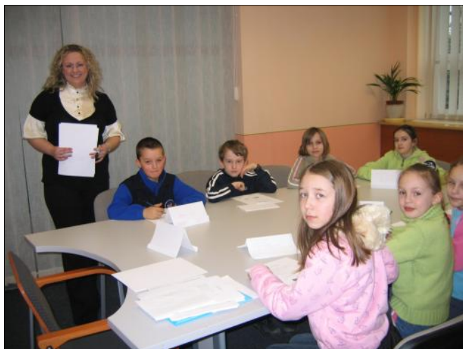
Było wesoło i pouczająco

24 uczniów Szkoły Podstawowej im. prof. Franciszka Leji w Grodzisku Górnym uczęszczających na zajęcia Centrum Języka Angielskiego „Młodzi Poligłoci” realizowane w ramach projektu „Centrum Nowoczesnego Kształcenia – szansą na lepszą przyszłość” współfinansowanego przez Unię Europejską, wyjechało na spotkanie z żywym językiem angielskim, które było możliwe w Szkole Języków Obcych Promar w Rzeszowie.