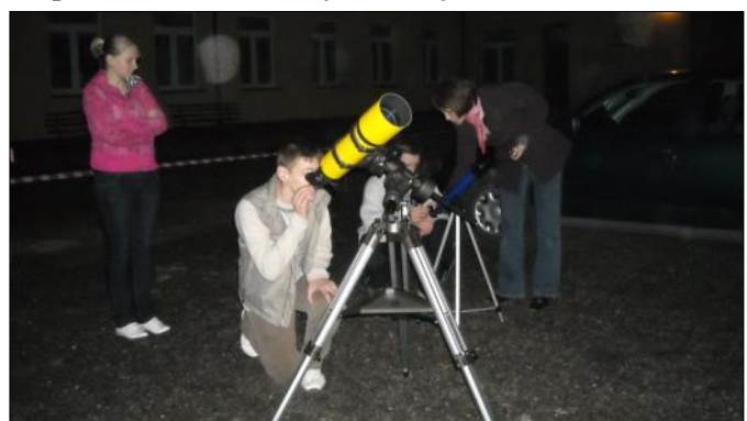
Nocne obserwacje nieba