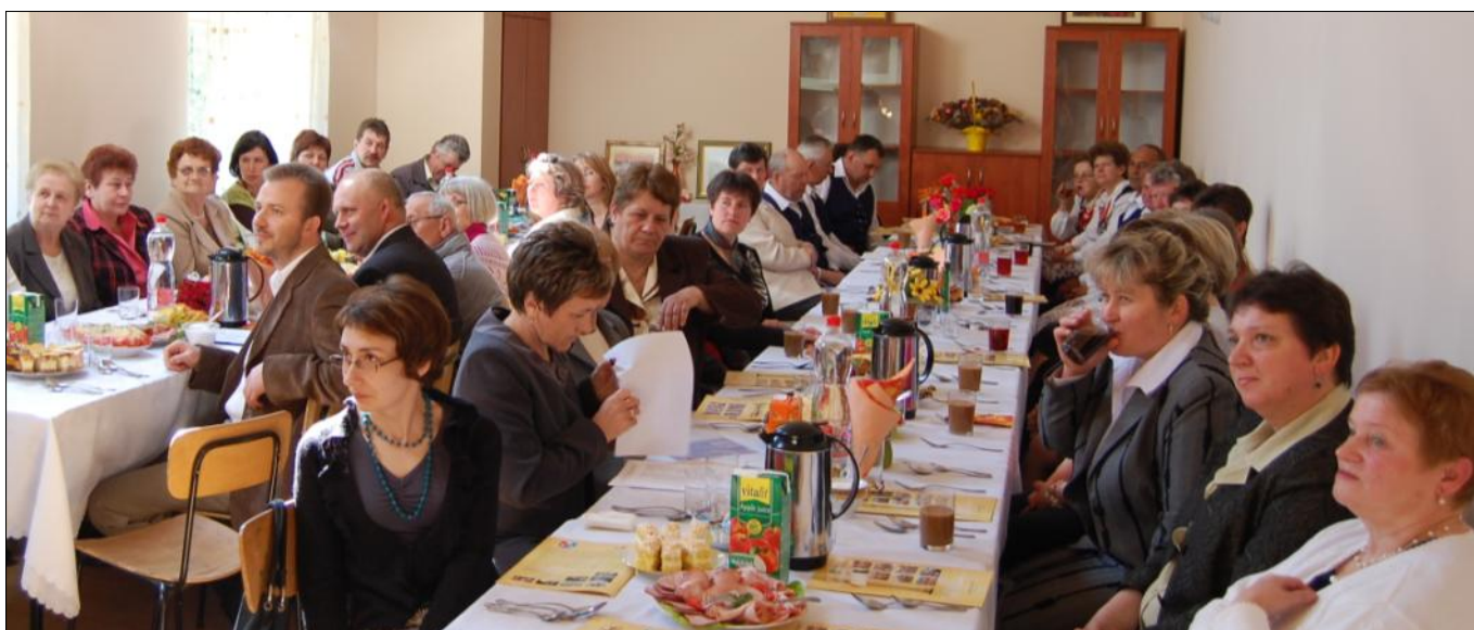
W spotkaniu podsumowującym uczestniczyły władze gminne, przedstawiciele OSP i panie z Kół Gospodyń Wiejskich. Gościnnie wystąpiła Leszczynka