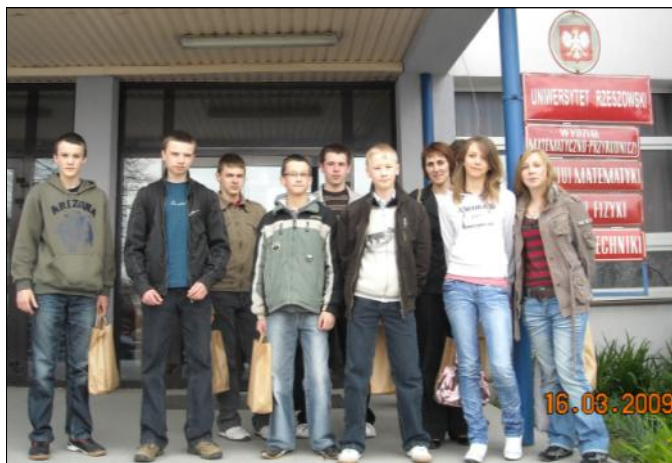
Z wizytą na uczelni

Gimnazjum im. prof. Franciszka Leji w Grodzisku Górnym zostało zakwalifikowane do trzyletniego projektu FENIKS. Kryteriami przyjęć były osiągnięcia uczniów, nauczyciela i szkoły w przedmiotach przyrodniczych.