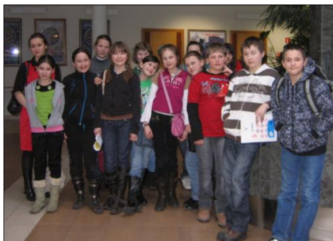
Jeszcze tylko pamiątkowe zdjęcie... i wracamy