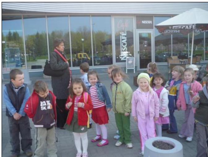
Przedszkolaki cieszyły się z wycieczki do kina

W środę 22 kwietnia br. dzieci z Przedszkola Samorządowego w Grodzisku Górnym wyjechały do kina „Helios” w Rzeszowie na bajkę pt. „Dzielny Despero”.