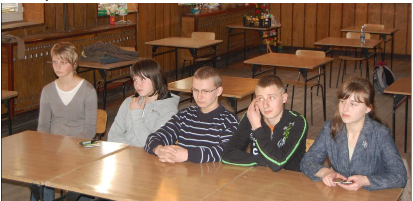
Uczniowie odpowiadali przed komisją na wybrane losowo pytania