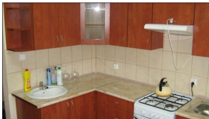
Urządzone zaplecze kuchenne