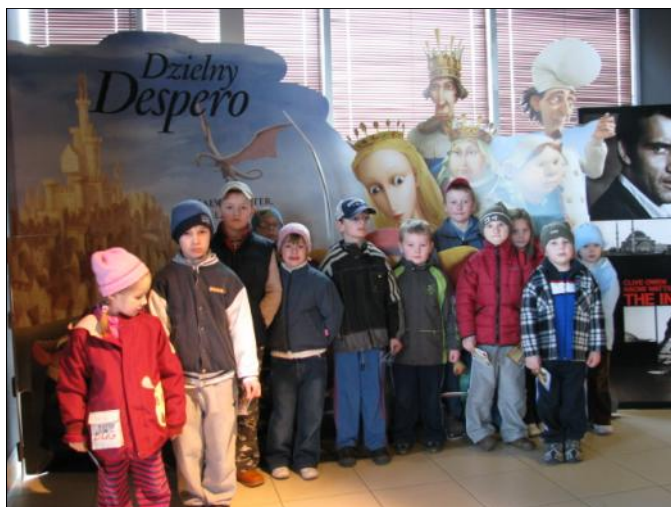
Mali kinomani z niecierpliwością czekali na swój seans

Na ten dzień zaplanowano wycieczkę do Rzeszowa. Była to trzecia z kolei w roku szkolnym 2008/2009 w jakiej udział wzięły dzieci 5-letnie i młodsze realizując projekt Zespołu Szkół im. Jana Pawła II pt. "Radosne przedszkole" w ramach Programu Operacyjnego Kapitał Ludzki, Priorytet IX, Działanie 9.1, Poddziałanie 9.1.1 - Zmniejszenie nierówności w stopniu upowszechniania edukacji przedszkolnej.