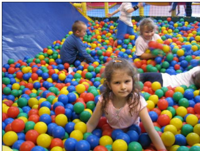
Szałeńcza zabawa w basenie z piłeczkami

uczyła całe królestwo, że liczy się to, jacy jesteście, a nie - jak wyglądamy.