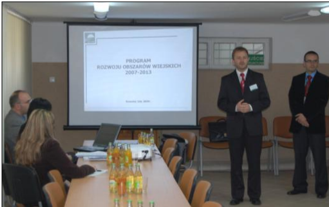
Spotkanie zorganizowano dzięki uprzejmości Wójta Gminy

W dniu 21 kwietnia 2009 roku o godz. 9.00 w sali narad Urzędu Gminy w Grodzisku Dolnym zostało przeprowadzone przez przedstawicieli Agencji Restrukturyzacji i Modernizacji Rolnictwa szkolenie z zakresu aplikowania o środki działania „Tworzenie i rozwój mikroprzedsiębiorstw” w ramach Programu Rozwoju Obszarów Wiejskich na lata 2007-2013.