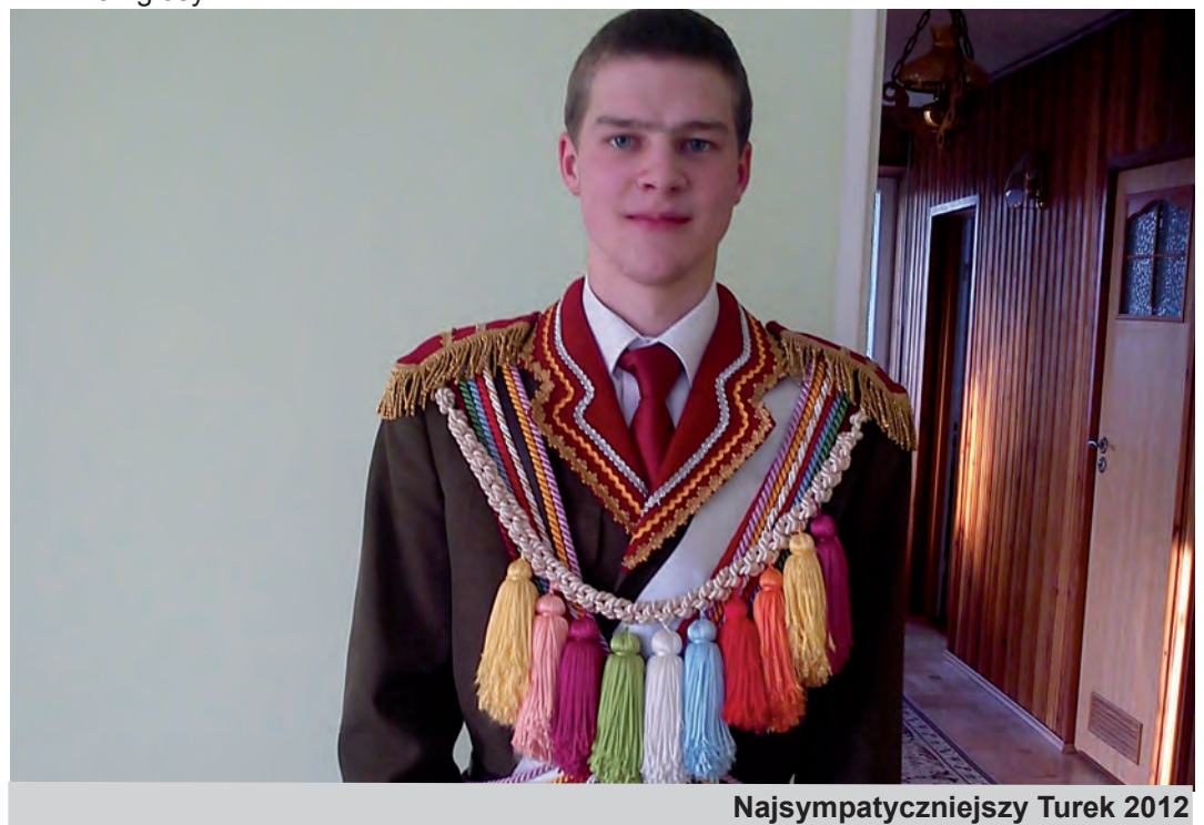
Najsympatyczniejszy Turek 2012

Również wśród głosujących w plebiscycie rozlosowane zostały nagrody. Pierwsza dziesiątka otrzymuje albumy, pozostali gminne gadżety (plecaki, kubki, pendrive). Po odbiór nagród zapraszamy do Urzędu Gminy Grodzisko Dolne, pokój nr 13. Patronat nad konkursem