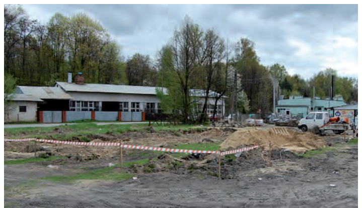
Na czas trwania remontu targowisko będzie funkcjonowało na parkingu obok biblioteki