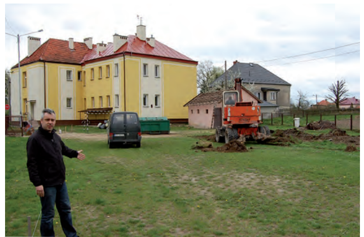
Przy szkole w Chodaczowie powstaje boisko