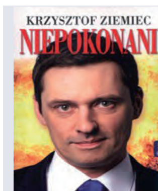
Ziemiec K. „Niepokonani”, Rafael 2013

nego ciała i duchem, obsesyjnie poświęconego pracy męża oraz jego wiecznie wtrącającej się matki. Na pomoc własnej mamy, zajętej planowaniem czwartego ślubu, nie ma co liczyć. Joy jest kobietą na skraju załamania nerwowego, lecz wierzy, że odrobina snu i czekolady z powodzeniem rozwiąże jej problemy... do chwili gdy w mieście zjawia się jej były chłopak. Ten sam, którego sekretnie kochała w dniu swojego ślubu. Joy była kiedyś ponętną i pewną siebie singielką. Kim jest teraz? Kiedy usiłuje to ustalić, jej mąż niespodziewanie znika.