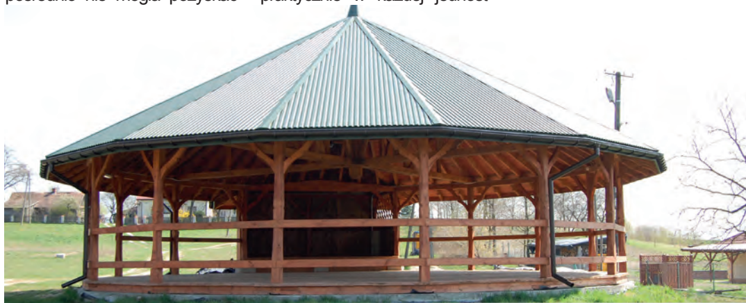
Nowa wiaty taneczna w Opaleniskach