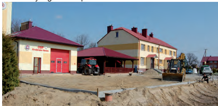
Prace na parkingu przed Remizą OSP w Grodzisku Nowym