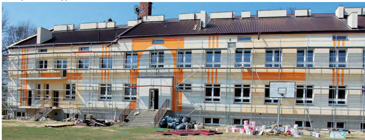
Nowa elewacja na Szkole Podstawowej w Zmysłówce