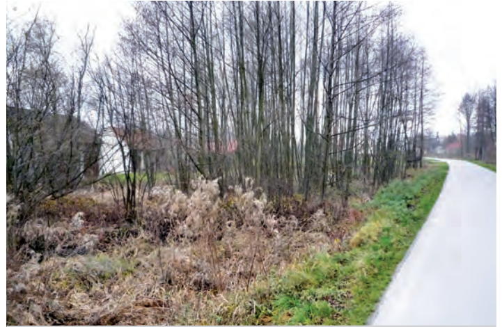
Działka oznaczona nr 866/11 o pow. 0.08 ha w Grodzisku Dolnym

II przetarg ustny nieograniczony odbędzie się w dniu 9 maja 2014 roku (piątek) o godz. 10.30 w Urzędzie Gminy Grodzisko Dolne (pokój nr 5).