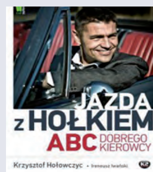
Hołowczyc K. „Jazda z Hołkiem. ABC dobrego kierowcy” G+J Gruner + Jahr 2013

Porcja przykładowych zestawów śniadaniowych czy obiadowych oraz praktycznych przepisów, sporządzonych przez doświadczonego dietetyka, pomoże nawet najbardziej zagubionemu rodzicowi mądrze karmić dzieci.