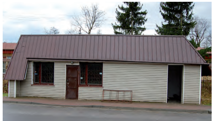
Budynek kiosko-przystanku w Wólce Grodziskiej

Podania na najem lokalu należy składać w Urzędzie Gminy Grodzisko Dolne (pokój nr 1). W przypadku gdy wpłynie więcej niż jedno podanie na w/w lokal zostanie przeprowadzony przetarg ustny nieograniczony na wynajem. Szczegółowe informacje dotyczące dzierżawy udzielane są w Urzędzie