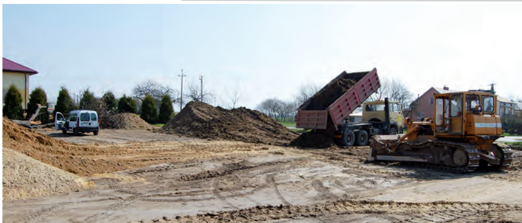
Przygotowywanie terenu pod budowę boiska sportowego w Grodzisku Nowym