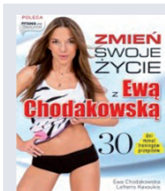
Chodakowska E. „Zmień swoje życie z Ewą Chodakowską”, K.E. LIBER 2013