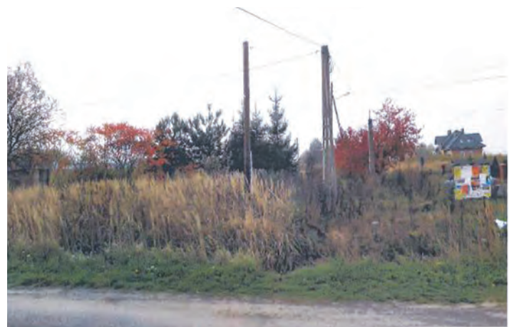
Działka oznaczona nr 1113 o pow. 0.1270 ha w Wólce Grodziskiej - Zagrodach

II przetarg ustny nieograniczony odbędzie się w dniu 9 maja 2014 roku (piątek) o godz. 10.00 w Urzędzie Gminy Grodzisko Dolne (pokój nr 5).