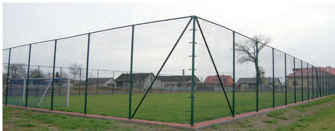
Boisko sportowe w Laszczynach