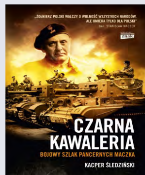
Kacper Śledziński „Czarna kawaleria. Bojowy szlak pancernych Maczka”, Znak 2014

13 kategorii filmowych, w każdej 13 dyskusji na temat 13 najważniejszych, najlepszych, tudzież najbardziej kontrowersyjnych obrazów w danej kategorii, czyli jak szybko, efektywnie i efektownie podjąć dyskusję na temat filmu.