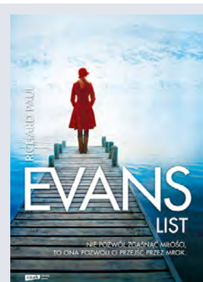
Richard Paul Evans „List”, Znak 2014

ty luksusowe? Czy można wpływać na konsumentów poza ich świadomością? Kto i kiedy kupuje pod wpływem impulsu? Na te i wiele innych pytań odpowiadają autorki tej książki. Wskazują, skąd można czerpać wiedzę o zachowaniach konsumentów, a następnie określają znaczenie podstawowych procesów poznawczych, emocjonalnych i motywacyjnych w podejmowaniu przez nich decyzji. Wnioski auterek poparte są wynikami badań naukowych oraz zilustrowane przykładami zastosowania wiedzy psychologicznej w działaniach marketingowych.