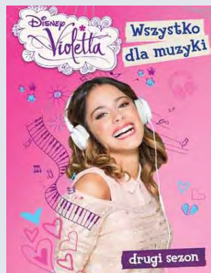
Wszystko dla muzyki (Seria Violetta), Egmont 2014