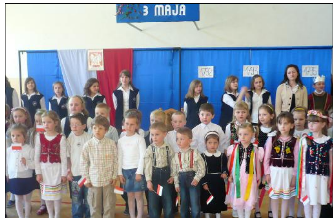
Przedszkolaki podczas akademii

Nagrodzone gromkimi brawami dzieci, zadowolone i dumne z udanego występu, wychodziły z sali machając wykonanymi przez siebie flagami.