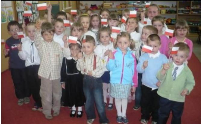
Nasi mali patrioci

W dniu 30.04.2008r. w Zespole Szkół w Grodzisku Górnym została zorganizowana uroczystość „Przedszkolaki z Biało-Czerwoną” z okazji „Święta flagi” obchodzonego 2 maja.