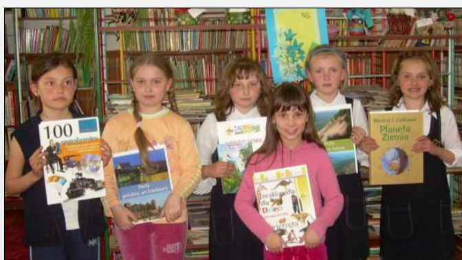
Laureatki konkursu plastycznego

Celem konkursu było wzbogacenie wyobraźni dzieci i zapoznanie z techniką plastyczną (kredka, farba). W konkursie wzięli udział uczniowie ze szkół podstawowych z klas I-III. Zainteresowanie było duże o czym świadczy liczba otrzymanych prac, których wpłynęło 97. Dominującym motywem były ilustracje z bajek które dzieci czytają najchętniej. Wśród nich znalazł się m.in. Kubuś Puchatek, Koziołek Matolek i Cztorej Pancerni.