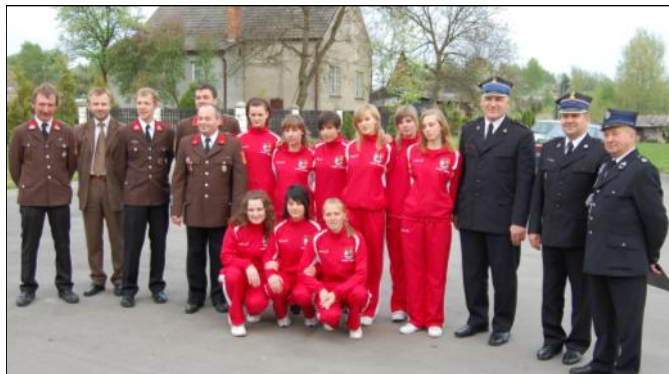
Pamiątkowe zdjęcie z zaproszonymi gośćmi

W dniu 2 maja 2008 roku jednostka Ochotniczej Straży Pożarnej z Grodziska Dolnego, gościła pięcioosobową delegację strażaków z miejscowości Krems (Austria).