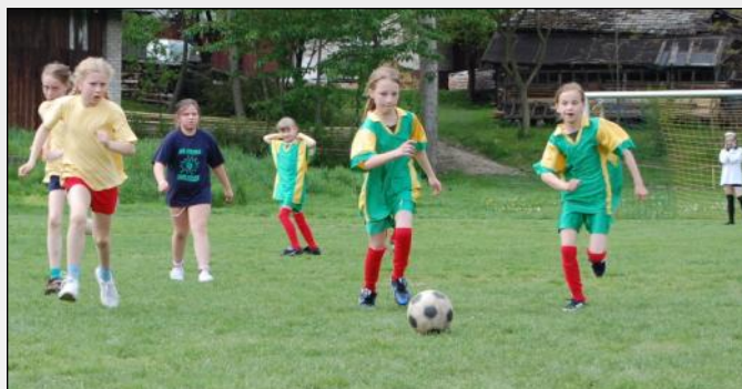
Zawodniczki w ataku

Najwięcej emocji wzbudziły jak zawsze mecze o miejsca na podium. Wśród dziewcząt prym wiodła drużyna z Laszczyn, która nie oddała zwycięstwa z roku ubiegłego i ponownie zajęła miejsce pierwsze. Na drugim uplasowały się zawodniczki z Grodziska Dolnego, na trzecim z Wól-