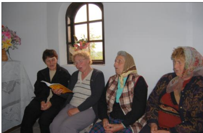
Pieśni ku czci Matki Bożej śpiewane w Kapliczce Zagumiennej

Mieszkańcy naszej gminy nadal żywo kultywują zwyczaj wieczornych modlitw pod kapliczkami. Od pierwszego do ostatniego maja, codziennie