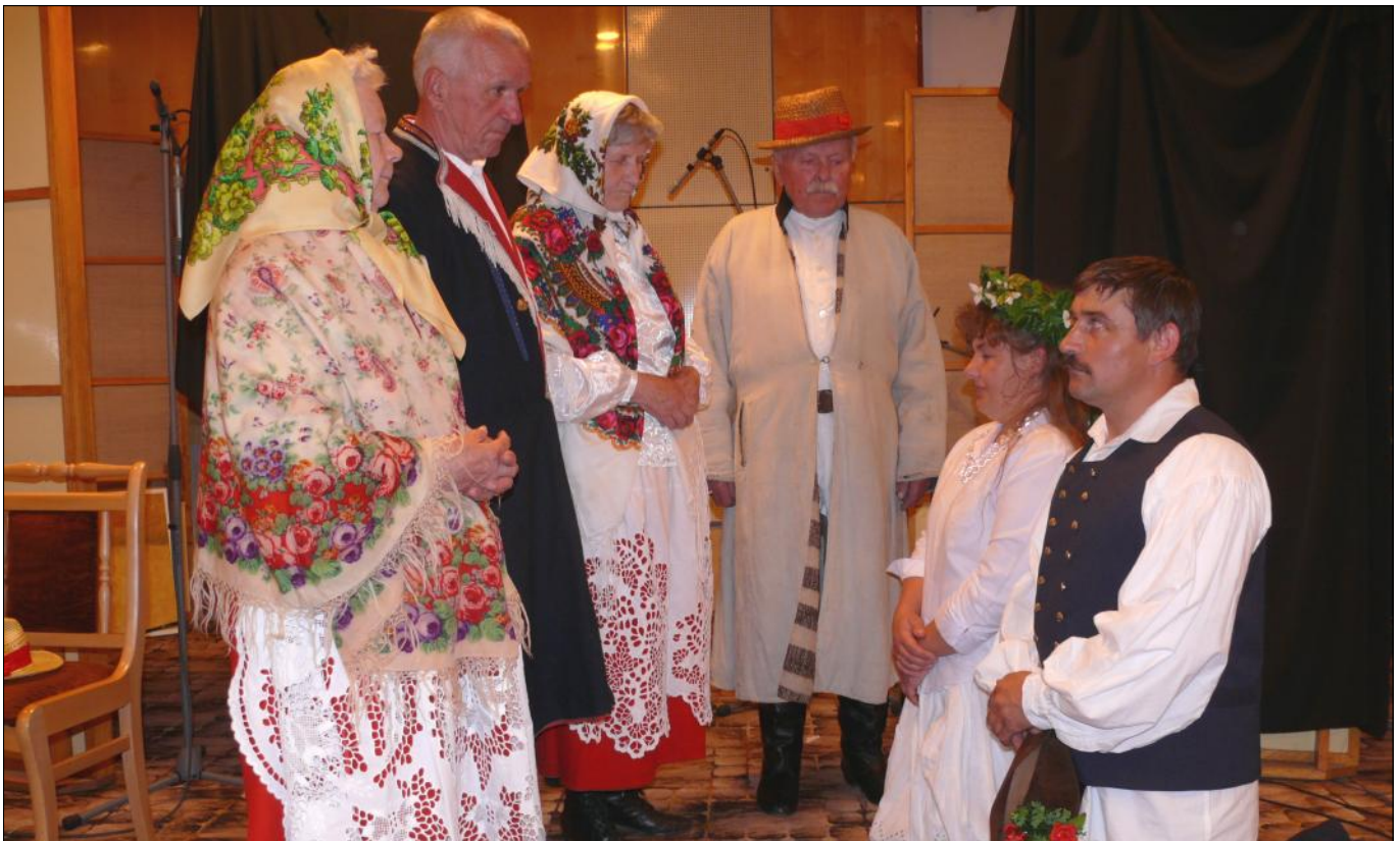
„Wesele Grodziskie” - rodzice udzielają młodej parze błogosławieństwa