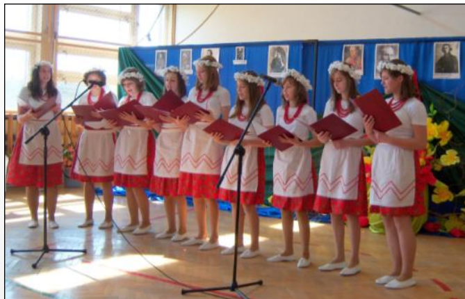
Gościnnie wystąpił zespół „CDN” z Dąbrowicy

W trzeciej edycji konkursu krasomówczego udział wzięli uczniowie z Nowego Kamienia,