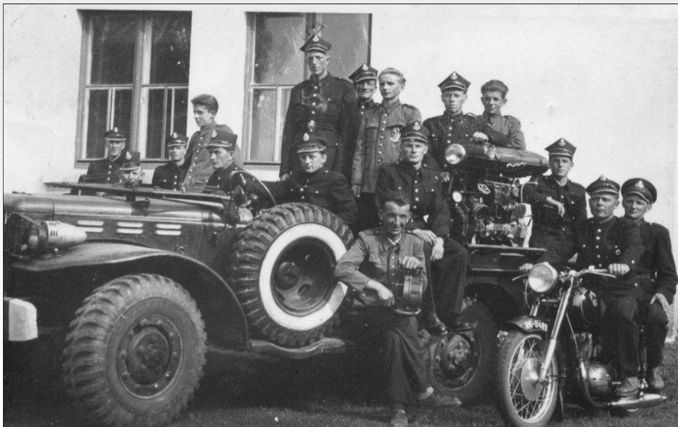
rok 1975