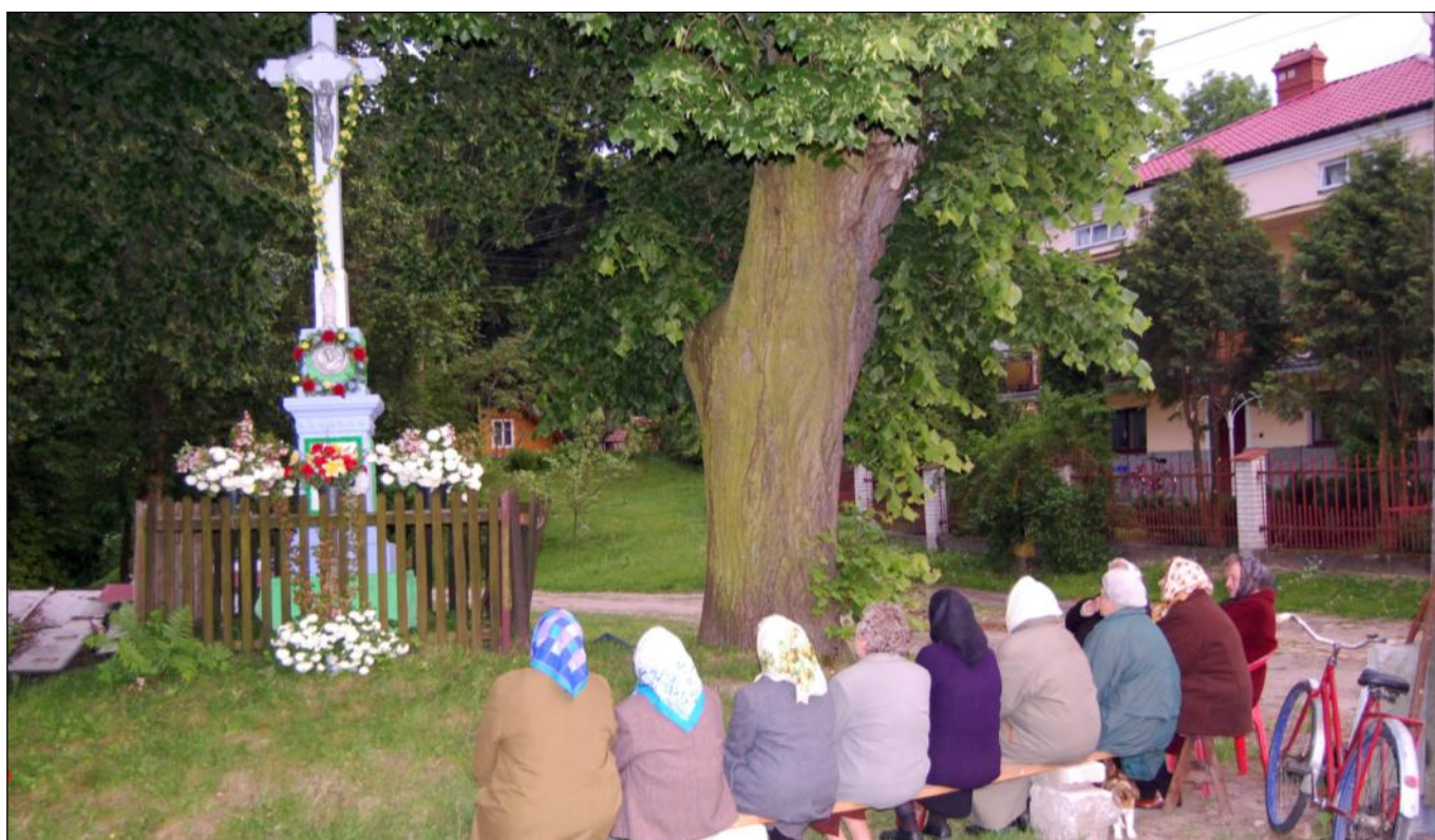
Wieczorne śpiewy pod krzyżem koło Orendy, w kierunku na Zmysłówkę