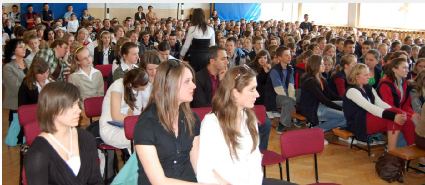
Zgromadzonych na sali swoim śpiewem oczarowały licealistki z Jarosławia