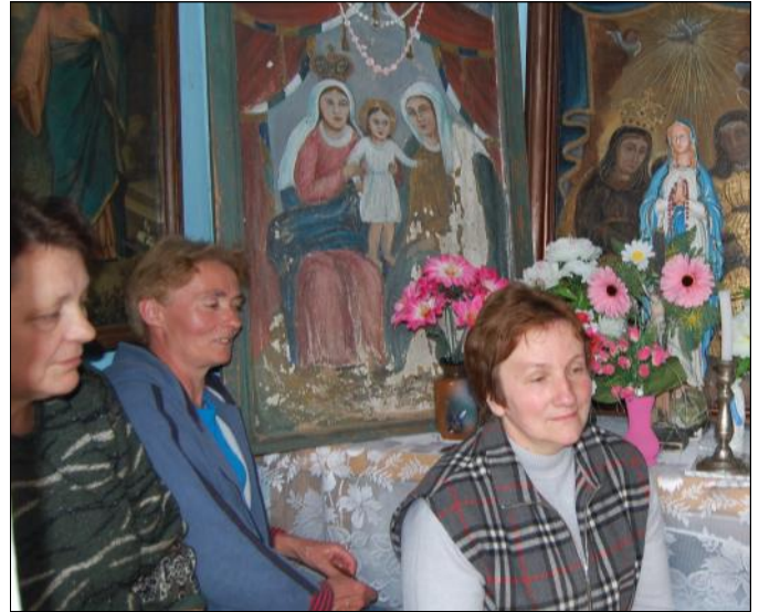
Majówka odprawiana wewnątrz Czerwonej Kapliczki

Kapliczek na terenie gminy jest wiele. Są na szczęście zadbane i otoczone troskliwą opieką. Współczesny katolik, pochłonięty codziennością życia, nie zawsze znajduje czas, by brać udział w tej modlitwie. Okazując kapliczkom szacunek, złożmy czasem kwiaty polne, przechodząc pochyl-