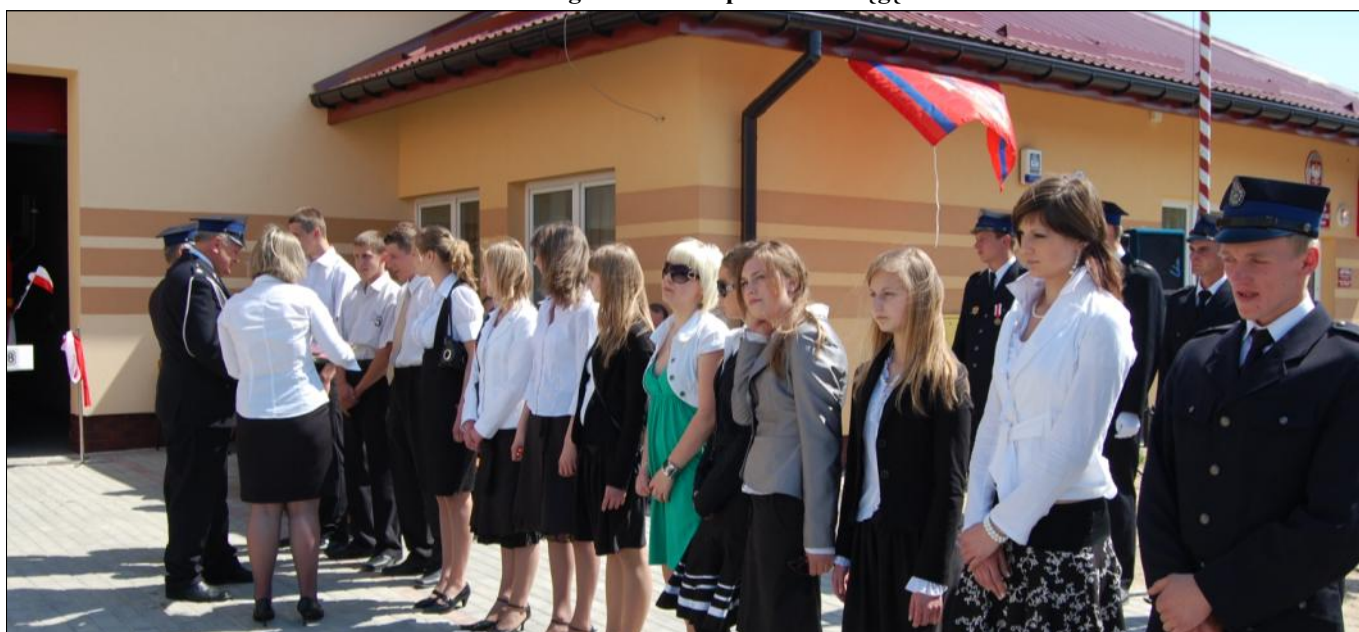
Specjalne odznaczenia otrzymali zawodnicy startujący w zawodach pożarniczych