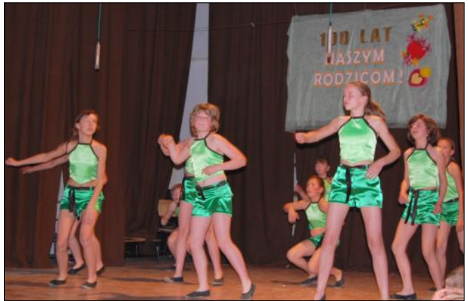
„Smerfetki” w układzie tanecznym

czenie uroczystości wszyscy wykonawcy wręczyli swoim rodzicom drobne upominki.