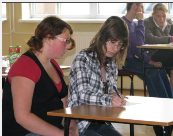
Młodzież miała okazję wykazać się znajomością encykliki Jana Pawła II