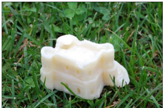
Zamek z mydła autorstwa Dągmary Majkut

Na konkurs napłynęły prace z Zespołów Szkół z Grodziska Dolnego i Górnego oraz ze Społecznej Szkoły Podstawowej w Wólce Grodziskiej. Jury po obejrzeniu ponad 30 prac plastycznych i przeczyta-