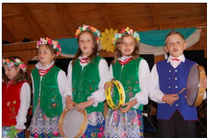
Program artystyczny w wykonaniu uczniów szkoły

Atrakcyjne loterie fantowe, gry i zabawy dla dzieci oraz liczne występy artystyczne, a na koniec dnia wieczorny festyn. Tak mieszkańcy Wólki świętowali na tegorocznym pikniku nad basenem w Wólce Grodzkiej.