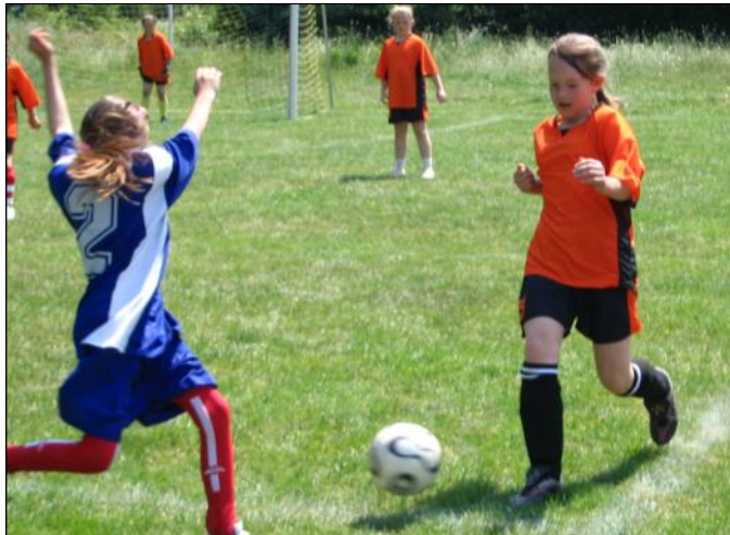
Eliminacje gminne - mecz dziewcząt

W dniach 22 i 25 maja br. na stadionie sportowym LKS „Grodziszczanka” w Grodzisku Górnym odbyły się Eliminacje Rejonowe Turnieju Piłki Nożnej Dziewcząt i Chłopców „Z podwórka na stadion”.