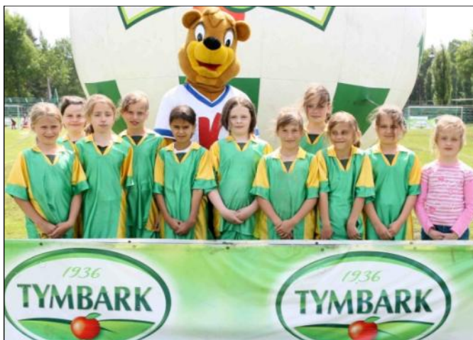
Drużyna dziewcząt z Laszczyn