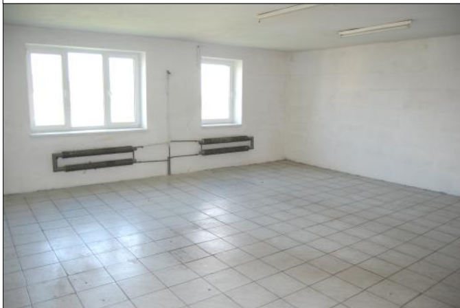
Lokal o powierzchni 50m 2