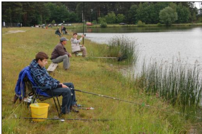
W oczekiwaniu na udane połowy

W niedzielne przedpołudnie, 31 maja nad Zalewem Czyste w Grodzisku Dolnym 33 uczniów szkół podstawowych i gimnazjów, wystartowało w zorganizowanych przez koło wędkarskie nr 37 „Pstrąg” w Grodzisku Dolnym zawodach wędkarskich z okazji „Dnia Dziecka”.