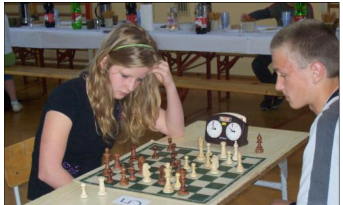
Cisza i skupienie towarzyszyły zawodnikom podczas partii