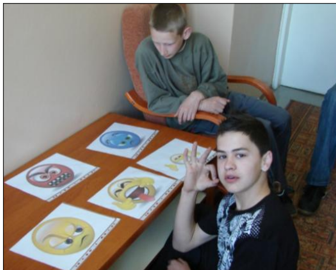
Rozpoznajemy i nazywamy uczucia towarzyszące nam w sytuacji konfliktu

Były to zajęcia mające na celu rozwijanie różnorodnych umiejętności niezbędnych do funkcjonowania młodego człowieka w grupie rówieśniczej i społeczeństwie. W trakcie 52 godzin zajęć uczniowie zdobywali wiedzę i praktyczne umiejętności z zakresu komunikacji i umiejętności interpersonalnych. Poznawali swoje mocne i słabe strony, analizowali cechy swojego charakteru i poszukiwali związków między temperamentem a stylem zachowania. Uczyli się jak radzić sobie z własnymi emocjami i rozwiązywać konflikty rówieśnicze z zastosowaniem metod pozbawionych agresji, a także poszukiwali sposobów rozwiązywania problemów wieku dorastania. Ponadto pracowali nad kształtowaniem postaw tolerancyjnych, poczucia odpowiedzialności za podejmowane decyzje i dokonywane wybory. Analizowali cechy wybieranych przez siebie autorytetów oraz dyskutowali na temat preferowanych wartości. Na zajęciach wykorzystywano m.in. zabawy dydaktyczne, plakaty i prezentacje, a także komputerowe programy multimedialne do nauki komunikacji i asertywności oraz filmy edukacyjne zakupione w ramach projektu. Dzięki udziałowi w warsztatach uczestnicy mieli możliwość rozwijania umiejętności interpersonalnych oraz kształtowania swoich postaw