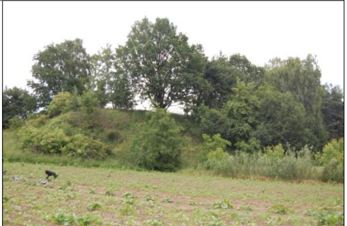
Działka na tzw. Wale w Grodzisku Dolnym

Działka o powierzchni o pow. 0.1014 ha, niezabudowana. Teren o bardzo dużym spadku w kształcie prostokąta, bez dojazdu. Obecnie jest nieużytkowana, porośnięta trawami, drobną samosiejką i drzewami (sosna, dąb, brzoza). Zgodnie ze Studium uwarunkowań i kierunków zagospodarowania przestrzennego gminy Grodzisko Dolne przedmiotowa działka położona jest na obszarach zabudowy o korzystnych warunkach klimatycznych dla osadnictwa. Działka ma urządzoną księgę wieczystą nr 21 080 w Sądzie Rejonowym w Leżajsku.