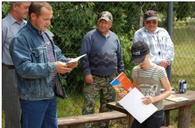
Wszyscy uczestnicy otrzymali pamiątkowe nagrody