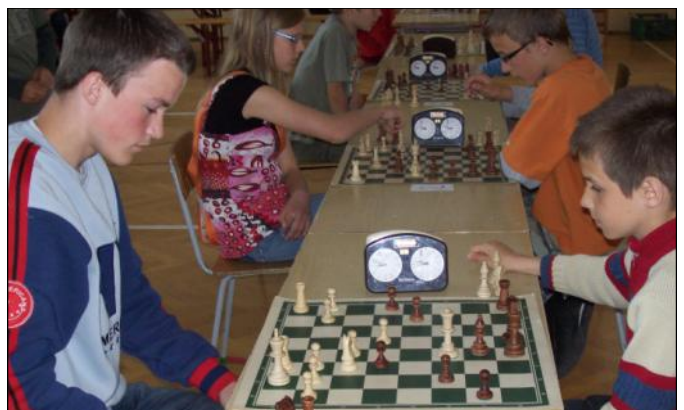
Każdy ruch był na wagę zwycięstwa