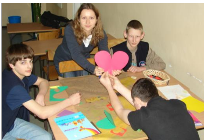
Uczymy się wyrażać nasze uczucia i emocje

i zachowania pod czujnym okiem psychologa.