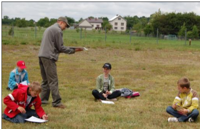
Konkurs wiedzy ekologicznej