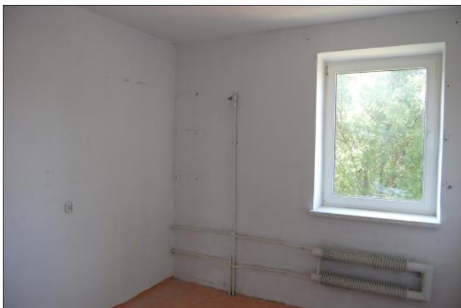
Lokal o powierzchni 11m 2

Lokal wyposażony jest w przyłącz energii elektrycznej i gazu. Ogrzewanie lokalu we własnym zakresie. Nakłady poniesione przy przystosowaniu lokalu do działalności obciążają najemcę. W przypadku modernizacji całego budynku wiejskiego przez wynajmującego, najemca musi przerwać działalność w lokalu i przekazać go wynajmującemu na czas trwania modernizacji bez żadnych roszczeń.