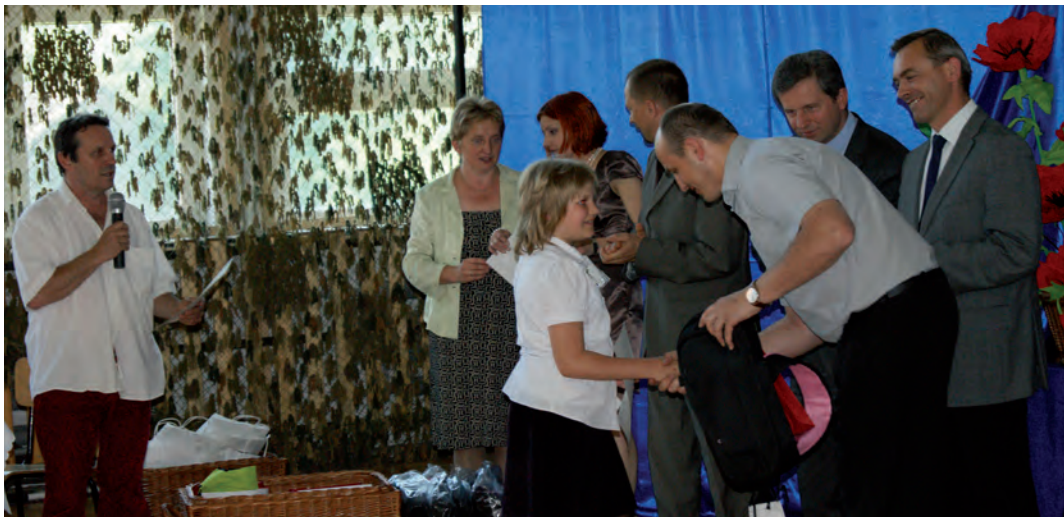
W tegorocznej edycji konkursu, zaprezentowało się 25 uczestników

Ten konkurs nie mógłby się odbyć, gdyby nie instytucje i firmy, które ufundowały nagrody i przyczyniły się do profesjonalnej organizacji tej inicjatywy. Zaliczmy do nich: