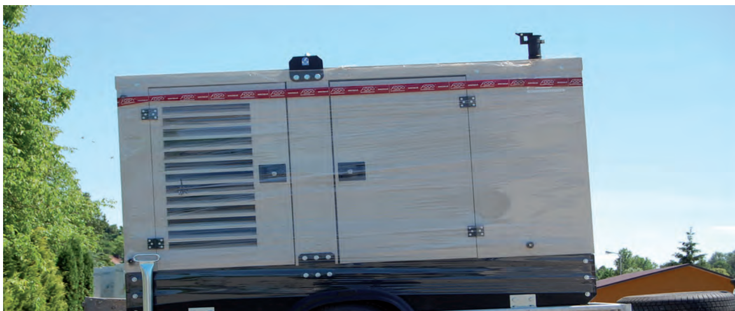
Nowy agregat prądowłóczy, jaki trafił do jednostki OSP Grodzisko Dolne