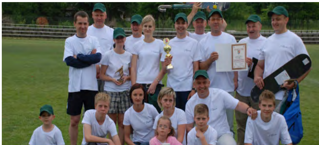
Reprezentacja Gminy Grodzisko Dolne - zdobywcy 3 miejsca

Zwycięzcy kolejnych konkurencji otrzymali okolicznościowe nagrody, a za poszczególne miejsca w ogólnej klasyfikacji Turnieju, reprezentacje samorządów otrzymały puchary, dyplomy i nagrody rzeczowe. MH