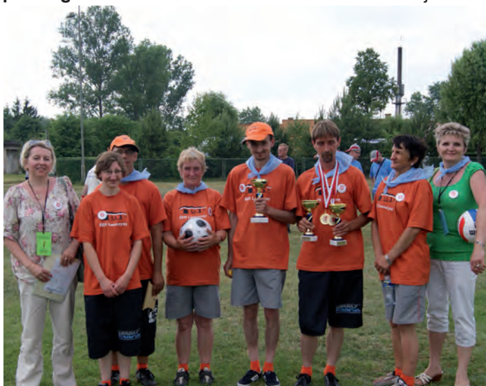
Reprezentacja ŚDS w Laszczynach wraz z opiekunami