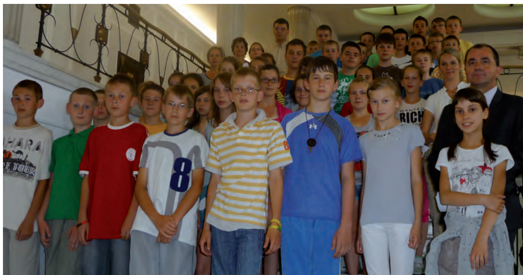
Na sejmowych schodach

Następnie z przewodnikiem uczniowie zwiedzili Stare Miasto, gdzie mogli pospacerować po ulicach znanych