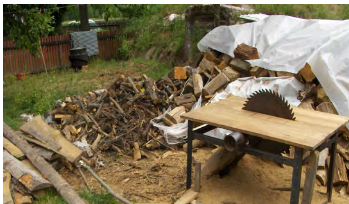
Pilarka tarczowa bez zabezpieczeń

Natomiast osoby nie podlegające ubezpieczeniu społecznemu rolników nie mają prawa do odszkodowania, dlatego też nie zgłaszają zaistniałych wypadków. Aby wszcząć postępowanie dowodowe mające na celu ustalenie okoliczności i przyczyny wypadku, zdarzenie należy możliwie jak najszybciej zgłosić do KRUS. Zbędna zwłoka w zgłoszeniu wypadku może mieć wpływ na ustalenie okoliczności i przyczyn wypadku, a tym samym powodować utratę prawa do jednorazowego odszkodowania. Zgłoszenia może dokonać każda osoba, która wie o zaistnieniu wypadku i można to uczynić osobiście, telefonicznie, listownie czy pocztą elektroniczną. Przy zaistnieniu wypadku w miarę możliwości należy zabezpieczyć miejsce i przedmioty związane z wypadkiem do