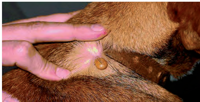
Kleszcze atakują nie tylko ludzi, ale i zwierzęta

Choroba występuje w dwóch fazach: faza utajona trwająca od 1 do 20 dni oraz faza