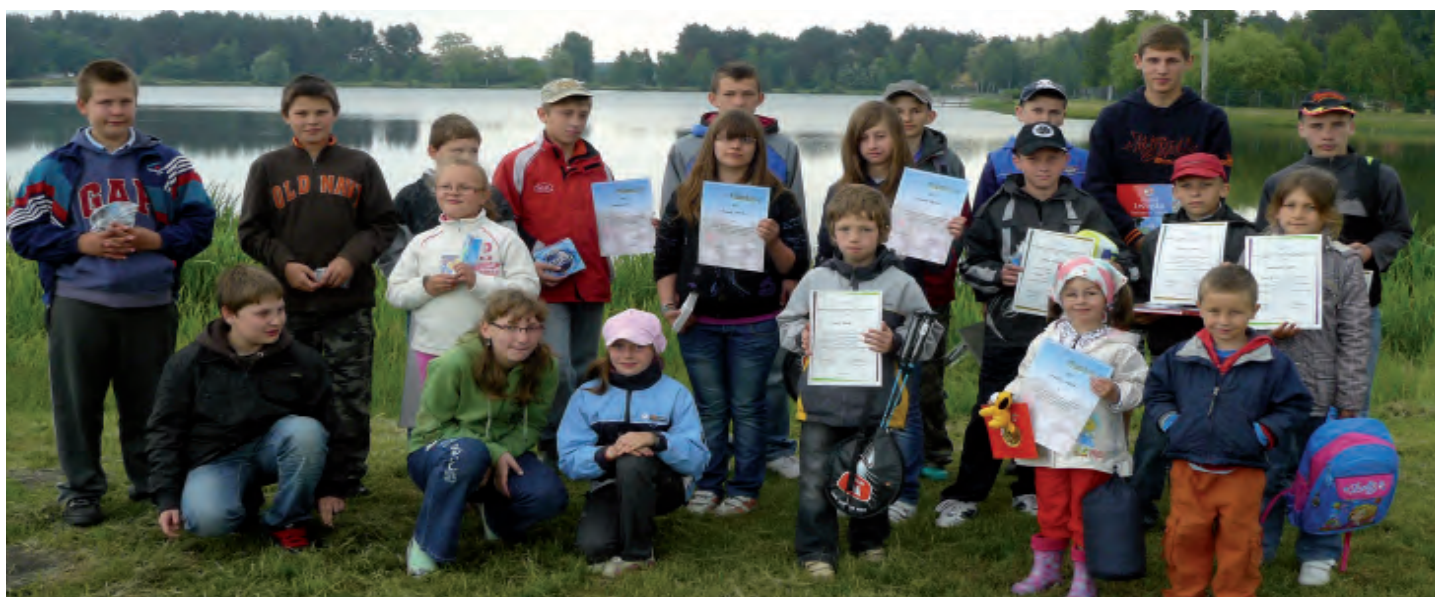
Zwycięzcy otrzymali nagrody rzeczowe i dyplomy, a pozostali nagrody pocieszenia