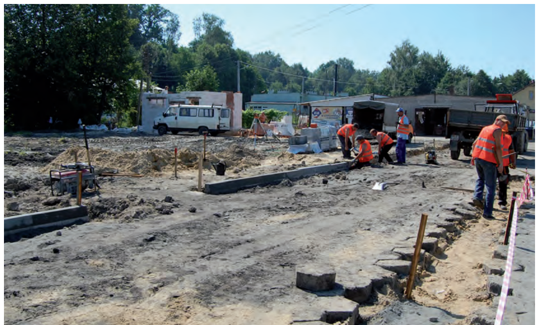
Na gminnym targowisku powstanie 56 stoisk handlowych