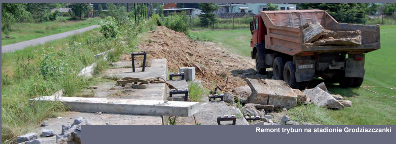
Remont trybun na stadionie Grodziszczanki