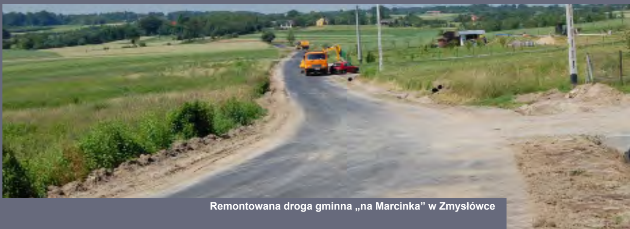
Remontowana droga gminna „na Marcinka” w Zmysłówce