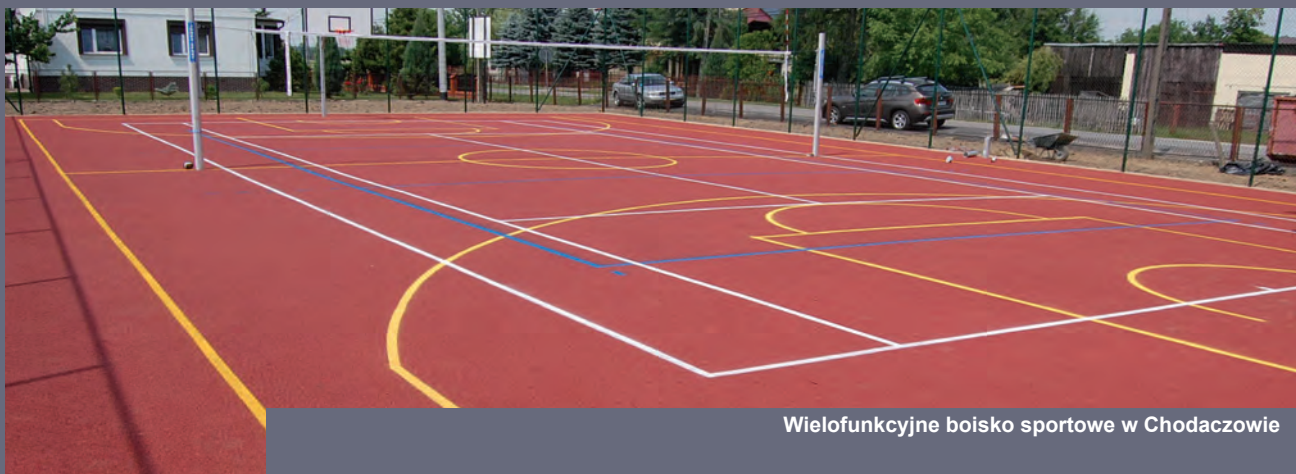
Wielofunkcyjne boisko sportowe w Chodaczowie