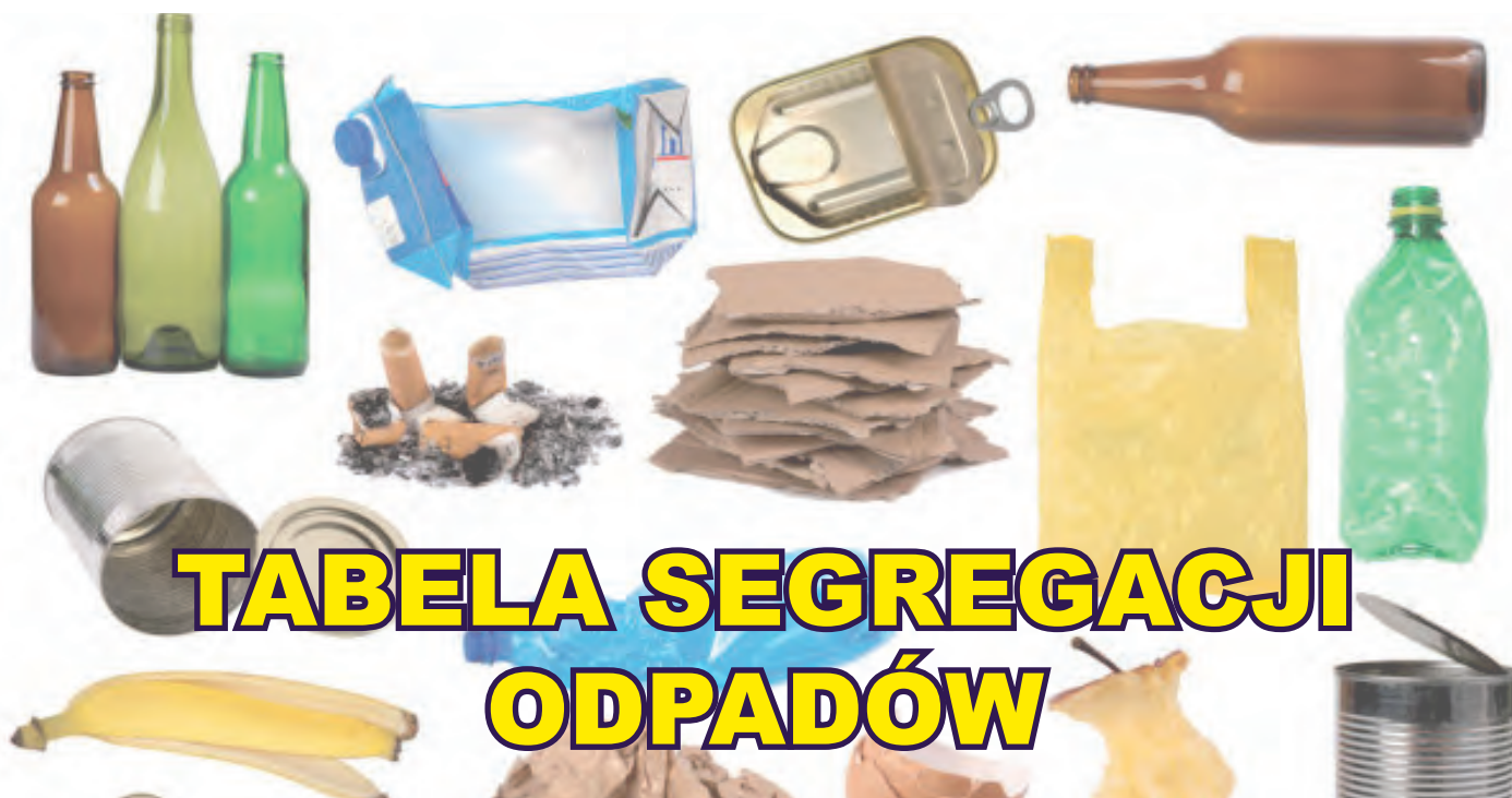
TABELA SEGREGACJI ODPADÓW