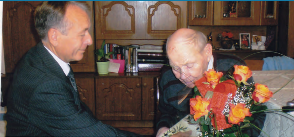
Życzenia urodzinowe - 17 października 2012r.