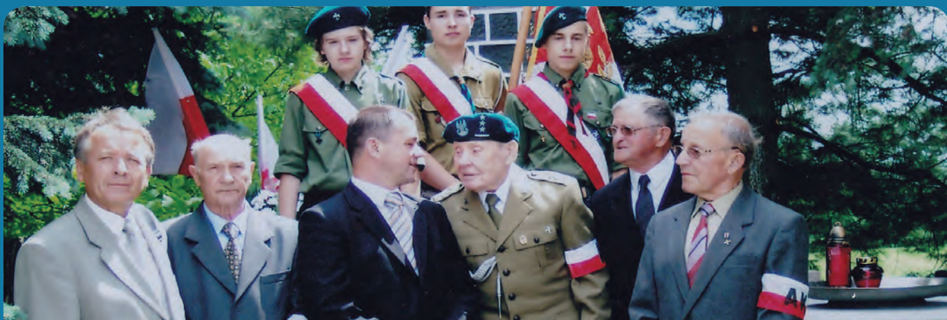
Udział w uroczystościach walk w Kuryłówce (pomnik na Kalówkach) - czerwiec 2008r.