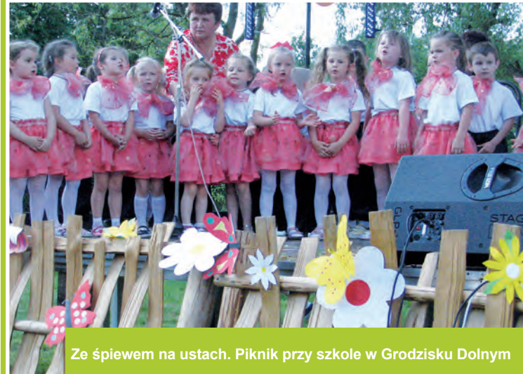
Ze śpiewem na ustach. Piknik przy szkole w Grodzisku Dolnym