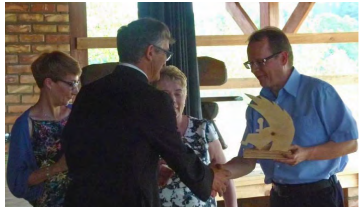
Wspierającym działalność laszczyńskiego ORW wręczono statuetki