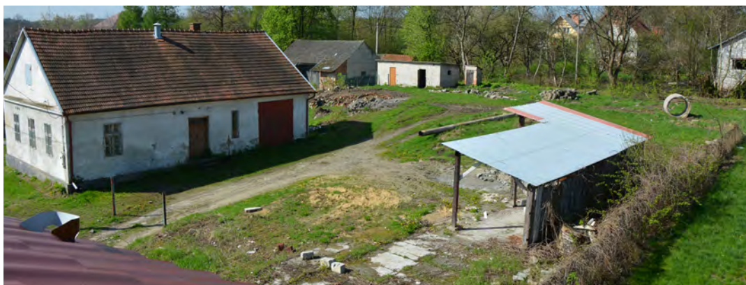
Prace rozbiórkowe na placu za Ośrodkiem Kultury