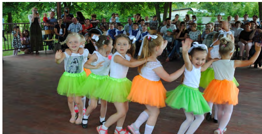
To już kolejny piknik, w którym udział wzięły grupy taneczne z Ośrodka Kultury

zentowały dzieci ze Szkoły Podstawowej w Chodaczkowie.