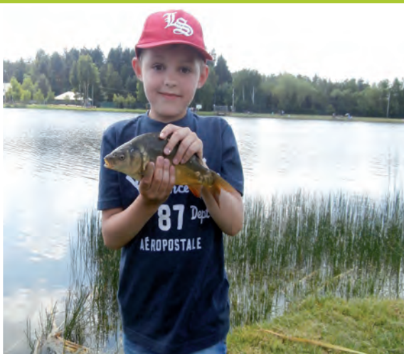
Woda, wędka, rybka. Dzień Dziecka nad „Czystym”