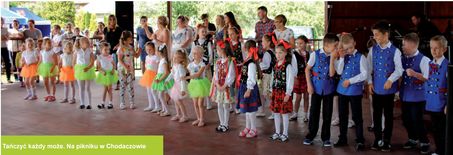
Tańczyć każdy może. Na pikniku w Chodaczowie

CHODACZÓW · GRODZISKO GÓRNE · GRODZISKO DOLNE · GRODZISKO NOWE LASZCZYNY · OPALENISKA · PODLESIE · WÓLKA GRODZISKA · ZMYŚLÓWKA