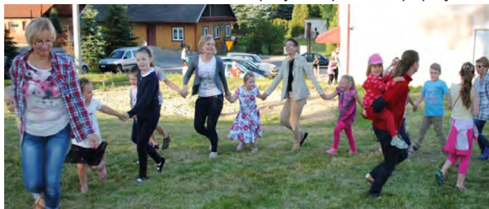
Czas spędzony razem jest bezcenny