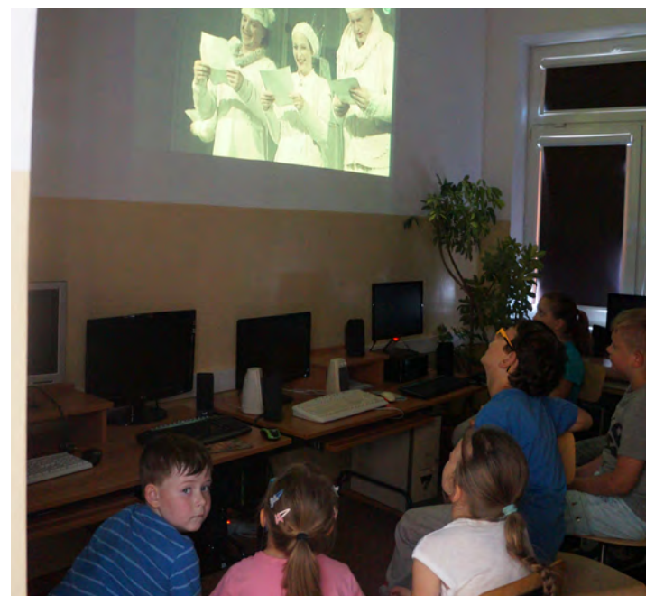
Czym skorupka za młodu nasiąknie...