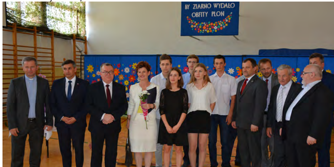
Jeszcze pamiątkowa fotka z drużyną robotyki wyjeżdżającą w dniach 6-10 lipca br. na turniej robotyki do USA

Po części oficjalnej delegacje udały się pod Krzyż Grunwaldu, gdzie złożono wiązanki kwiatów.