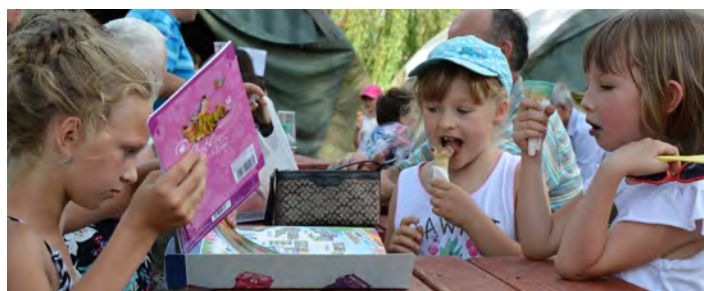
Najmłodszy chłodził się lodami