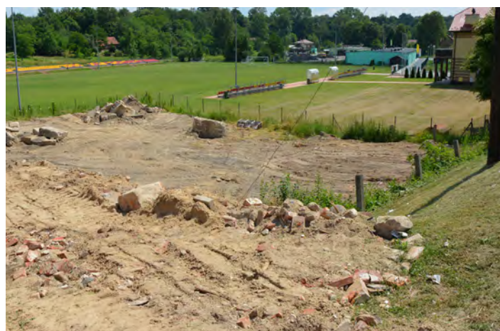
Porządkowana działka przy stadionie w Grodzisku Górnym

W tym samym czasie prowadzone są roboty rozbiórkowe na działce usytuowanej w bezpośrednim sąsiedztwie stadionu w Grodzisku Górnym. Zakupiony przez gminę plac zaadaptowany zostanie na potrzeby stadionu. MH