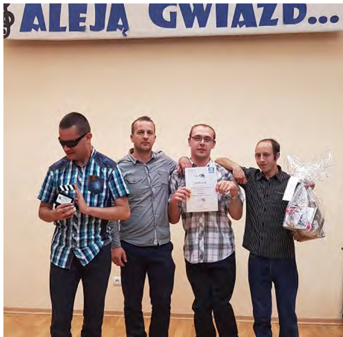
Za realizację teledysku grupa otrzymała wyróżnienie

Tym razem z grupą uczestników realizujących teledysk z