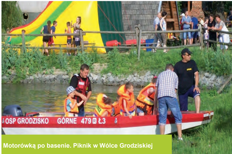
Motorówką po basenie. Piknik w Wólce Grodziskiej