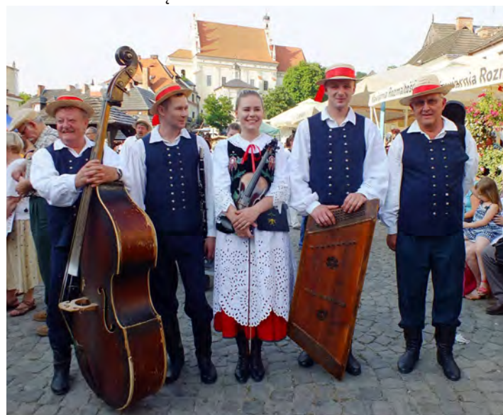
III miejsce w Polsce to ogromny sukces dla grodziskiej Kapeli