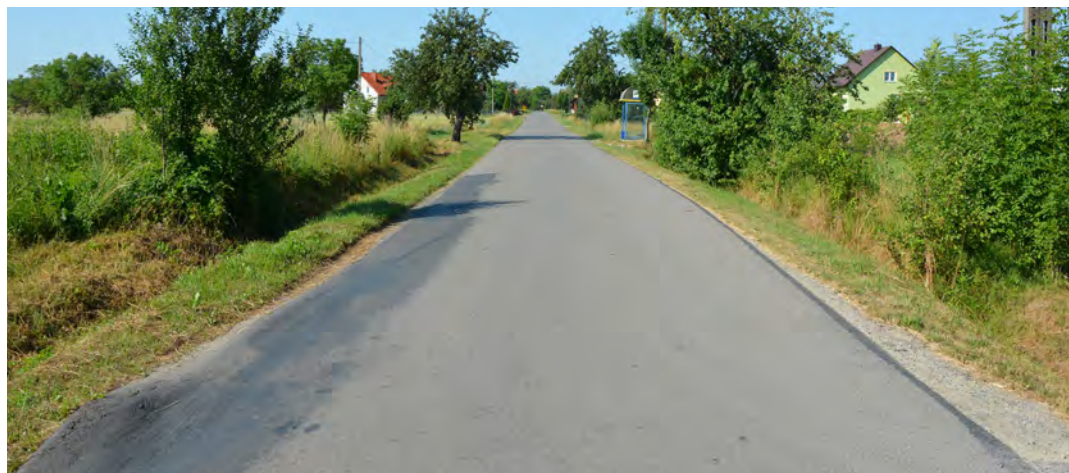
W Chodaczowie na odcinku od drogi Skośnej do cmentarza wybudowany zostanie chodnik

rza, natomiast sama jezdnia zostanie przebudowana od Szkoły Podstawowej w Chodaczowie do „ronda” w Laszczynach. Wartość projektu według podpisanej w dniu 27 czerwca 2016r. umowy wynosi ponad 3 mln 226 tys. zł., w tym dofinansowanie z PROW - 2 mln 052 tys. zł. Wkład własny pokryje Gmina Grodzisko Dolne w kwocie ponad 785