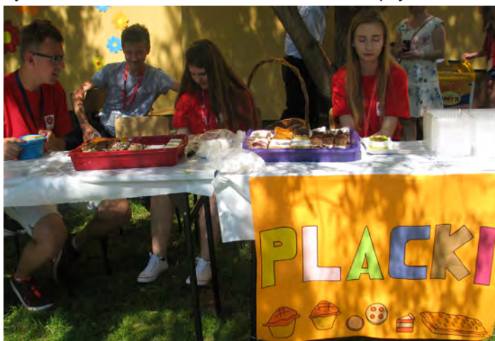
Na łakomczuchów czekało słodkie ciasto