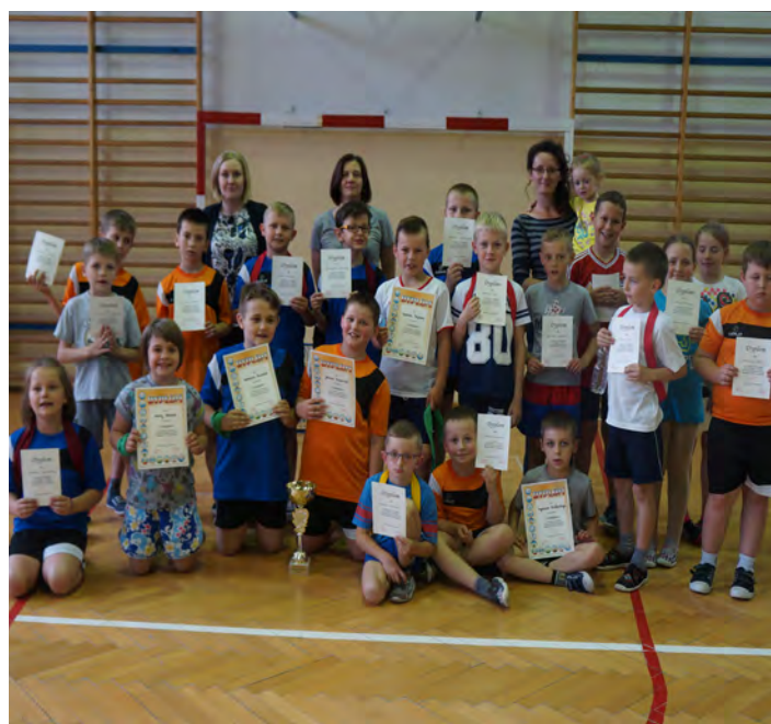
Rozgrywkom towarzyszyły wielkie emocje