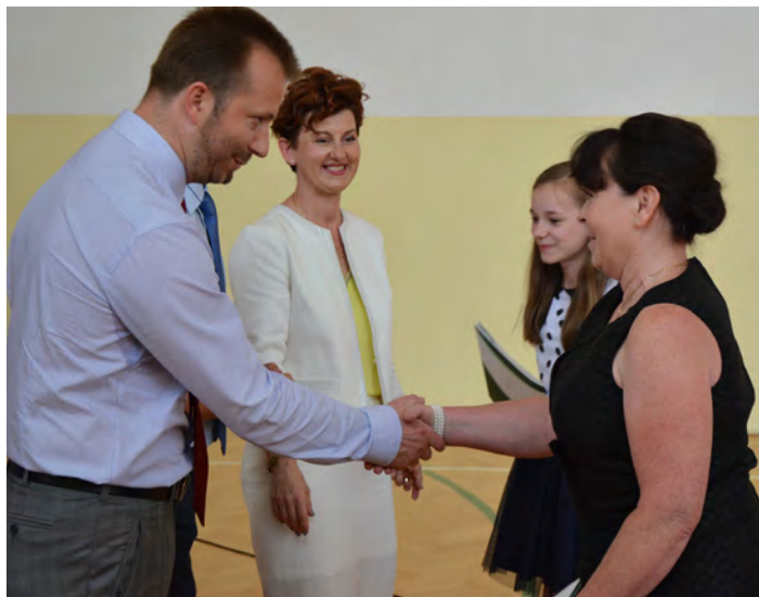
Najzdolniejsi uczniowie otrzymali nagrody wójta

W wojewódzkim zakończeniu roku szkolnego uczestniczyło wielu znamienitych gości m.in. wicewojewoda podkar-