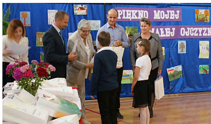
W konkursie wystartowało 27 uczniów