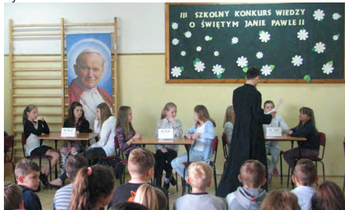
Co roku młodzież wykazuje się znajomością życia i twórczości Jana Pawła II