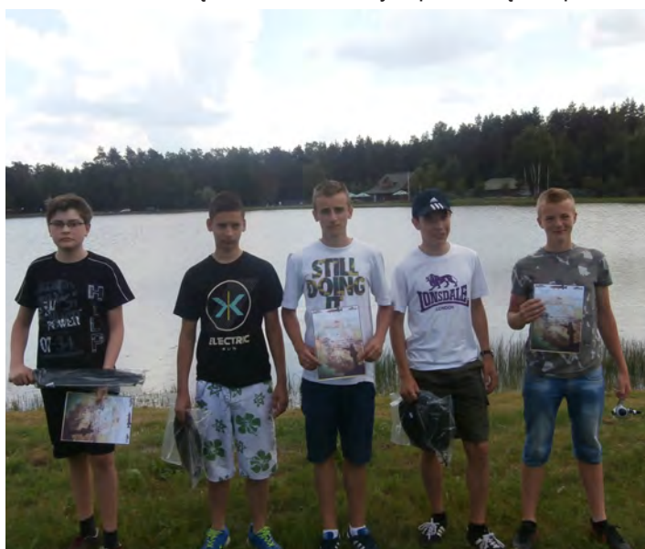
Po połowach na młodzież czekały konkursy ekologiczne z nagrodami