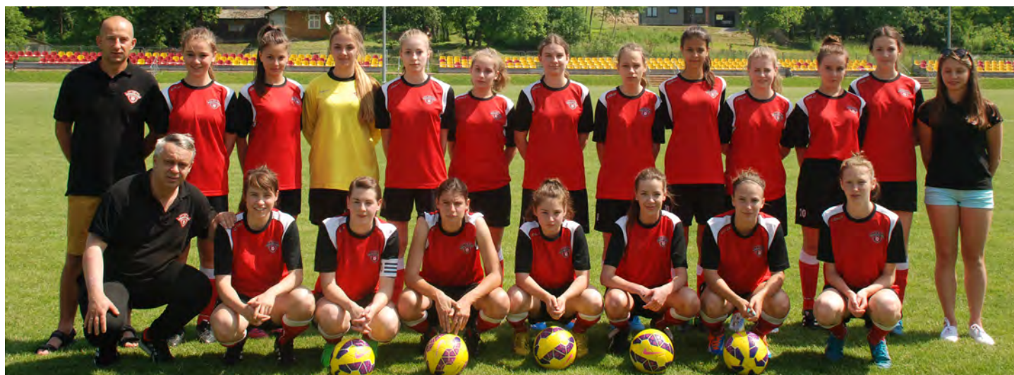
I kto powiedział, że w piłkę potrafią grać tylko mężczyźni