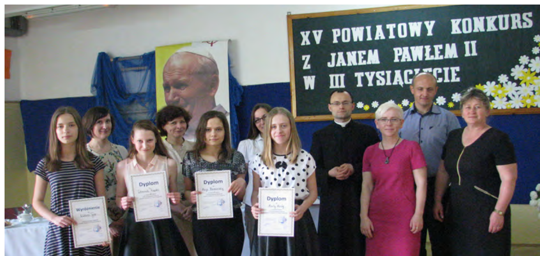
Taki patron naprawdę zobowiązuje