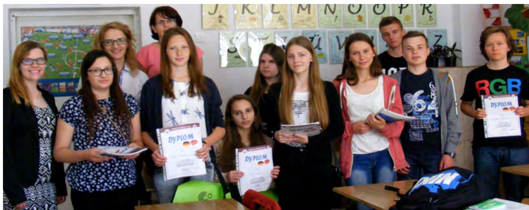
Młodzież doskonale wie, że języki obce to ich przyszłość