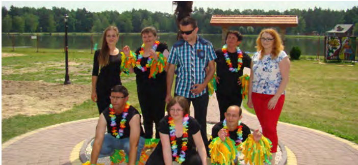
Kolorowa grupa z ŚDS Laszczyzny