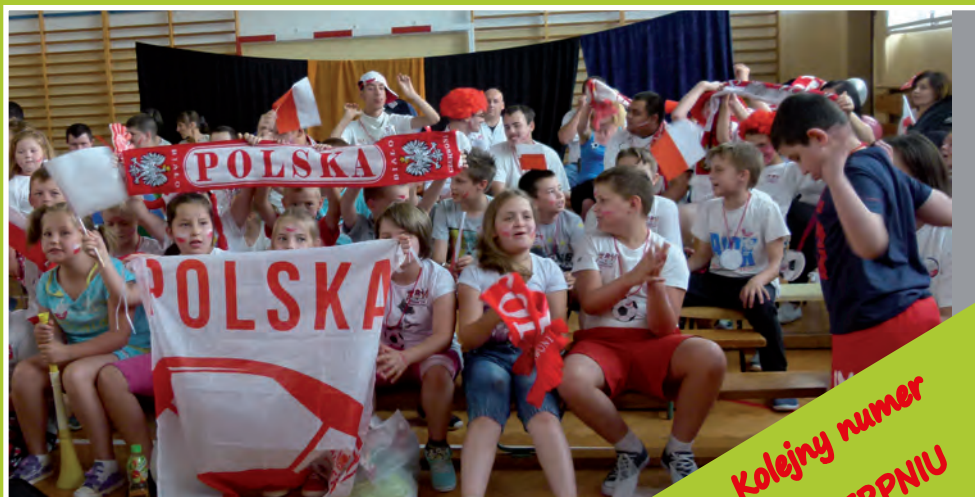
Wszyscy jesteśmy kibicami