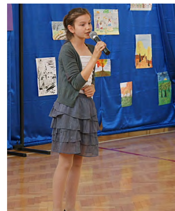
Oracja Wiktorii Gdańskiej