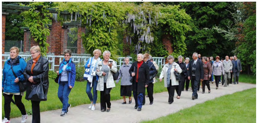
Nawet na zimny maj seniorzy znaleźli sposób i atmosfera wycieczki bardzo się ociepliła