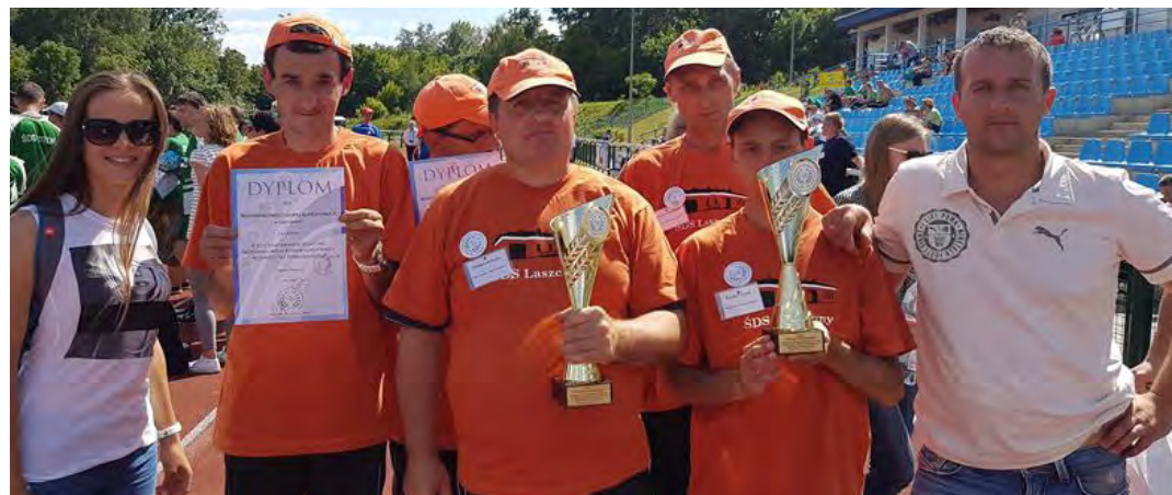
Poprzez udział w rozgrywkach podopieczni przełamują kolejne bariery i własne słabości