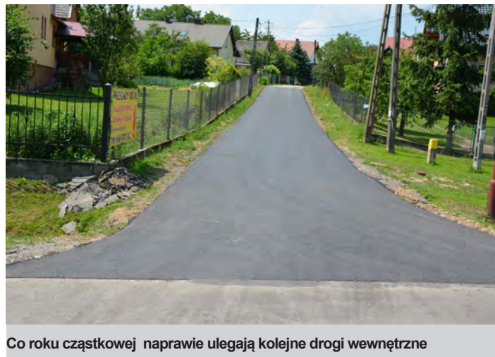
Co roku cząstkowej naprawie ulegają kolejne drogi wewnętrzne

roboty ruszyły pełną parą i można powiedzieć, że ich zaawansowanie osiągnęło co najmniej półmetek. Wartość robót remontowych ob-