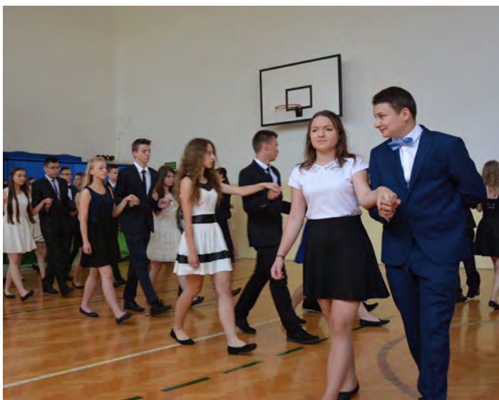
Poloneza czas zacząć...