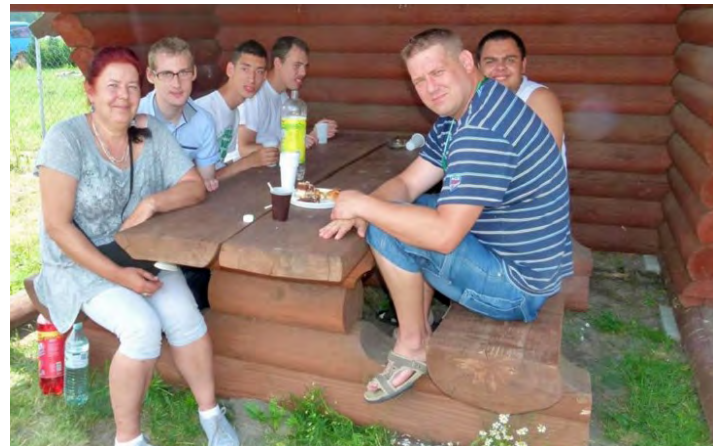
Po zabawie przyszedł czas na chwile wytchnienia w cieniu