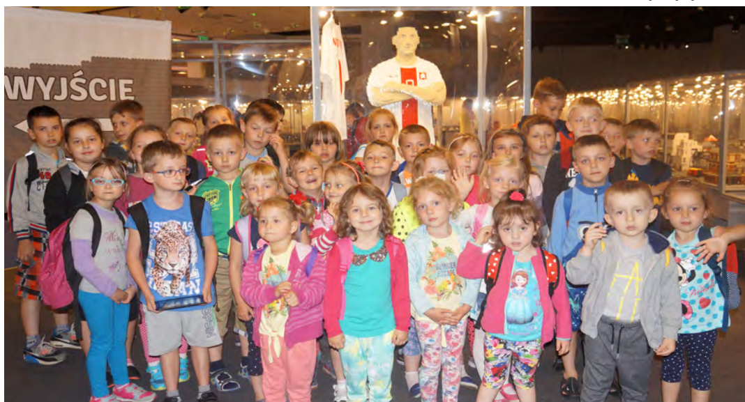
I jak tu nie zrobić sobie zdjęcia z Lewandowskim. Co prawda z figurą, ale zawsze...

w skali 1:1. Duże zainteresowanie zbudził także Air Force One, czyli Boeing 747 należący do prezydenta USA. Zajrzeliśmy do środka i podejrzeliśmy zbudowane z klocków sceny historyczne z udziałem najważniejszych osób w Stanach Zjednoczonych. Niezapomniane wrażenia zapewniła również makietą z jeżdżącym pociągiem, ogromny niszczyciel gwiazdny Venator, a także seria zaprogramowanych robotów. Dzieci miały możliwość zagrać z nimi w kółko i krzyżyk, obserwować maszynę kroczącą AT-ST z filmu „Gwiezdne Wojny” oraz podziwiać poruszającego się pająka. DZIECI BYŁY ZACHWYCONI! Korzystały ze strefy zabawy, kina edukacyjnego, tworzyły budowle z klocków LEGO, bawiły się i grały na konsoli. Na koniec wszyscy posmakowali przepysznych frykasów w Mc'Donald's. Po dniu pełnym, wrażeń dzieci jednogłośnie stwierdziły, że był to ich najpiękniejszy Dzień Dziecka.