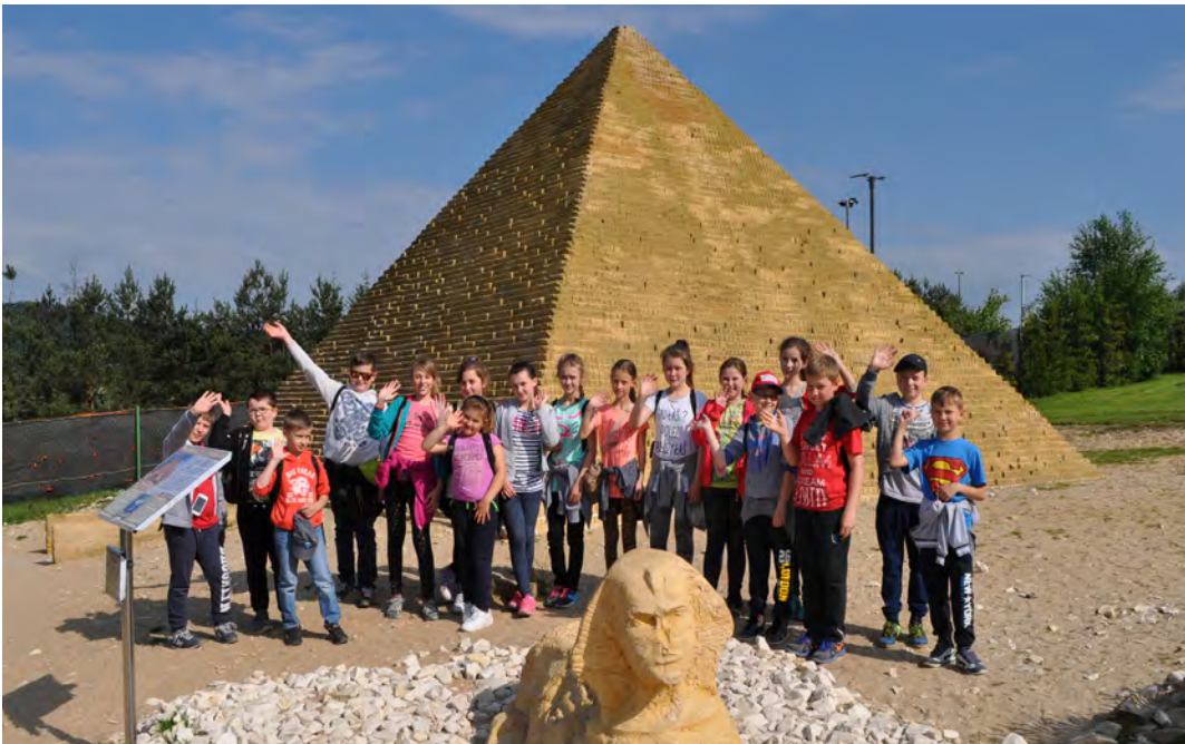
By mieć zdjęcie na tle piramidy, nie trzeba lecieć do Egiptu

Następny przystanek to miejscowość Krajno-Zagórze, gdzie spędziliśmy czas w Parku Rozrywki i Miniatur. Znajduje się tam wiele miniatur znanych na całym świecie budowli, między innymi: Bazylika Świętego Piotra, Katedra Notre Dame, Koloseum, Opera z Sydney, wieże World Trade Center, Big Ben, Taj Mahal z Indii, Piramida Cheopsa czy Wodospad Niagara. I wreszcie to, na co wszyscy czekali z niecierpliwością – park linowy. Na koniec czekał nas seans w kinie 6D, które dostarczyło nam wielu wrażeń. Jeszcze tylko lody i powrót do domu... Wycieczka wszystkim bardzo się podobała. Czekamy na następne.