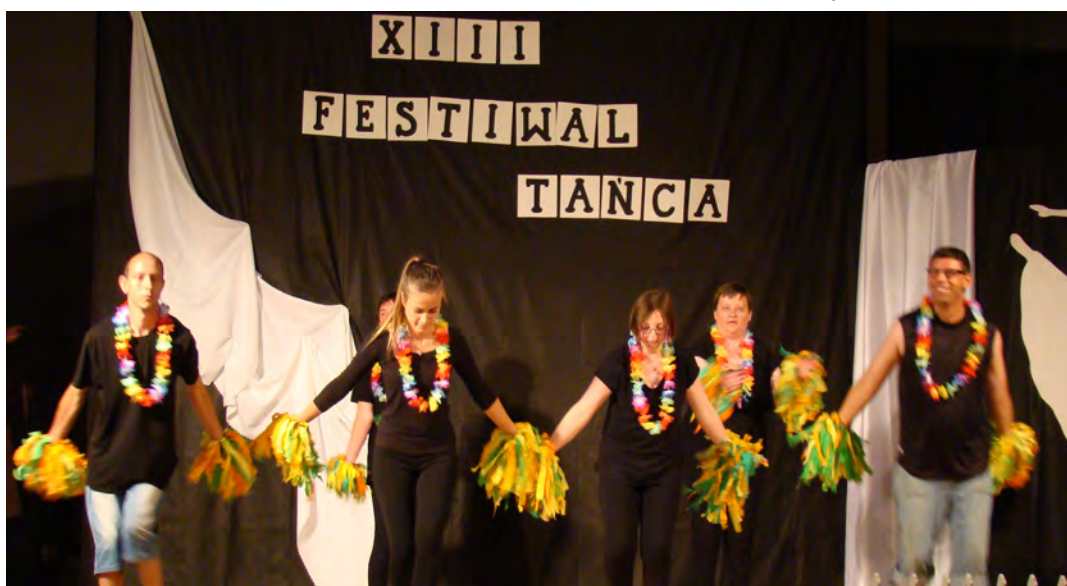
Najważniejsze by taniec sprawiał radość