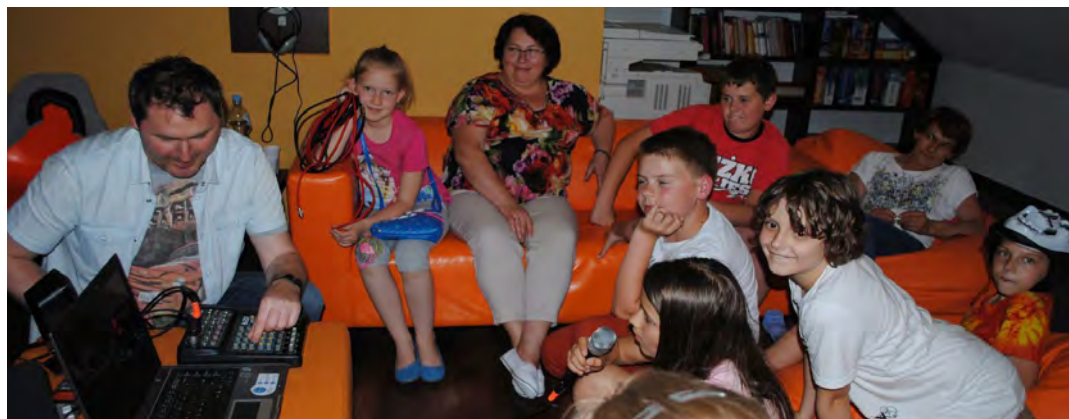
Praca z dźwiękiem jest bardzo interesująca