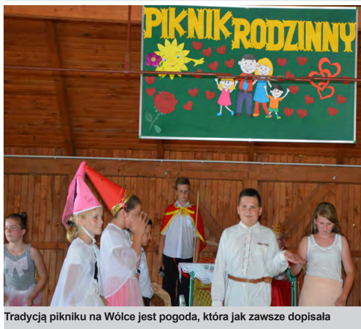
Tradycją pikniku na Wólce jest pogoda, która jak zawsze dopisała