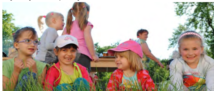
Radości nie było końca