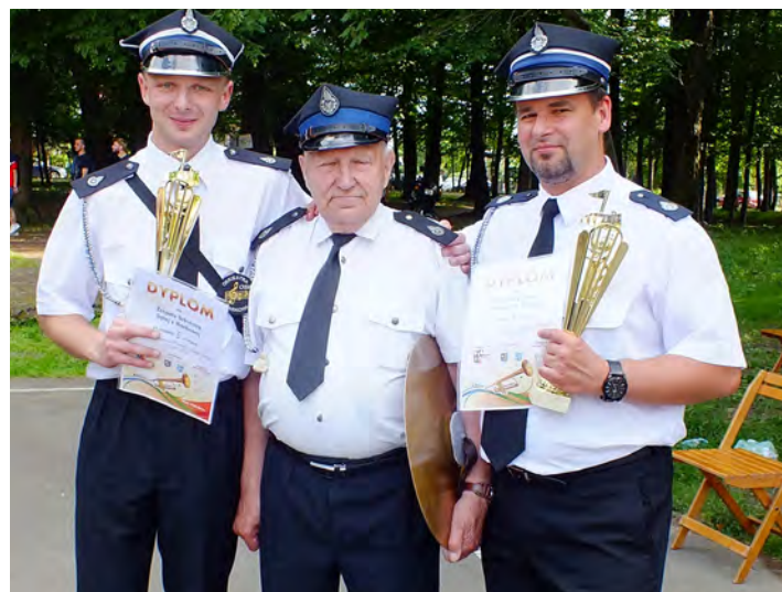
Wiadomo w czyje ręce trafiły główne nagrody