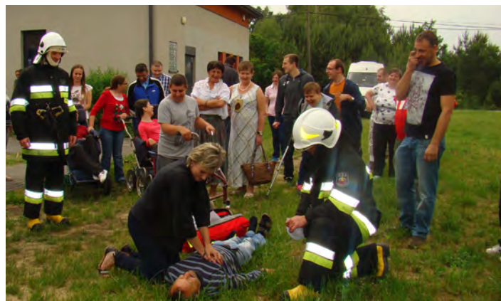
Wszyscy doskonale wiedzą jak ważna jest pierwsza pomoc