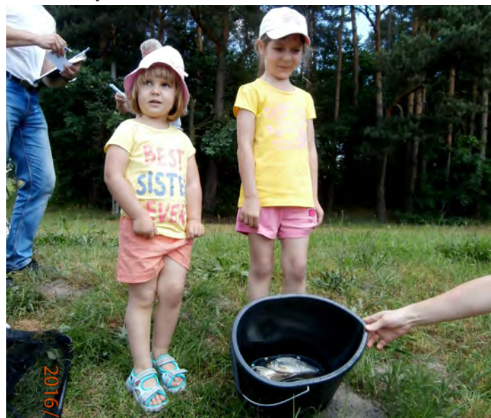
Stanowiska obsadzone były w komplecie, a rybka brała