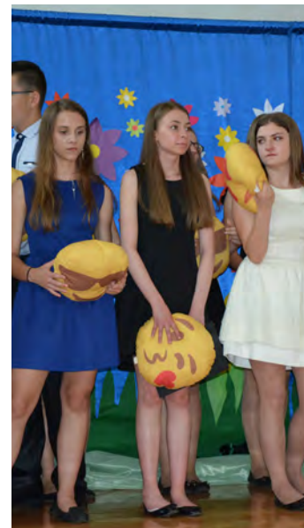
Kończące gimnazjum klasy trzecie otrzymały od młodszych kolegów pamiątkowe maskotki