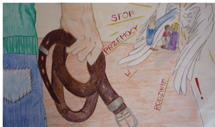
Przemoc widziana oczami dziecka