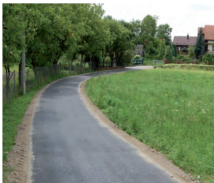
Grodzisko Dolne - droga na p. Jońca