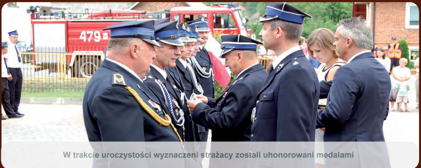
W trakcie uroczystości wyznaczeni strażacy zostali uhonorowani medalami