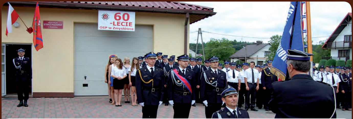
Akt przekazania sztandaru na ręce prezesa jednostki OSP Zmysłówka