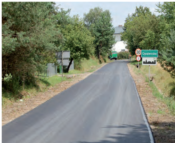
Droga Opaleniska - Budy