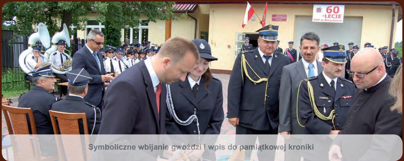
Symboliczne wbijanie gwoździ i wpis do pamiątkowej kroniki