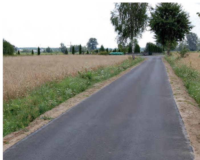
Chodaczów - droga Cmentarna