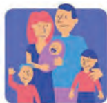
KARTA DUŻEJ RODZINY