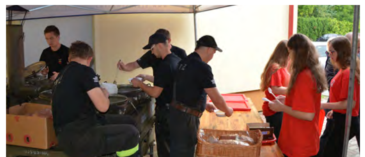
Pożywną grochówkę przygotowali strażacy z Laszczyn