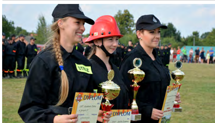
Zdobywczynie trzech pierwszych miejsc