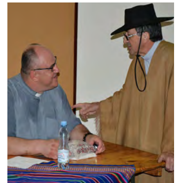
Przyjacielska wymiana zdań