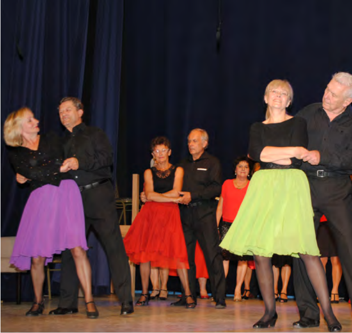
Piątkowe występy sceniczne w Ośrodku Kultury