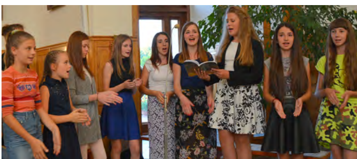
S. Agnieszkę śpiewem wspierały chórzystki z Chałupek Dębniańskich