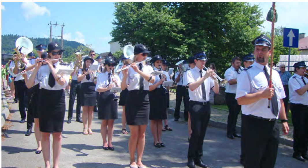
Grodziska orkiestra nie po raz pierwszy koncertuje w Lutowiskach

Współcześnie organizowane „Targi Końskie” odbiegają od dawnej tradycji, obecnie to przegląd Ośrodków Jeździeckich zlokalizowanych