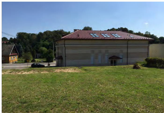
Uporządkowany plac za Ośrodkiem Kultury