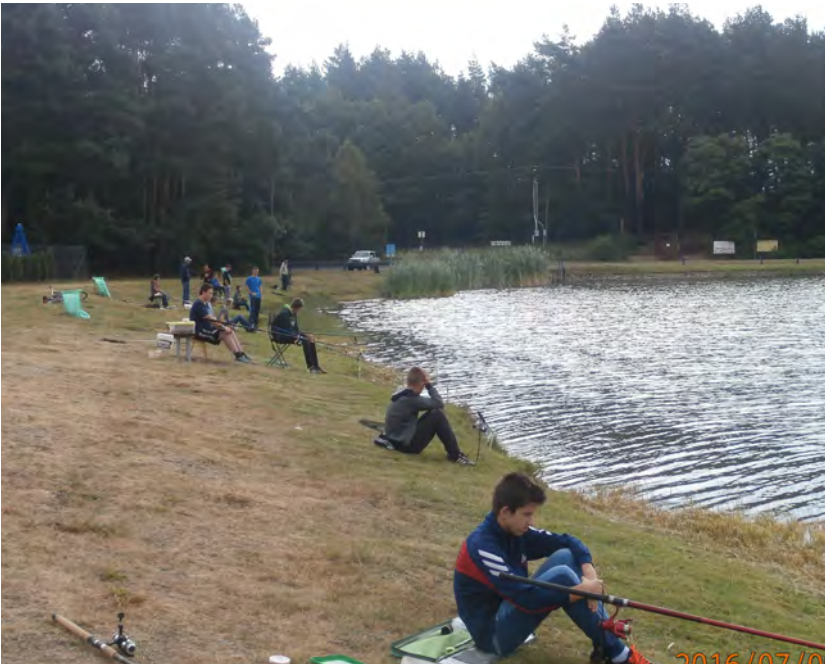
Połowy wędkarskie nad „Czystym”