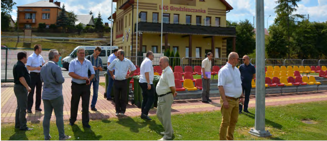
Goście z Ukrainy byli pod wrażeniem sportowego zaplecza i stadionowej murawy

Po serii pytań wójt zaprosił delegacje do wizytowania w terenie. Odwiedzono Społeczną Szkołę Podstawową w Wólce Grodziskiej, Środowiskowy Dom Samopomocy w Laszczynach oraz Gminną Bibliotekę Publiczną i stadion w Grodzisku Górnym.