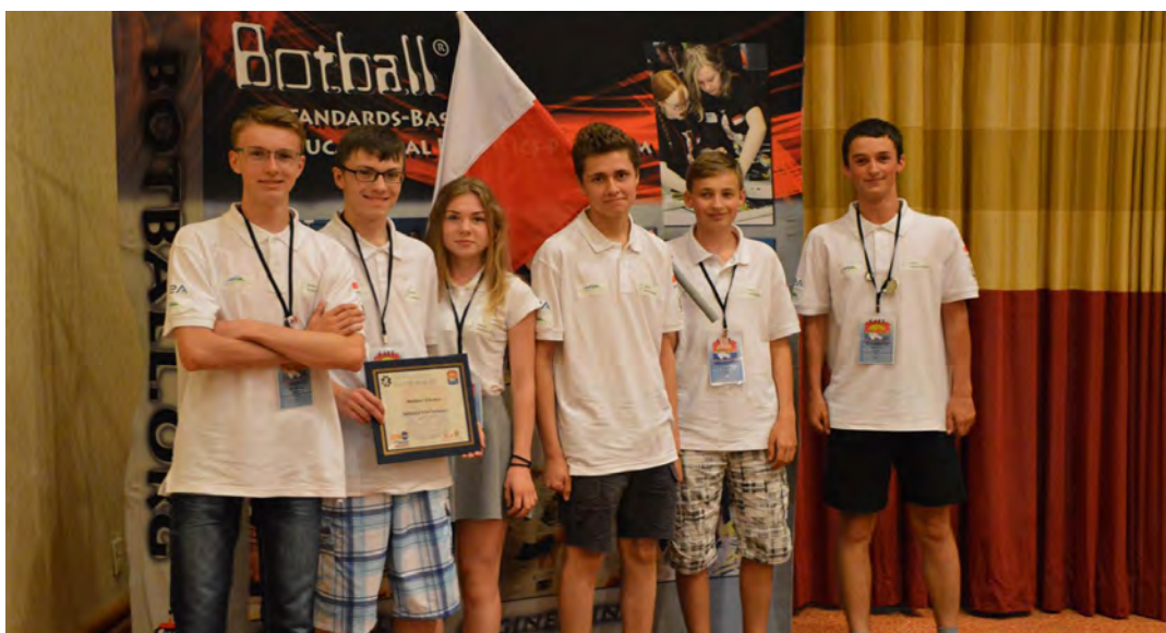
9. miejsce na 54 drużyny z całego świata to bardzo dobry wynik naszych reprezentantów