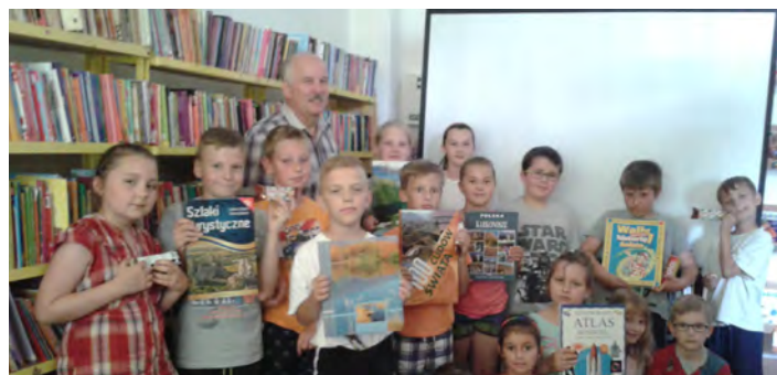
Takie spotkania rozbudzają ciekawość świata