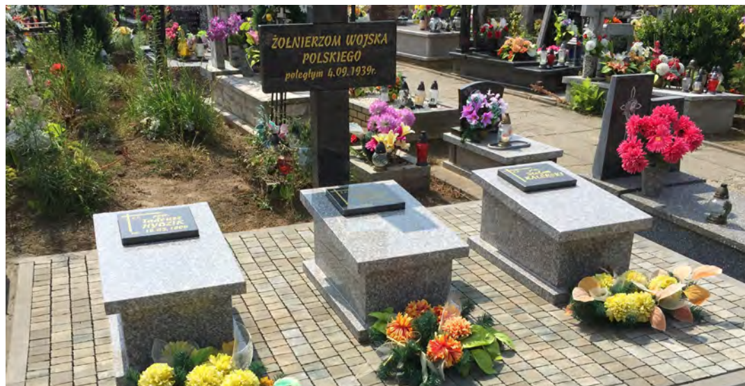
To od nas zależy jak długo trwać będzie pamięć o bohaterach z tamtych lat