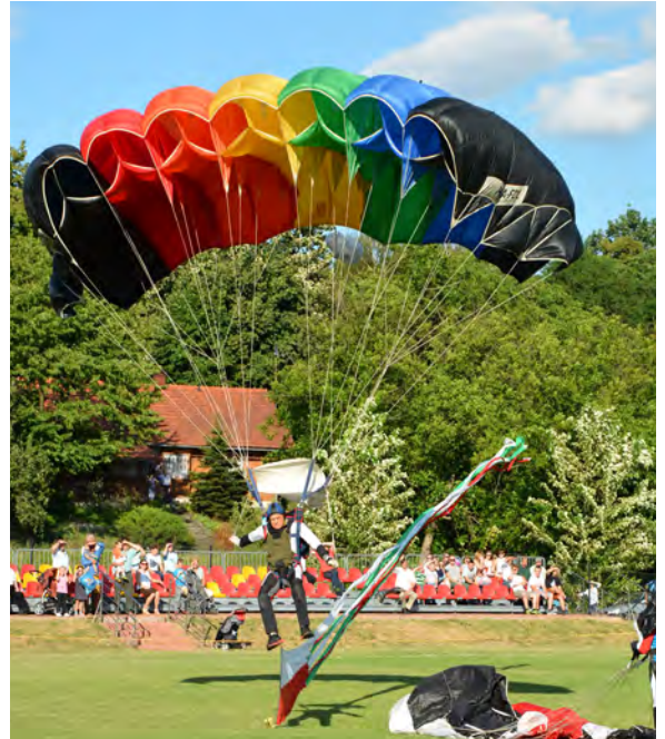
Na płycie stadionu wylądowali spadochroniarze