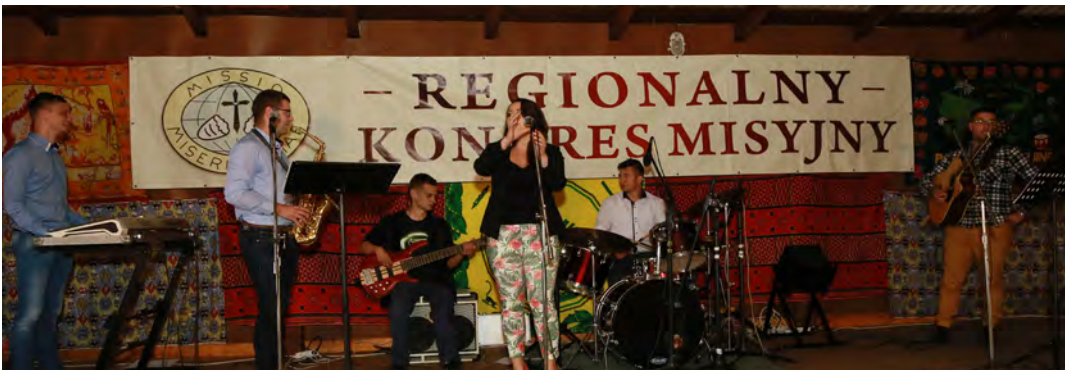
Misyjną widownię rozgrzewał leżajski „Drogowskaz”