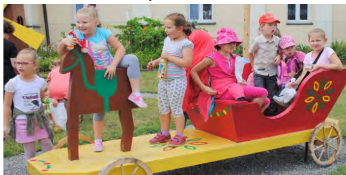
Dzieciaki energię spożytkowały bawiąc się na placu przed muzeum