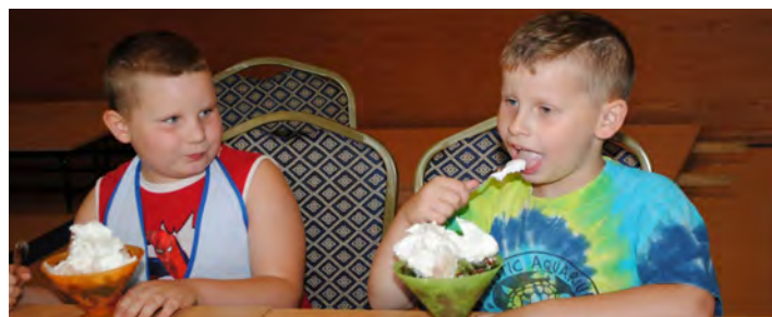
I jak tu się powstrzymać i nie zjeść takich pyszności