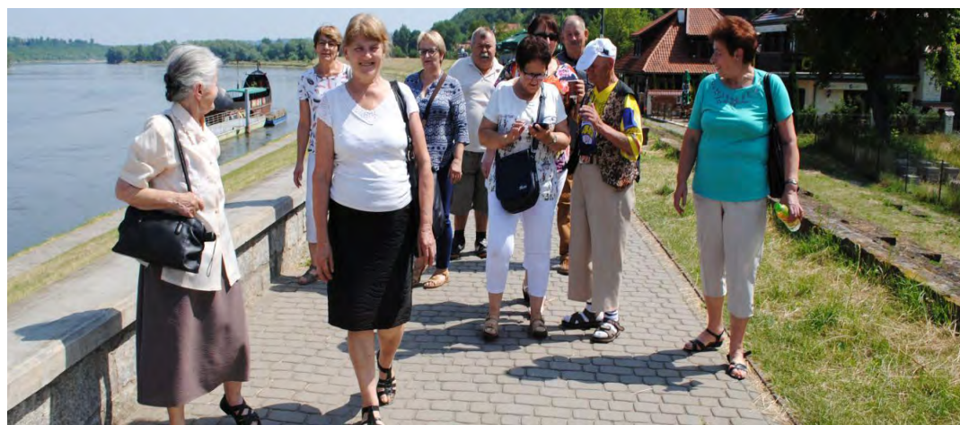
Kazimierz Dolny to bardzo urokliwe miasto