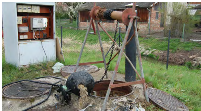
Niewłaściwe korzystanie z kanalizacji rodzi problemy eksploatacyjne