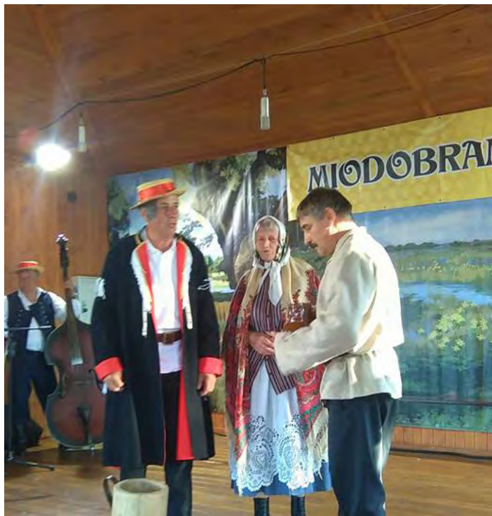
Grodziszczoki i ich „Miodobranie”

Część rozrywkową niedzielnej imprezy stanowiły występy zespołów artystycznych, wśród których można