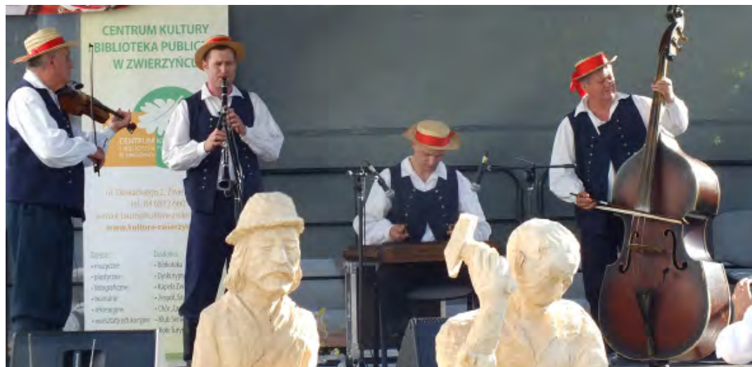
Występ w Zwierzyńcu oceniono na trzecie miejsce