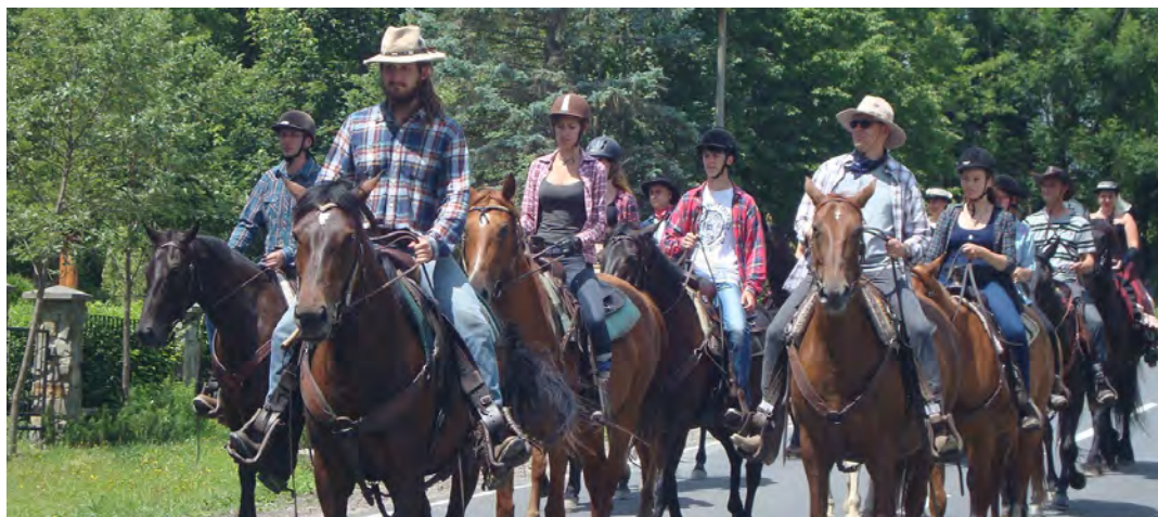
Konna parada z udziałem ośrodków jeździeckich