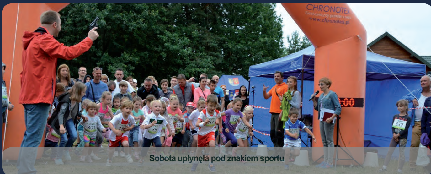
Sobota upłynęła pod znakiem sportu