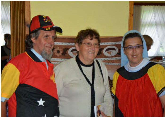
Jedyna taka okazja by zrobić pamiątkową fotkę z misjonarzami