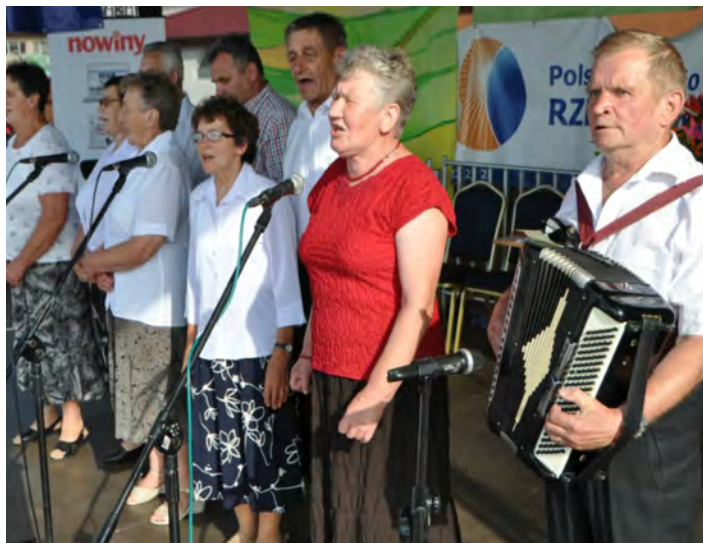
Nie ma to jak biesiadne granie

Podczas przeglądu można było ponadto degustować tradycyjne potrawy regionalne przygotowane przez Koła Gospodyń Wiejskich z terenu gminy Tryńcza. Na koniec odbyło się wspólne od-