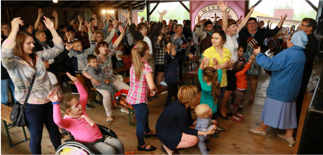
Był czas na modlitwę i wesołą zabawę