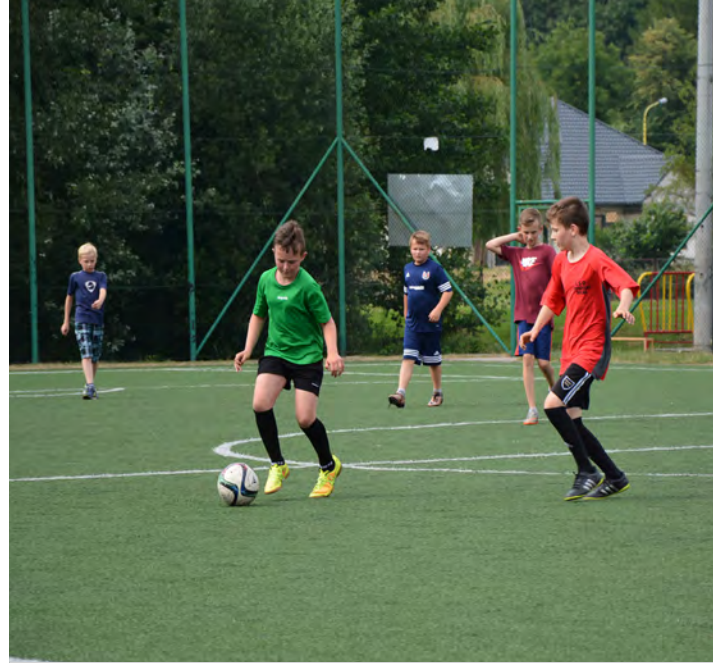
Rozgrywki na Orliku w ramach Gminnej Parafiady