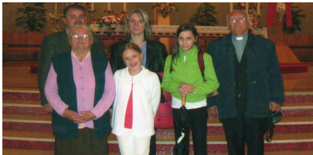
Z rodziną w Amerykańskiej Częstochowie