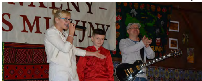
Zespół Testimonium widowię uraczył śpiewem i zagadkami