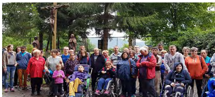
Wspólne wyjazdy integrują

le ciekawych eksponatów obrazujących rozwój przyrody od czasów zamierzchłych do dziś. Z muzeum udaliśmy się w drogę powrotną do domów. Uczestnicy wycieczki byli bardzo zadowoleni z wyjazdu i czekają z niecierpliwością na następną tego typu wyprawę. Wyjazd miał na celu integrację społeczną osób niepełnosprawnych z osobami pełnosprawnymi. Ponadto wszyscy mogliśmy podziwiać piękno naszego kraju. LD