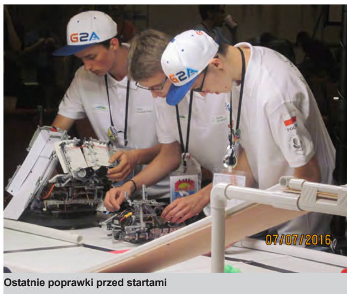
Ostatnie poprawki przed startami

Więcej informacji na ten temat można znaleźć na stronach: http://bajkirobotow.blogspot.com http://zsleji.pl