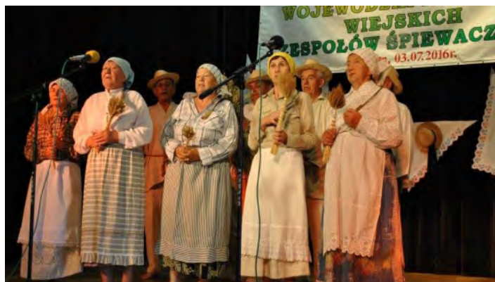
To był udany konkurs dla obu zespołów

Do udziału w tegorocznym przeglądzie stanęło 30 zespołów, które działają przy ośrodkach kultury, kołach gospodyń wiejskich i innych organizacji i śpiewają tradycyjne pieśni i przyśpiewki ludowe ze swojego regionu. W ramach przeglądu zaprezentowały się również nasze zespoły śpiewacze – „Grodziszczoki” i „Leszczynka”. W swoich 10-minutowych występach obydwie zespoły poszły w kierunku pieśni obrzędowych. „Leszczynka” bardzo dobrze i ciekawie przedstawiła przyśpiewki żniwne, za co otrzymała I miejsce. Zespół „Grodziszczoki” wybrał zaś pieśni weselne. Przyśpiewki do „Białego wieńca” i „Oczeplin” w ocenie jury zasłużyły na II