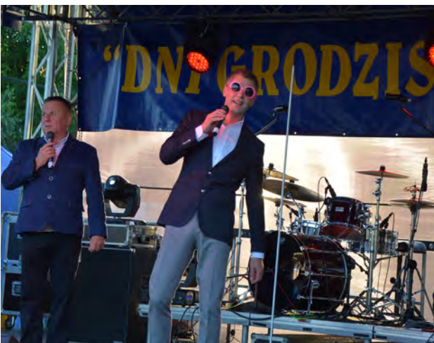
Występ kabaretu RAK