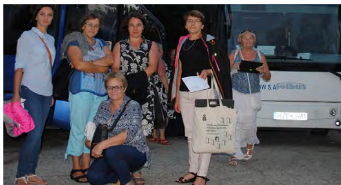
Uczestniczki książkowego szaleństwa we Wrocławiu