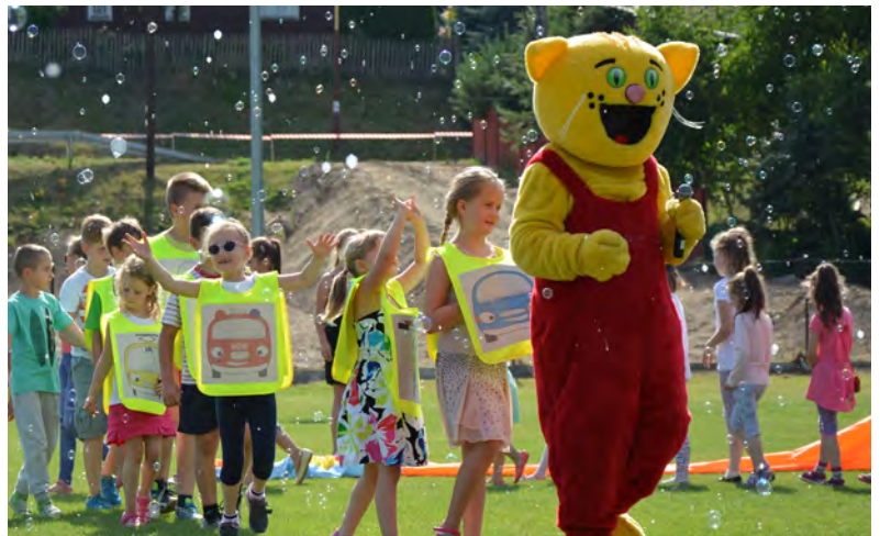
Niedzielnny program dla dzieci