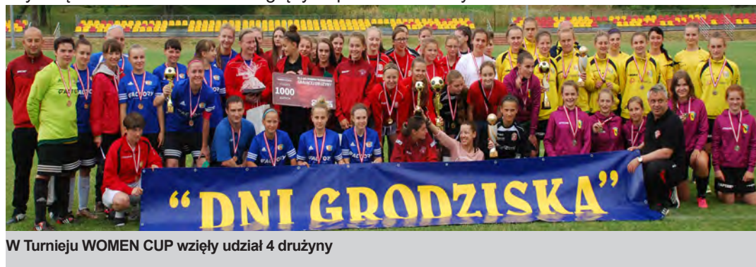
W Turnieju WOMEN CUP wzięły udział 4 drużyny