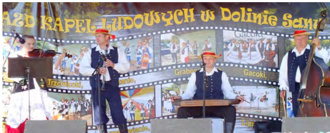
Tu nagrodą był sam występ

Koncerty kapel nie były jedyną atrakcją. Na stoiskach rozstawionych na rynku można było podziwiać dzieła artystów ludowych, takie jak drewniane rzeźby, tradycyjne zabawki, wyroby z wikliny, czy ikony. Panie z okolicznych Kół Gospodyń Wiejskich przygotowały stoisko z lokalnymi potrawami. Dzieci mogły korzystać z dmuchanej zjeżdżalni oraz nauczyć się puszczania ogromnych baniek mydlanych. Dużym zainteresowaniem cieszył się również szcudlarz, który „wyczarowywał” zwierzęta z balonów. Na zakończenie imprezy odbył się festyn, który był atrakcją dla miłośników tańca i dobrej zabawy. Michał Rydzik