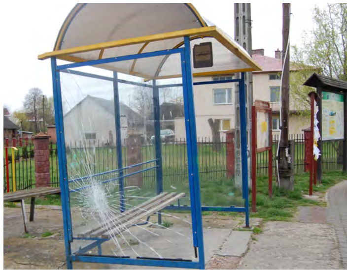
Pęknięta szyba przystankowa w Grodzisku Górnym