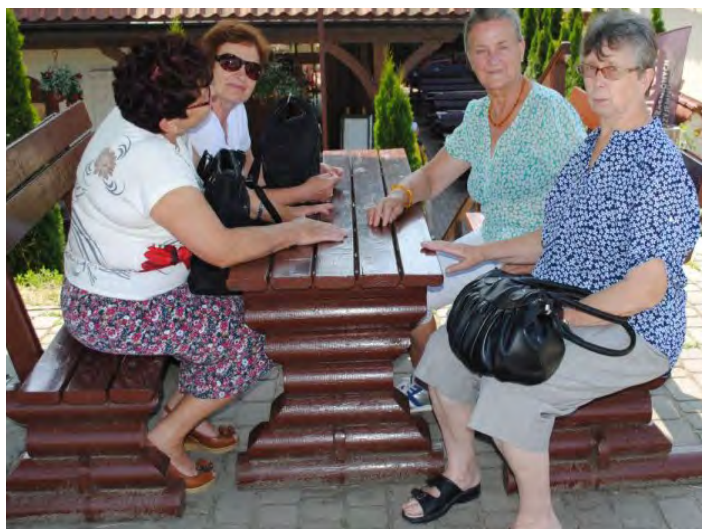
Był czas na zwiedzanie, odpoczynek