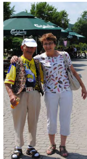
...i pamiątkowe zdjęcia