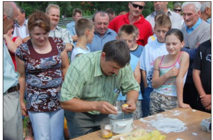
Panowie jak zawodowcy radzili sobie z rozbijaniem jajek