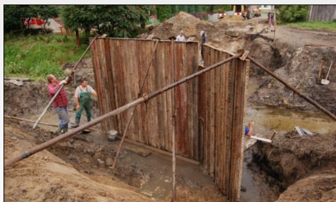
Prace na moście „na Rydzika”

W najbliższym czasie rozpoczęte zostaną kolejne inwestycje. Ogłoszone już zostały 4 przetargi na: 1. Budowę ogólnodostępnego kompleksu sportowego, w ramach programu „Moje Boisko - Orlik 2012”, 2. Przebudowę drogi dojazdowej do gruntów rolnych na tzw. „Pastewnik”, 3. Modernizację obiektu OSP Miasteczko wraz z dociepleniem budynku, 4. Budowę wielofunkcyjnego budynku Szkoły Podstawowej w Wólce Grodziskiej.