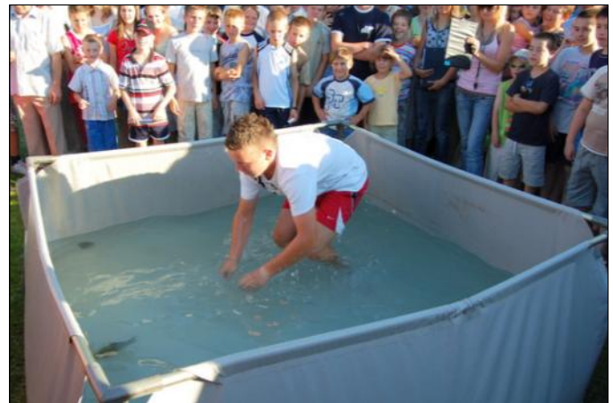
„Polowanie” na karasia