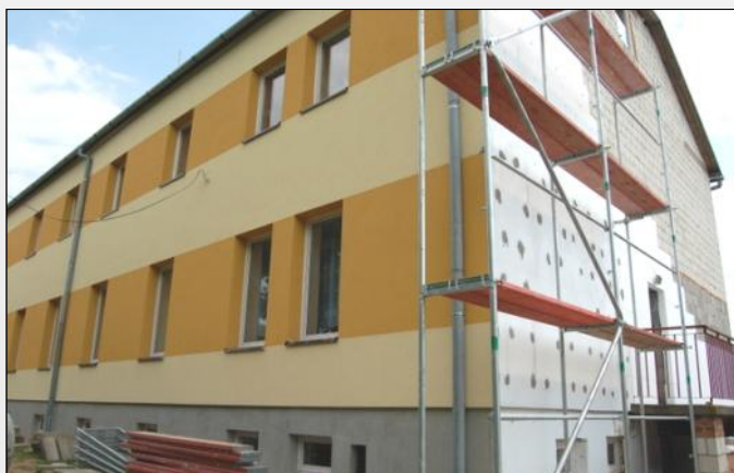
Elewacja zewnętrzna budynku w Grodzisku Nowym

Obecnie trwają prace termomodernizacyjne dwóch budynków użyteczności publicznej. W Grodzisku Nowym trwa remont Domu Wiejskiego, gdzie wymieniono stolarkę okienną i drzwiową. Planowane prace obejmują ocieplenie budynku, wykonanie elewacji, instalacji odgromowej i płytki odbojowej oraz malowanie dachu. Wartość inwestycji wynosi 197 292,02 zł.