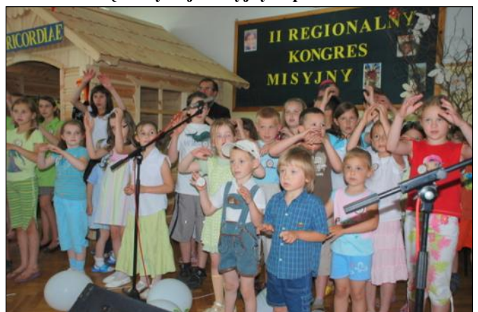
Taki mały taki duży może świętym być