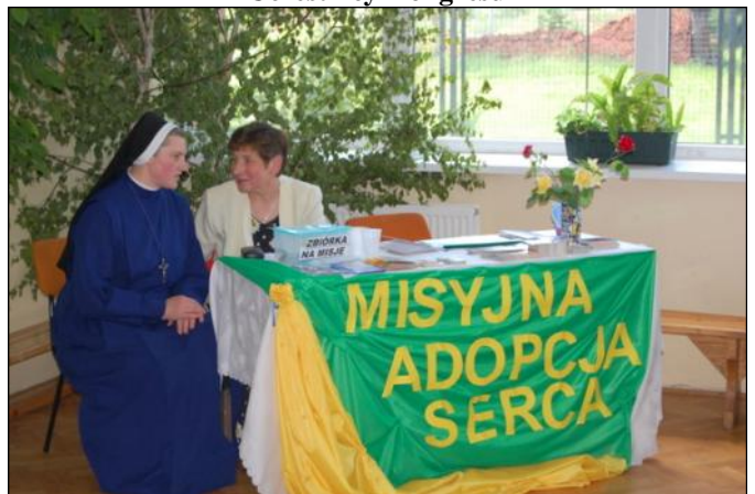
Każdy mógł przylączyć się do Misyjnej Adopcji Serca