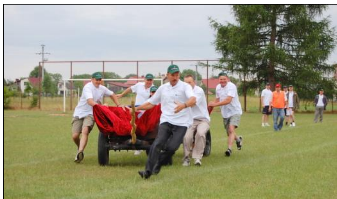
Perfekcyjnie wykonany przejazd bryczką

W tegorocznych rozgrywkach wystartowało cztery drużyny, reprezentowane przez Powiat Leżajski, Gminę Leżajsk, Gminę Kuryłówka i Gminę Grodzisko Dolne. Składy drużyn tworzyli pracownicy urzędów i radni. Dla zawodników i ich drużyn przygotowano 13 konkurencji, na które składały się: przejazd bryczką, przeciąganie liny, przecieranie kłosa, konkurencja niespodzianka, rzuty do kosza, trójbój siłowy, sprawnościowy tor przeszkód,