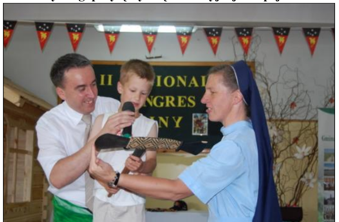
Zacięta licytacja misyjnych przedmiotów