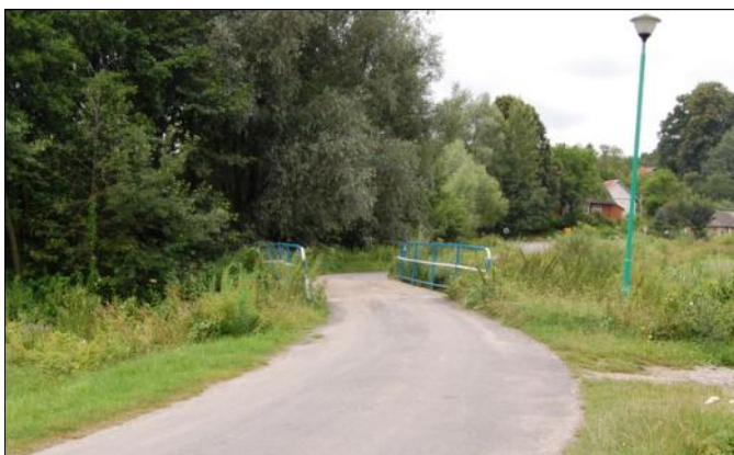
Droga i most obok Remizy OSP w Grodzisku Dolnym

Zarząd Województwa Podkarpackiego pozytywnie rozpatrzył wniosek Gminy Grodzisko Dolne o przyznanie pomocy finansowej w ramach Działania 2 - Wsparcie inwestycji związanych z utrzymaniem lub rozwojem gminnej infrastruktury drogowej objętego „Podkarpackim Samorządowym Instrumentem Wsparcia Rozwoju Infrastruktury na Obszarach Wiejskich”.