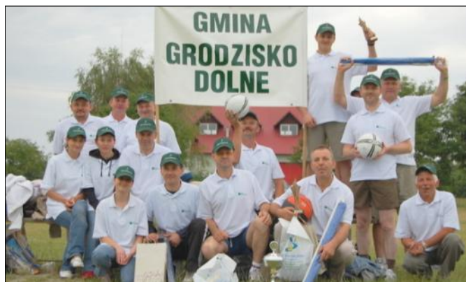
Reprezentacja Gminy Grodzisko Dolne

rzuty „jajkiem”, chód na płozach, konkurencja strażacka, wbijanie gwoździ, piłka siatkowa i rzuty ringo na pacholek. Konkurencje wymagały od uczestników sprytu, szybkości, sprawności fizycznej i drużynowego zgrania.