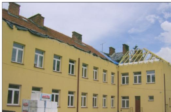
Remont dachu na szkole w Grodzisku Górnym

Z początkiem lipca ruszyły także prace związane z wymianą mostu na drodze „na Rydzika”. Zgodnie