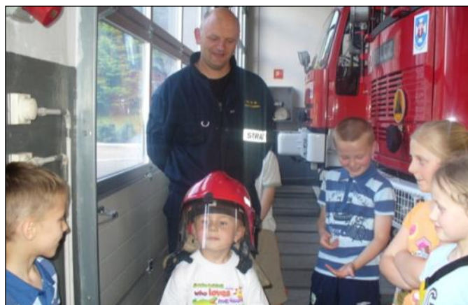
A może by tak w przyszłości do straży

ków o swojej pracy. Oglądały samochody strażackie i ich wyposażenie oraz przymierzały strażackie hełmy. Po dniu pełnym atrakcji w godzinach popołudniowych wszyscy zadowoleni wrócili do swoich domów.