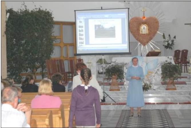
Prezentacja filmu o mieszkańcach Papui Nowej Gwinej