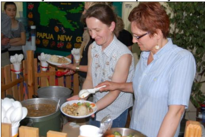
Dania wyglądały bardzo apetycznie