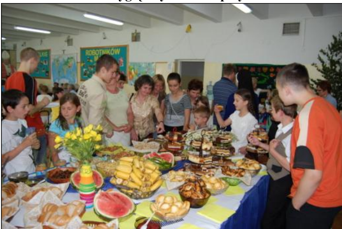
Misyjny stół był oblegany ze wszystkich stron