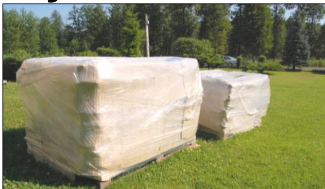
Prawidłowo przygotowana paleta

Azbest staje się zagrożeniem dla zdrowia, gdy dojdzie do korozji lub jakiegokolwiek uszkodzenia wyrobu (łamanie, kruszenie, cięcie i każda inna obróbka). Taki stan powoduje uwalnianie się włókien do powietrza i możliwe wdychanie ich do płuc. Oddychanie powietrzem, w którym znajdują się niewidzialne dla oka włókna azbestu w kształcie harpuna, prowadzi do wielu chorób: pylicy azbestowej, nowotworu dróg oddechowych, raka płuc. Odpady zawierające azbest, z uwagi na zakaz ich stosowania, nie mogą być przedmiotem odzysku i muszą być w sposób bezpieczny dla ludzi i środowiska unieszkodliwiane przez składowanie. Podczas ściągania płyt z dachu należy zabezpieczyć drogi oddechowe, zakładając maski przeciwpylowe. Płyty należy ułożyć na paletach do wysokości ok. 1 metra. Paletę należy związać i dokładnie ofoliować. Jest to bardzo ważne, by podczas transportu nie doszło do pylenia. Tak przygotowane palety powinny być umieszczone w miejscu pozwalającym na swobodny dojazd samochodu ciężarowego. Najlepiej przed domem blisko