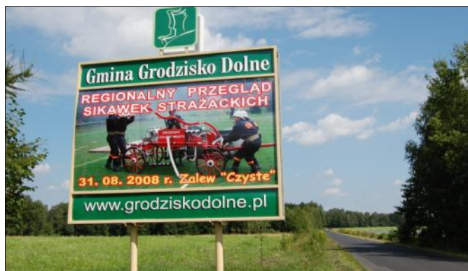
„Witacz” zawiera część stałą i wymienny środek

Mistrzostwa Podkarpacia w Skokach Spadochronowych. Kolejną promuje Regionalny Przegląd Sikawek Strażackich, który odbędzie się 31 sierpnia nad Zalewem „Czyste” w Grodzisku Dolnym.