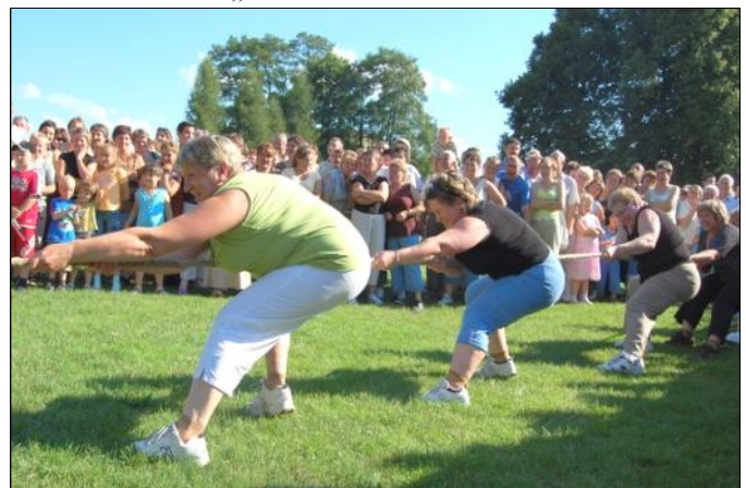
Kobiety w przeciąganiu liny