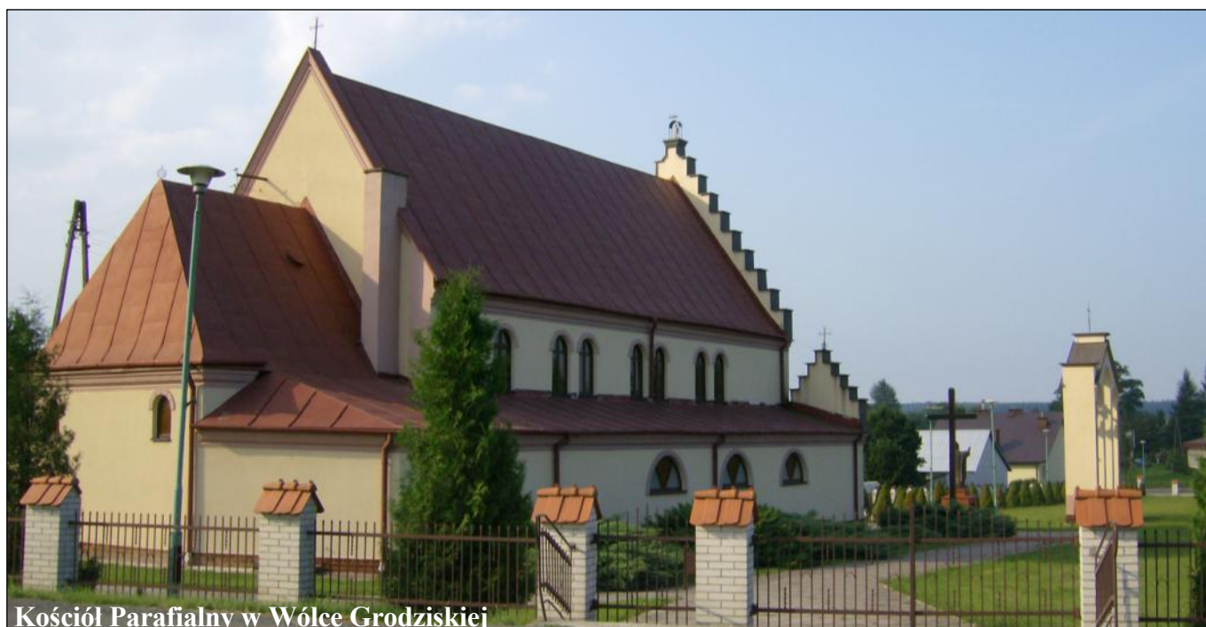
Kościół Parafialny w Wólce Grodzkiej

(Niniejszy artykuł powstał dzięki przekazom uczestników wydarzeń jesieni 1971 roku).