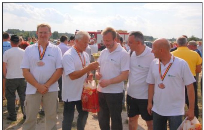
Drużyna z Grodziska przekazuje wójtowi swój puchar