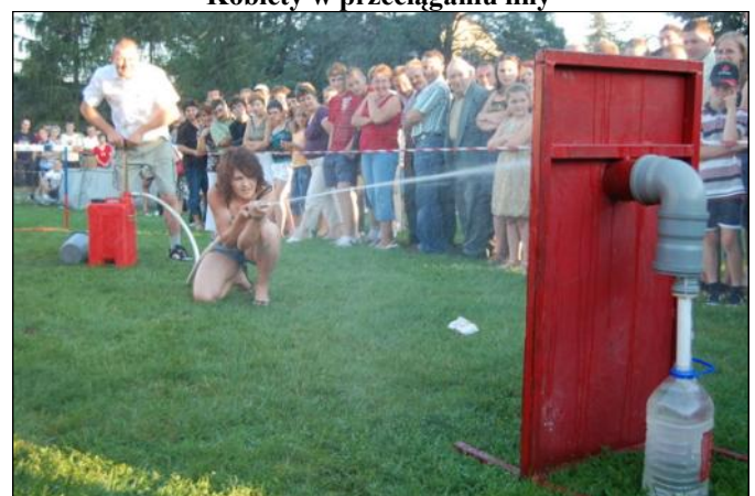
Strażacy w swoim żywiole