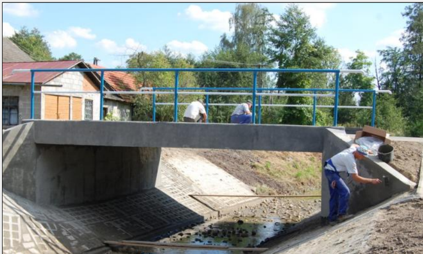
Nowy most na drodze „Na Rydzika” w Grodzisku Dolnym