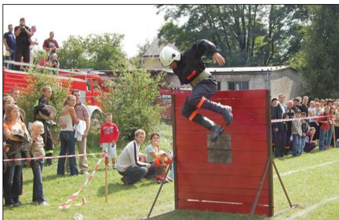
Przeszkoda - mur