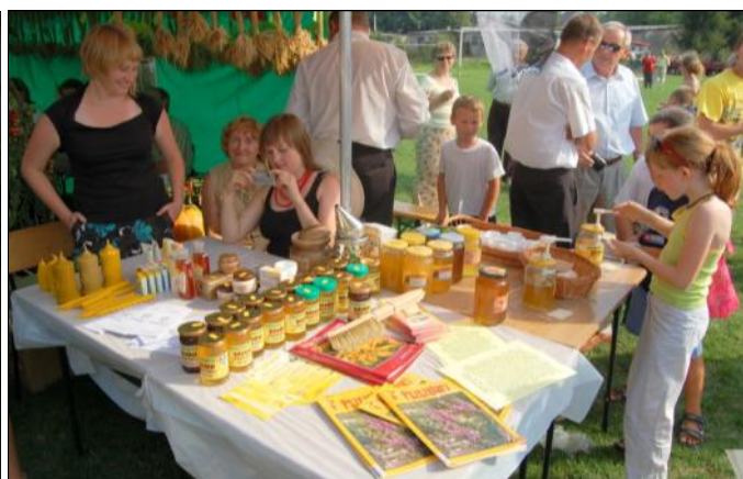
Promocja produktów pszczelich