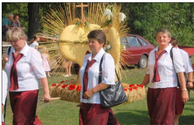
Delegacja wieńcowa z Wólki Grodziskiej - Zagrody