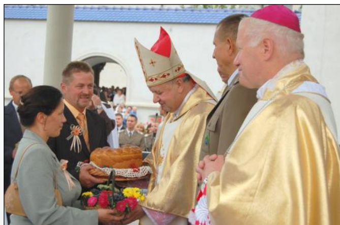
Starostwie dożynek gminnych wręczają Jego Eminencji - Kardynałowi Stanisławowi Dziwiszowi dary z grodzkiej ziemi

Prócz delegacji wieńcowych liczną grupę stanowiły oddziały żołnierzy i służb mundurowych, takich jak Państwowa i Ochotnicza Straż Pożarna, Policja, Służba Więzienna, 21 Brygada Strzelców Podhalańskich i Bieszczadzki Oddział Straży Granicznej.