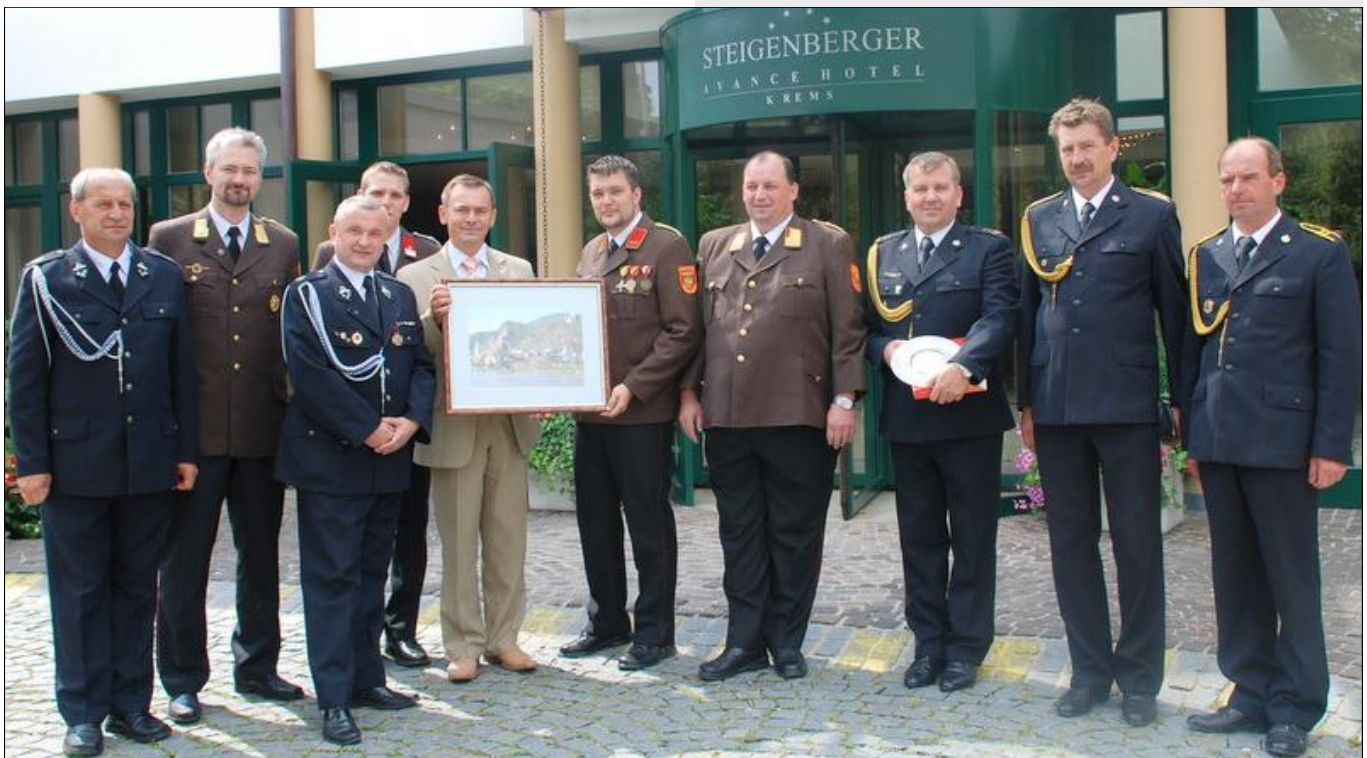
Przedstawiciele polskiej i austriackiej delegacji przed hotelem w Krems