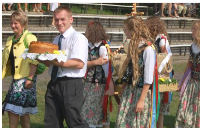
Delegacja wieńcowa z Chodaczowa