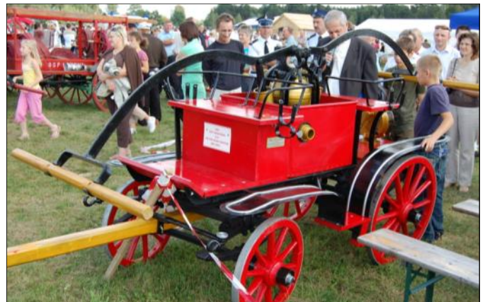
Zabytkowa sikawka - JRG Nowa Sarzyna