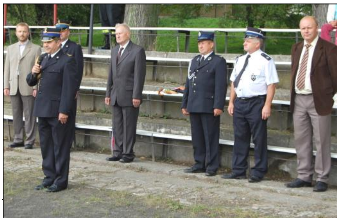
Komendant Powiatowy PSP wita zgromadzonych druhów