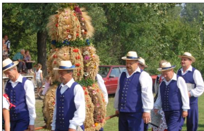
Wieniec dożynkowy Zespołu „Leszczyńka”