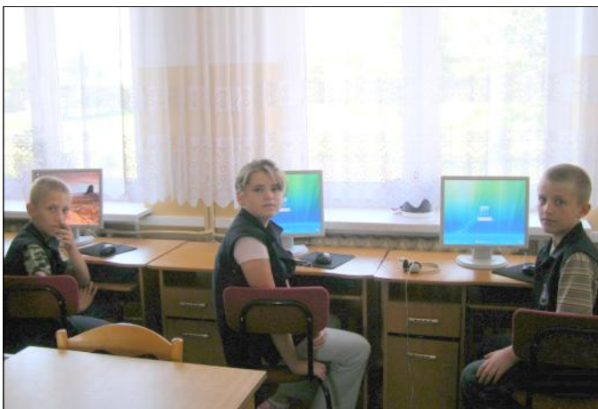
Zajęcia w internetowym centrum informacji multimedialnej w Grodzisku Górnym

Dbając o stan bezpieczeństwa na szkolnych korytarzach, w Zespole Szkół w Grodzisku Dolnym, wymieniono płytki PCV na gresowe, odmalowano ściany na korytarzach, klatkach schodowych i w salach lekcyjnych. Na hali sportowej naprawiono dach oraz odremontowano ściany boczne na trybunach. Do trzech sal lekcyjnych zakupiono ścianki meblowe, do jednej wykładzinę i ławki. Nowe stoliki zyskała pracownia komputerowa i internetowe centrum multimedialne.