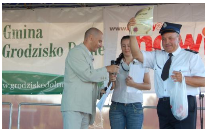
Prezes jednostki OSP Grodzisko Dolne odbiera nagrodę