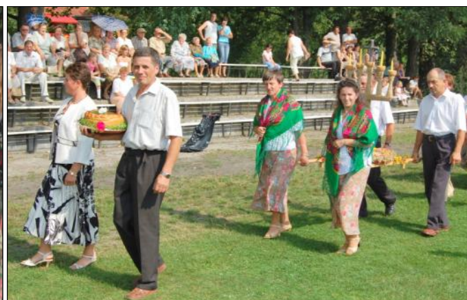
Delegacja wieńcowa z Opalenisk