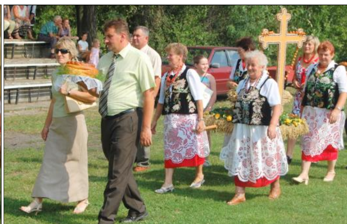
Delegacja wieńcowa z Grodziska Dolnego