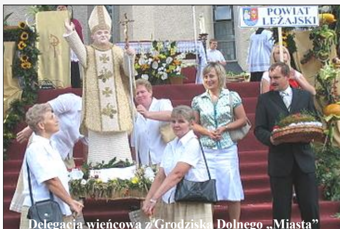
Delegacja wieńcowa z Grodziska Dolnego „Miasta”

W dniu 31 sierpnia 2008 podkarpaccy rolnicy obchodzili swoje święto plonów. W Sanktuarium Matki Bożej Bolesnej w Haczowie odbyły się VIII Dożynki Województwa Podkarpackiego i XXV Jubileuszowe Dożynki Archidiecezji Przemyskiej.