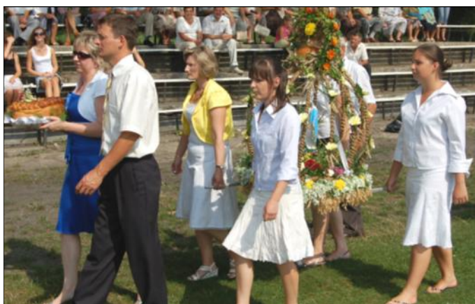
Delegacja wieńcowa z Laszczyn