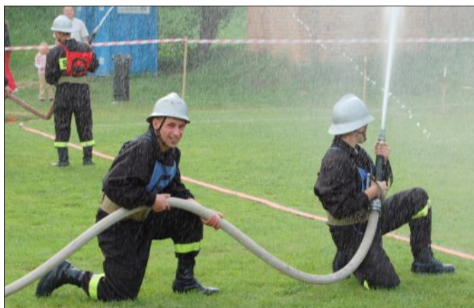
Strażacy na finiszu