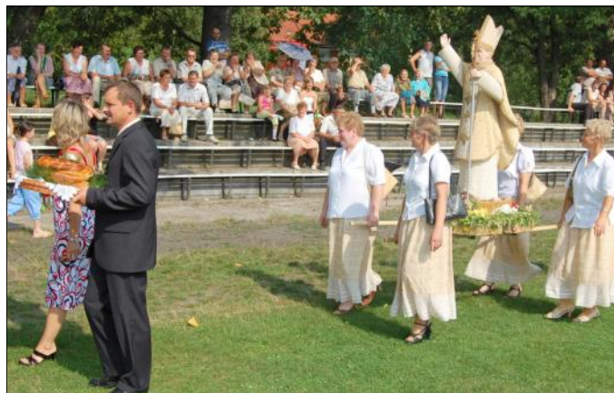
Delegacja wieńcowa z Grodziska Dolnego „Miasta”