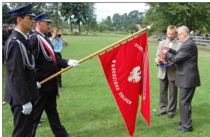
Nadanie odznaczenia sztandarowi