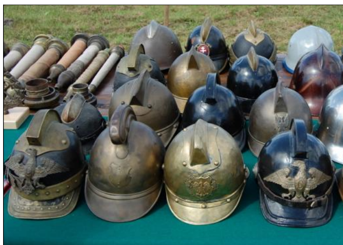
Wystawa strażackich hełmów