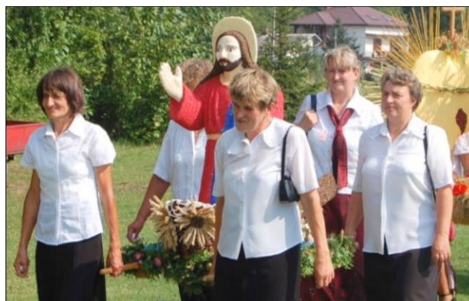
Delegacja wieńcowa z Wólki Grodziskiej