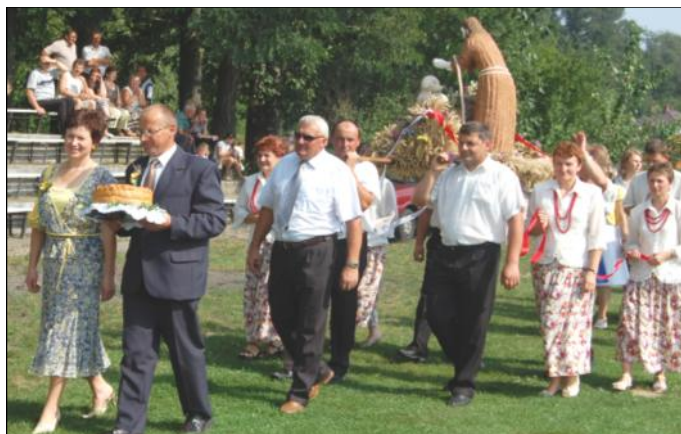
Delegacja wieńcowa z Grodziska Nowego