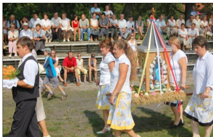
Delegacja wieńcowa ze Zmysłówki