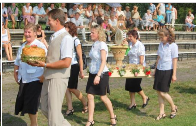
Delegacja wieńcowa ze Zmysłówki