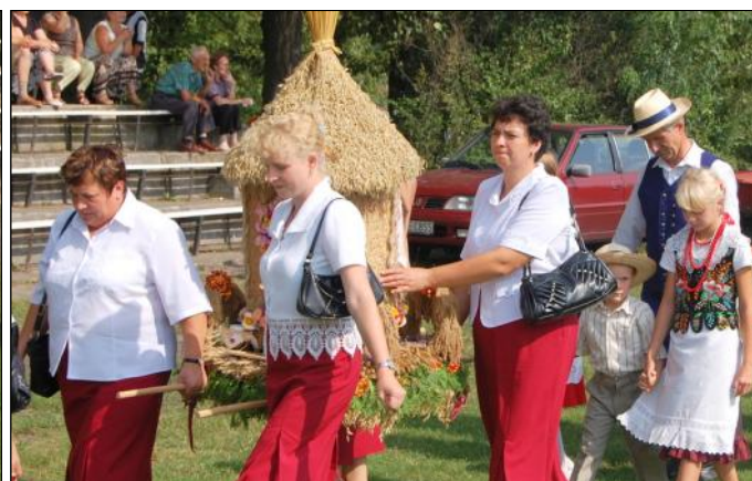
Delegacja wieńcowa z Wólki Grodziskiej - Majkuty