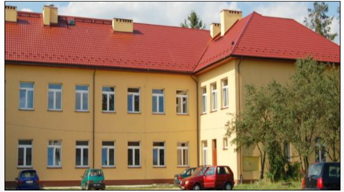
Nowy dach na Zespole Szkół w Grodzisku Górnym

Z kolei na drodze „Na Rydzika” w Grodzisku Dolnym, zakończono generalną przebudowę mostu.