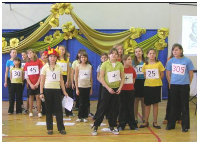
Występy młodzieży podczas realizowanego przez szkołę projektu „Szkoły Jagiellońskiej”

Stałym elementem każdego bloku naukowego będzie szereg krajoznawczych oraz ekologiczno-przyrodniczych wyjazdów edukacyjnych, w trakcie których uczniowie zdobytą wiedzę teoretyczną przełożą na praktykę. Będą to np. wycieczki do Zakopanego, w Bieszczady, Tatry, czy do Bolestraszyca.