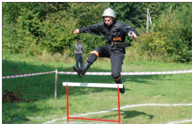
Skok przez płotek