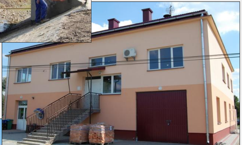
Wyremontowany Budynek Wiejski w Grodzisku Nowym