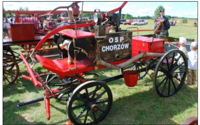
Zabytkowa sikawka - OSP Chorzów

Specjalizująca się w ratownictwie chemicznym jednostka z Nowej Sarzyny zaprezentowała ratownicze łodzie oraz nowoczesne kombinezony uży-