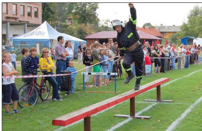
Przeszkoda - równoważnia