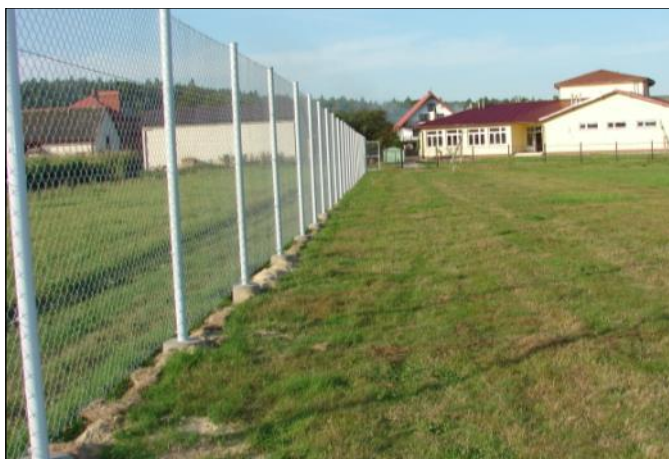
Ogrodzone boisko sportowe przy szkole w Opaleniskach

Największe, a tym samym najkosztowniejsze prace wykonano w tym roku w Zespole Szkół w Grodzisku Górnym. Na budynku szkoły i części sali gimnastycznej wymieniono dachy. Wewnątrz szkoły odmalowano szatnie, sanitariaty i salę gimnastyczną. Zamontowano nowe drzwi wejściowe do budynku szkoły oraz wyremontowano zewnętrzne schody przy wejściu awaryjnym i kotłowni. Powstała nowa pracownia komputerowa dla gimnazjalistów i internetowe centrum multimedialne dla szkół podstawowych. Rozbudowano także system monitoringu o 9 dodatkowych kamer.