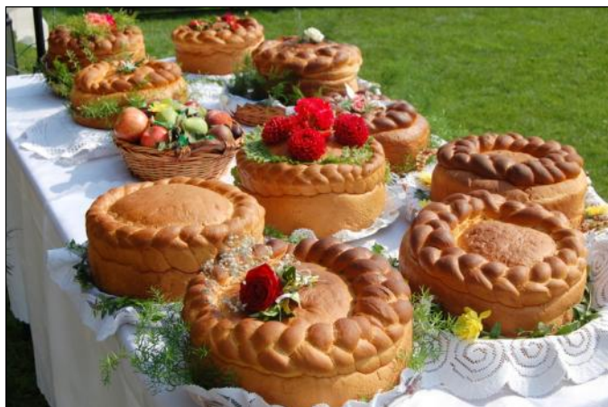
Na dożynkowym stole nie zabrakło chleba

Po ścięciu ostatnich kłosów zboża obchodzone jest uroczyste święto plonów, obrzędowe zakończenie zbioru płodów ziemi.