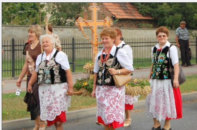
Delegacja wieńcowa z Grodziska Dolnego

W nabożeństwie uczestniczyły delegacje gmin Powiatu Leżajskiego. Naszą gminę reprezentowało 6 sołectw, wystawiając w sumie 8 dożynkowych wieńców: trzy z Wólki Grodzkiej oraz po jednym z Grodziska Dolnego, Grodziska Dolnego „Miasta”, Opalenisk, Chodaczowa i Grodziska Nowego.