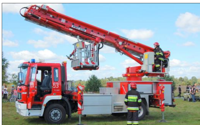
Wóz do akcji ratowniczych na wysokości