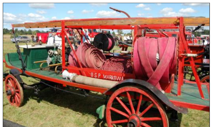
Zabytkowa sikawka - OSP Markowa