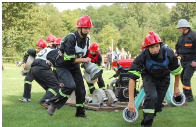
Grodziskie „złotka” w akcji