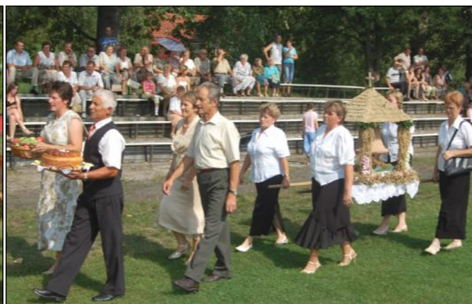
Delegacja wieńcowa z Grodziska Górnego