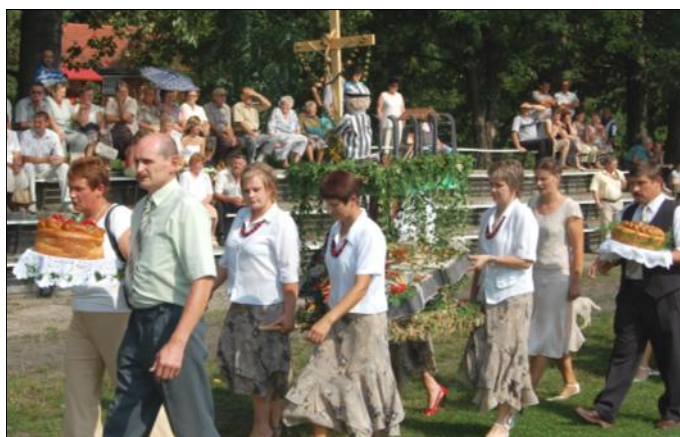
Delegacja wieńcowa z Podlesia