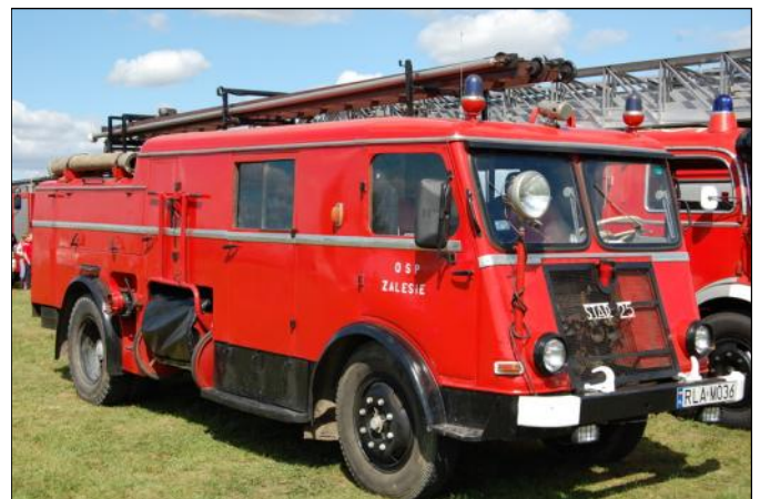
Wóz strażacki -- OSP Zalesie