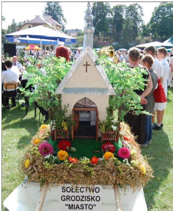
Wierne odzwierciedlenie kapliczki stojącej w Miasteczku