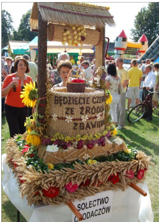
Wyklejona kłosami zbóż studnia to propozycja wienca z Łaszczyń