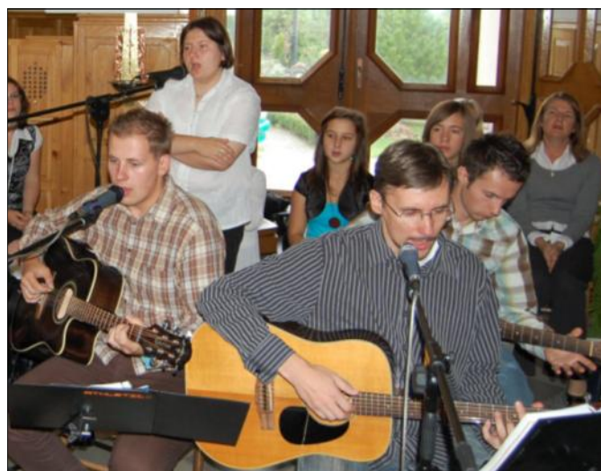
Przez trzy dni Zespół „Dla Ducha” z Piotrkowa Trybunalskiego dbał o oprawę muzyczną spotkania