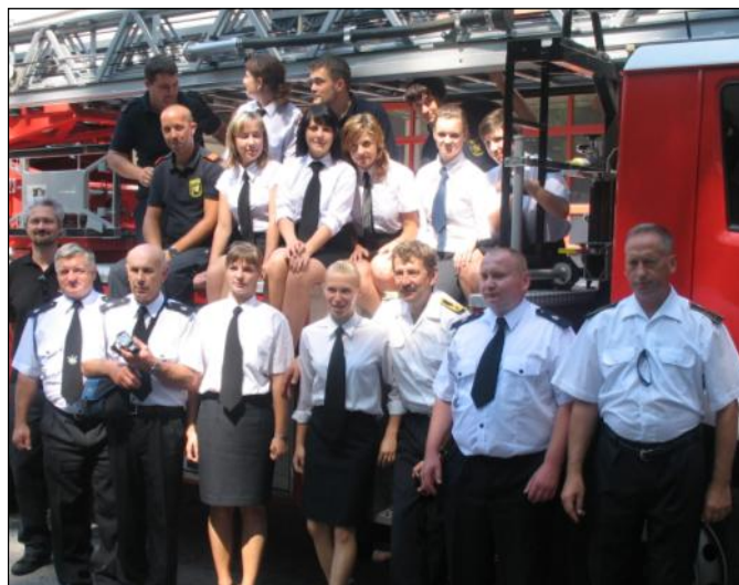
Współpraca między jednostkami stale się rozwija

Wyjazd przebiegał w miłej, przyjaznej atmosferze, a jego uczestnicy byli pod wrażeniem zorganizowania tak ciekawego pobytu w Krems.