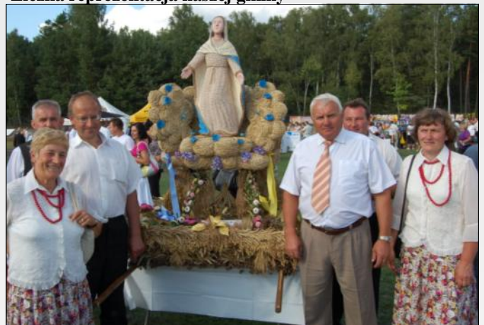
Delegacja wieńcowa z Grodziska Nowego