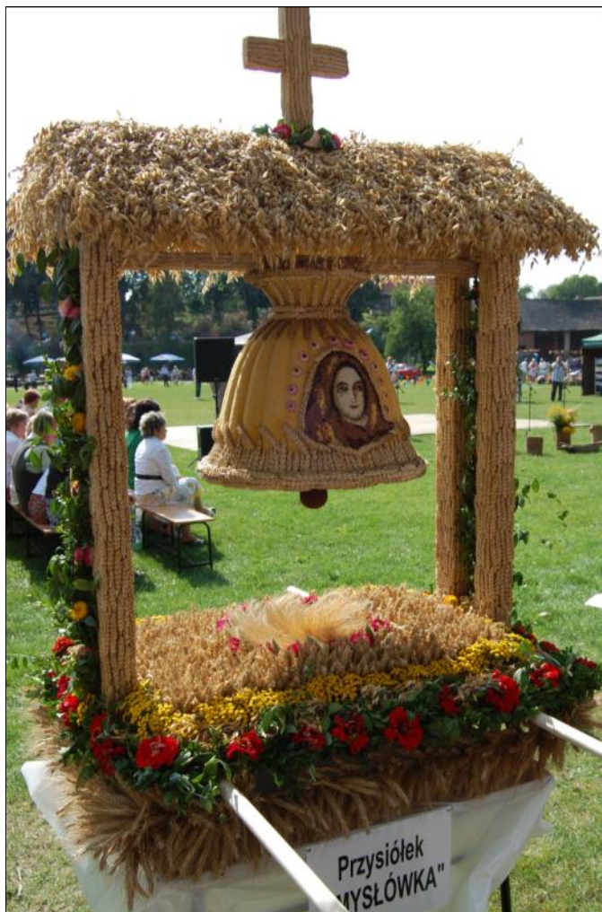
Dzwon wiszący na belkach wyłożonych kłosami