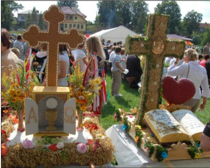
Sołectwo Zmysłówka wykonało dwa wieńce: tabernakulum z kielichem i hostią oraz wieńce w kształcie krzyża, obok serce i otwarta księga życia