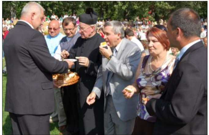
Poczęstunek chlebem i miodem