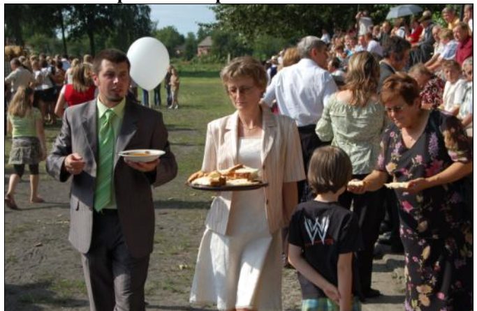
Starostwie dożynek z Grodziska Dolnego