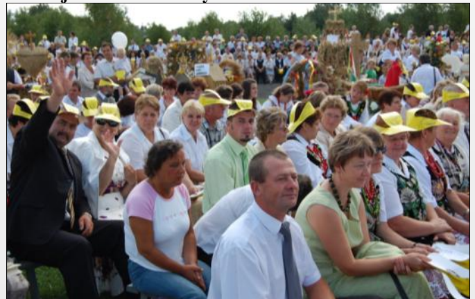
Liczna reprezentacja naszej gminy