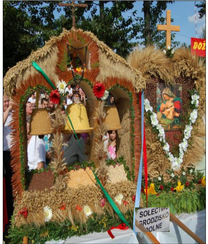
Delegacja z parafii w Grodzisku Dolnym przybyła z dwoma wieńcami: jeden w kształcie serca, drugi to odzwierciedlenie stojącej przed kościołem dzwonnicy