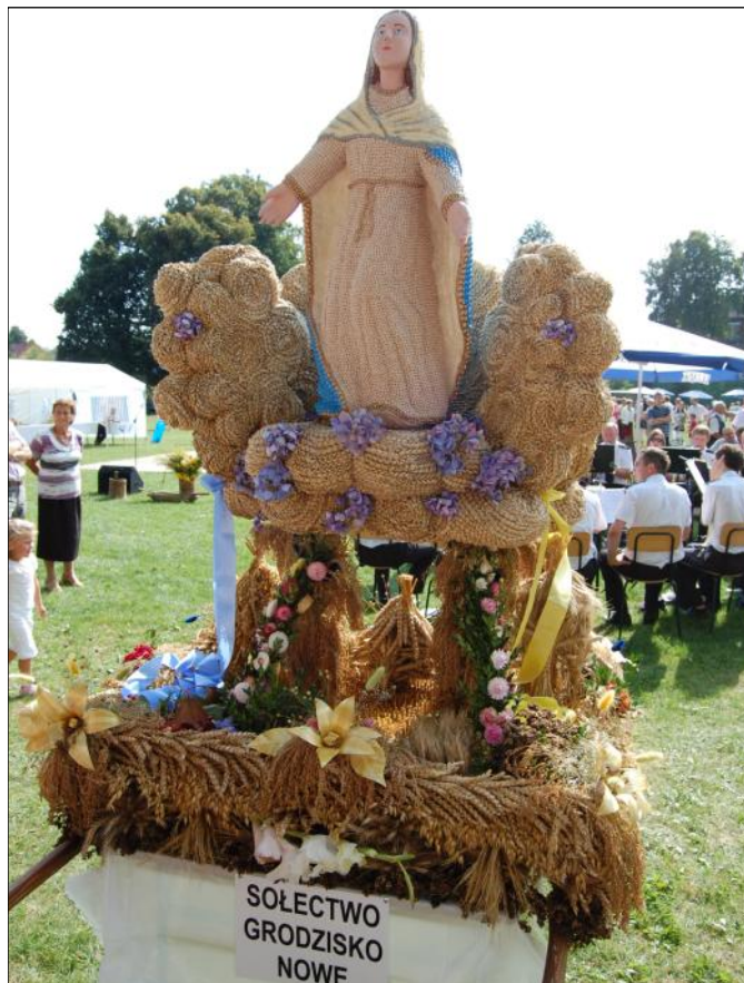
Wniebowzięcie NMP, obok wyklejone ziarnami zbóż obłoki