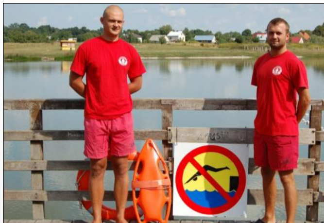
Nad bezpieczeństwem kąpielących czuwali ratownicy

Z pewnością na taki stan rzeczy miała wpływ sama obecność ratowników. Warto jednak pamiętać o tym, że wypocznikowi nad wodą powinien towarzyszyć w każdej chwili przede wszystkim