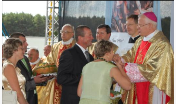
Procesja z darami ofiarnymi

Prócz delegacji wieńcowych na dożynkach zaprezentowały się również panie z Koła Gospodyń Wiejskich z Grodziska Górnego, które wystawiły przygotowane przez siebie i Koło Gospodyń z Wólki Grodzkiej tradycyjne grodziskie potrawy. Na stoisku zakosztować można było pieczonego grodziskiego chleba ze smalcem, kapusty, gołąbków z kaszą gryczaną, jaglaną i grzybowym sosem oraz weselnych szyszek i ciast.