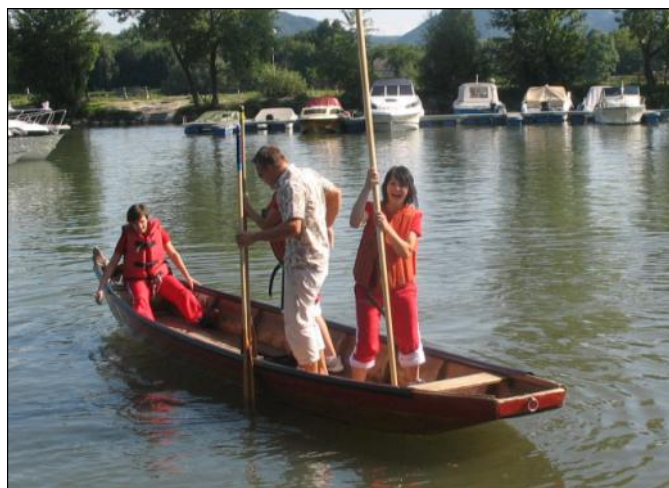
Pływanie po Dunaju to tylko jedna z wielu atrakcji jakie strażacy z Krems przygotowali dla naszych dziewczyn