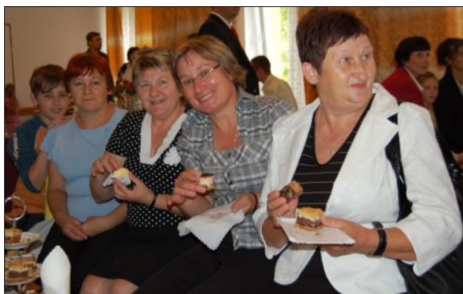
Misyjne ciasta rozchodziły się jak ciepłe bułeczki