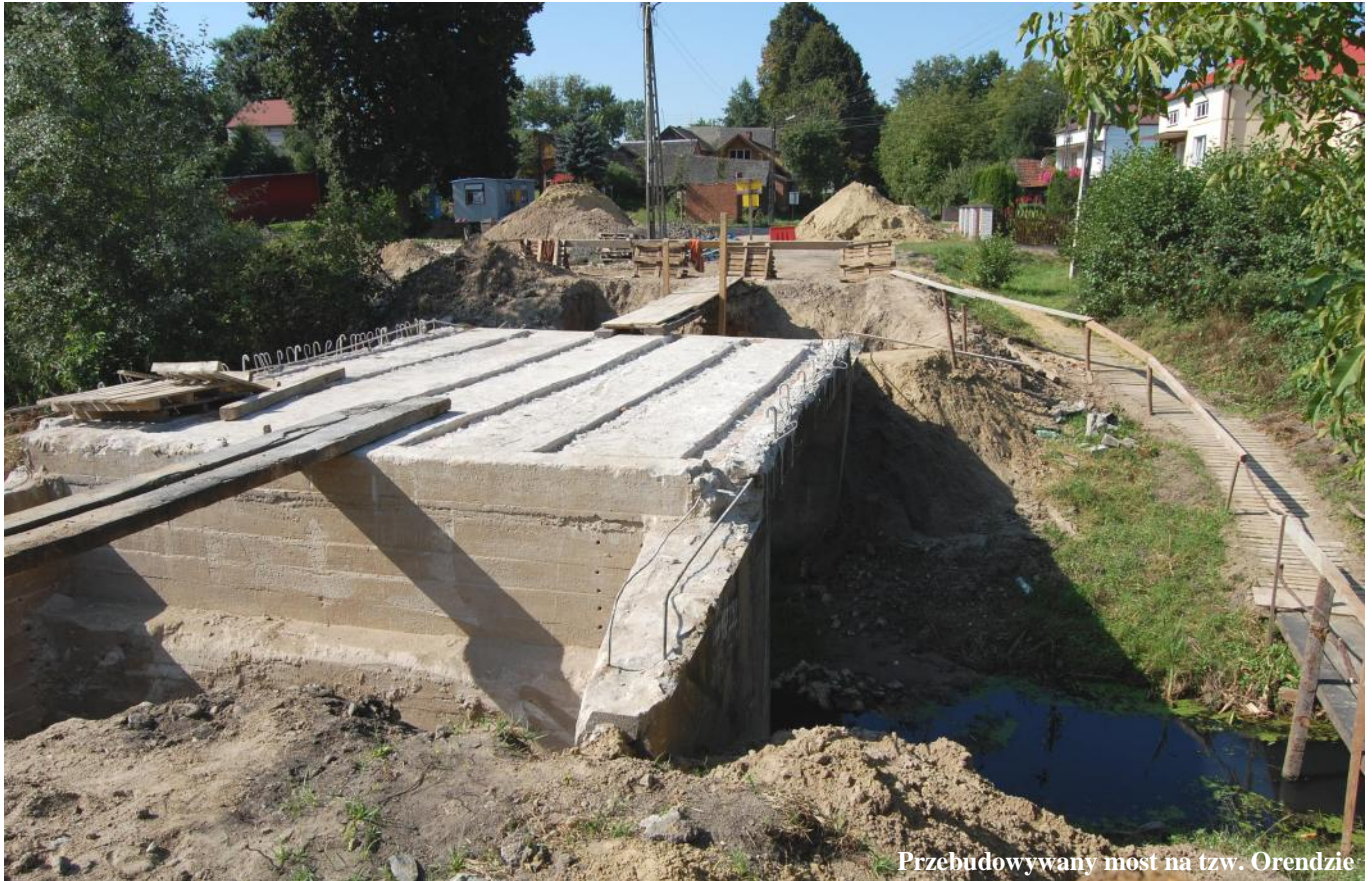
Przebudowywany most na tzw. Orendzie

Dobiega końca realizacja pierwszej z dwóch prowadzonych przez powiat leżajski na terenie naszej gminy inwestycji drogowych.