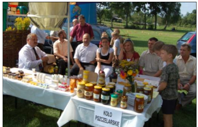
Stanowisko z produktami pszczelimi