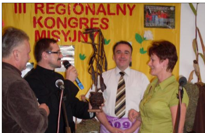
Szczęśliwi posiadacze wylicytowanego podczas aukcji waniliowego drzewka