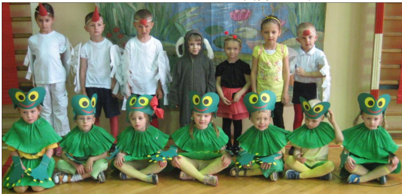
Piękne stroje i odpowiednia sceneria sprawiły, że dzieci wczuły się w swoje role