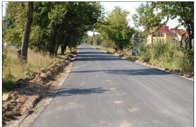
Zmodernizowany odcinek drogi Tryńcza-Chodaczków