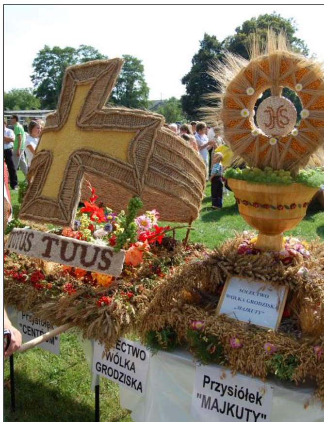
Tegoroczne wieniec z Wólki przedstawiają kielich z hostią i papieski pierścień