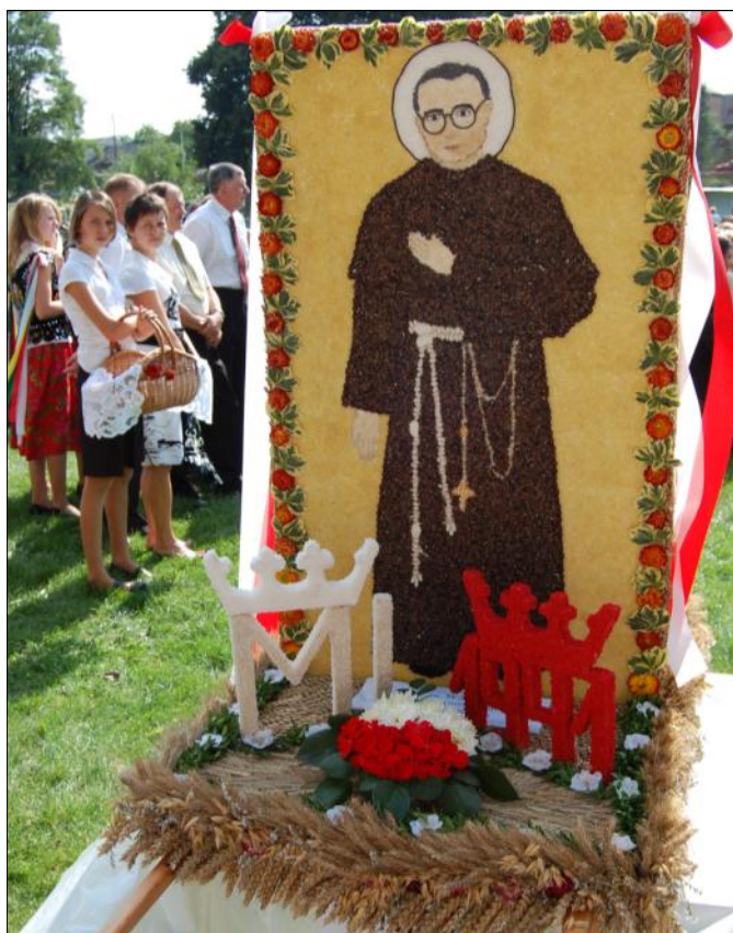
Św. Maksymilian Maria Kolbe, patron parafii Wólka Grodziska - wieniec mieszkańców tzw. Podwólcza