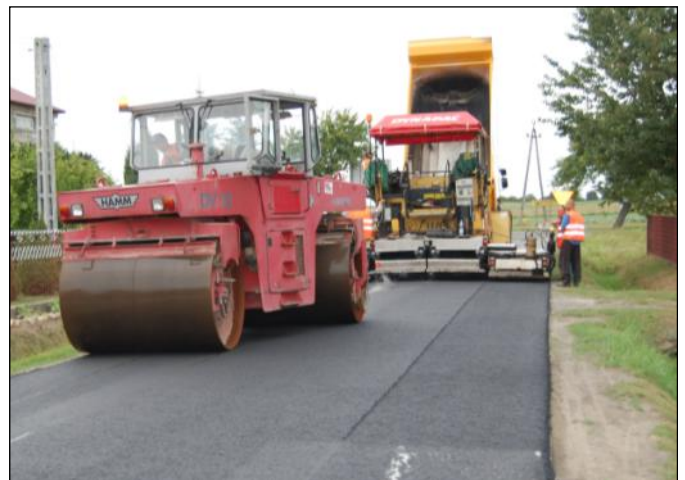
W najbliższym czasie usypane zostaną pobocza

Modernizacja obu dróg prowadzona jest w ramach Regionalnego Programu Operacyjnego Województwa Podkarpackiego na lata 2007-2013.