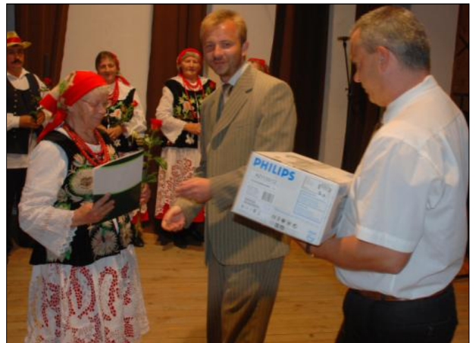
Najbardziej zasłużeni członkowie zespołu otrzymali nagrody rzeczowe

W tym miejscu należy wspomnieć o ostatnich osiągnięciach i sukcesach tegoż zespołu. Niespełna dwa miesiące temu „Grodziszczoki” uhonorowane zostały Łowickim Pasiakiem - Nagrodą Główną VIII Ogólnopolskich Spotkań Folklorystycznych w Łowiczu, a dwa dni później 30 czerwca zespołowa delegacja odbierała w Rzeszowie, z rąk Marszałka