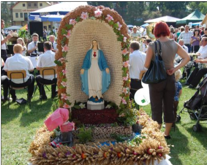
Wieniec z Grodziska Górnego przedstawia objawienie się Matki Bożej Św. Bernadecie