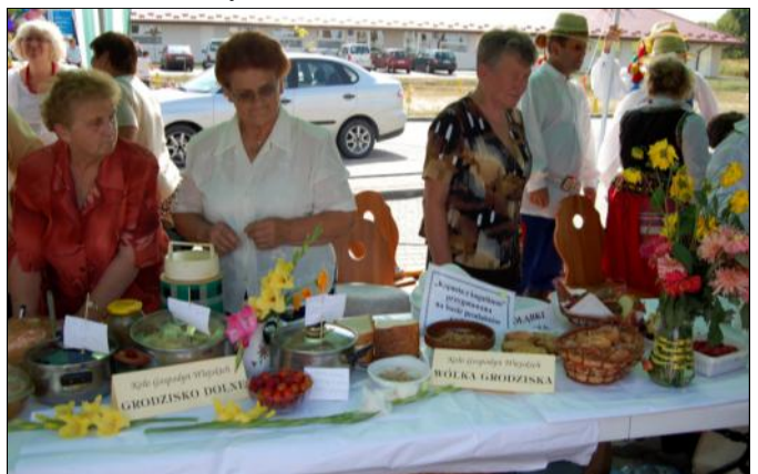
Na grodzkim stole królowały gołąbki, pierogi, kapusta z grochem i opionki z serem