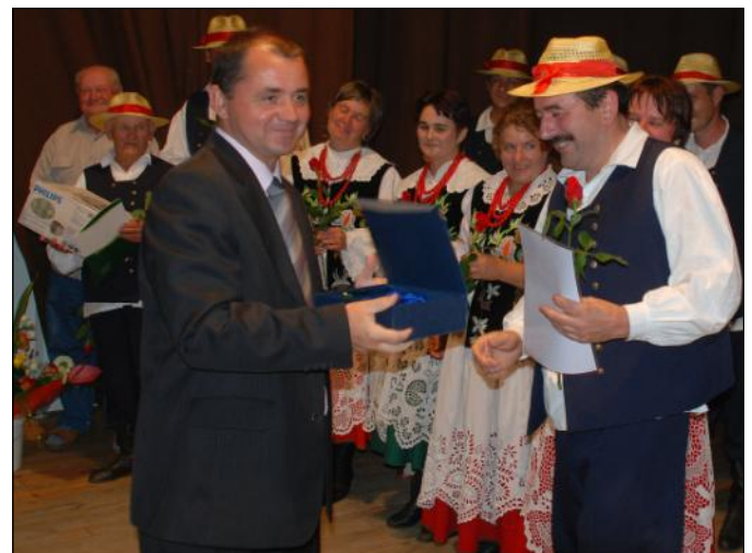
Na jubileuszu „Grodziszczoków” nie zabrakło i naszego posła