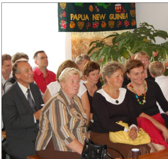
Lewa strona sali aktywnie uczestniczyła w licytacji misyjnych przedmiotów