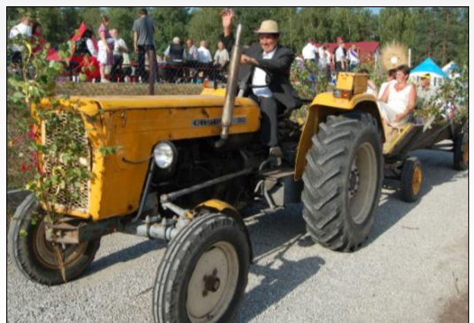
Powrót uczestników dożynek