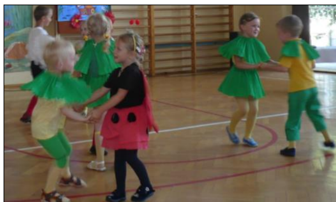
Dzieci uczą się poprzez zabawę

Uczestnicy spotkania życzyli sobie aby dzieci miały możliwość kontynuacji edukacji przedszkolnej np. poprzez udział w następnych projektach dla przedszkoli dofinansowanych przez UE. AC