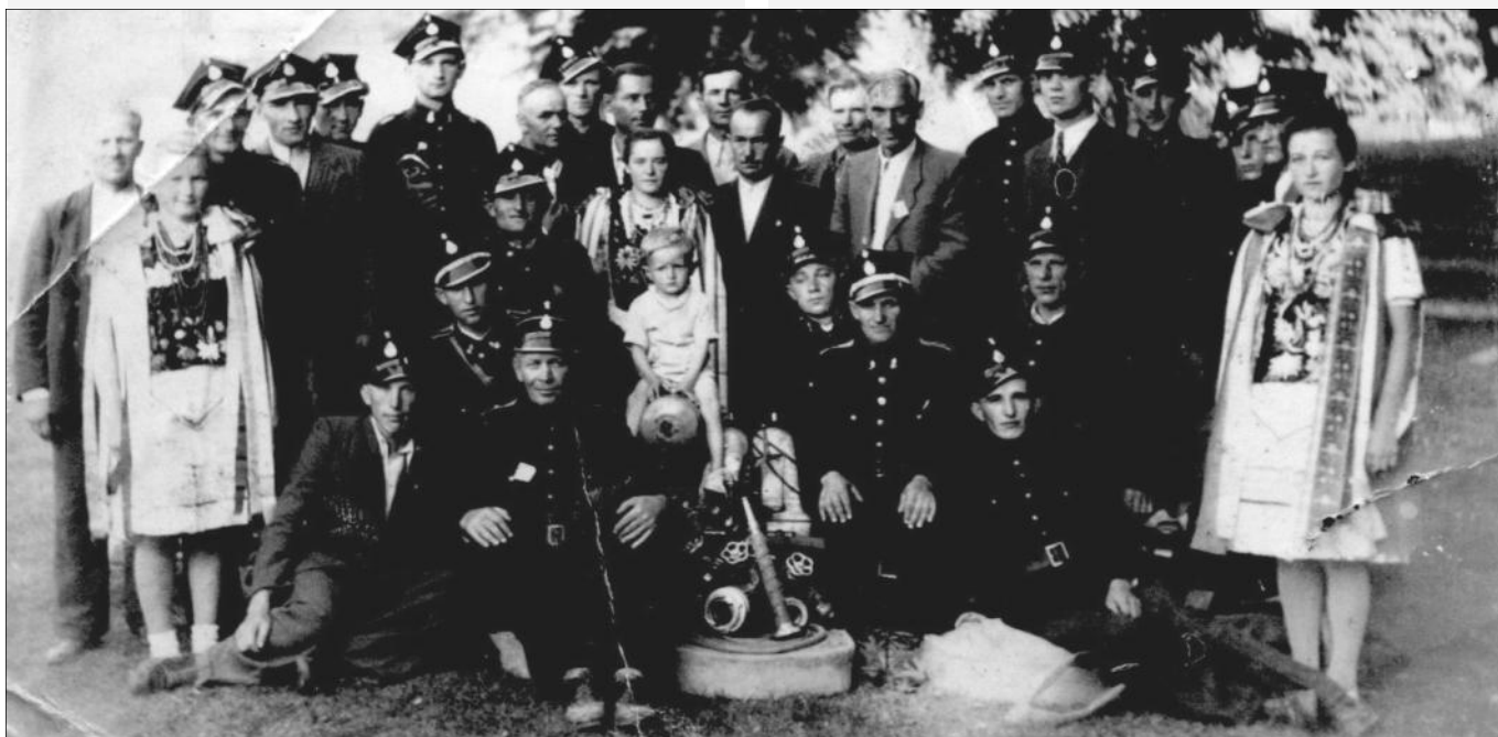
Zakup pompy strażackiej dla jednostki OSP Grodzisko Górne

Zarząd OSP ściśle współpracował z Zarządem Gminy w Grodzisku Dolnym, który w miarę możliwości wspierał działalność naszej OSP, pokrywając znaczną część kosztów prowadzonych prac remontowych. Prace na przestrzeni ostatnich lat prowadzone były na szeroką skalę a wiele z nich jednostka finansowała w własnym zakresie, z dochodów za wynajmem sali i z wpływów w wyniku organizowania dyskotek.