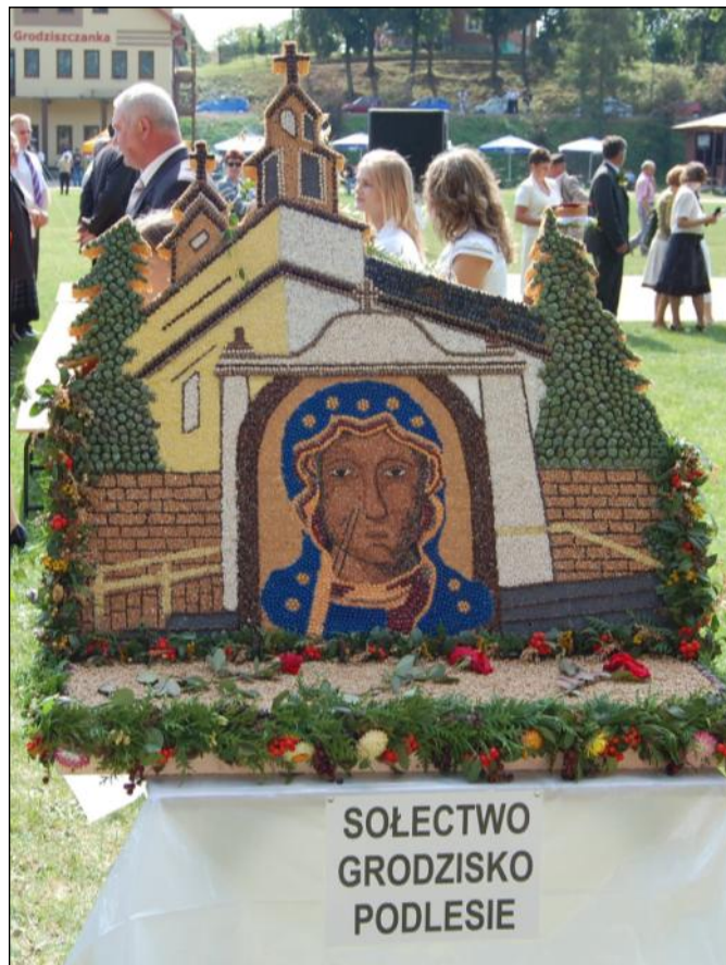
Wieniec przedstawia kontury kościoła, na tle którego widnieje wizerunek |Matki Boskiej Częstochowskiej

Piękna pogoda i dobra zabawa sprawiły, że publiczność bawiła się do późnych godzin na wieczornym festynie. MH