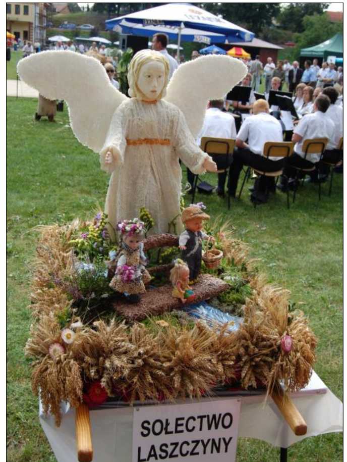
Anioł Stróż czuwający nad bezpieczeństwem dzieci przechodzących kładką przez rzekę