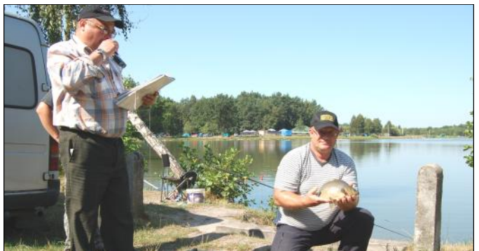
Taką rybą mógł się pochwalić zwycięzca