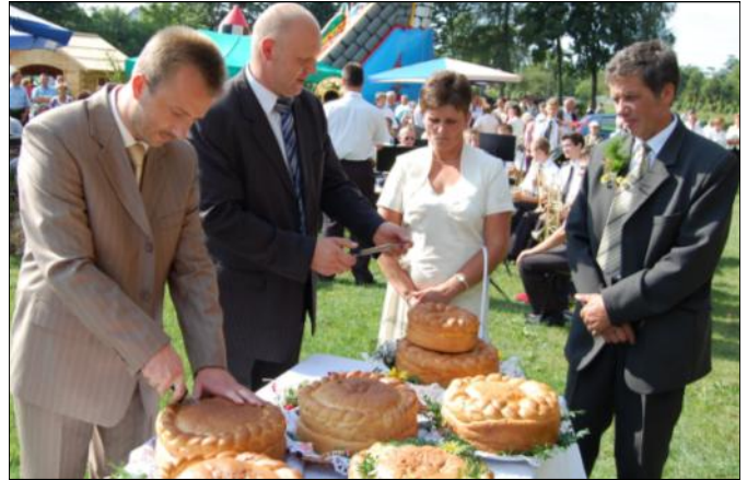
Dzielenie dożynkowych chlebów

Zgromadzeni na stadionie uczestnicy dożynek mieli okazję spróbować nie tylko chleba, ale również miodu z pasiek grodziskich pszczelarzy. Było