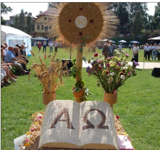
Wieniec w kształcie monstrancji - sołectwo Opaleniska