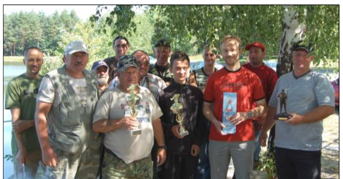
Uczestnicy tegorocznych zawodów wędkarskich