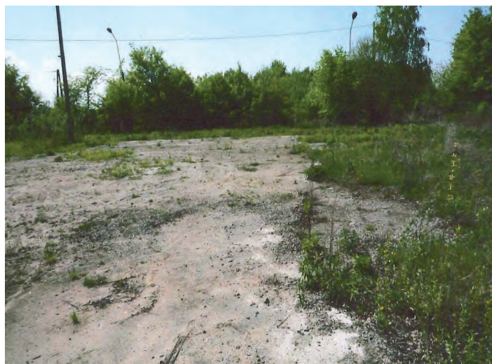
Działka oznaczona nr 1042/3 o pow. 0.3254 ha w Chodaczkowie

Przetarg odbędzie się w dniu 27 września 2013 roku (piątek) o godz. 10.30 w Urzędzie Gminy Grodzisko Dolne (pokój nr 5).