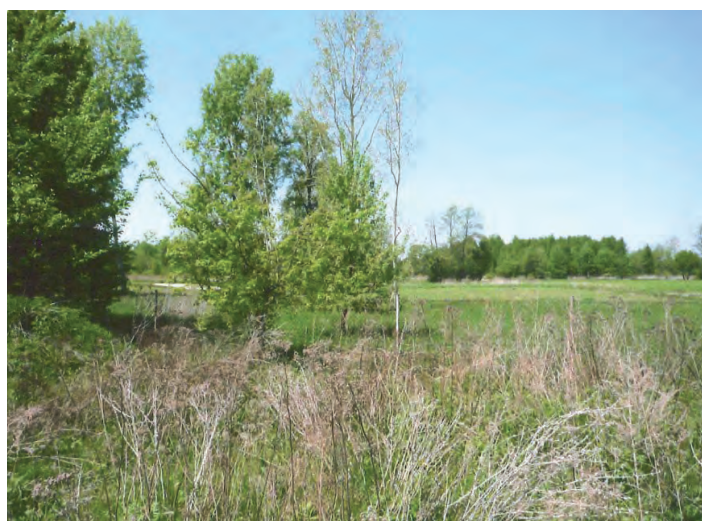
Działka oznaczona nr 1042/5 o pow. 0.1944 ha w Chodaczkowie

Przetarg odbędzie się w dniu 27 września 2013 roku (piątek) o godz. 11.00 w Urzędzie Gminy Grodzisko Dolne (pokój nr 5).