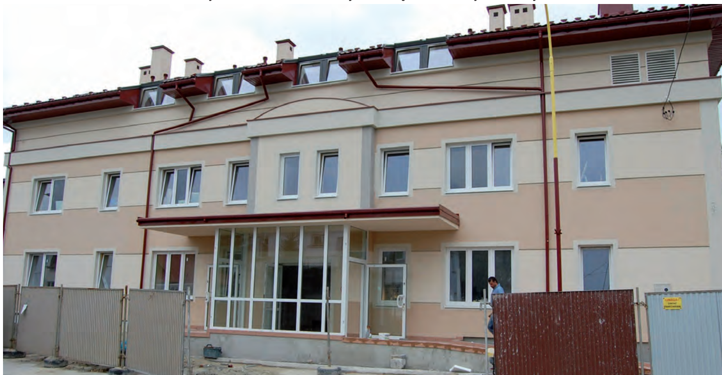
Ośrodek Kultury w Grodzisku Dolnym - sierpień 2013r.