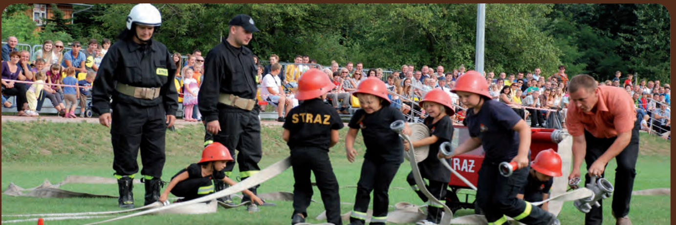
W trakcie tegorocznych pokazów obejrzelśmy pokaz „specjalnej” drużyny