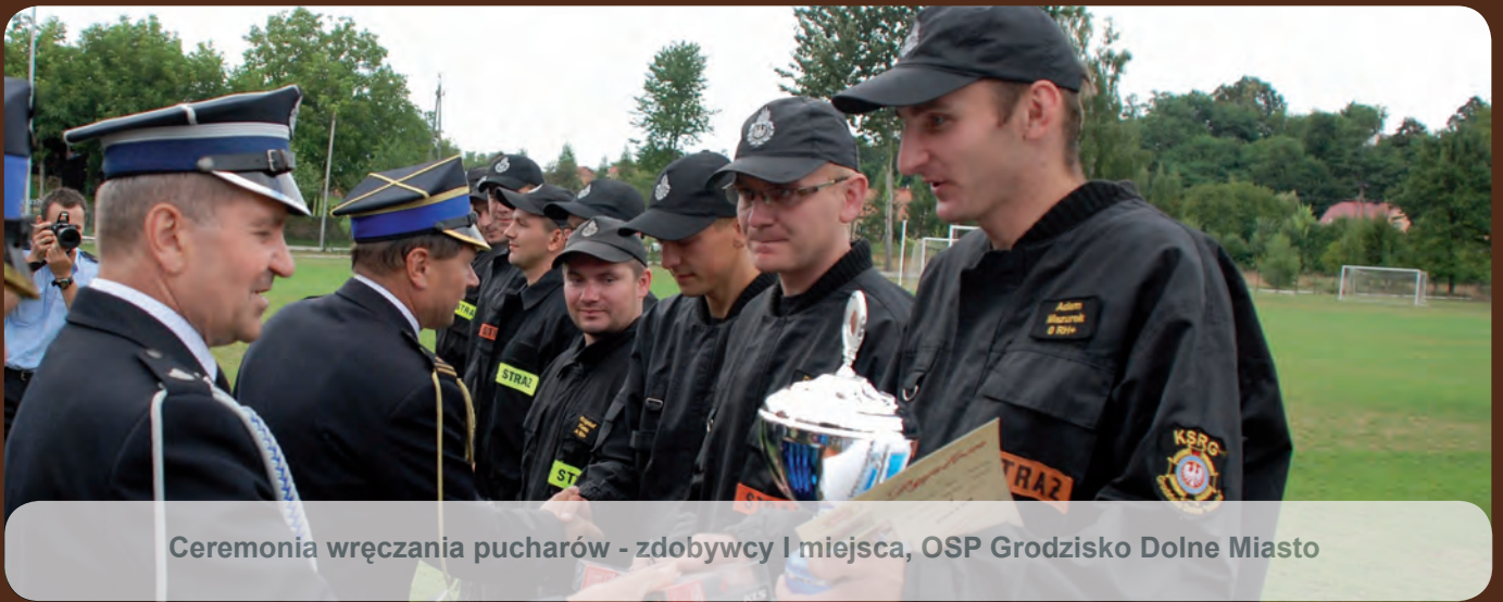
Ceremonia wręczenia pucharów - zdobywcy I miejsca, OSP Grodzisko Dolne Miasto