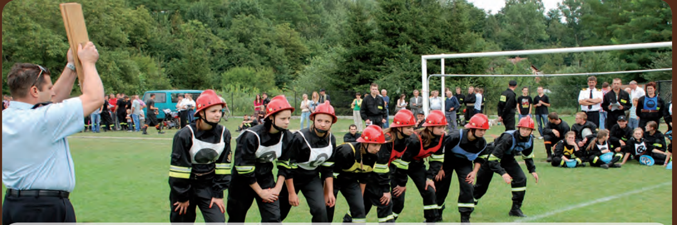
...i wystartowały - drużyna „Grodziskich Złotek”