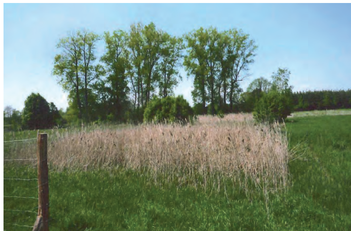
Działka oznaczona nr 180 o pow. 0.0978 ha w Chodaczkowie

Przetarg odbędzie się w dniu 27 września 2013 roku (piątek) o godz. 10.00 w Urzędzie Gminy Grodzisko Dolne (pokój nr 5).