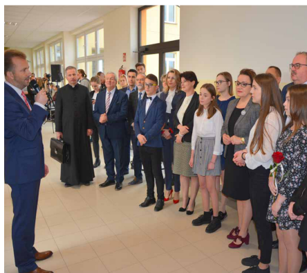
Regionalne Centrum Robotyki Szkolnej w Grodzisku Górnym otwarte