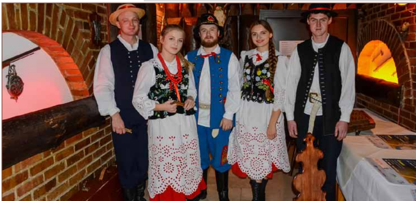
Grodziscy cymbaliści zdominowali rzeszowski konkurs