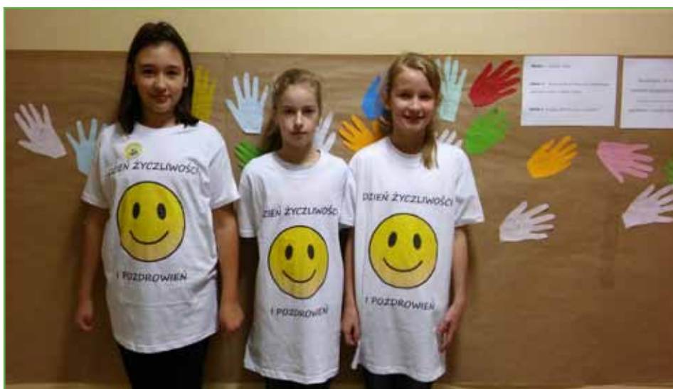
Czasami wstarczy zwykłe „cześć” by na twarzy drugiego człowieka pojawił się uśmiech