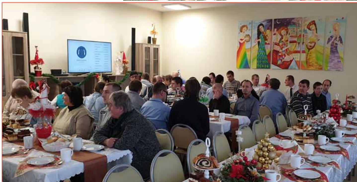
Siedząc przy wspólnych stołach wspominano mijający rok

Kierownik, uczestnicy i terapeuci Środowiskowego Domu Samopomocy w Laszczymach i Filia w Zmysłówce