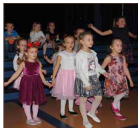
Balowe stroje nie przeszkadzały w świetnej zabawie, do której zachęcała pani wodzirej