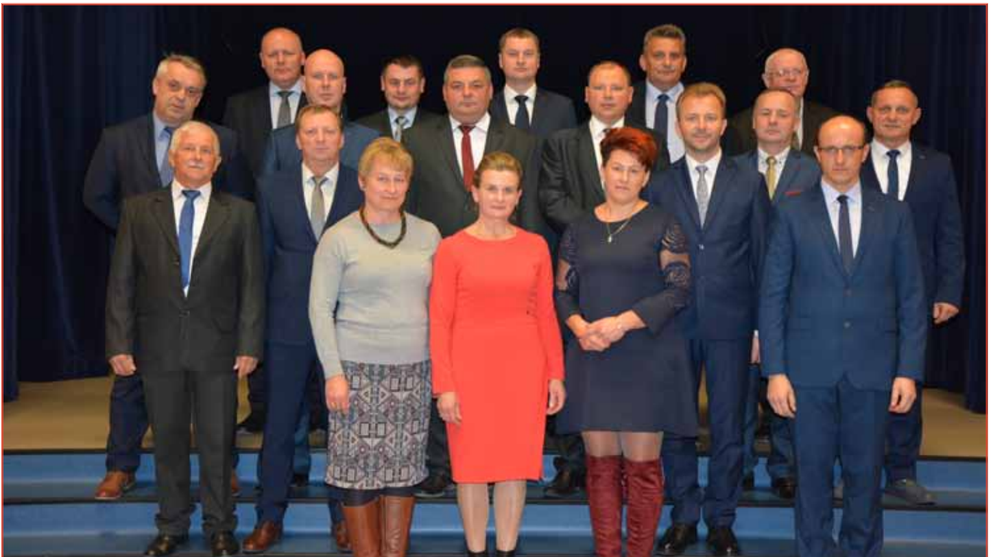
Nowa Rada Gminy Grodzisko Dolne