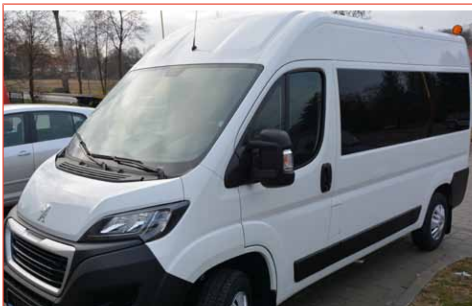
Nowy peugeot to trzeci samochód na stanie ośrodka

Gminne placówki ŚDS liczą 53 osoby, do przewozu których służą 3 samochody. Wkład własny gminy w zakup nowego pojazdu to prawie 87 tys. zł.