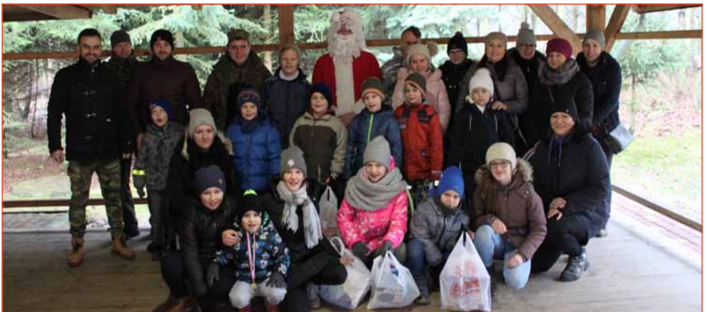
Nagrody i prezenty uczestnikom turnieju wręczył Święty Mikołaj