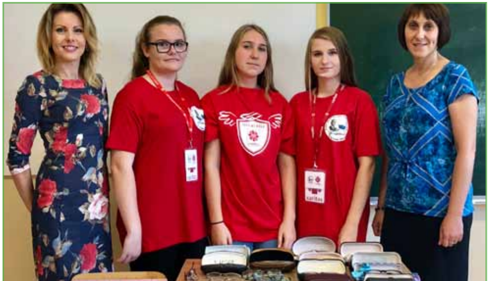
Kiedy komuś pomagamy, pomagamy także sobie - stajemy się lepsi