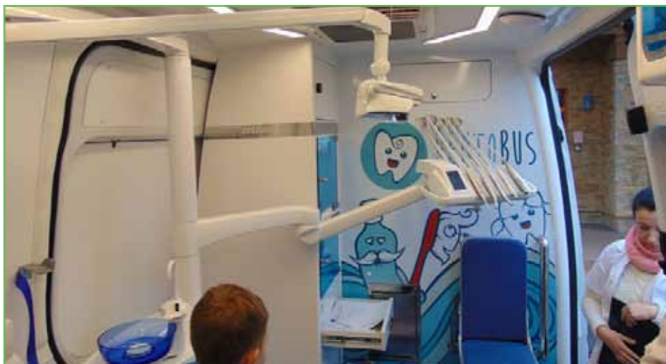
Wizyta w dentobusie jest mniej stresująca niż w tradycyjnym gabinecie

Badanie obejmowało przegląd jamy ustnej uczniów, w czasie którego oznaczano wskaźnik intensywności próchnicy, ocenę stanu przyzębia i zgryzu oraz udzielono indywidualnego instruktażu w zakresie higieny jamy ustnej i zasad prawidłowego odżywiania.