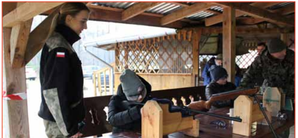
Tego dnia można było sprawdzić swoje umiejętności strzeleckie