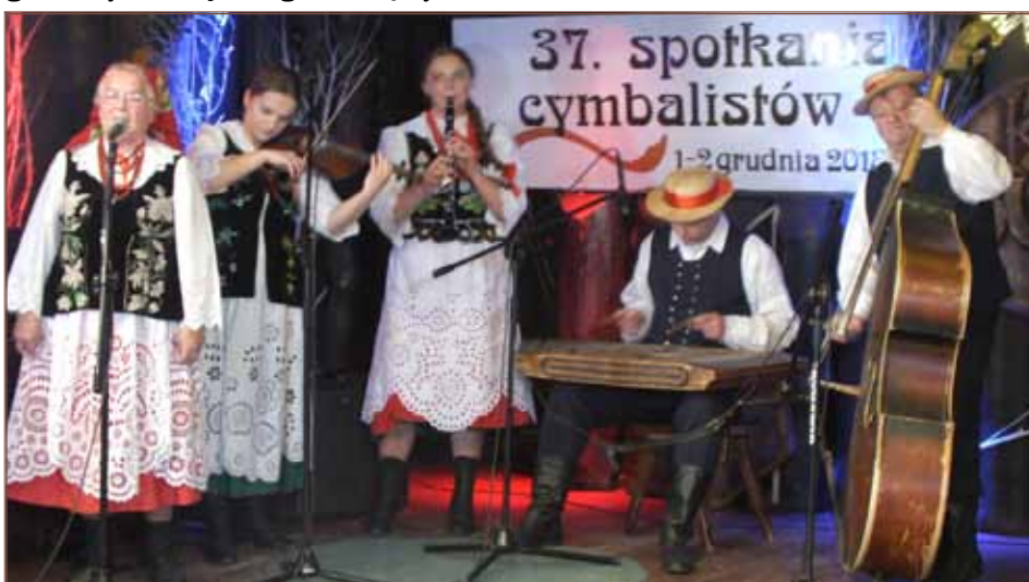
Trzecie miejsce dla grodziskich kapel