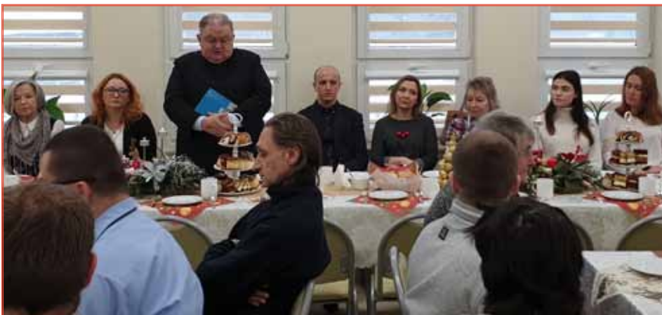
Spotkanie przy świątecznym stole to już tradycja w ośrodku