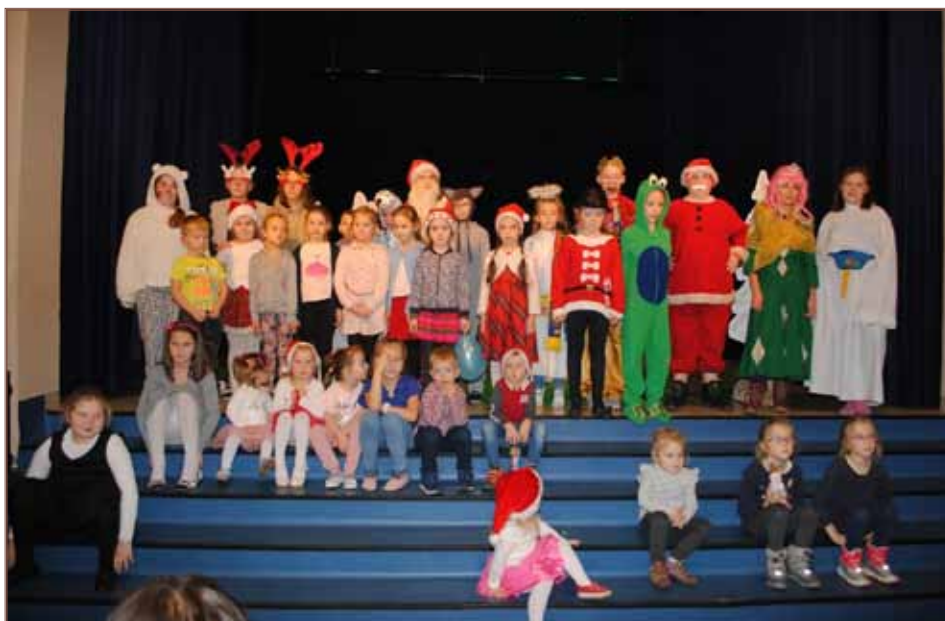
Uczestnicy spotkania wspólnie poszukiwali śladów Świętego Mikołaja