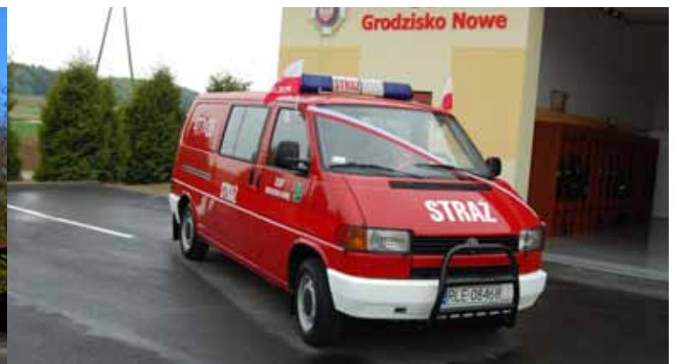
Volswagen Transporter T-4