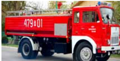
Jelcz 010 GCBA