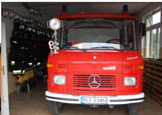
Mercedes Benz L608W