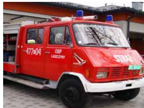
STEYR 590.132 rok prod. 1981