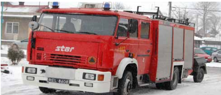
Jelcz/Star - 200