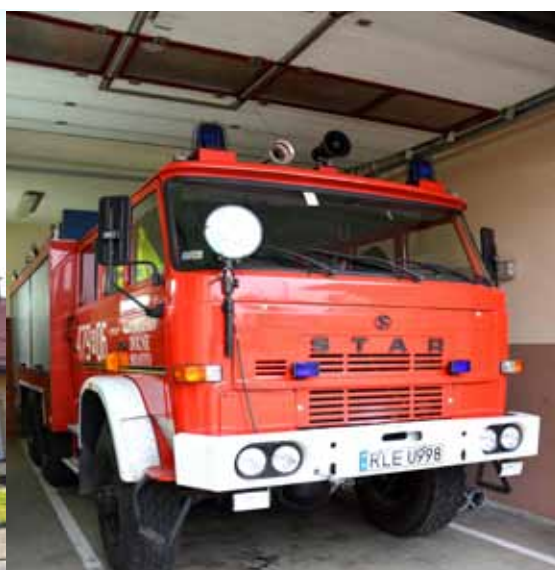
STAR 200 rok prod. 1989