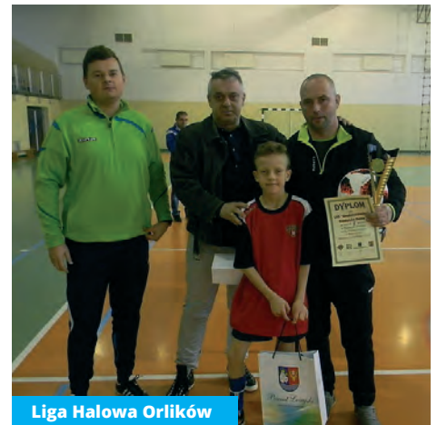
Liga Halowa Orlików