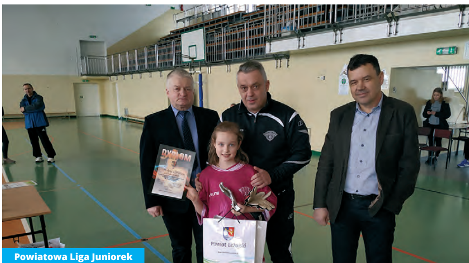
Powiatowa Liga Juniorek