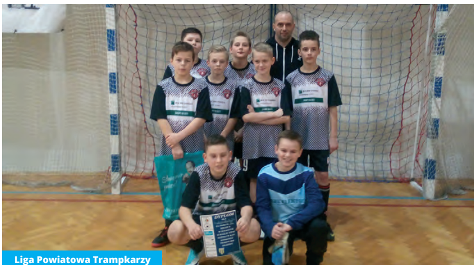
Liga Powiatowa Trampkarzy