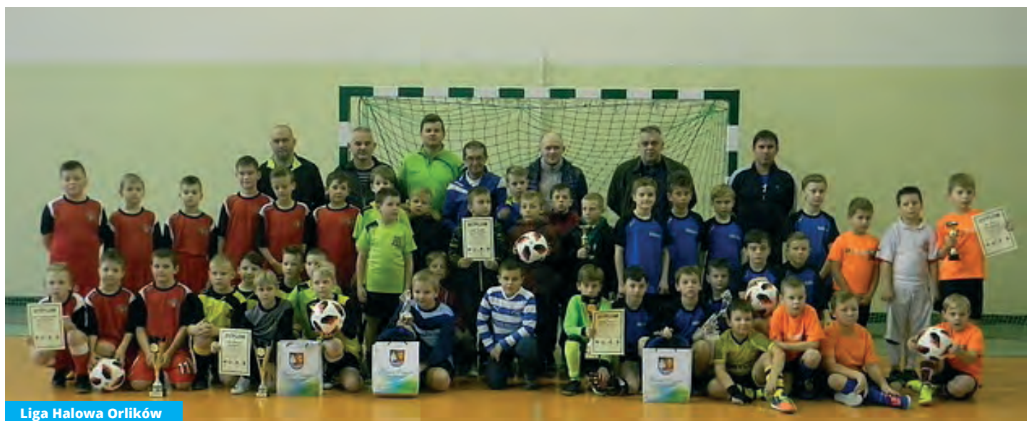
Liga Halowa Orlików