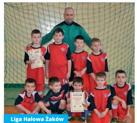
Liga Halowa Żaków