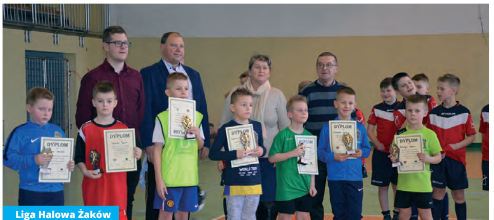
Liga Halowa Żaków