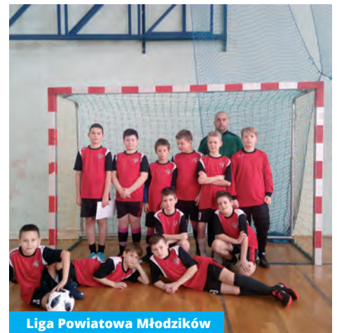
Liga Powiatowa Młodzików