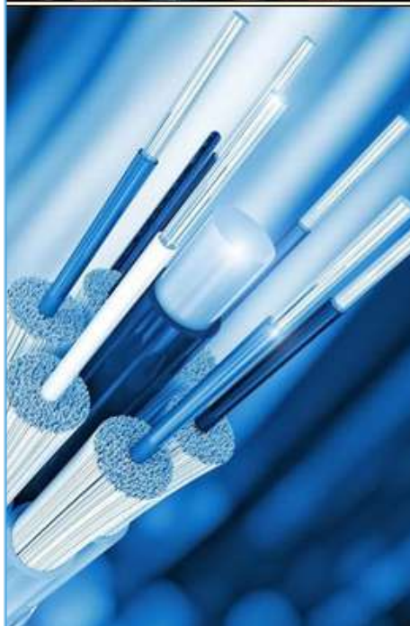
Piasek pod mikroskopem i światłowód