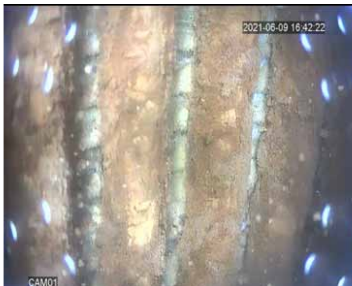
Wnętrze studni przed regeneracją