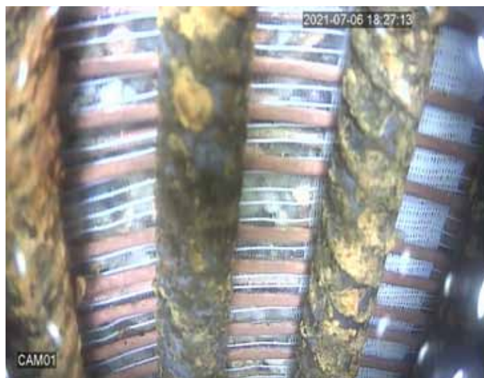
Wnętrze studni po regeneracji