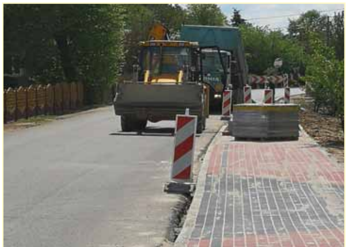
Droga w trakcie przebudowy