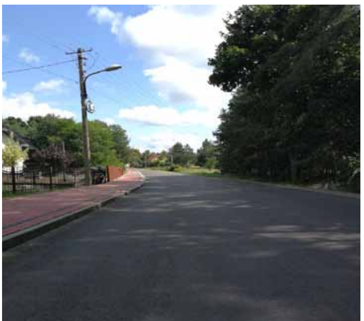
Droga po przebudowie