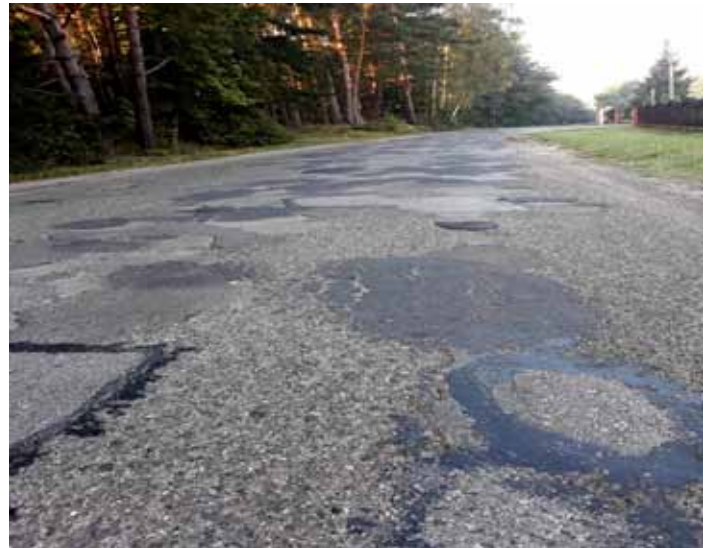
Droga przed przebudową