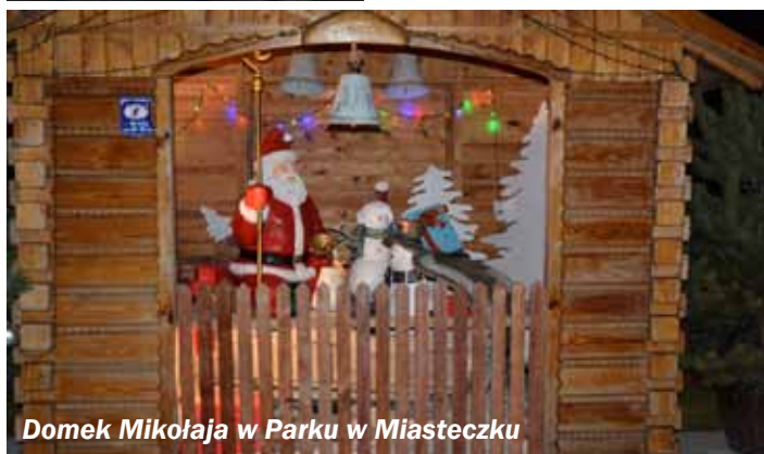
Domek Mikołaja w Parku w Miasteczku