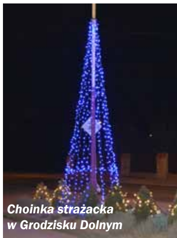
Choinka strażacka w Grodzisku Dolnym