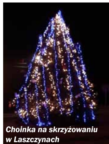
Choinka na skrzyżowaniu w Laszczynach