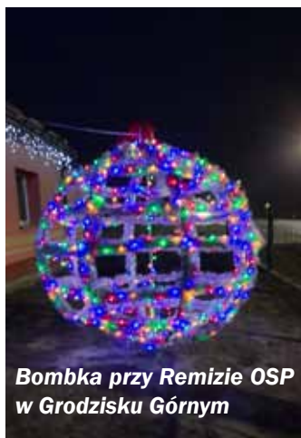
Bombka przy Remizie OSP w Grodzisku Górnym