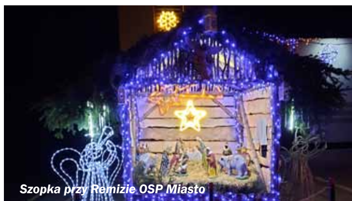
Szopka przy Remizie OSP Miasto