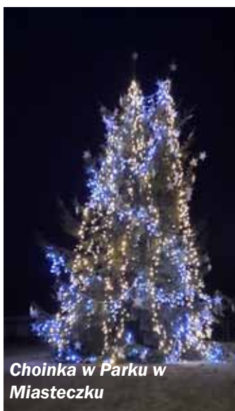
Choinka w Parku w Miasteczku