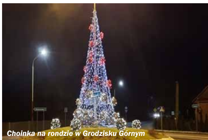
Choinka na rondzie w Grodzisku Górnym