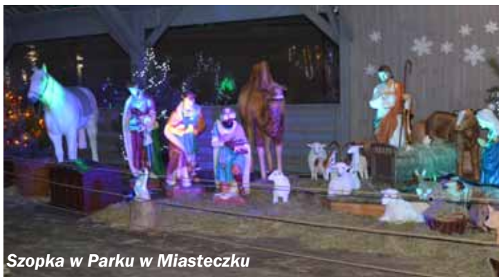
Szopka w Parku w Miasteczku

Składamy serdeczne podziękowania wszystkim osobom, które zaangażowały się i pomagały w przystrajaniu naszych ulic i miejsc w tym czasie.