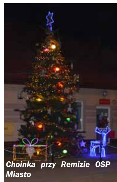
Choinka przy Remizie OSP Miasto