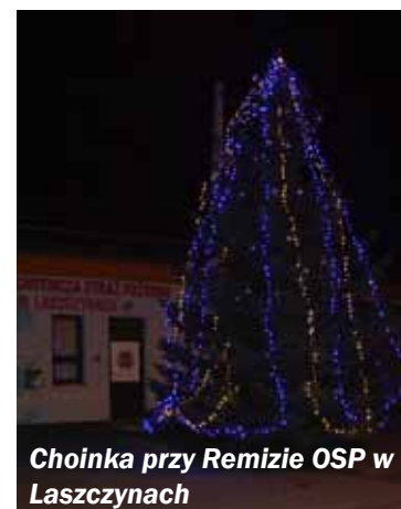
Choinka przy Remizie OSP w Laszczynach