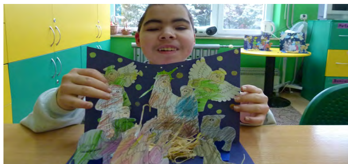
Każdy miał swój pomysł na szopkę

Już w IV wieku w grocie betlejemskiej powstał żłóbek upamiętniający narodziny Jezusa. Kilka lat później szopka powstała w Rzymie. Tradycja szopek bożonarodzeniowych rozwinęła się dzięki św. Franciszkowi z Asyżu, który zbudował stajenkę, wykorzystując żywe zwierzęta i odtwarzając sceny z narodzenia Jezusa. Obecnie w każdej parafii z okazji świąt Bożego Narodzenia w świątyniach ustawiane są szopki, niektóre bardzo bogate i okazałe. Także wychowankowie naszego ośrodka, będąc jeszcze w świątecznych nastrojach, wykonali szopki bożonarodzeniowe z różnych materiałów.