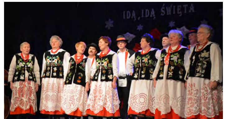
Zespół Regionalny „Grodziszczoki”