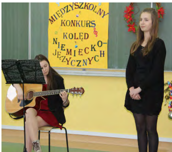
Tradycja śpiewania kolęd po niemiecku dobrze przyjęła się wśród uczniów