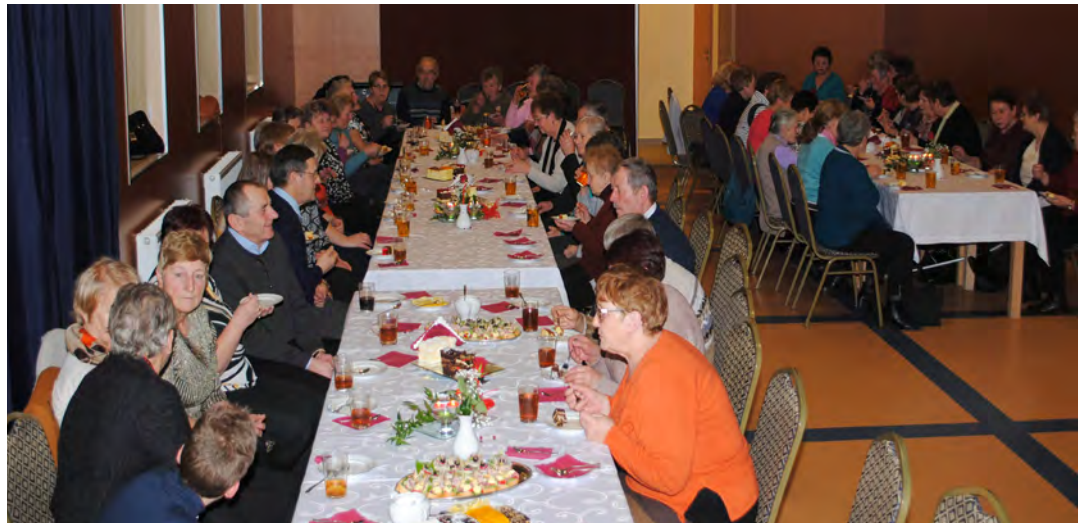
Towarzystwo seniorzy wchodzą w Nowy Rok

Spotkanie miało charakter świąteczno-noworoczny. Był śpiew kolęd i noworoczne życzenia. Specjalnie dla seniorów, ze spektaklem teatralnym poświęconym życiu i twórczości H. Sienkiewicza, wystąpiła grupa teatralna z Zespołu Szkół z Grodziska Dolnego. Seniorki wysłuchały