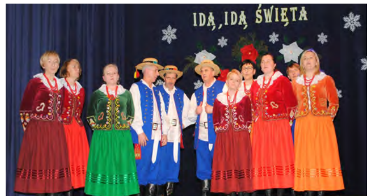
Zespół Wokalny „Złoty Potok”