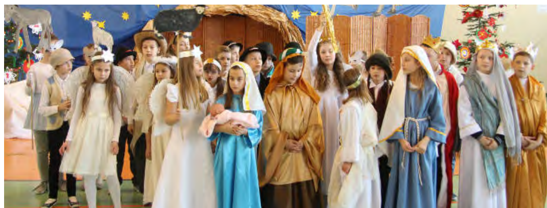
Młodzi aktorzy perfekcyjnie przygotowali się do swoich ról