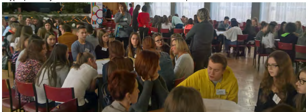
Tematyka zajęć dotyczyła bezpieczeństwa w sieci