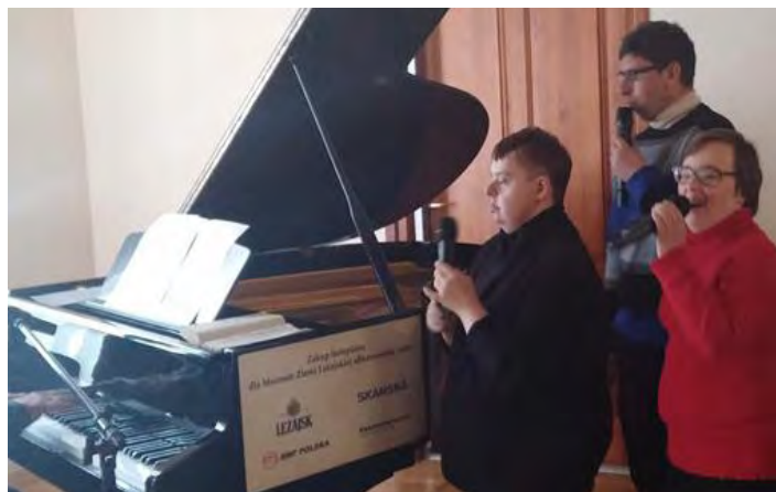
Nic nie brzmi tak pięknie jak polskie kołędy