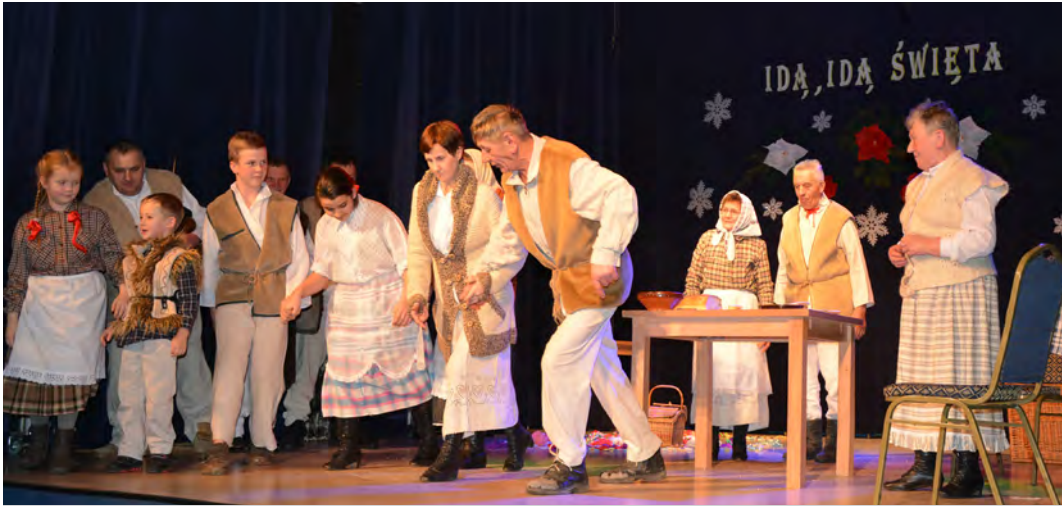
Zespół „Leszczyńska” w widowisku kolędniczym