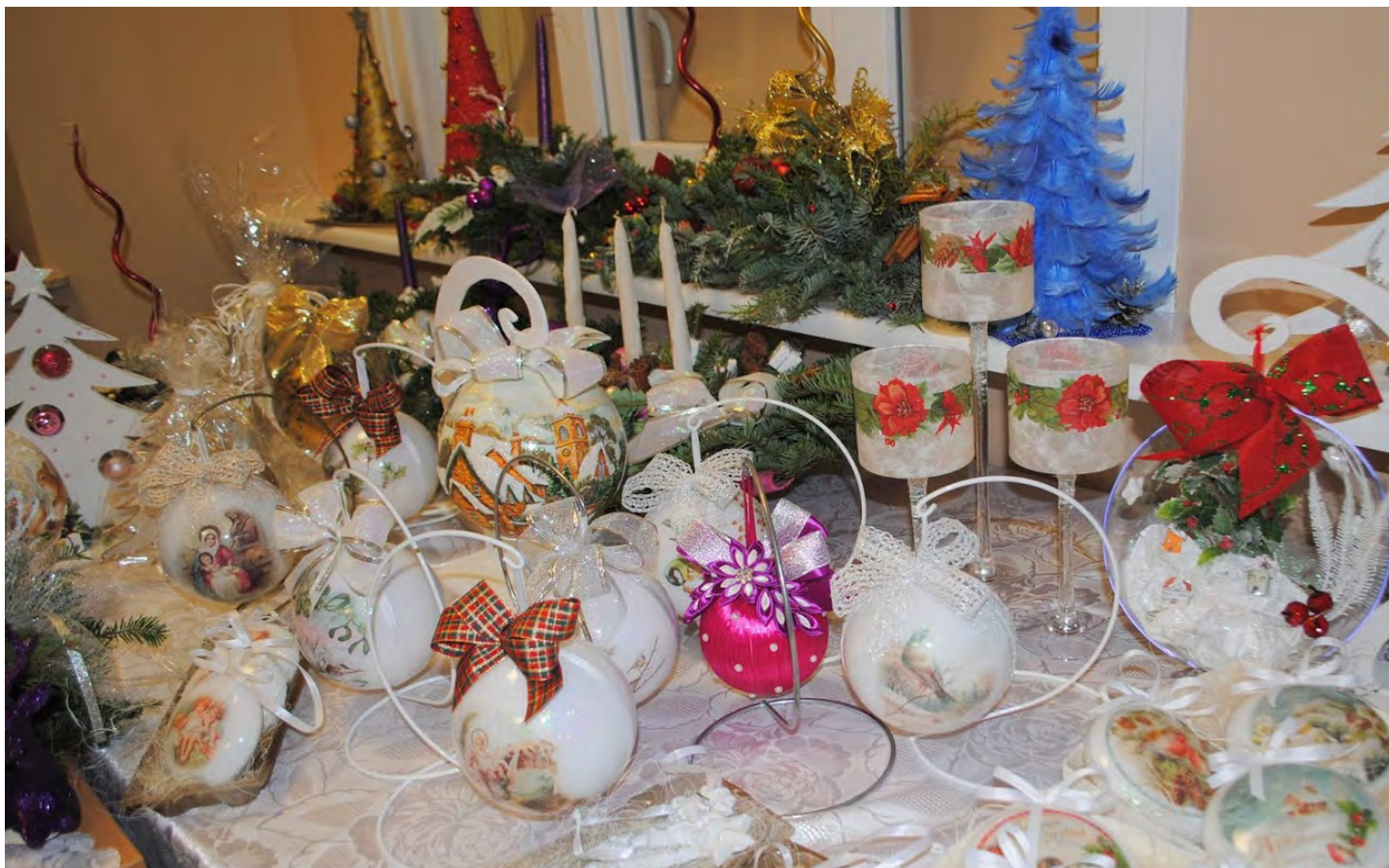
Kiermasz świątecznych ozdób wykonanych przez Środowiskowe Domy Samopomocy