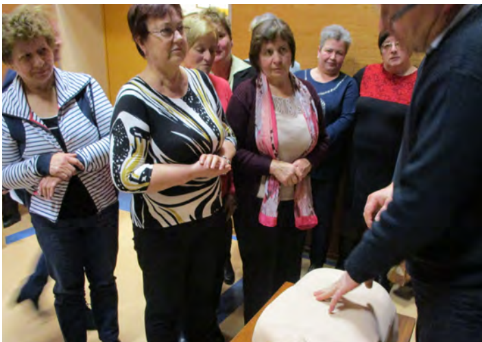
Warto wiedzieć jak udzielić pierwszej pomocy