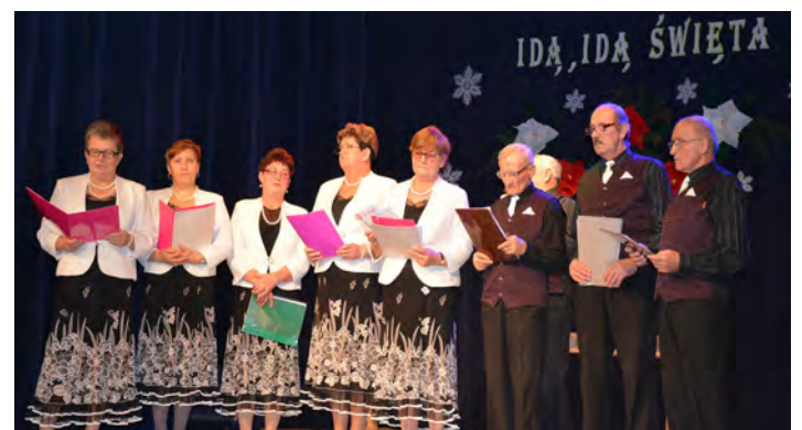
Zespół Śpiewaczy „Wiola” z Chodaczowa