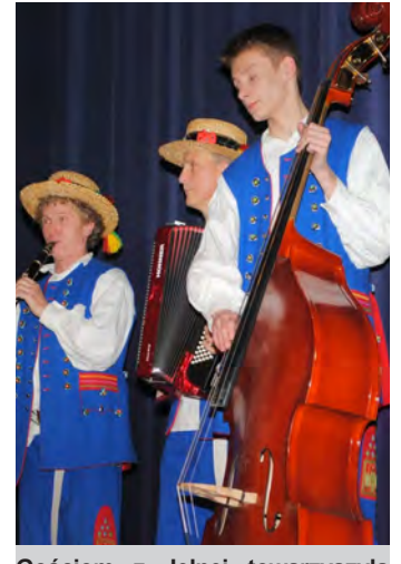
Gościom z Jelnej towarzyszyła kapela