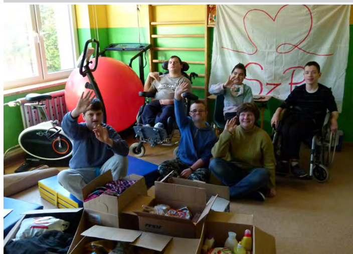
Pomocników do zrobienia szlachetnej paczki nie brakowało