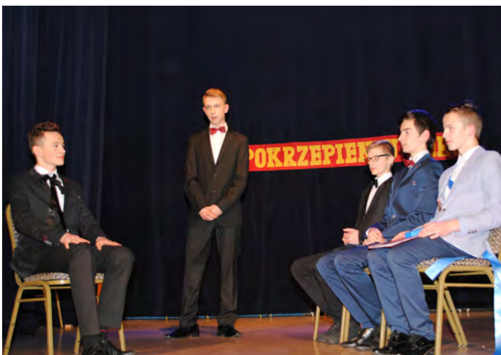
Spektakl o H. Sienkiewiczu dla seniorów