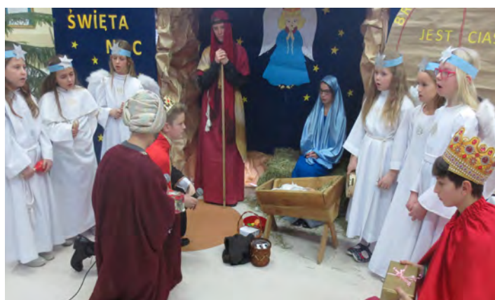
Przedstawieniem młodzież przypomniała historię świętej rodziny