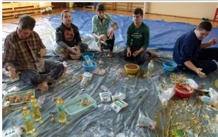
Praca twórcza z artykułami spożywczymi