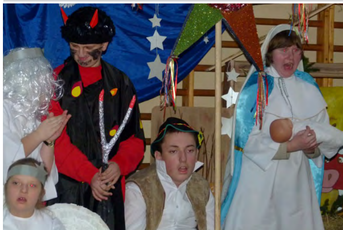
Festiwal strojów kołędniczych