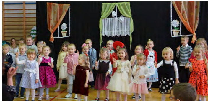
Wierszem, tańcem i piosenką maluchy wyraziły wdzięczność seniorom