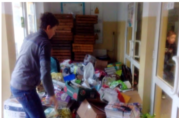
Dla nas to tylko makulatura, dla nich szansa na studnię z wodą

Tym razem zbieraliśmy 2160 kg makulatury, a pieniądze z jej sprzedaży wesprą budowę już szóstej studni w Czadzie. Koordy-