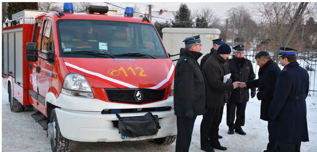
Uroczyste przekazanie wozu strażackiego dla OSP z Grodziska Dolnego