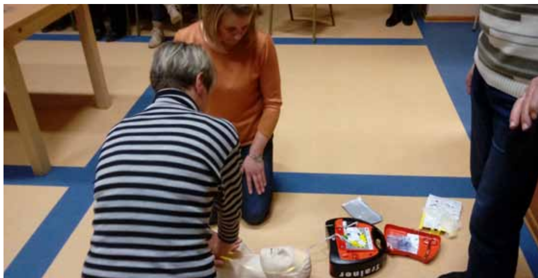
W ramach ćwiczeń, każdy mógł samodzielnie spróbować udzielić pomocy z użyciem defibrylatora