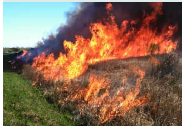
Wypalanie traw zabija środowisko