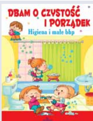
„Dbam o czystość i porządek. Higiena i małe BHP”, Arystoteles 2016.

Piękna opowieść o przewrotnym losie, gorzkich łzach, straconych miłościach i przebaczeniu. Przede wszystkim o przebaczeniu sobie, o ile to jeszcze możliwe.