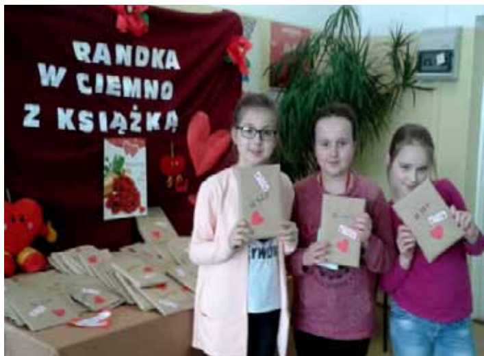
To była bardzo udana randka w ciemno