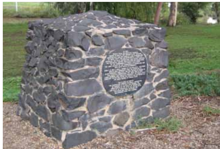
Pomnik poświęcony motylowi, który zwalczył plagę opuncji, Australia.

Na początku lat 60-tych XX wieku w Chinach komunistyczny rząd przeprowadził szeroką kampanię tępienia wróbli, które uznano za szkodniki wyjadające ziarno na zasiewy. W rezultacie pola uprawne opanowała plaga owadów, zwłaszcza szarańczy, które do tej pory były wyjadane przez te ptaki. Powiększyło to rozmiary panującej wówczas klęski głodu, której ofiarą padło kilkadziesiąt milionów ludzi. Lecz od czegoż jest chemia? W walce ze szkodni-