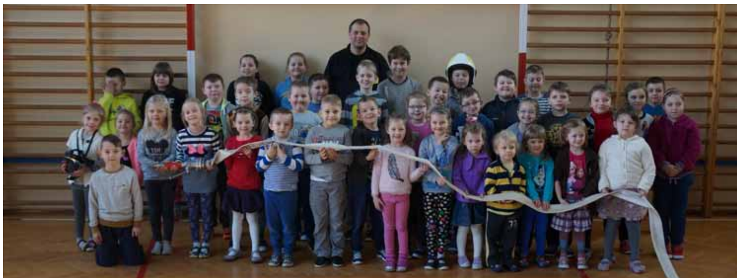
Na pytanie - kim chciałbyś zostać w przyszłości, większość chłopców odpowiada, że strażakiem