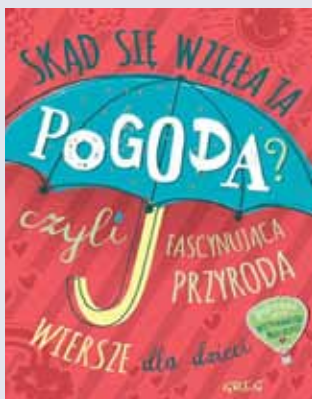
Izabela Michta, „Skąd się wzięła ta pogoda? czyli fascynująca przyroda”, Greg 2016.

Co ważne, książka ta nie została przeładowana niepotrzebnymi informacjami, a zawarte w niej treści zaprezentowano przystępnym, zrozumiałym językiem. Tam, gdzie było to możliwe, zostały zastosowane ułatwiające naukę formy tabel, wykresów, diagramów. Najważniejsze pojęcia wyróżniono wyraźnie widocznymi na stronie ramkami. Istotnym uzupełnieniem jest indeks pojęć, dzięki któremu poruszanie się po książce jest intuicyjnie proste. W serii „Repetitorium maturzysty” ukazały się również: język angielski, język niemiecki, matematyka, historia, chemia, biologia, WOS, Fizyka.