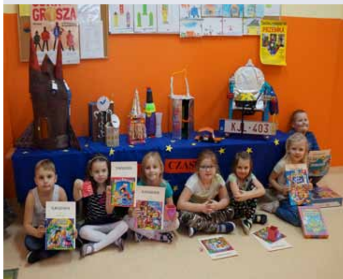
Wspólna praca twórcza dzieci i rodziców zaowocowała nagrodami

W ciągu bieżącego roku szkolnego w Oddziale Przedszkolnym w Laszczynach odbyły się konkursy, w których wzięły udział przedszkolaki wraz z rodzicami. Najważniejszym ich celem była integracja rodziny poprzez wspólne działanie.