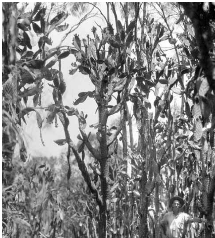
Zarośla opuncji, Queensland, Australia rok 1930

Na pomoc wezwano naukowców, lecz na skuteczne rozwiązanie problemu przyszło poczekać kilkanaście lat, bo tyle czasu zajęło badaczom zidentyfikowanie naturalnego wroga opuncji w jej ojczyźnie, którym okazał się mały motyl Cactoblastis cactorum . Jego gąsienice żywiły się mięszem kaktusów skutecznie ograniczając ich ekspansywność. W 1930 roku 3 biliony jaj tego motyla rozrzuciono na kolczaste zarośla Australii, a po 7 latach klęska została wreszcie opanowana i po opuncji nie zosta-