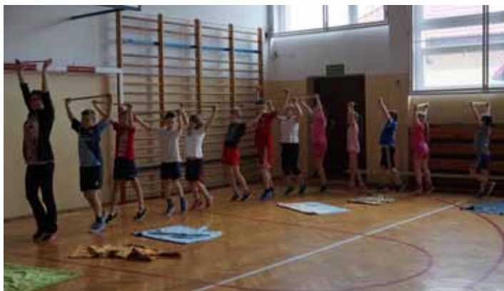
Każdy ci powie, że ruch to zdrowie