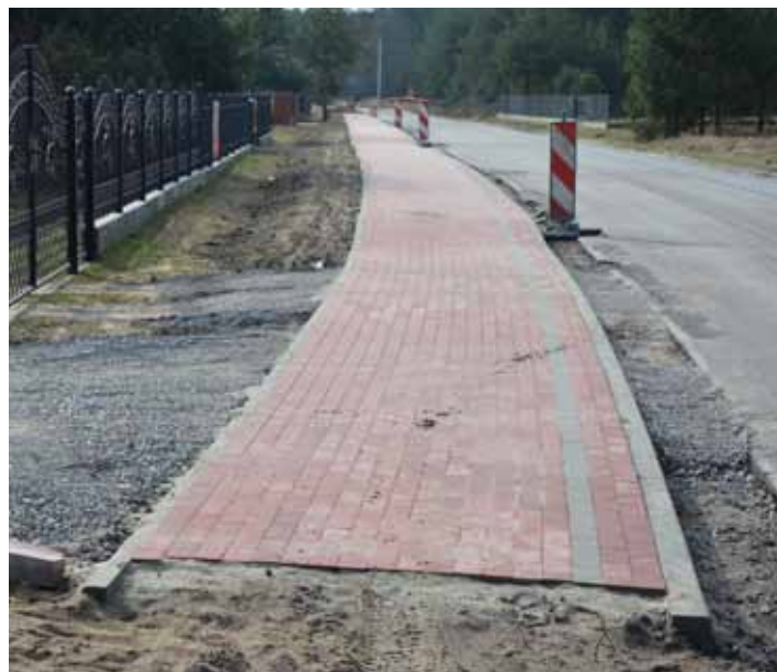
Nowy odcinek chodnika w kierunku na Gniewczynę