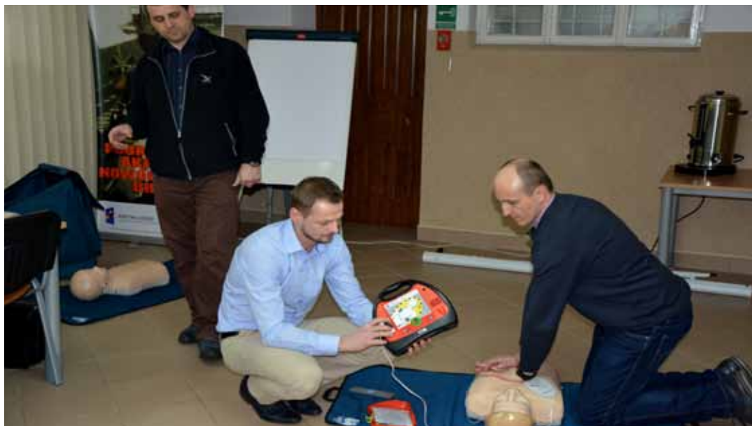
Urządzenie podpowiada głosem co należy zrobić, żeby podjąć działania adekwatne do stanu pacjenta