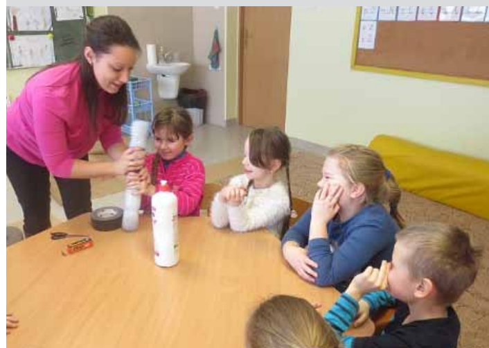
Na zajęciach z panią pedagog