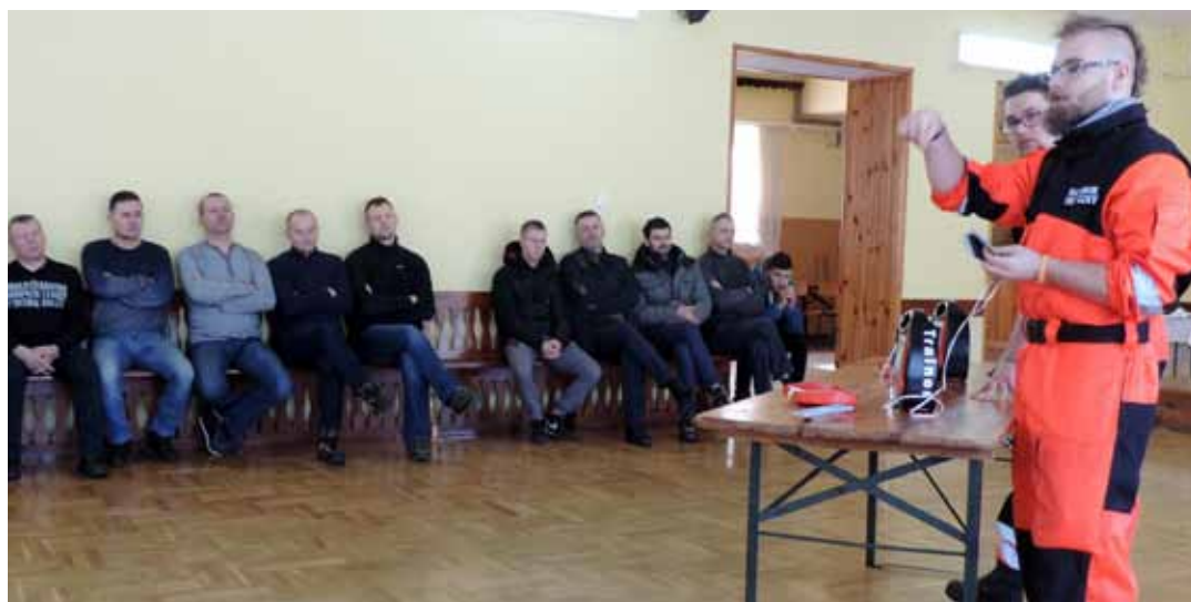
Prowadzący spotkanie ratownicy, pokazywali strażakom krok po kroku jak działa defibrylator

Zakup defibrylatorów sfinansowała gmina.