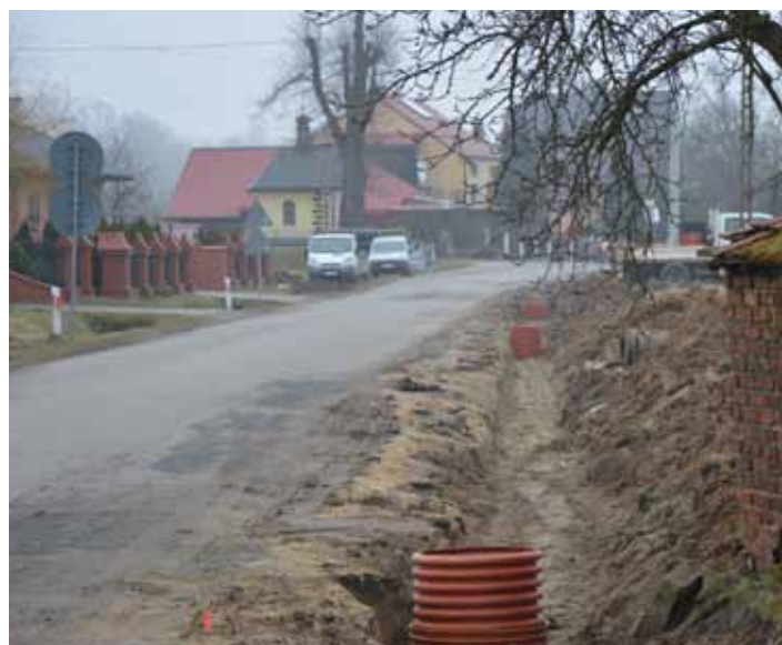
Prace ziemne na Żołyńskiej