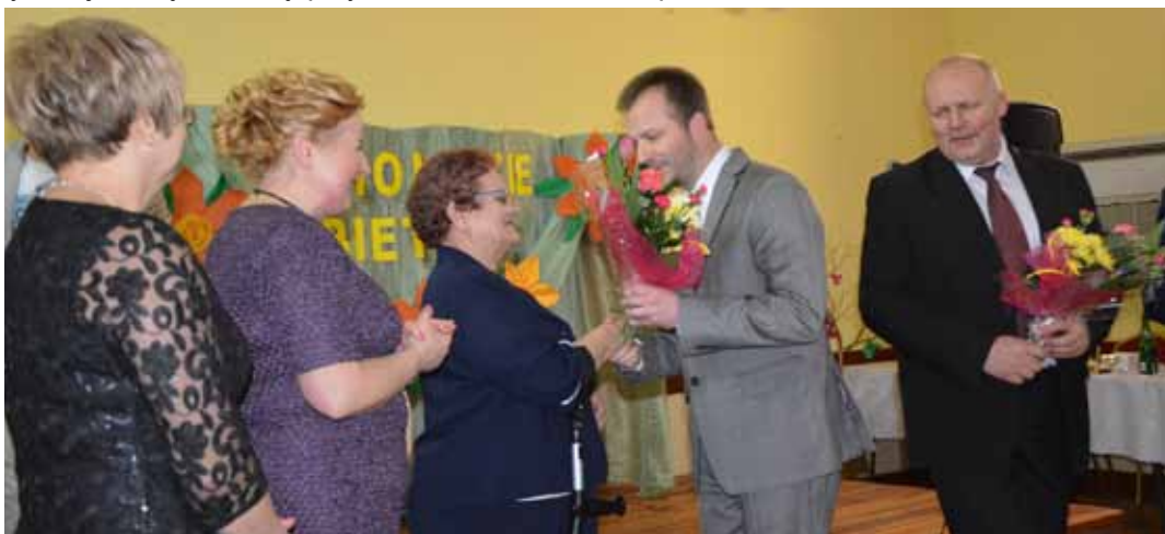
Przedstawicielki płci pięknej otrzymały kwiaty od władz gminy