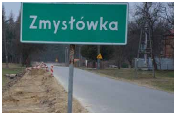
Na nowy chodnik czekają mieszkańcy Zmysłówki i Opalenisk