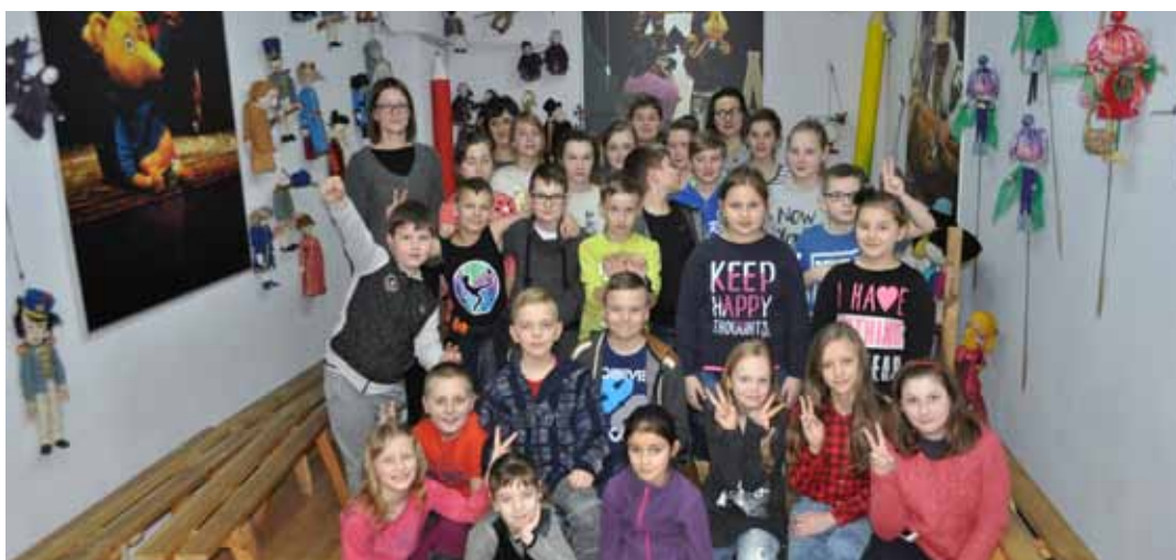
Poznanie świata przez teatr daje szansę na wartościową rozrywkę

Nasi uczniowie mieli też okazję wziąć udział w nietypowej lekcji, która odbyła się w Muzeum Lalek Teatral-