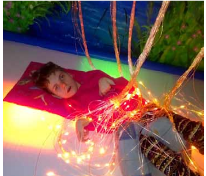
Terapia w Sali Doświadczeń Świata

stymulacji polisensorycznej. Przebywanie w Sali Doświadczania Świata ukierunkowane jest na pobudzanie zmysłów do aktywności, a jednocześnie miłym spędzeniem czasu w atmosferze relaksu i bezpieczeństwa. Terapia Snoezelen z jednej strony umożliwia odprężenie i relaksację, która nie jest pasywnością; a z drugiej strony aktywność, eksplorację odbywającą się w sposób nieinwazyjny i niewymuszony. Zmysły są pobudzane muzyką, efektami świetlnymi, zapachami i łagodnymi wibracjami.