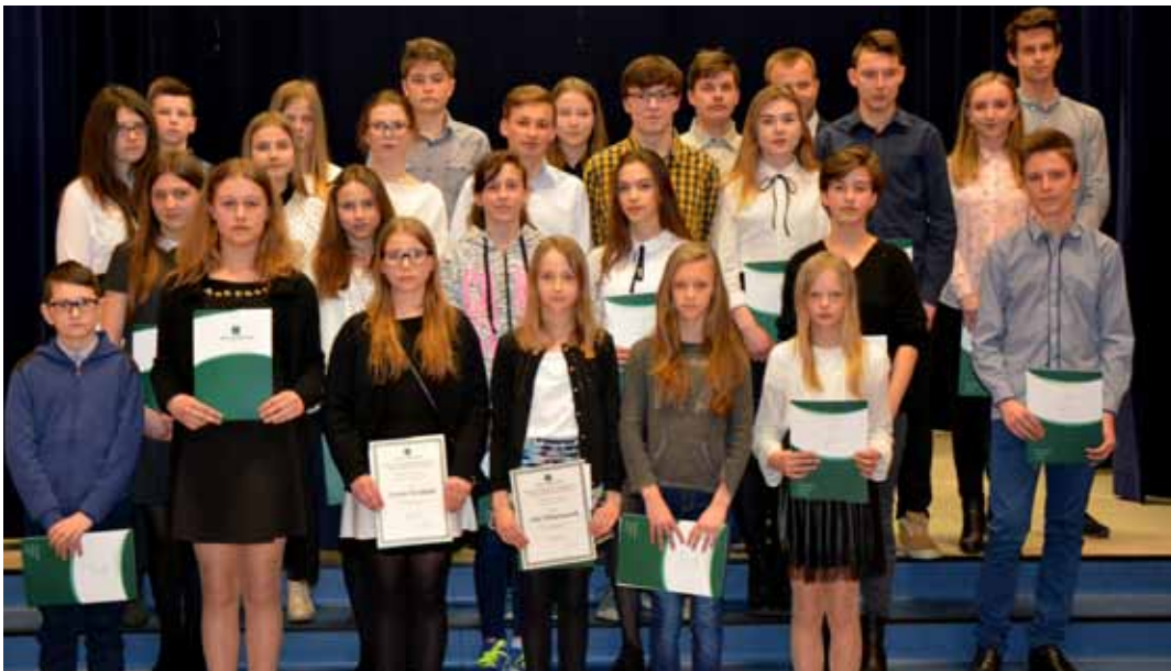
W gronie stypendystów mamy „stałych” bywalców