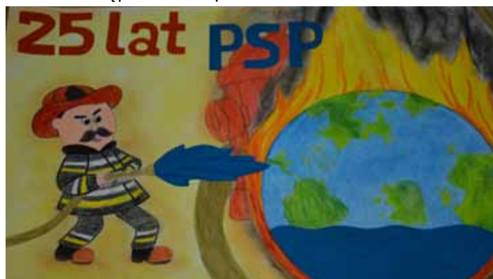
Praca jednego z uczestników konkursu