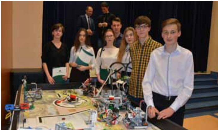
Nagrodzeni za sukcesy w robotyce