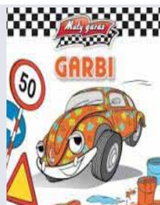
Krzysztof Kielbasiński, „Garbi”, Wilga 2015.

Książeczka Garbi należy do serii książeczek z autkami, która skierowana jest do najmłodszych czytelników. Książeczki można nie tylko czytać, oglądać ale również kolekcjonować.