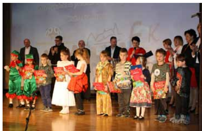
Przedszkolaki odebrały nagrodę za II miejsce