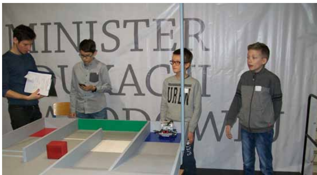
Ostatnie przygotowania przed startem