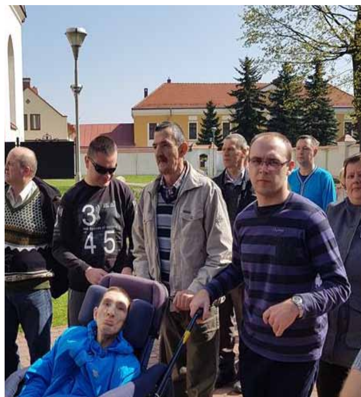
Uczestnicy drogi krzyżowej