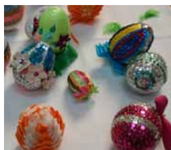
Wiele jest sposobów na zdobienie wielkanocnych pisanek