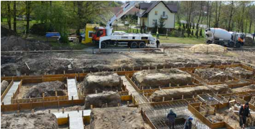
Fundamenty pod nowy budynek