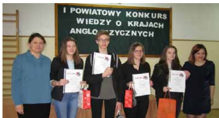
Konkurs wygrała uczennica z Zespołu Szkół w Grodzisku Dolnym

19 uczniów z 10 gimnazjów z powiatu leżajskiego zmierzyło się z testem składającym się z 7 zadań o tematyce związanej z wybranymi krajami anglojęzycznymi.