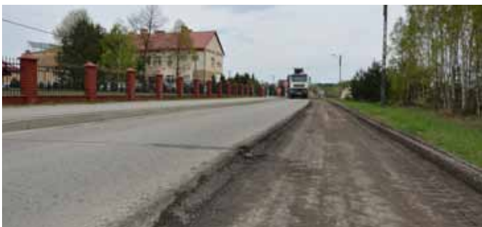
Ściągana nawierzchnia drogi w Laszczynach (fot. z dnia 19.04.2017r.)

ny wraz z jej rozbudową w miejscowości Chodaczów. Wartość umowy to niemal 2 mln 950 tys. zł. Wykonawca ma za zadanie wykonać przedmiot umowy do 31 sierpnia br.