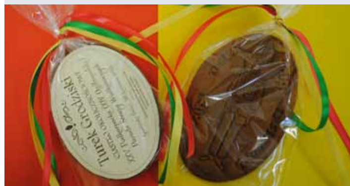
Okolicznościowe ciastko będzie rozdawane w trakcie parady