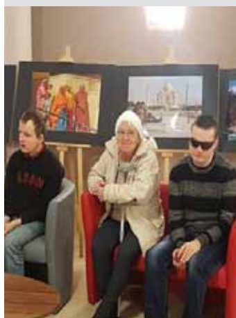
W oczekiwaniu na seans