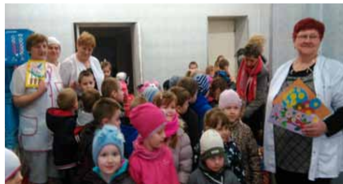
W ramach wdzięczności panie z piekarni otrzymały prace plastyczne