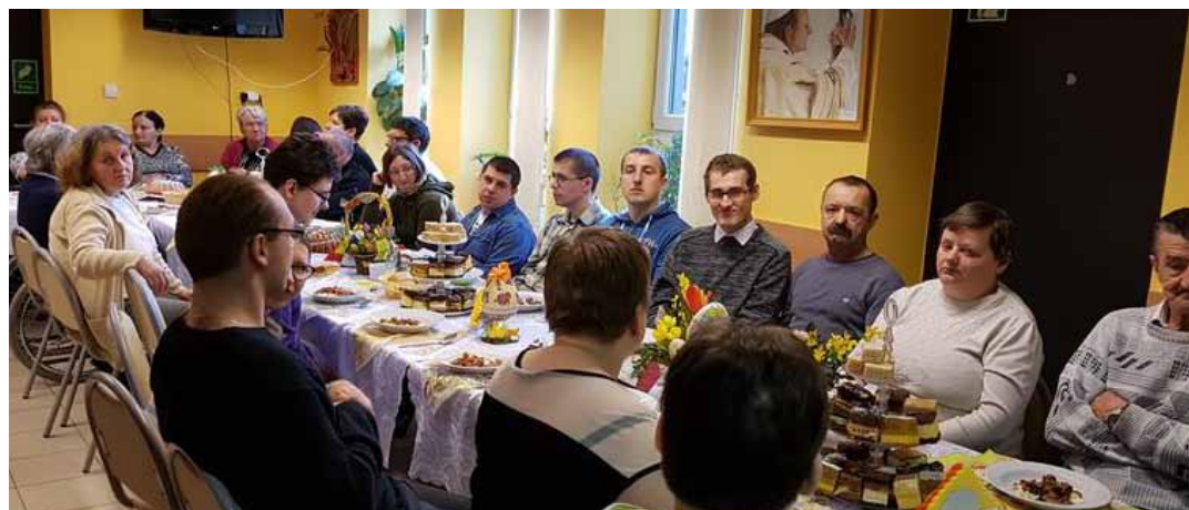
To już kolejna wspólna wielkanoc w placówce