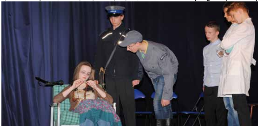
W sugestywny sposób młodzież przedstawiła czym kończy się „zabawa” z narkotykami