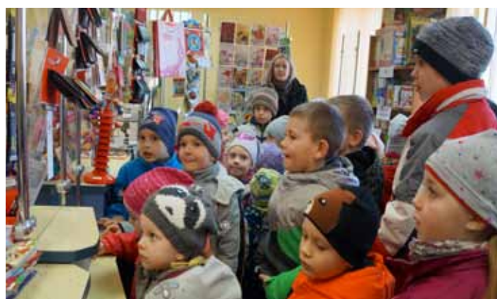
Przy okienku pocztowym