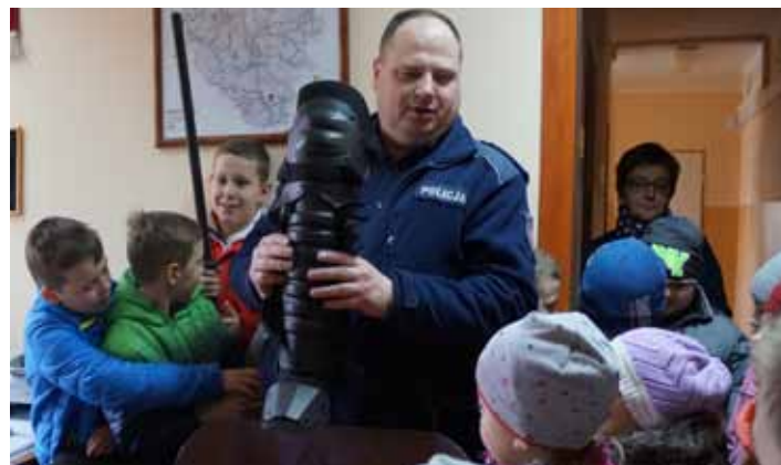
Wizyta na posterunku policji w Grodzisku Dolnym