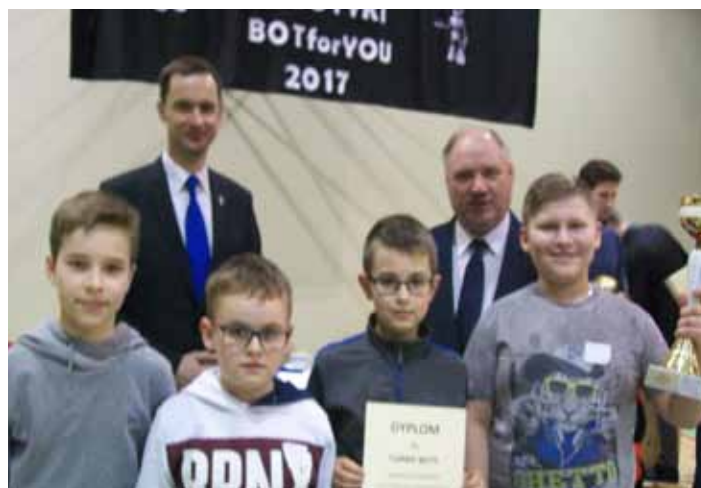
TurboBoty odbierają nagrodę za I miejsce