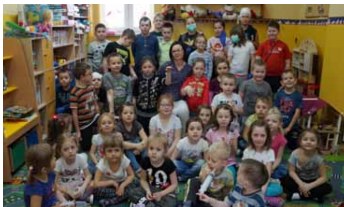
Gościem specjalnym w szkole była pani położna