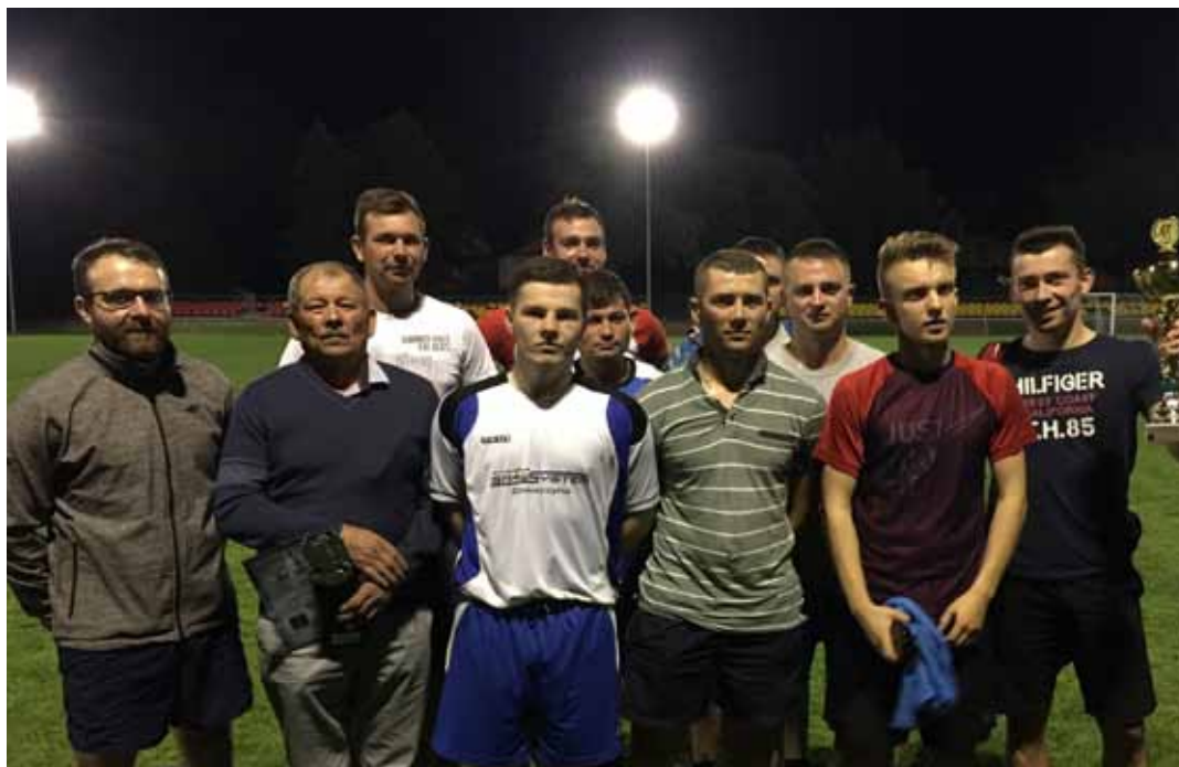
Zwycięzcy turnieju strażackiego - reprezentacja OSP z Chodaczowa