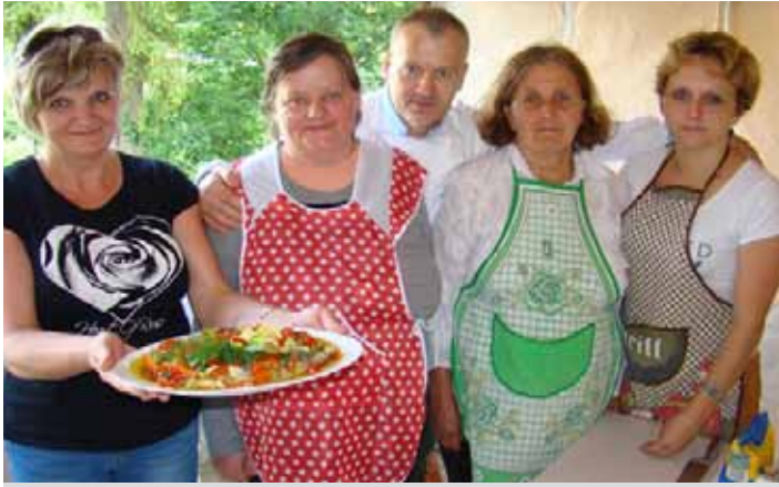
Liczył się smak potrawy, ale i forma podania

tanie ze szpinakiem. Inwencja twórcza uczestników grupy kulinarniej przeszła nasze najśmielsze oczekiwania, a przygotowane przez nich potrawy wprawiły w zachwyt nawet samego szefa kuchni. Wszystkie dania nie tylko