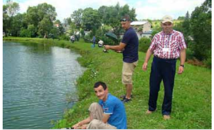
Połowy tego dnia pozwoliły na zdobycie 3 miejsca

pięknie wyglądały, ale równie dobrze smakowały. Uwieńczeniem spotkania była wspólna degustacja przygotowanych specjałów oraz nagrodzenie wszystkich drużyn kucharzy i wędkarzy pucharem, dyplomem