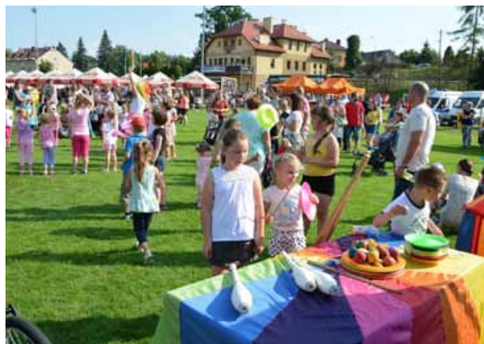
Niedzielne atrakcje dla dzieci