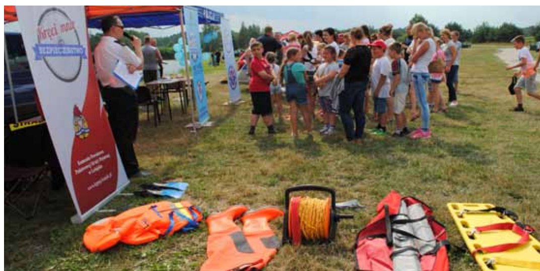
Grupa słuchaczy pogadarek o bezpieczeństwie na Czystym