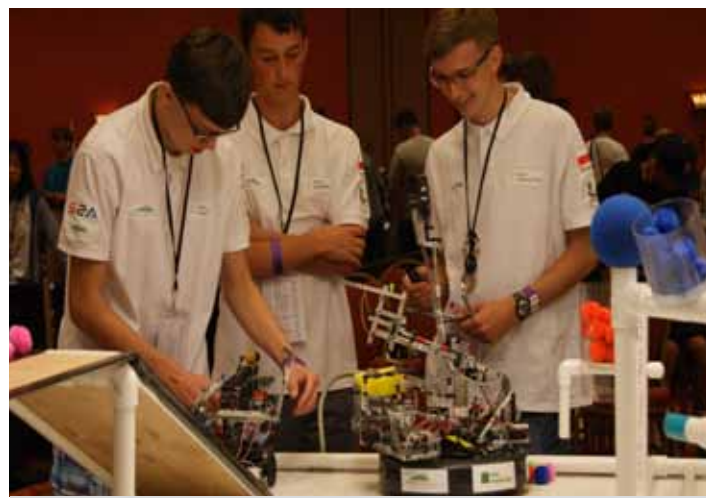
Przy stole turniejowym