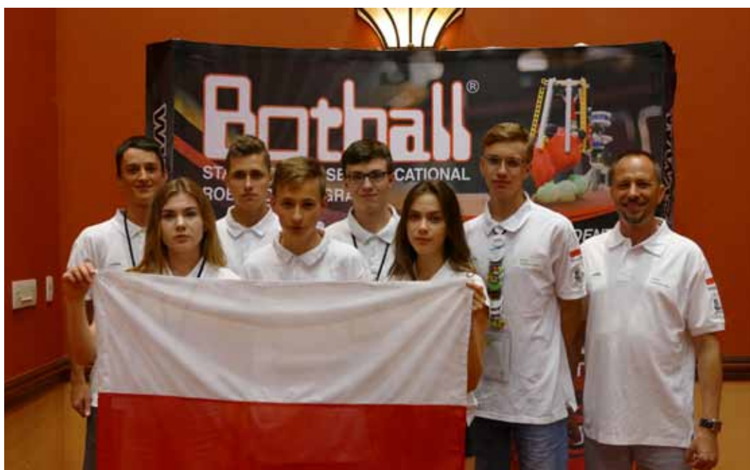
Podczas ceremonii wręczenia nagród