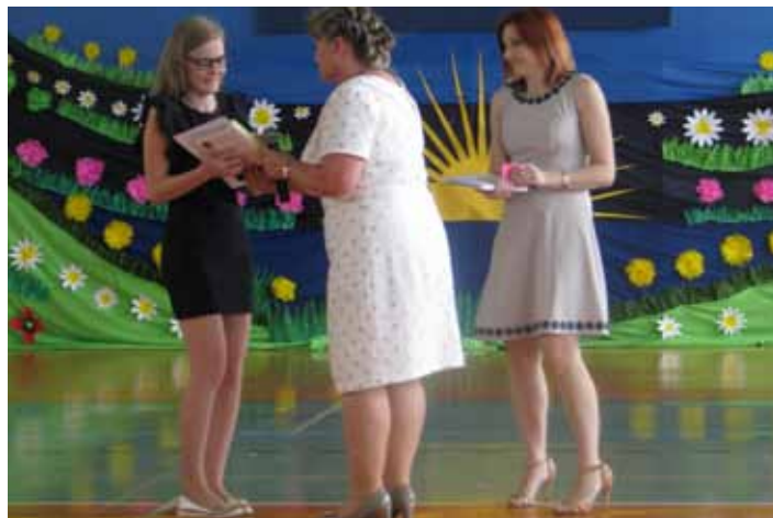
Certyfikaty w Grodzisku Dolnym to już tradycja

dały się z części pisemnej i ustnej. W części pisemnej sprawdzane były umiejętności rozumienia tekstu słuchanego, czytanego i umiejętność pisania w języku niemieckim. Część ustna wymagała od zdających umiejętności komunikowania się w sytuacjach życia codziennego.