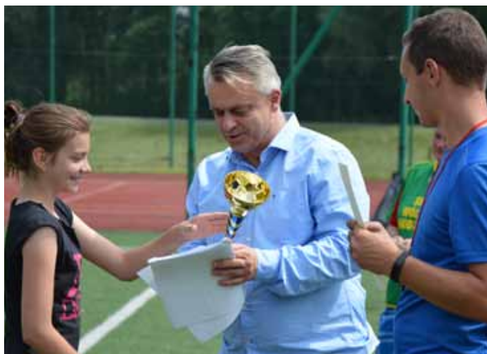
Nagrody dla zwycięzców gminnej parafiady