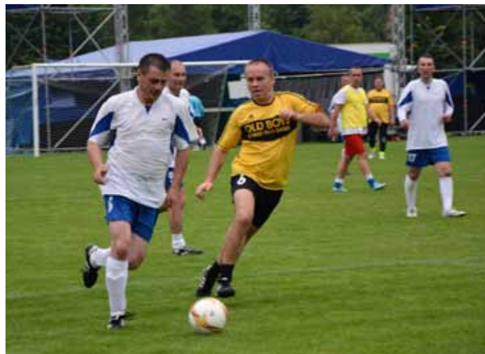
Towarzyski mecz oldbojów

i opiekunów zorganizowano poczęstunek kielbaską z grilla.