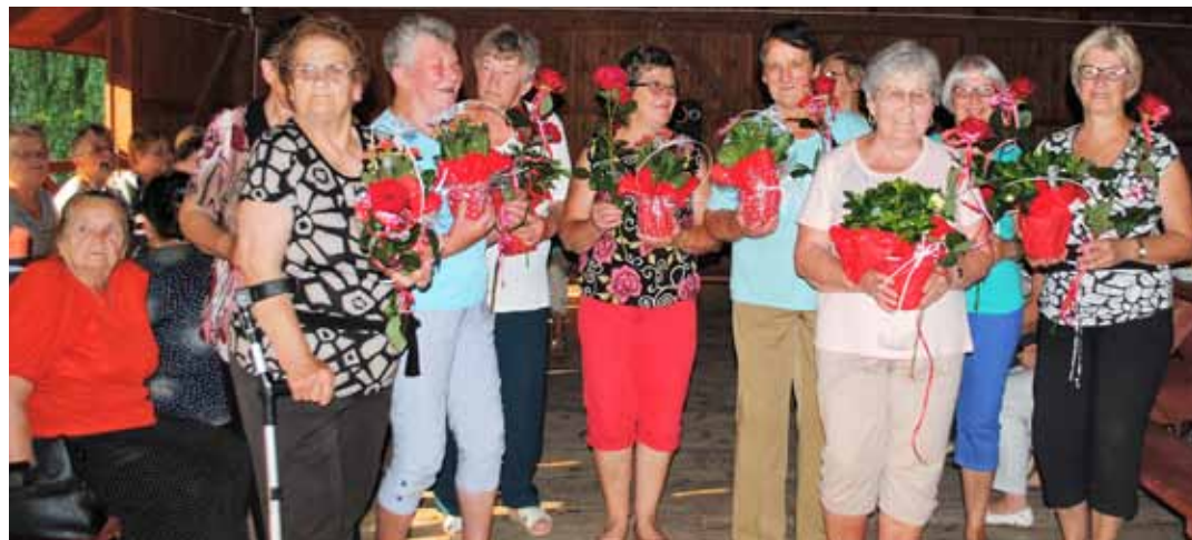
Wszystkie solenizantki otrzymały piękne kwiaty

przy muzyce Seniorzy bawili się do późnego wieczora. Zapraszamy też seniorów