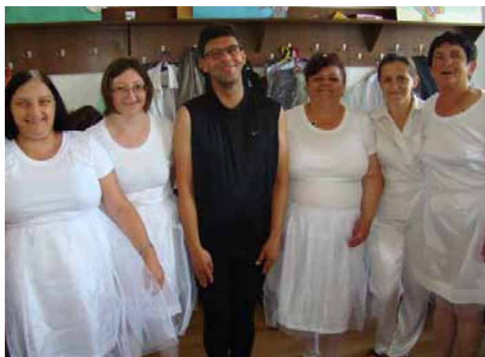
Czas na balet