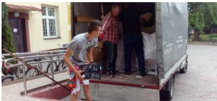
Dla nas to tylko makulatura - dla mieszkańców Afryki szansa na wodę