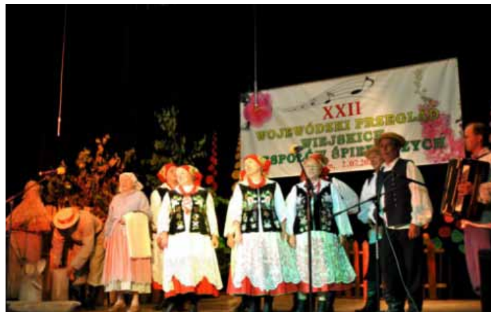
Z Tyczyna zespół przywiózł II nagrodę