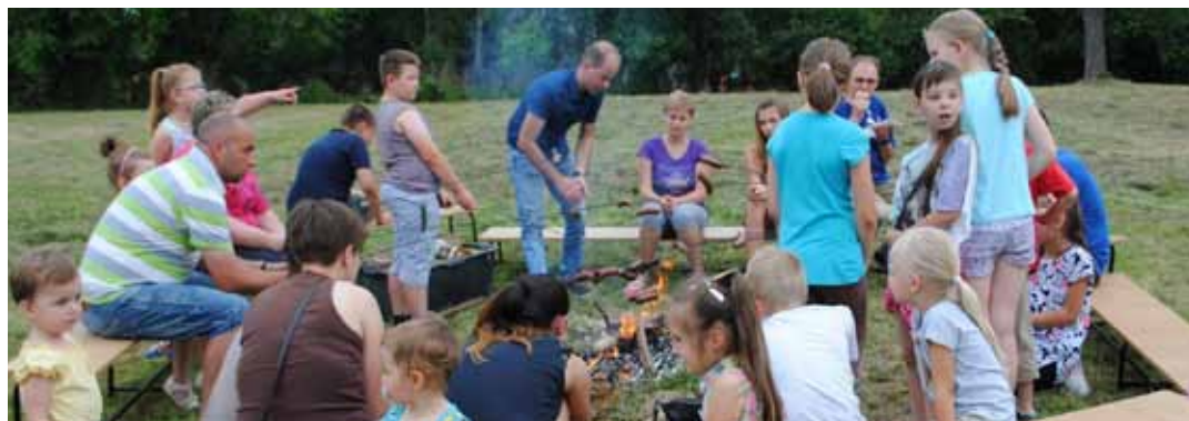
Nie ma to jak kielbaska pieczona w ognisku