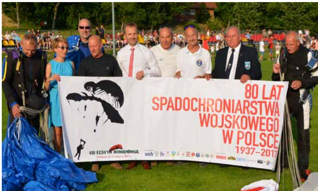
Na płycie stadionu wylądowali skoczkowie

Każdy uczestnik zawodów otrzymał słodczyce i drobne nagrody wędkarskie. Spośród wędek, kołowrotków, podbieraków i innych gadżetów wędkarskich mogli sobie wybrać jedną. Pozostali uczestnicy otrzymali również atrakcyjne nagrody pocieszenia. Na zakończenie dla wszystkich zawodników