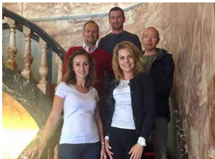
To był intensywny, ale bardzo dobrze wykorzystany czas

Każdy uczestnik wyjazdu mieszkał u innej rodziny, co pozwoliło na doskonałe nie kompetencji językowych również poza szkołą oraz jeszcze lepsze skupienie się na komunikacji w języku angielskim. Jednym z wielu zadań rodziny goszczącej jest wspieranie podopiecznych w doskonaleniu umiejętności językowych, dlatego nawet