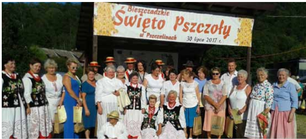
Na święcie pszczoły nie mogło zabraknąć akcentu grodziskiego

W czasie imprezy odbyła się Bieszczadzka Konferencja Pszczelarska, prezentacja sprzętu pszczelarskiego, degustacja miodu,