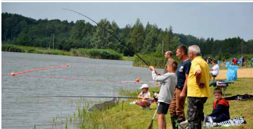
Wędkarzom kibicowały całe rodziny