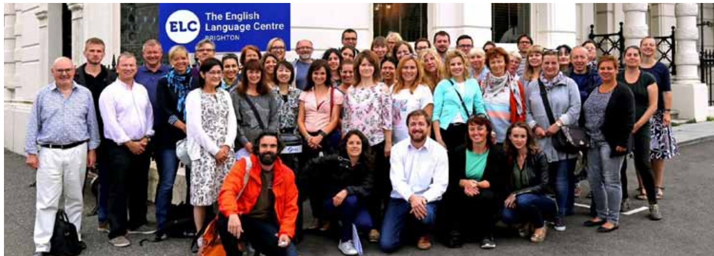
W szkoleniach udział wzięli kursanci z całego świata