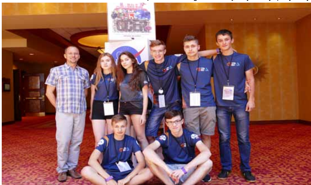
W dobrych nastrojach drużyna rozpoczęła turniej

Konkurs Botball jest organizowany od 1993 roku przez KISS Institute for Practical Robotics w Norman (Oklahoma, USA). Jest on w rzeczywistości bardzo rozbudowanym programem edukacyjnym przygotowującym uczniów szkół średnich do studiów technicznych, ze szczególnym uwzględnieniem automatyki i programowania. Uczniowie biorący udział w tym programie muszą zbudować roboty, które w najskuteczniejszy sposób wykonają zadania określone w konkursie. Mają także obowiązek stworzyć wnikliwą dokumentację pracy, ze szczególnym uwzględnieniem współpracy w swoim zespole, szczegółowym harmonogram prac oraz dokumentacją techniczną robotów, wykonaną za pomocą programów typu CAD. Całość musiała być sporządzana w języku angielskim,