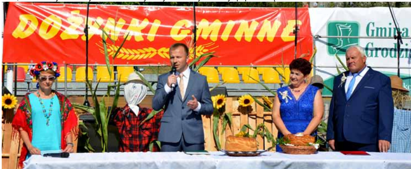
Starostami tegorocznych Dożynek Gminnych byli przedstawiciele sołectwa Grodzisko Nowe

Składamy serdeczne podziękowania delegacjom wieńcowym, sołtysom, radnym, kołom pszczelarskiemu, kołom myśliwych z Dębna i Żołyni, rolnikom, wystawcom, występującym zespołom, sponsorom, strażakom z gminnych jednostek OSP oraz wszystkim tym, którzy włączyli się w organizację Dożynek Gminnych.