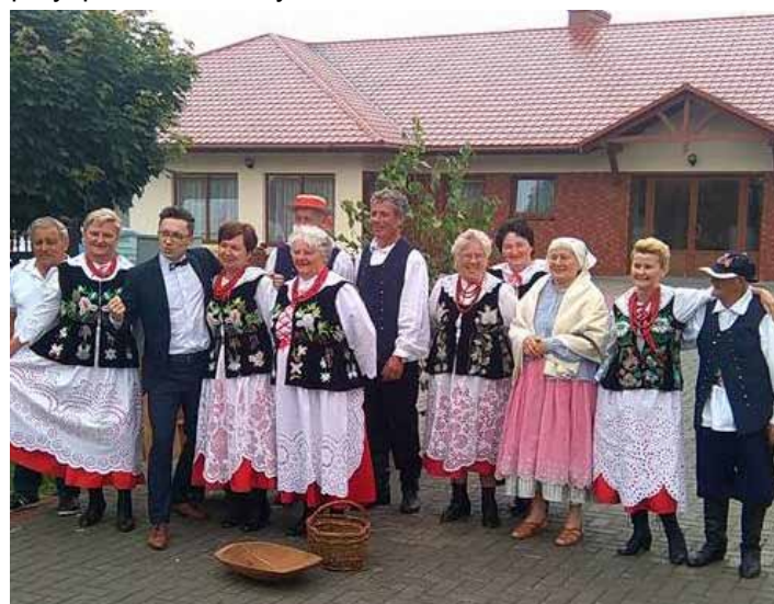
Weselna brama w wydaniu Grodziszczoków