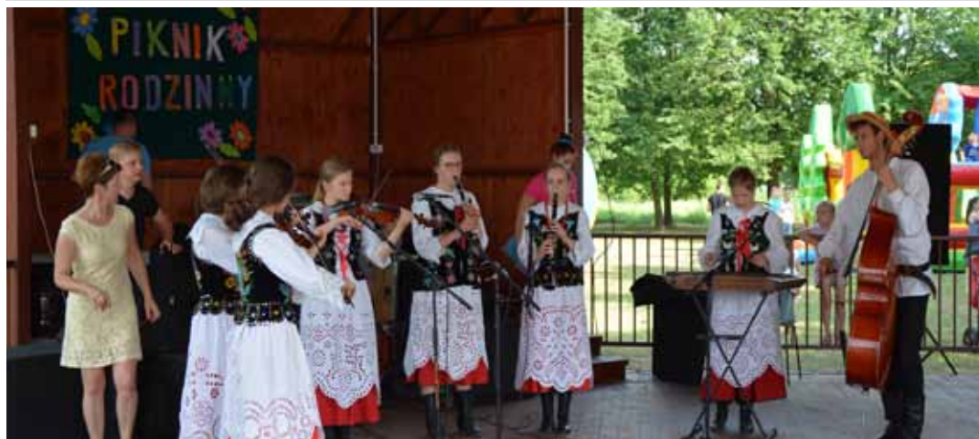
Na ludową nutę w Chodaczowie