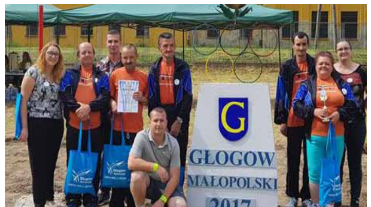
Podopieczni ŚDS zawsze chętnie biorą udział w spartakiadach