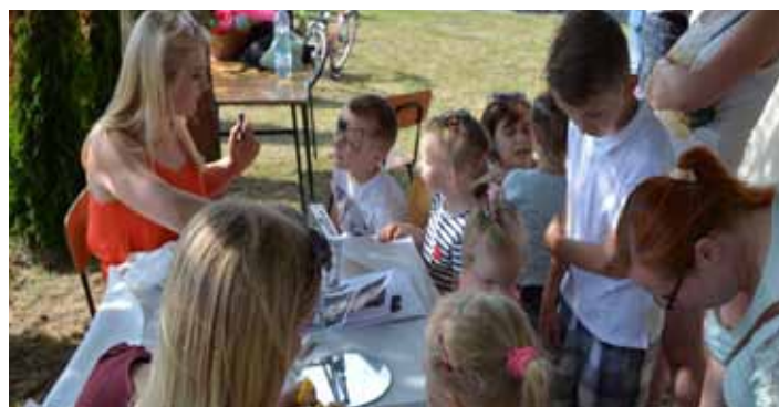
W kolejce po „nową” twarz

wokalistki zaśpiewały znane i lubiane piosenki, co jeszcze bardziej zbliżyło wszystkich do letniej przygody. Ośrodek Kultury składa podziękowania organizatorom za zaproszenie naszych zespołów do współtworzenia części artystycznej. OK