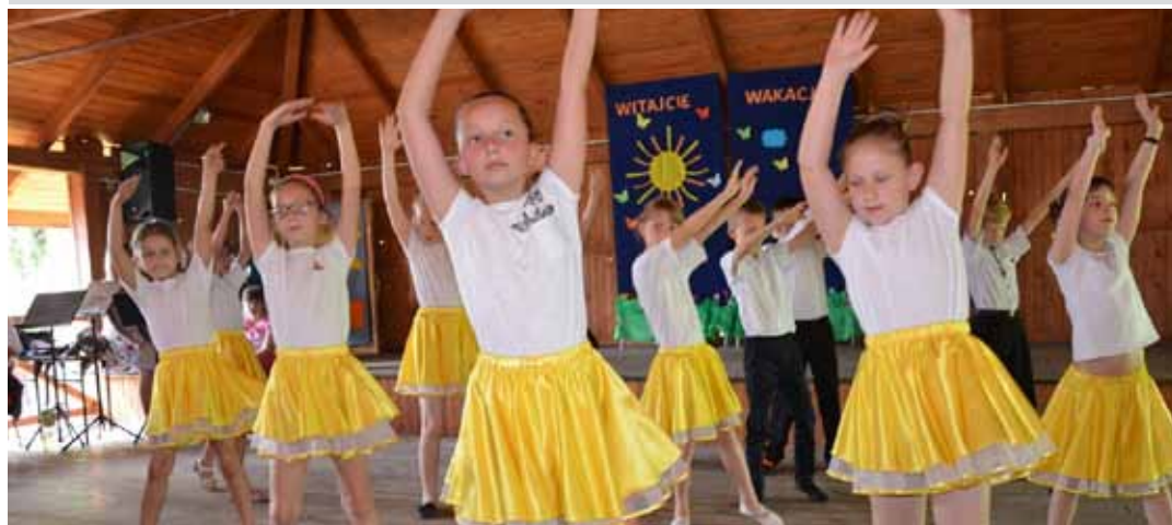
Powitanie wakacji w Wólce Grodzkiej